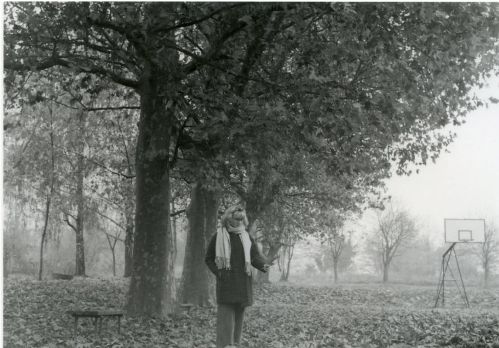
Slika 11: Dorotea_filter1_foma

Slika 10 predstavlja fotografiju motiva portreta koja je razvijena na Foma multigrade papiru koji je osvjtljen kroz filter 1. Filter 1 je najmekši filter kojim se dobivaju slabi kontrasti na fotografiji i zbog toga se fotografija doima blijedo, ima „isprani“ efekt, te se radi slaboga kontrasta detalji gube i manje dolaze do izražaja. Ovaj filter se koristiti za postizanje maglovitog i blijedog efekta jer se njime dobivaju najsvjetlije fotografije, ali za prikazivanje detalja nije najbolja opcija.