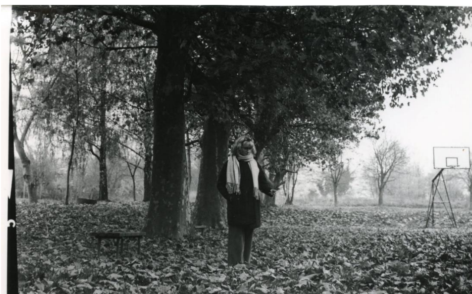
Slika 35 : Dorotea_splitfiltering_Ilford

Tehnikom split-filtering-a su dobivene i slike 34 i 35. One su također prvo razvijene pod filterom 2 kako bi se postigli lijepi tonovi, a potom pod filterom 4 kako bi s pravom količinom kontrasta detalji došli do izražaja. Slika 34 je razvijena na Foma fotoosjetljivom papiru, a slika 35 na Ilfordu. Međusobnom usporedbom fotografija vidljivo je da su postignuti dobri rezultati kao i na slikama 32 i 33. Svi detalji su izvrsno