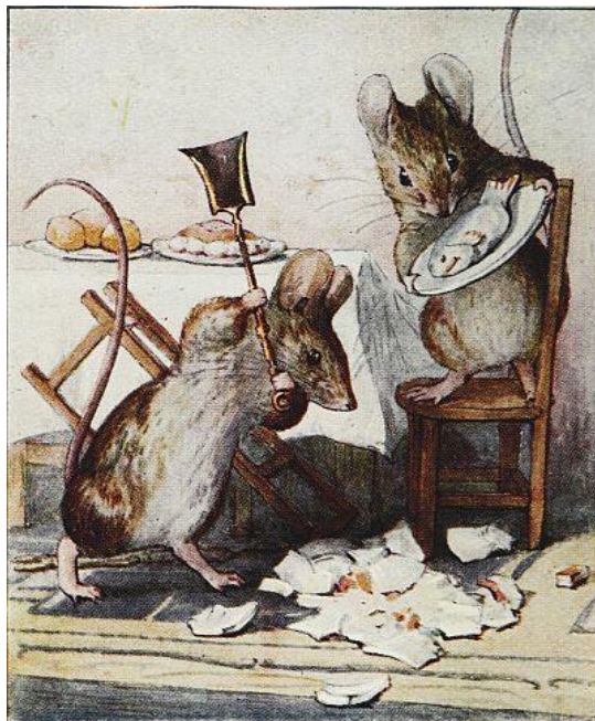
slika 3.1. „The tale of Two Bad Mice“ ilustratorice i spisateljice Beatrix Potter [1]

Craneov stil se odražavao u crnim obrubima, bojama bez previše tonskih prijelaza i pomalo je ličio na japanski stil crteža. Beatrix Potter bila je jedna od prvih žena koje su ilustrirale dječje knjige te se izdvajala po tome što nije imala formalno obrazovanje, ali je mnogo vremena provela analizirajući anatomiju životinja i vježbajući te su najreprezentativniji primjeri ilustracije za knjige „The tale of Two Bad Mice“ (slika 3.1.) i „The Tale of Peter Rabbit“.