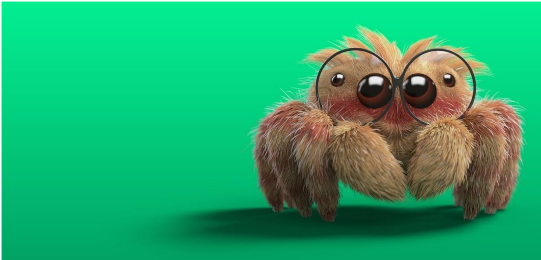
Slika 6.2. animirani lik pauka „Pavle Pauq“ [10]

Šalje se poruka kako je bezopasno i lako ugovoriti i obvezati se na nešto financijske obvezujuće. I 2D i 3D animacija nas podsjećaju na doba djetinjstva kad smo crtali i zamišljali isto tako simpatične i bezopasne likove te nam takve vizualizacije kada odrastemo, bude osjećaje i smatramo ih manje ozbiljnima baš kao i onda kad smo bili djeca.