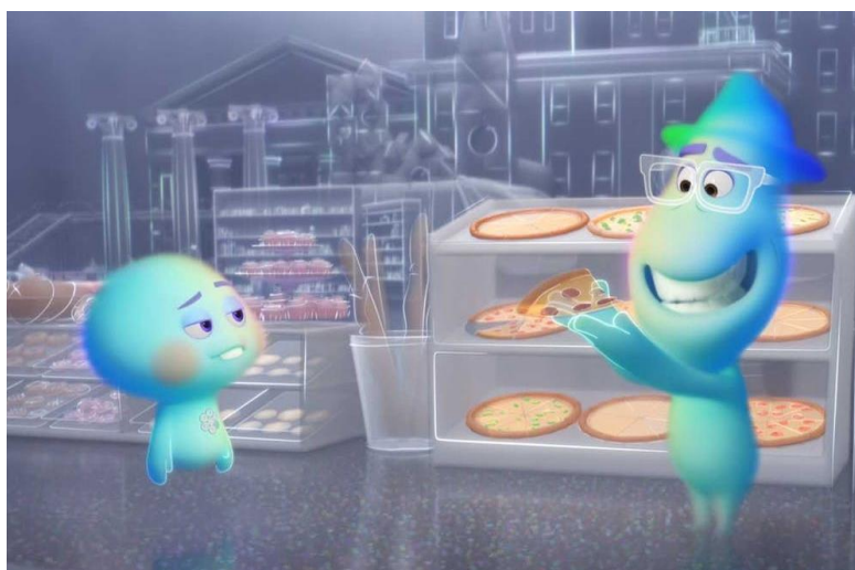
Slika 4.4. Disneyjev i Pixarov animirani film „Duša“ [4]

Na primjer, ako se liku u animiranom filmu dogodi nešto ružno te ga drugi zagrlj, povratna reakcija bude pozitivna, dijete će steći dojam i primijeniti da je poželjan čin nekoga utješiti i dati mu pažnju. Još jedna od zanimljivosti je što su djeci bez iznimke smiješni padovi ili nezgode na koje lik naiđe iznenadno. U stvarnom životu ne viđaju ukućane kako padnu na koru od banane no animirani film to čini zabavnim jer se nezgoda ne klasificira kao neuspjeh ili izvor boli već kao simpatični trenutak nespretnosti.