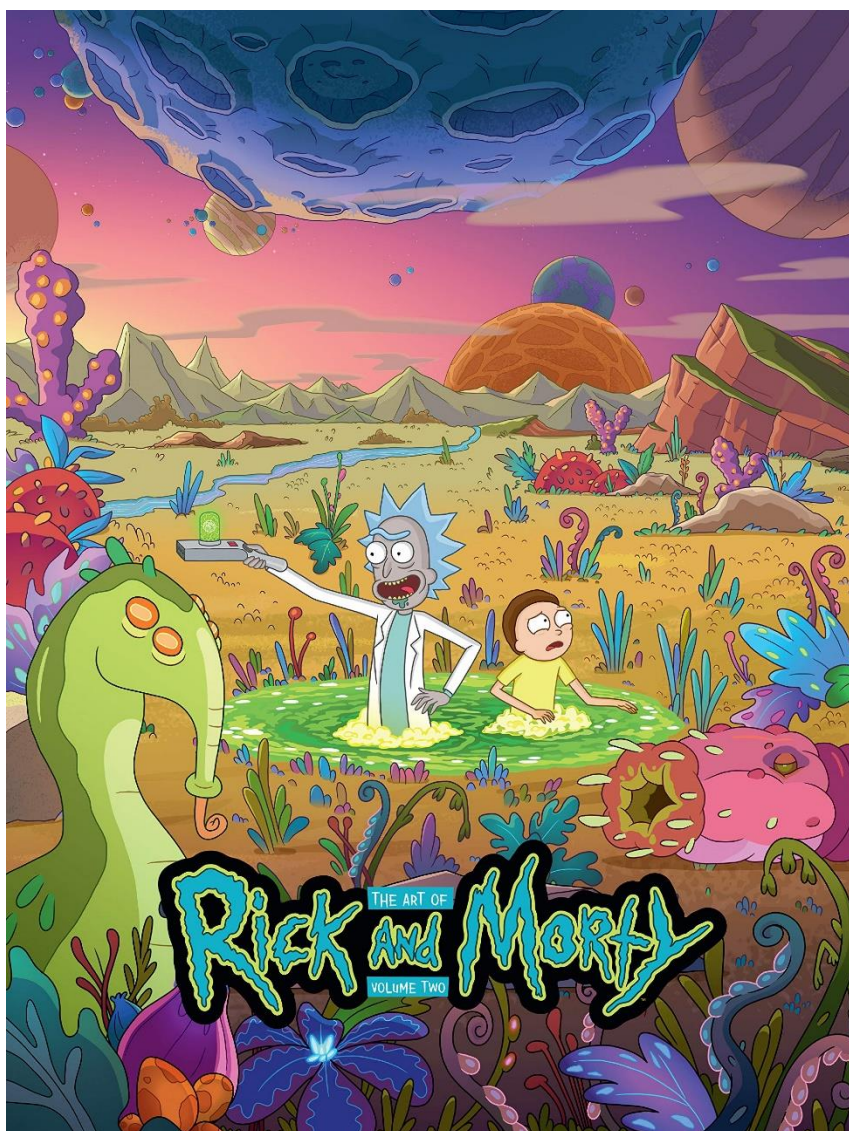
Slika 6.1.2. animirana serija „Rick and Morty“ [9]

zaokupila i filozofijom i sarkazmom. Razlika u ova dva animirana prikaza jest što se „Rick and Morty“ vizualno mogu očitovati kao sadržaj za odrasle.