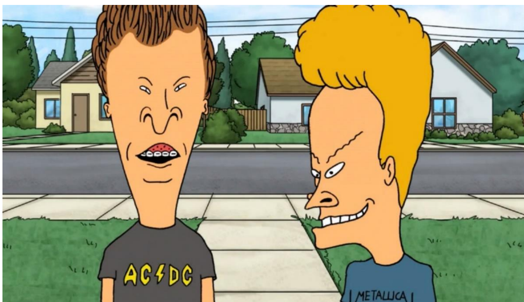
Slika 3.2.2. animirana serija Beavis and Butt-head [3]

Tim Burton se također držao tematika neprirdodnog, pretjeranog i inovativnog, ali su njegova publika bili tinejdžeri koje nije mogao zastrašiti svojim likovima već su ih smatrali zanimljivim. Nakon ilustriranih animiranih filmova, animatori su počeli eksperimentirati s različitim materijalima te je kratki film Creature Comforts osvojio Oskara. Disney, Pixar i Dreamworks su obilježili djetinjstva mnogih krajem 90-ih i početko 2000-ih, a popularizaciju su naravno olakšale kasete i DVD-i. Dreamworks-ov „Shrek“ jedan je od boljih i novijih prvih primjera digitalne animacije za koji su nagrađeni Oskarom, a godinu nakon, istom je nagradom počašćen i „Spirited away“ Hayaoa Miyazakija; jedno od najpopularnijih i najznačajnijih japanskih animiranih djela. te se nakon toga velika većina animiranih filmova oslanja na 3D animaciju. [3]