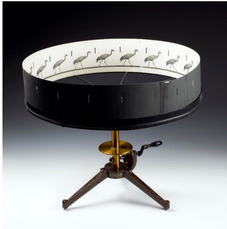
Slika 3.2.1 zoetrop [2]