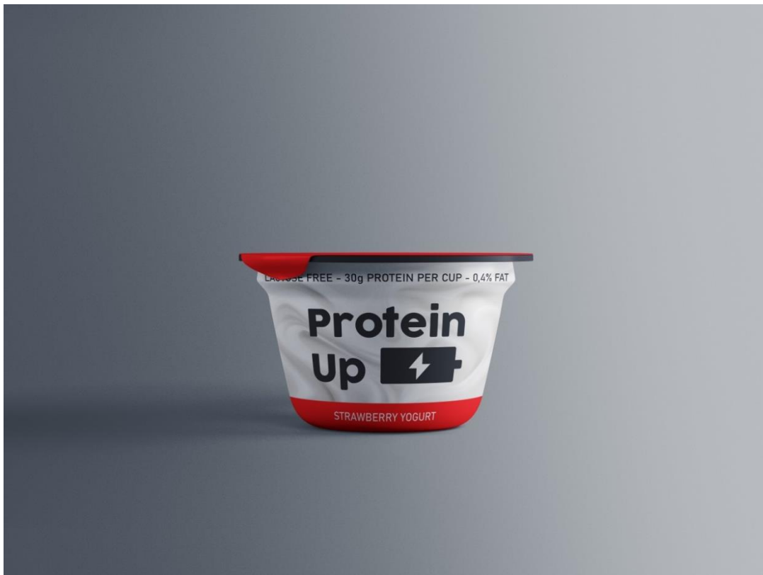
Varijanta 3 – okus jagoda; crna boja #231F20, crvena boja #FF0000; obrazac: Graphicpear.com