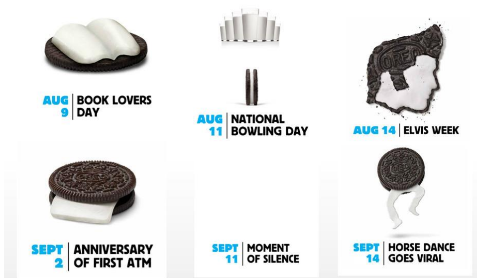
Sl.10. Oreo Daily Twist kampanja

Svi dosadašnji primjeri vizualnog pripovijedanja dokazuju da uspješna marketinška strategija zahtijeva da subjekt pripovijedanja bude kvalitetan jednako kao i upotreba vizualnih sadržaja. Priče mogu dolaziti iz mnogih aspekata poslovanja ili života, bilo da se radi o vrijednostima tvrtke, kako ljudi uživaju u proizvodu, ključnim prekretnicama u životnom vijeku proizvoda itd. U Oreo Daily Twist kampanji za američko tržište 2012. Godine, tvrtka je proslavila stoti rođendan kreiranjem 100 originalnih slika nadahnutih pop kulturom, obilježavajući značajne dane u godini. Ta je kampanja prikupila globalne pohvale i nagrade te redefinirala publicitet za robnu marku Oreo.