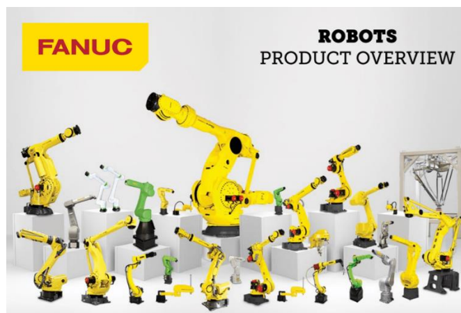
Slika 9 – Asortiman Fanuc robota

Ova funkcija dostupna je za sve Fanuc robote i dovoljna je za jednostavne zadatke. Za složenije zadatke, programer koristi iPendant ručni terminal ili iRProgrammer, programe za pametne uređaje. [11]