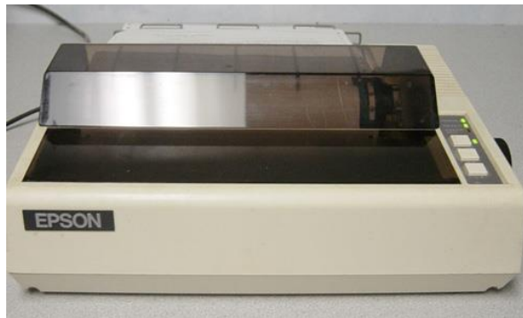
Slika 3 – MX – 80 Epson printer iz 1980.

Prvi komercijalni tiskari općenito su koristili mehanizme iz električnih pisaćih strojeva. Potreba za većom brzinom dovela je do razvoja novih sustava posebno za korištenje računala. U 1980-ima postojali su sustavi s kotačićima slični pisaćim strojevima, linijski pisači koji su proizvodili sličan ispis, ali puno većom brzinom, i matični sustavi koji su mogli miješati tekst i grafiku, ali su proizvodili ispis relativno niske kvalitete (slika 3.). Crtač ( plotter ) je korišten za one koji su zahtijevali visokokvalitetnu linijsku umjetnost poput nacрта. [8]