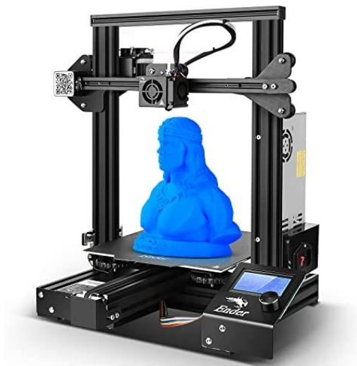
Slika 5 - Official Creality Ender 3 Pro 3D

Amazon, 3D printer ( https://www.amazon.ae/Official-Creality-3D-Certified-220x220x250MM/dp/B07K3SZBHH 3D printer )