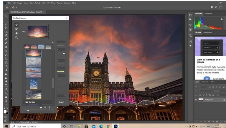
Slika 6 - Otvoren program Adobe photoshop na računalu

plan za fotografe koji spaja dva programa zajedno. Postavili su industrijski standard za profesionalne fotografe u raznim žanrovima fotografije.