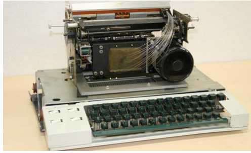
Slika 2 – OKI Matrix printer iz 1968.

iReTron Blog, Technology Flashback: The Dot Matrix Printer