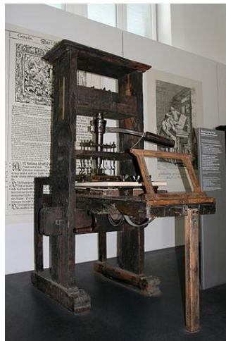
Slika 1 – Tiskarski stroj iz 1811.godine

Zbog želje za prenošenjem znanja kineski narod prvi izumljuje pokretna slova s kojima su slagali riječi. Otkriće se pripisuje Bi Shengu početkom 11.stoljeća. Iz Kine se princip tiskanja proširio u Koreju i Japan. Izumom tiskarskog stroja došlo je do velikog napretka grafičkoj industriji, ali i napretka u samom društvu jer je tiskarski stroj zamijenio dotadašnje pisanje knjiga rukom. Izumiteljem prvog tiskarskog stroja smatra se Johannes Gutenberg koji je u Europi izazvao kulturnu revoluciju. Johannes Gutenberg je 1440. godine došao na ideju da izlijeva pojedinačna slova od metala i od tih slova sastavlja redove i stranice. Konstruirao je drvenu prešu pomoću koje se dobivao otisak pritiskom ravne ploče preko lista papira (slika 1.), i tako 1455. godine objavio prvu tiskanu Bibliju. Na ovaj način je uspio pronaći put da što više djela od raznih autora nađe svoj put do čitatelja i na taj način doprinio širenju pismenosti, kulture i duhovnosti. [5]