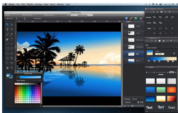
Slika 7 - iDraw – Vektorski grafički program

GratuitTelecharger, Adobe photoshop ( https://gratuittelecharger.com/en/adobe-photoshop-windows/ ), Računalna grafika može se klasificirati u različite kategorije: piksel grafika i vektorska grafika, s dodatnim 2D i 3D varijantama. Mnogi grafički programi fokusirani su isključivo na vektorsku (slika 7.) ili rastersku grafiku, ali postoje neki koji su u mogućnosti raditi na objema. Jednostavno je pretvoriti vektorsku grafiku u rastersku grafiku, obrnuto je teže, ali i za to postoje softveri.