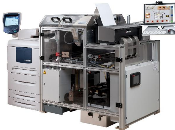
Slika 4 – Espresso Book Machine iz 2007.

Brzi napredak internetske e-pošte tijekom 1990-ih i 2000-ih uveliko je istisnuo potrebu za ispisom kao sredstvom za premještanje dokumenata, a širok izbor pouzdanih sustava za pohranu nagovijestio je da je "fizička sigurnosna kopija" danas od male koristi.