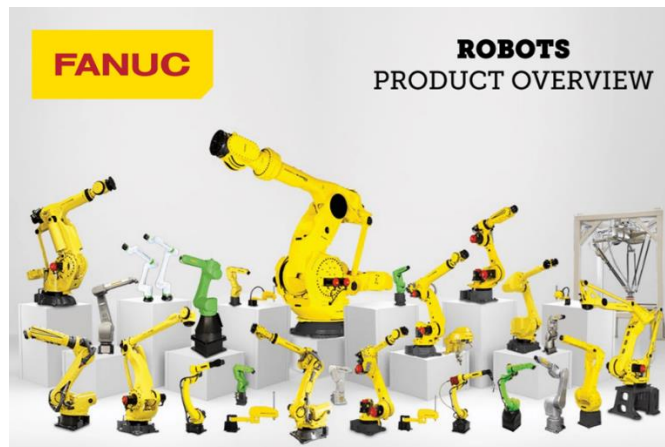
Slika 9 – Asortiman Fanuc robota

Ova funkcija dostupna je za sve Fanuc robote i dovoljna je za jednostavne zadatke. Za složenije zadatke, programer koristi iPendant ručni terminal ili iRProgrammer, programe za pametne uređaje. [11]