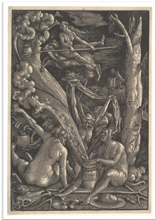
Slika 3 „The Witches“; Hans Baldung Griena;

teksturom kratkih, kutnih linija koje čine i gotičko pismo i živahne ilustracije. Mnoge su stranice oživljene drvećem u obliku kovrčave loze opuštene likovima do pojasnih duljina da bi stvorile dojam sjajne animacije. Nasuprot tome, u talijanskoj knjizi odnos pravolinijskog slova koji se temelji na drevnim rimskim natpisima, rezervnih i elegantnih ilustracija drvoreza stvara osjećaj klasične smirenosti i ravnoteže. Sredinom šesnaestog stoljeća gravura je postala omiljeni medij za ilustraciju knjiga. Budući da gravure i type zahtijevaju različite vrste preša, ilustracije su se morale tiskati samostalno, obično na zasebnim listovima, i više se nisu mogle vizualno integrirati s tekстом.