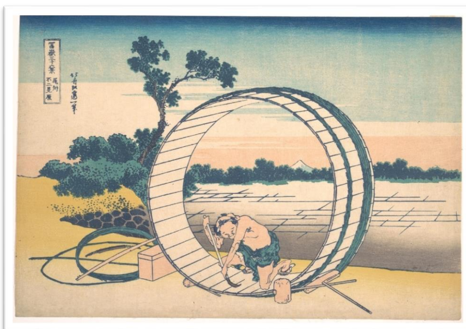
Slika 10 "Fujimigahara in Owari Province"; autor: Hokusai; godina: 1830.-1832.; dimenzije: 25,4 x 38,1 cm; drvorez u boji; iz serije „Trideset i šest pogleda na planinu Fuji“