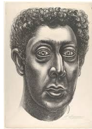
Slike 3.4.1.-3.4.13. Serija 13 drvoreza, 1931.