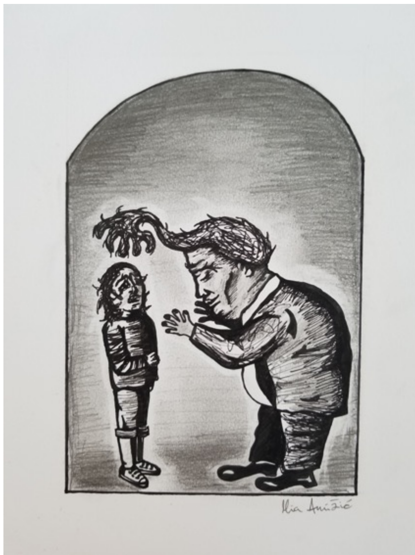
Slika 3.2. Čudovište i djevojčica, 2020.

Čudovište i djevojčica je moja verzija litografije Franjevca i Indijanca José Clemente Orozca. Bespomoćni Indijanac je u ovom slučaju djevojčica (inspirirana fotografijom Johna Mooorea koja prikazuje uplakanu djevojčicu koju odvajaju od njene obitelji na granici), a prijetvorno samilosni Franjevac nadvijen nad njom je Donald Trump.