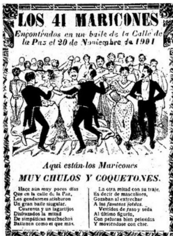
Slika 2.4.1. . José Guadalupe Posada, Ples 41 homoseksualca , 1901.

Iako je došlo do društvenog pomaka u stavovima prema ulogama žena, teme spolnosti i seksualnosti nisu došle na red tako brzo. Homoseksualnost je i dalje bila tajna i općenito privatna stvar. U studenom 1901. godine, došlo je do policijske racije okupljanja homoseksualaca i transvestita u Mexico Cityju, poznatog kao El baile de los cuarenta y uno ili Ples četrdeset i jednog (Slika 2.4.1.). Kružile su glasine da je zet Porfirija Díaz bio jedan od uhićenih zajedno s još nekoliko članova visokog društva, međutim popis uhićenih nikada nije objavljen. Incident je ubrzo postao javni skandal, a proslavljeni karikaturist José Guadalupe Posada oslikao je incident za nacionalne novine.