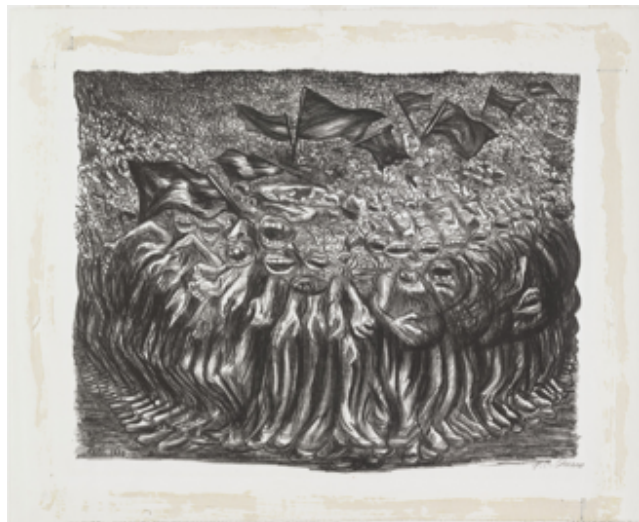
Slika 3.3.2. Mase, 1935.