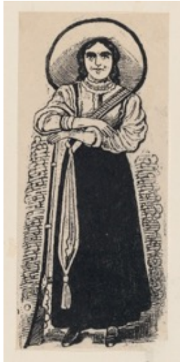
Slika 3.1.3. Žena vojnik, oko 1880.