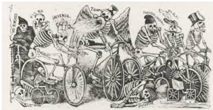
Slika 2.6.1. José Guadalupe Posada, Zašto ići biciklom? 1898.

Ubrzo se pojavio širok spektar klubova i društava, kao i biciklistički klubovi i organizirane utrke. Francuska je tvrtka uvozila bicikle i osnovala iznajmljivanje, a organizirani sportovi s pravilima, jednakošću natjecanja, birokracijom i formalnim vođenjem evidencija postali su obilježja modernosti. Iako su muškarci dominirali sportom, i žene su sudjelovale. Za žene je biciklizam značio oslobađanje od strogog nadzora i slobodniju žensku odjeću, kao što su bile Bloomers hlače za vožnju. Biciklizam je promoviran kao promicanje vježbanja i dobre higijene i modernizacijom putem tehnologije.