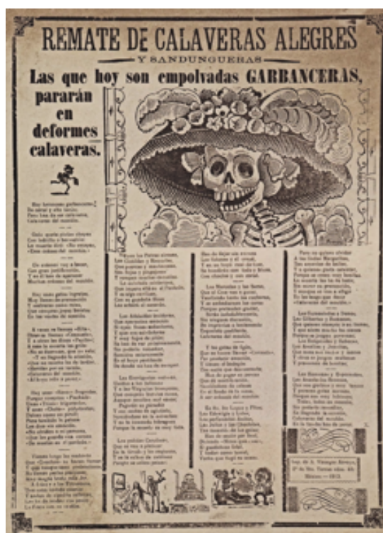
Slika 3.1.1. i 3.1.2., La Calavera Catrina, 1913.

Od izbijanja meksičke revolucije 1910. do njegove smrti 1913. Posada je neumorno radio u tisku. Radovi koje je u to vrijeme dovršio u tisku omogućili su mu da razvije svoju umjetničku snagu kao crtač, graver i litograf. U to je vrijeme nastavio raditi satirične ilustracije i crteže objavljivane u časopisu El Jicote koje su igrale značajnu ulogu za vladu tijekom mandata predsjednika Francisca Madera i tijekom kampanje Emiliana Zapate.