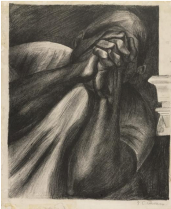
Slika 3.3.6. Tuga, 1934.