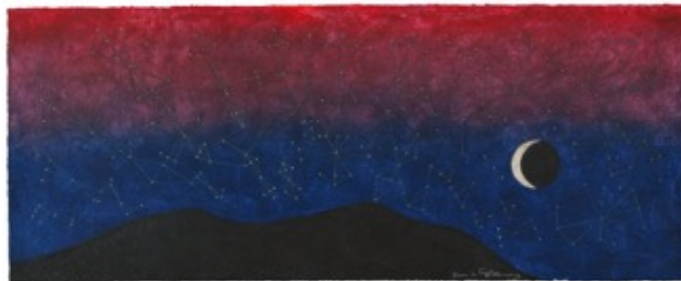
Slika 3.5.2. Galaksija, 1977.