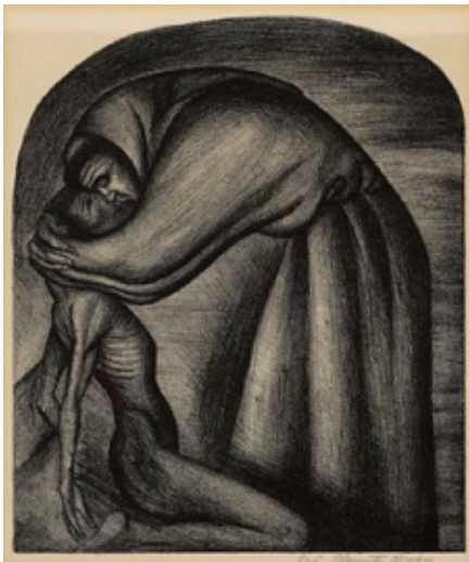
Slika 3.3.1. Franjevac i Indijanac, 1916.