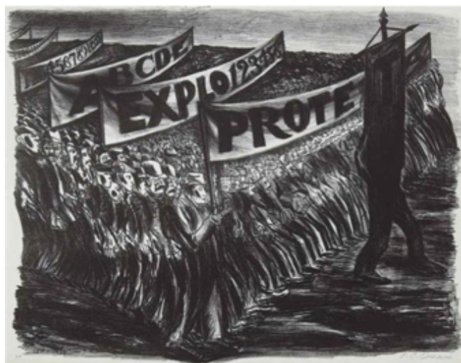
Slika 3.3.3. Prosvjed, 1935.