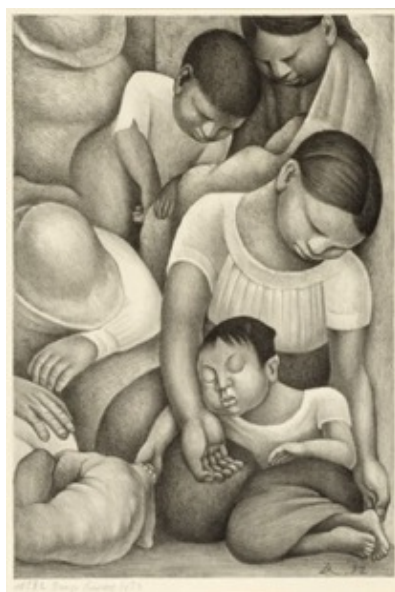
Slika 3.2.2. San , 1932.