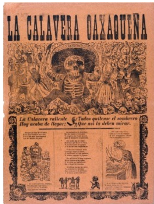
Slika 3.1.6. Ilustracija u novinama Calavera oaxaqueña, 1903.