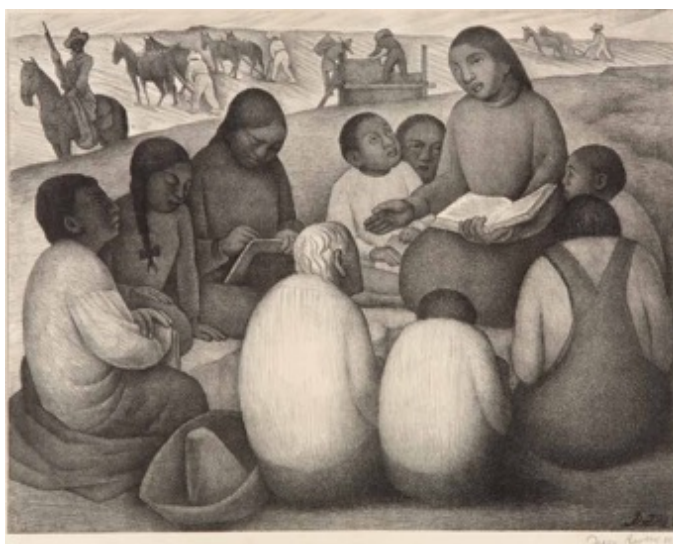
Slika 3.2.3. Seoska škola, 1932.