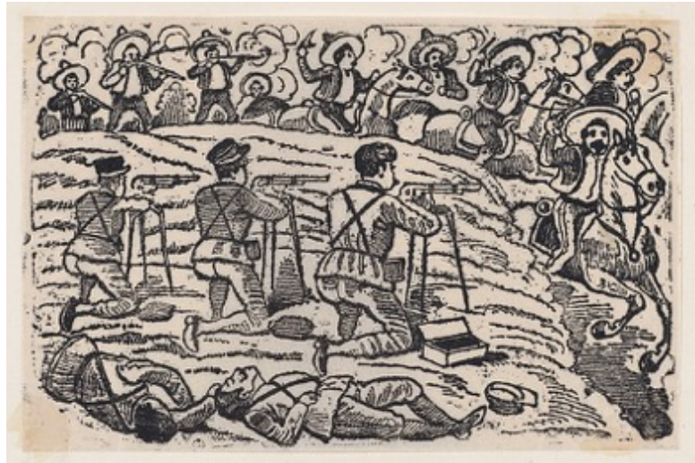
Slika 3.1.4. Bitka između federalne vojske i Zapatinih pristaša, 1910.