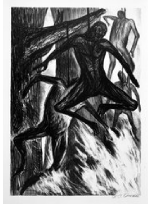
Slika 3.3.7. Obješeni ljudi (crnci), 1930.