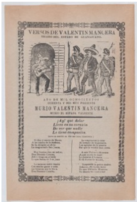
Slika 3.1.5. Uhićenje Valentina Mancere, 1902.