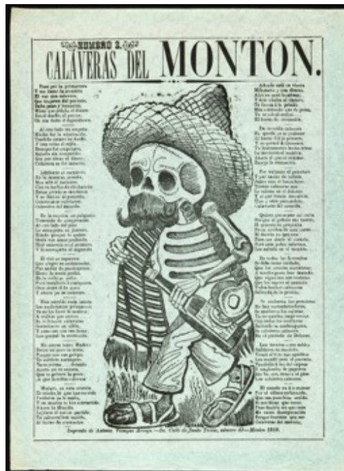
Slika 3.1.9. Calaveras s hrpe, broj 2, 1910.