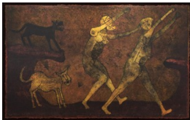
Slika 3.5.1. Dva lika napadnuta psima, 1983.

Njegova djela nastala između 1925. i 1991. godine, uključuju drvoreze, litografije, bakropise i grafike mixografije. Uz pomoć meksičkog tiskara i inženjera Luisa Rembe, Tamayo je proširio tehničke i estetske mogućnosti grafičke umjetnosti razvijanjem novog medija koji su nazvali mixografija. Ova je tehnika jedinstveni postupak likovnog tiska koji omogućuje izradu otisaka s trodimenzionalnom teksturom te slobodu da se koristi bilo koja kombinacija čvrstih materijala. Osim što je bio pionir novog grafičkog postupka, Rufino Tamayo u nasljeđu ostavio i svojih 80-ak originalnih mixografski radova.