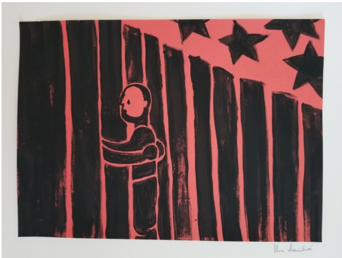
Slika 3.3. Zid između nas, 2020.

Serijski 13 drvoreza David Alvaro Siqueirosa nastalih za vrijeme njegovog boravka u zatvoru 1931. su bili idejna inspiracija za rad Zid između nas . Slika predstavlja dvoje ljudi razdvojenih zidom sa zvijezdama na nebu. Zid je simbol razdora između obitelji i prijatelja i uzroka napremostive boli i žalosti te je zajedno sa zvijezdama alegorija za američku zastavu.