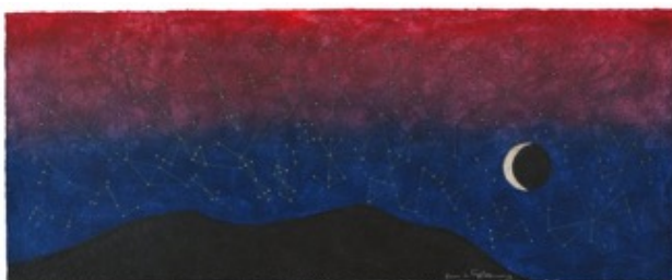
Slika 3.5.2. Galaksija, 1977.