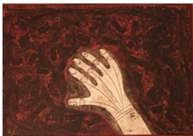
Slika 3.5.3. Bijela ruka, 1977.