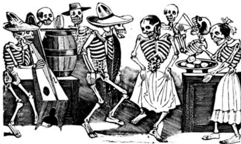
Slika 3.1.8. Veselje zagrobnog života, 1910.