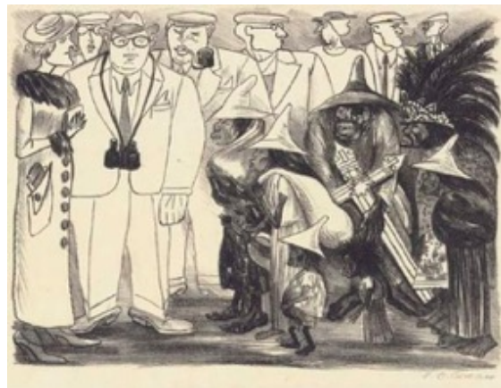
Slika 3.3.5. Turisti, 1935.