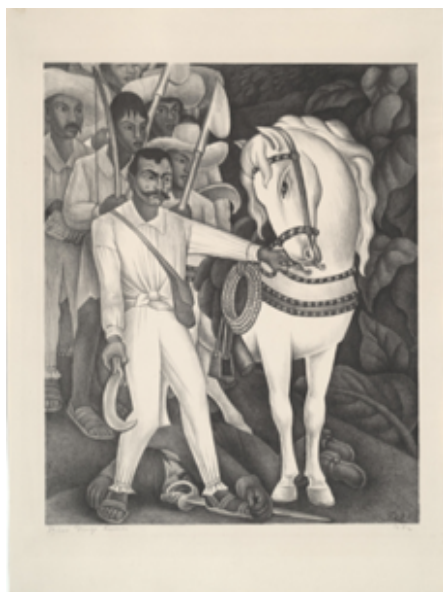
Slika 3.2.1. Zapata , 1932.

Litografija Zapata se temelji na detalju iz ciklusa freski u palači Cortés u Cuernavacaci, koji prikazuje povijest Meksika. U njoj Rivera prikazuje revolucionarnog heroja Emiliana Zapatu tijekom Meksičke revolucije 1910. Zapata, koji je postao nacionalni heroj i simbol otpora, prikazan je kako drži uzde konja čiji aristokratski vlasnik leži mrtav pred njegovim nogama. Prati ga skupina seljaka koji nose bijele košulje. Ovu scenu s freske Rivera je ponovno slikao za svoju izložbu 1931. u Muzeju moderne umjetnosti i sada je u muzejskoj stalnoj zbirci.