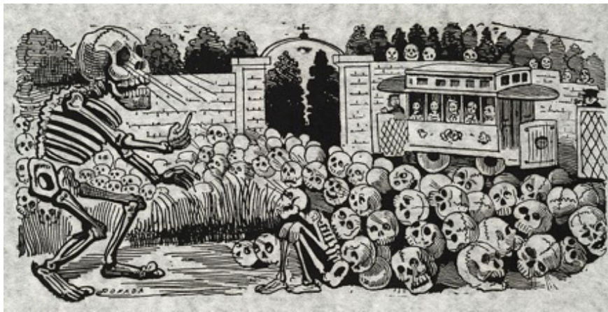
Slika 3.1.7. Velika električna lubanja, 1900.-1913.