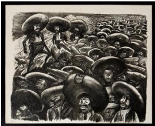
Slika 3.3.4. Zapatisti, 1935.