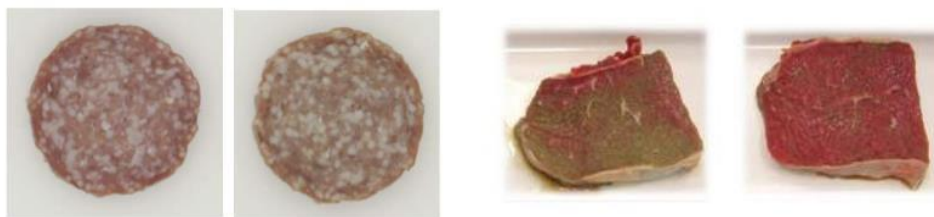
Slika 15. Promjena boje mesnih proizvoda uslijed oksidacije [16]

same ambalaže. Postoje i razni moderni postupci koji se temelje na ugradnji aktivnih barijera u ambalažni materijal. Te ugrađene barijere bi prema potrebi propuštale više ili manje kisika ovisno o kakvoj se namirnici radi [3]. Aktivna barijera smanjuje permeaciju kisika u ambalažu iz okoline, štiti proizvod od kvarenja i promjene kvalitete. Ugradnjom aktivnih tvari poput željeznog (3) oksida ili zeolita koji vežu na sebe kisik, možemo usporiti oksidaciju i smanjiti koncentraciju kisika u ambalaži do 0,1,%. Također se dodaju hvatači vodene pare ( \text{Al}_2\text{O}_3 i \text{ZnO} ) te slojevita glina kao fizička barijera koja usporava prolaz molekula \text{O}_2 kroz ambalažni film polietilena. Hvatači kisika se dodaju u različite vrećice, boce, čepove, folije i sl.