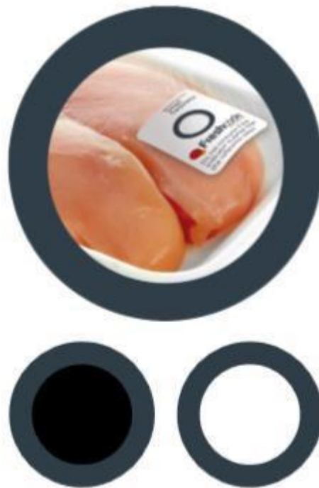
Slika 4. Primjer indikatora svježine [4]

Inovativni indikator svježine „Freshcode“ (razvijen od tvrtke Kao Chimigraf) ukazuje potrošačima, distributerima i proizvođačima ambalaže idealno razdoblje za konzumaciju filetiranih i okoštenih pilećih prsa pakiranih u modificiranoj atmosferi (MAP). Ova inteligentna boja postupno mijenja obojenje kako bi pokazala stupanj svježine. Proizvod više nije za potrošnju kada se naljepnica pretvori u potpuno crnu boju [4].