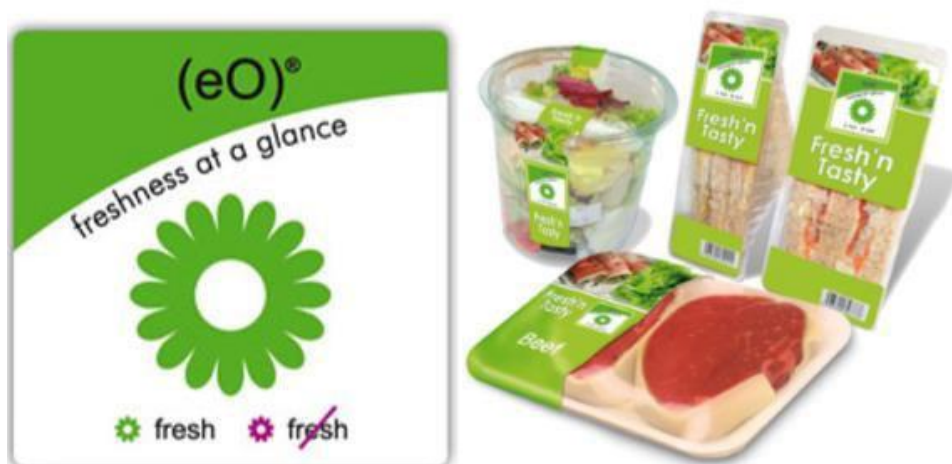
Slika 14. Primjer indirektnog vremensko-temperaturnog bioindikatora [14]

Iako bioindikatore možemo podijeliti na direktne i indirektne, u prehrambenoj industriji se češće koriste indirektni zbog premale osjetljivosti direktnih bioindikatora. Primjer indirektnog vremensko-temperaturnog bioindikatora je (eO) ® naljepnica tvrtke Cryolog. Tehnologija se bazira na mikroorganizmima koji simuliraju kvarenje zapakiranog proizvoda. Indikator sadrži gel s mikroorganizmima koji se izrađuje posebno prema vrsti namirnice, uvjetima skladištenja i razini tražene svježine. Ukoliko je proizvod bio predugo izložen nepovoljnim temperaturnim uvjetima ili je prestar za uporabu boja naljepnice će se promijeniti iz zelene u ljubičastu.[14]