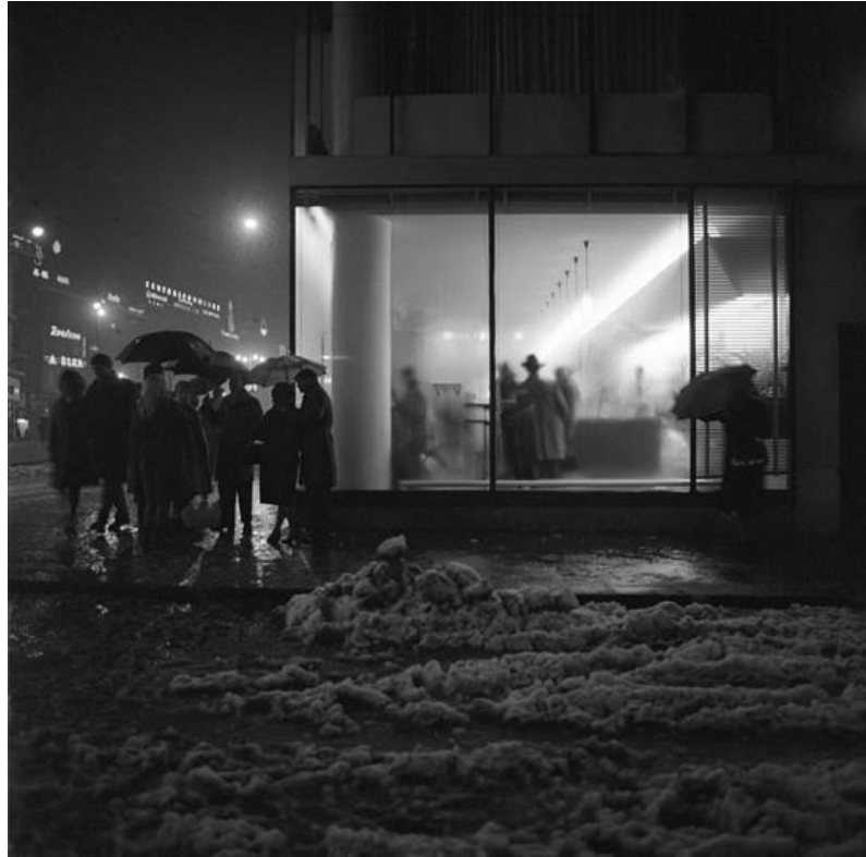
Slika 15: Tošo Dabac, Slastičarna zvana „Majmunjak“, 1960. [21]