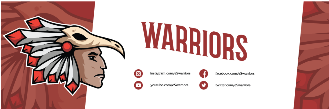
(Slika 21. Banner)

Slika 21. prikazuje banner namijenjen stream platformi Twitch. Kako su svi banneri pravokutnog oblika koristi se isti dizajn, a mijenjaju se samo dimenzije.