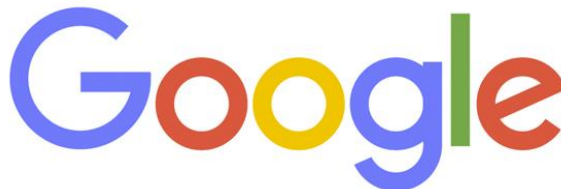
(Slika 2. Logo internet tražilice Google)

2. Tekstualni logo isto kao i monogram temelji se na pismu, odnosno tipografije, ali za razliku od monograma koristi se puno ime tvrtke. Primjer(Slika 2.) tekstualnog logotipa je logo najpopularnije internetske tražilice Google. [9]