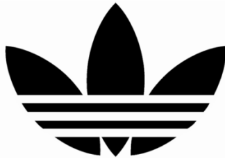
(Slika 4. Logo sportske marke Adidas)

4. Apstraktan logo, umjesto prepoznatljive slike kao piktogram, koristi apstraktne geometrijske oblike. Logo sportske marke Adidas je primjer jednog apstraktnog loga(slika 4.). [9]