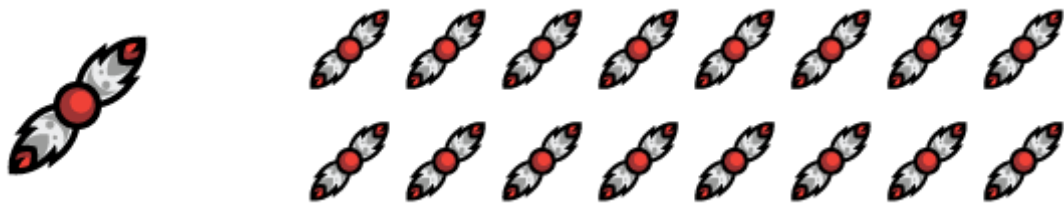
(Slika 18. Pero uzorak)