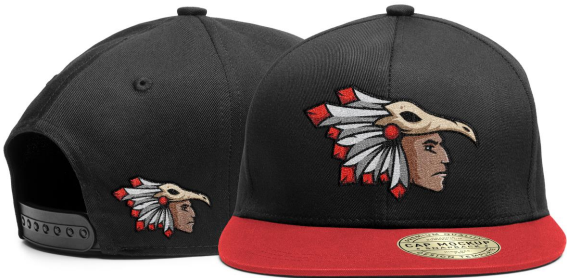
(Slika 25. Kapa s maskotom tima)