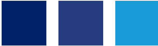
(Slika 6. PayPal paleta boja)

Za primjer možemo uzeti pletu boja PayPal servisa (slika 6.). Radi se o internetski orijentiranoj kompaniji koja omogućuje obavljanje uplata i novčanih prijenosa u potpunosti preko interneta. Plava, kao primarna boja u ovom slučaju, savršena je za ovaj brend jer upravo zbog svojih osobnosti kao što je stabilnost, povjerenje i sigurnost.