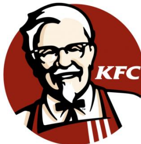
(Slika 5. Logo američkog lanca restorana KFC)

5. Maskota je ilustrirani lik koji predstavlja tvrtku. Odličan je način za stvaranje vlastitog glasnogovornika brenda. Primjer maskote je logo američkog lanca restorana KFC(Slika 5.). [9]