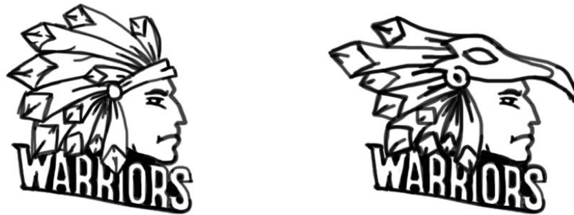
(Slika 13. Skice maskote)

Prije izrade ilustracije, napravljene su dvije skice maskote, koje se mogu vidjeti na slici 13. Zbog povijesti plemena, skica koja se nalazi na desnoj strani odabrana je kao maskota tima.