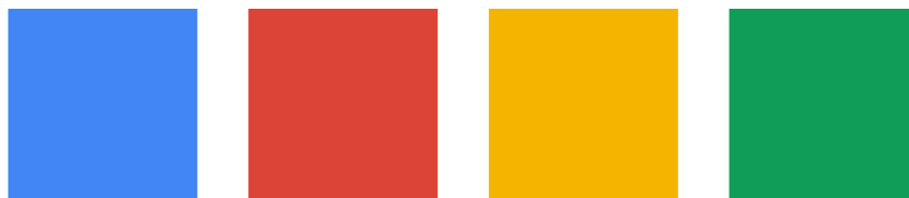
(Slika 7. Google paleta boja)

Zatim imamo paletu internetske tražilice Google (slika 7.). Paleta boja u ovom slučaju sačinjena je od četiri različite boje, što prvenstveno odašilje pristupačnost, otvorenost, a osim toga široka paleta boja ukazuje i na širok spektar pretraživanja, odnosno stvari koji se mogu naći putem tražilice.