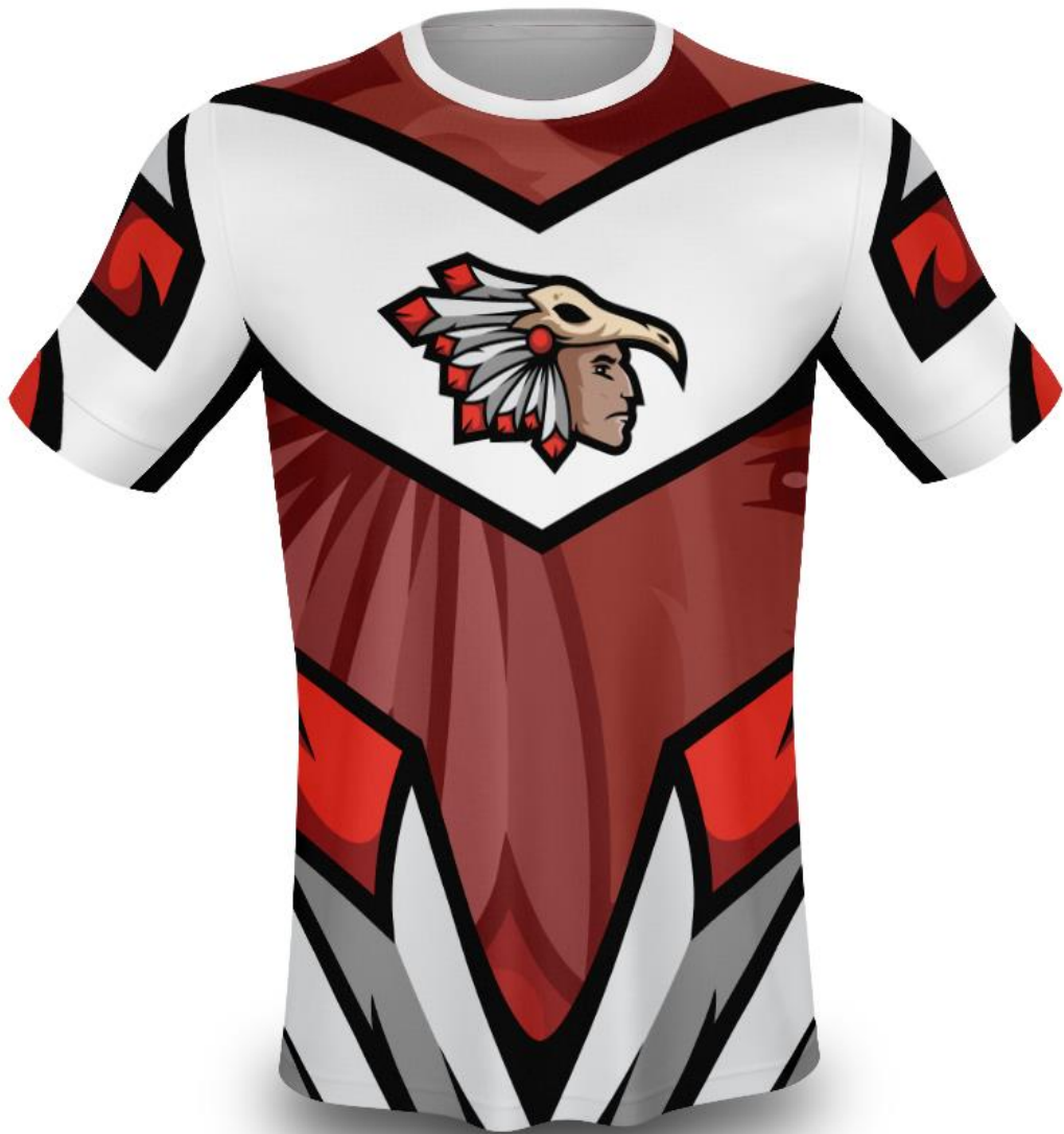
(Slika 22. Dres eSport tima Warriors)

Od kako su se natjecanja počela organizirati u većim dvorana i na stadionima počeli su se koristiti dresovi, slični onima prisutnima u konvencionalnim sportovima. Na dresovima se nalaze imena igrača, ovisno i videoigri mogu se i nalaziti pozicije na koja igraju, osim toga tu je i maskota tima kao i sponzori.