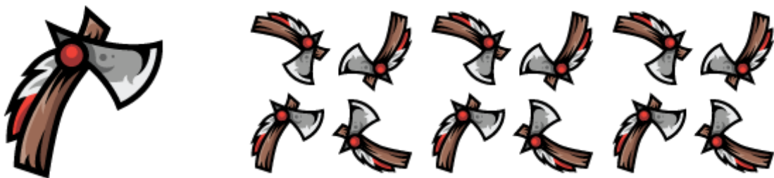
(Slika 17. „Tomahawk“ uzorak)