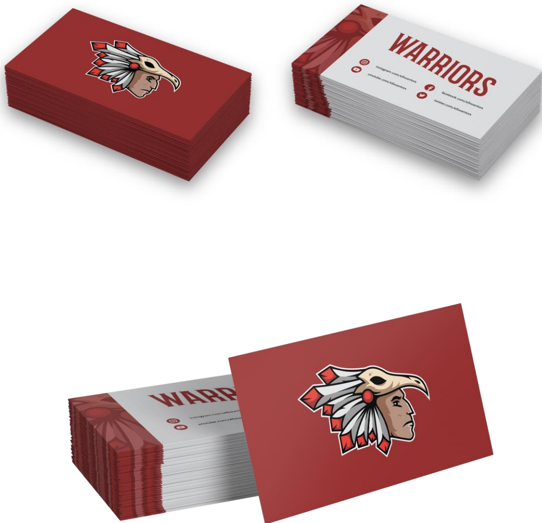
(Slika 23. Prednja i stražnja strana podsjetnice)

Pojestnice u eSportu se prvenstveno koriste kako bi se reklamirali Twitch i YouTube profili, odnosno kanali.