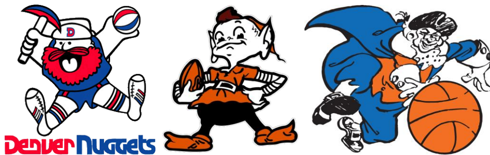
(Slika 10. Stare maskote NFL timova)

Maskote su prvobitno izgledale veselo, ličile su na likove iz crtanih filmova (Slika 10.), ali je 1970-tih došlo do promjene stila, te se sa „veselih“ maskota prešlo na maskote koje su danas prisutne u gotovo svim američkim sportovima. [12]