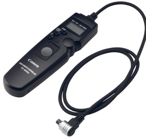
(Slika 5.) Intervalometar: Canon TC-80N3