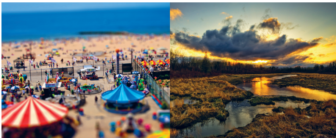
(Slika 6.) Tilt-shift time-lapse