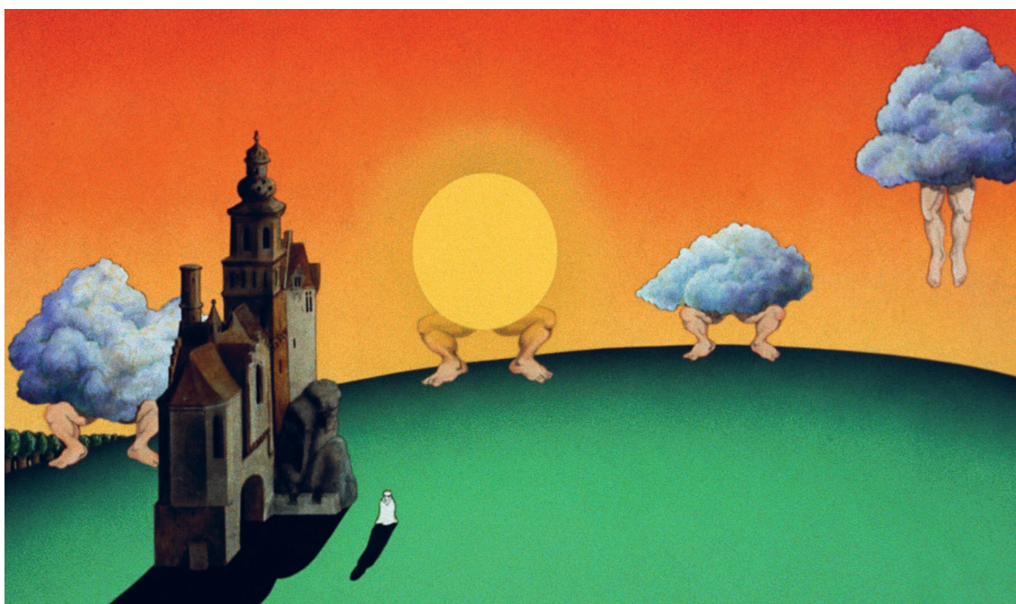
(Slika 12.) Film: Leteći cirkus Monty Python-a

Stop motion izrađen uz pomoć kolaž papira se radi tako da izrezuju oblici željenih likova ili okoline. Ova tehnika je također relativno komplicirana te zahtjeva visok nivo stručnosti i pažnje, ali ne toliko koliko drvene lutkice ili glinene figurice. Ova tehnika najviše slični klasičnom crtanom filmu zbog činjenice da se koristi većinom papir. Postoji i slična alternativa ovoj tehnici a radi se o snimanju uz pomoć silueta. Razni izrezani oblici se koriste na način da se njihova sjena projicira na podlogu koja se fotografira. Kao najbolji primjer stop motion animacije uz pomoć kolaža može se navesti britanski humoristični serijal: "Leteći cirkus Monty Python-a" , (Slika 12.) gdje su sekvence između glumačkih scena ispunjene kratkim duhovitim isječcima izrađene ovom tehnikom.