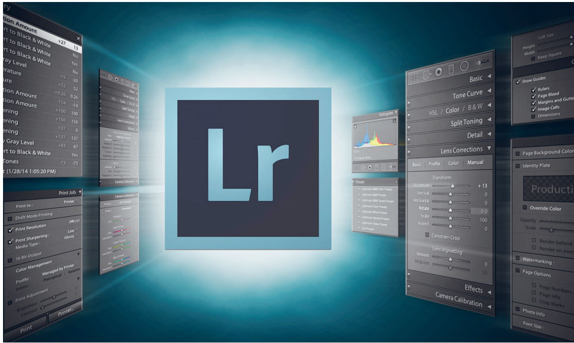
(Slika 14.) Adobe Photoshop Lightroom