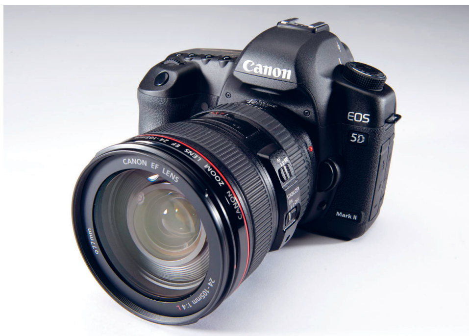
(Slika 2.) Fotoaparat: 5D Mark II

proširuje okvire fotografije. Tehnički podaci: RFull frame CMOS senzor od 21,1 megapiksela, procesor DIGIC 4, mogućnost proširivanja osjetljivosti do 25 600 ISO, snimanje Full HD (1080, 30 sličica u sekundi) videozapisa, 3-inčni VGA LCD Live View zaslona, snimanje JPEG fotografija brzinom do 3,9 fps do granice kapaciteta memorijske kartice, 9 AF točaka i dodatnih 6 AF točaka, kućište načinjeno od magnezijske legure.