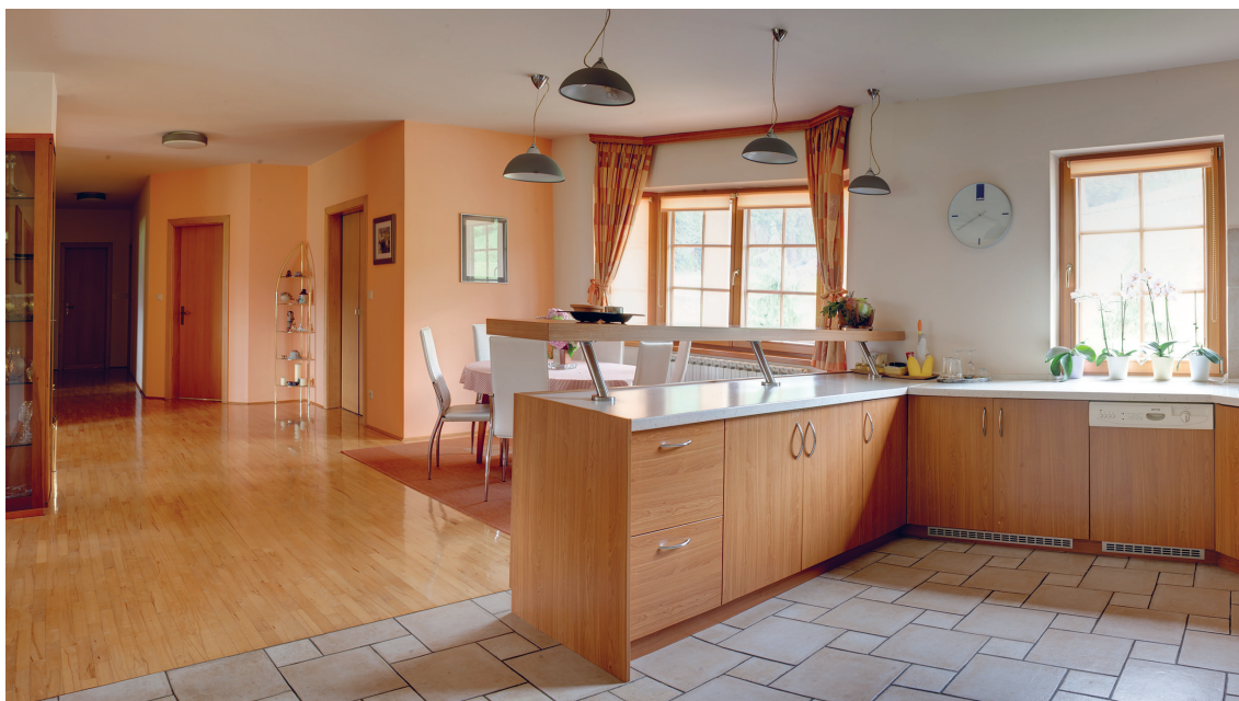
(Slika 8.) HDR fotografija

Ova tehnika je čak i u današnje vrijeme vrlo zahtjevna za izradu te iziskuje mnogo sati rada budući da se svaka sličica koja će se kasnije prikazivati u videu mora ručno obraditi u programu koji izrađuje HDR fotografije.