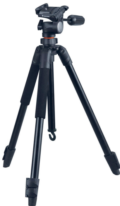
(Slika 4.) Stativ: Vanguard Espod 233AP