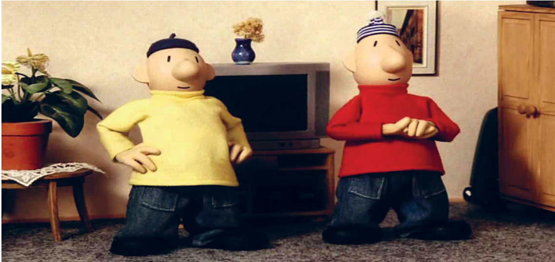
(Slika 10.) Crtić: A Je To! , 1976.