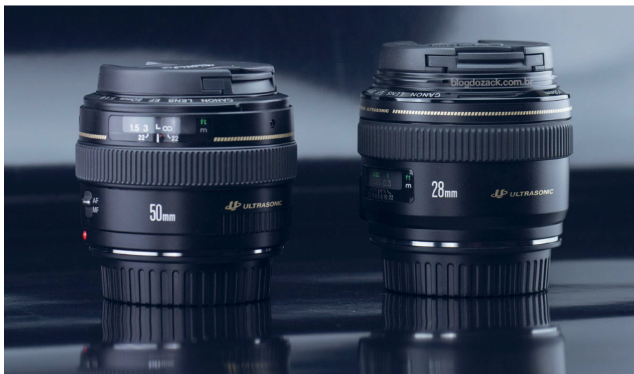
(Slika 3.) Objektivi: Canon 28 mm 1,8, 50 mm 1.4.

kojima se nalazi fotoaparati postaje sve veći pa neželjeni pomaci kadrova mogu postati problem koji se do neke mjere može ispravljati u post produkciji.