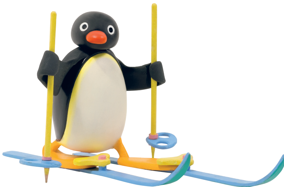
(Slika 11.) Crtić: Pingu

Kao i lutke, animiranje glinenih figurica stop motion tehnikom spada među najstarije objekte koji se animiraju. Figurice su izrađene većinom od plastelina a oblikuju ih vrlo kvalitetni animatori i umjetnici. Kao i u slučaju lutaka, ova tehnika je također vrlo zahtjevna za snimanje i najbolje funkcionira u finijoj varijanti, što znači da se snima izuzetno velika količina fotografija. Primjer za ovu vrstu animacije je dobro poznati film Pingu ( Slika 11. ), gdje je glavni lik nestašni pingvin sa južnog pola.