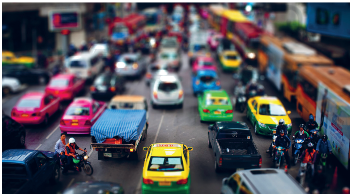
(Slika 9.) Tilt-shift fotografija

Jedna od nuspojava ove tehnike je doimanje objekata na sceni umanjenima poput makete zbog selektivnog fokusa. U svrhe time-lapsea ova tehnika se koristi za vrlo interesantno prikazivanje svakodnevnih događaja na način na koji čovjek nije naviknut promatrati. Zbog optičkih karakteristika tilt-shift objektivu i zbog dinamičkih svojstava pojedine scene, objektivu sa ovom funkcijom se ne koriste u izradi animacija, nego se taj efekt dodaje kasnije u post produkciji. Za dobivanje valjanog tilt-shift odnosno minijaturnog efekta potrebno je zamutiti kadar u dosta velikoj mjeri, odnosno dodati vrlo plitku dubinsku oštrinu na pojedinu scenu. Optičke karakteristike objektivu u većini slučajeva ne omogućavaju željenu količinu dubinske oštine, pogotovo širokokutni objektivu koji čak i na najvećim otvorima zaslona daju neželjene rezultate. Kao primjer može poslužiti objektiv žarišne duljine 18mm, sa otvorom zaslona od f/2.8. Takva postavka objektivu na udaljenosti već od 3.8m na dalje daje potpuno oštru sliku, što je apsolutno neiskoristivo u svrhe tilt-shift-a, odnosno minijaturnog efekta. Čak i širokokutni objektivu sa tilt-shift funkcijom daju slabe rezultate budući da im je glavna namjena manipulacija geometrijom objekata i subjekata koji se fotografiraju. Stoga, da bi se postigao minijaturni efekt i na takvim postavkama objektivu, zamućenje i selektivni fokus scene dodaju se na relativno lak način u kasnijoj obradi u programima za montažu videa ili obradu fotografija.