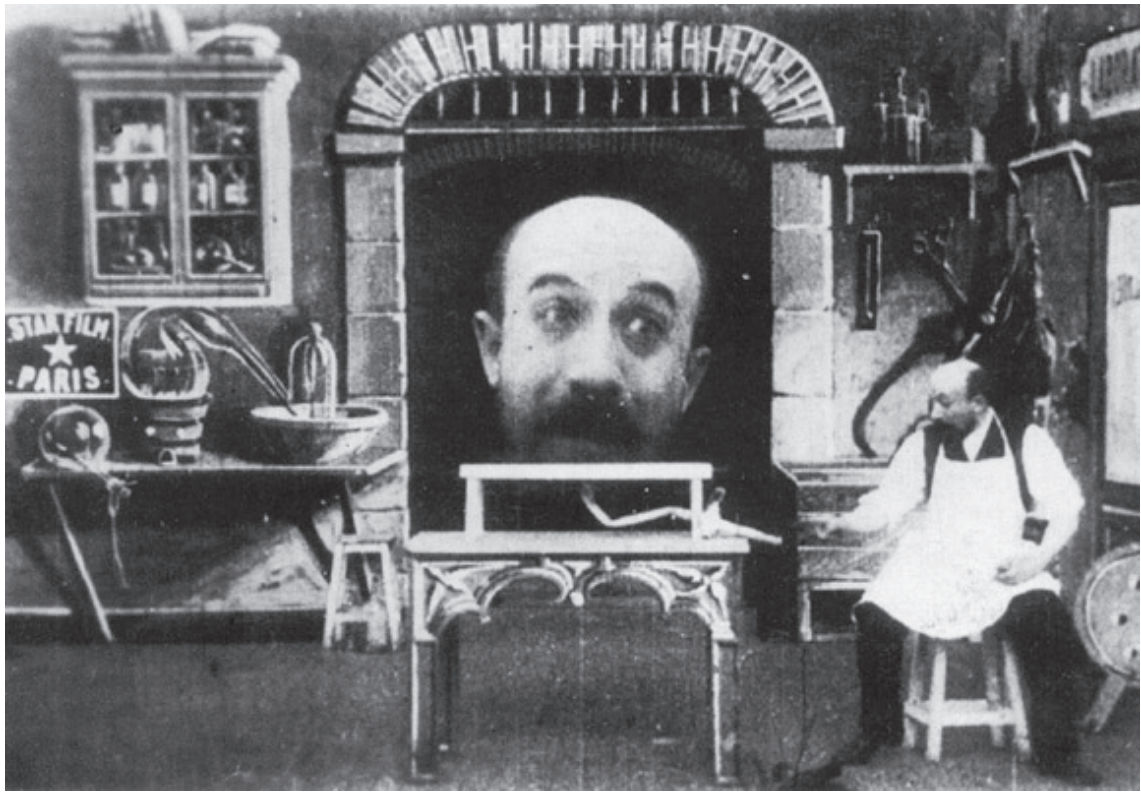
(Slika 1.) Georges Méliès - Carrefour De L'Opera, 1897.