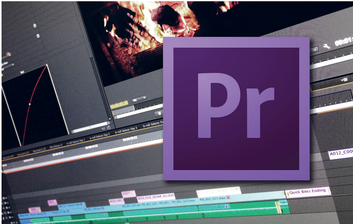
(Slika 13.) Adobe Premiere Pro