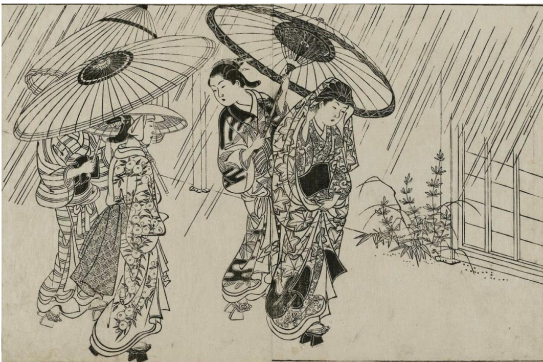
Slika 9. Nishikawa Sukenobu, „Četiri žene sa kišobranima na pljusk“ (izvor: **https://ukiyo-e.org/image/mfa/sc200478 -Ukiyo-e search (31.8.2019.))