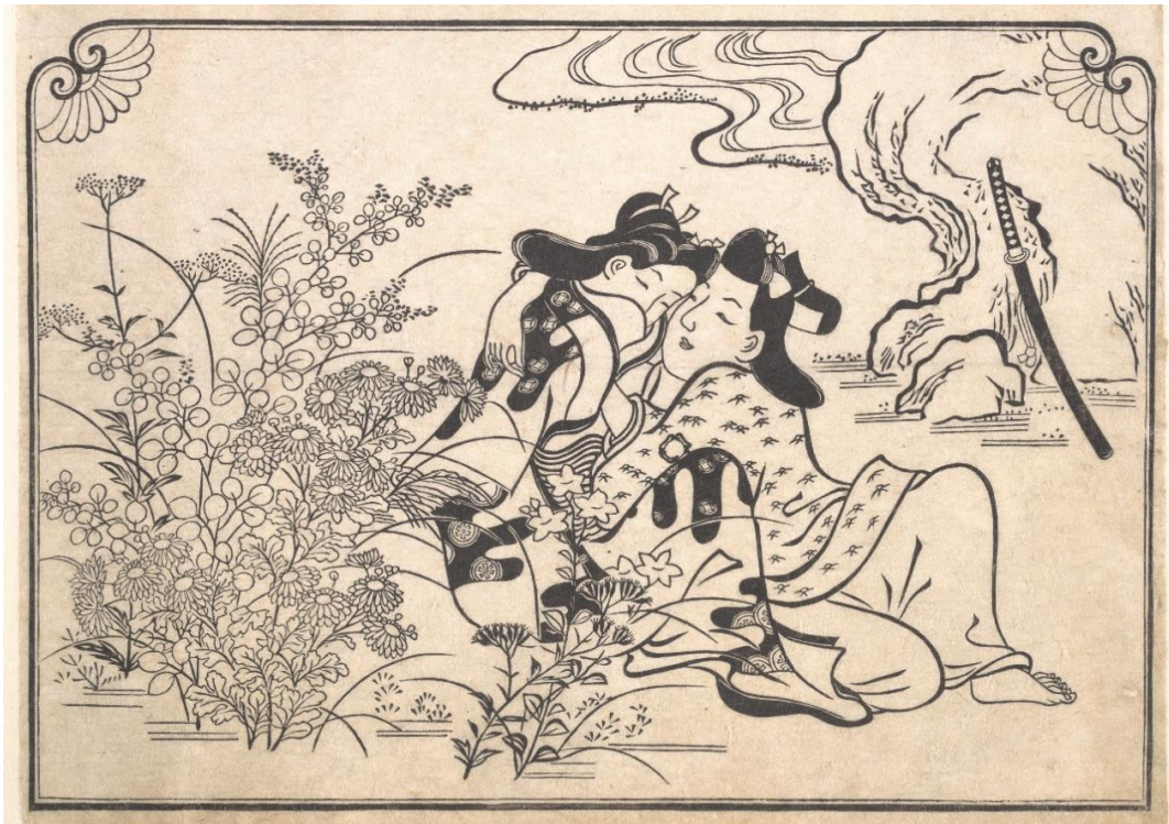
Slika 8. Hishikawa Moronobu, „Ljubavnici pokraj jesenskih trava u cvatu“, 1690-te.