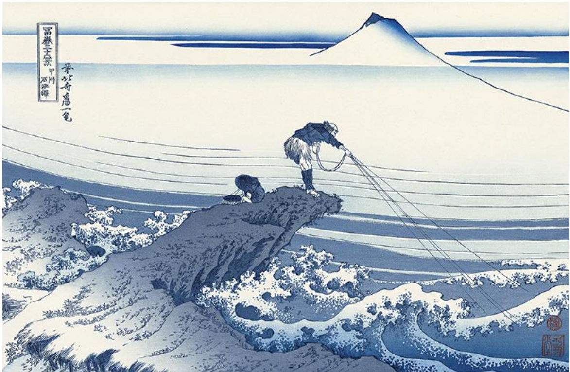
Slika 14. Katsushika Hokusai „Usamljeni ribar kod Kajikazawe“, iz serije „36 pogleda na planinu Fuji“, 1826.-1831.

Utagawa Hiroshige je počeo izrađivati pejzaže po uzoru na Hokusai i njegovu uspješnost. Za razliku od Hokusai, Hiroshige je svoja djela učinio realističnijima povlačeći uzore po principima zapadnjačkih umjetnika. Osim toga, njegova su djela bila poetičnija te se više trudio promatraču prenijeti atmosferu nego točno prikazati scenu. Kao što je i Hokusai napravio nekoliko serija radova, Hiroshige se upustio u isto i otisnuo tri serije slika pod nazivima „53 postaje Tokaida“, „69 postaja Kisokaidoa“ i „100 poznatih prizora Eda“. (slike 15., 16., 17.) [6]