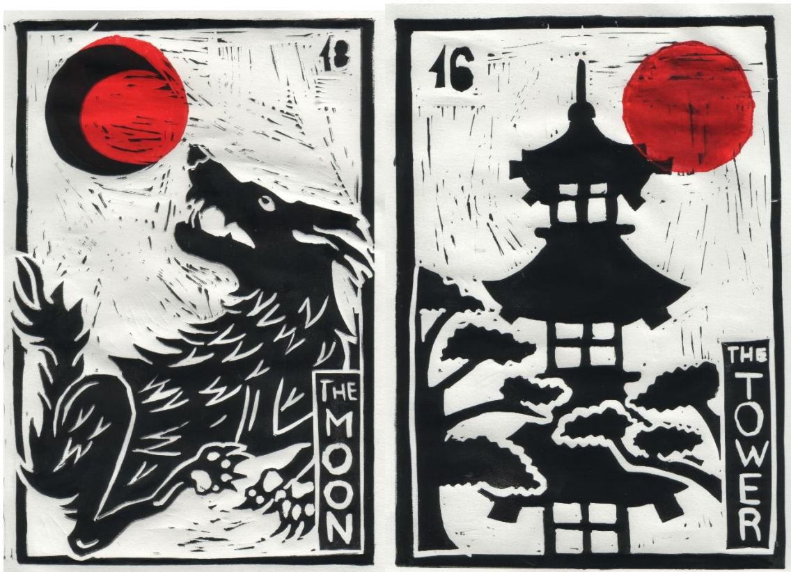
Slika 25. (lijevo) „Mjesec“; slika 26. (desno) „Toranj“