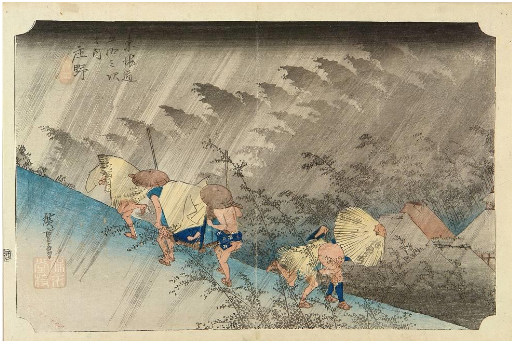
Slika 15. Utagawa Hiroshige „Bijela kiša u Shonou“, iz serije „53 postaje Tokaida“, 1833.-1834. (izvor: ***https://www.metmuseum.org/art/collection/search/36521 - The Met (31.8.2019.))