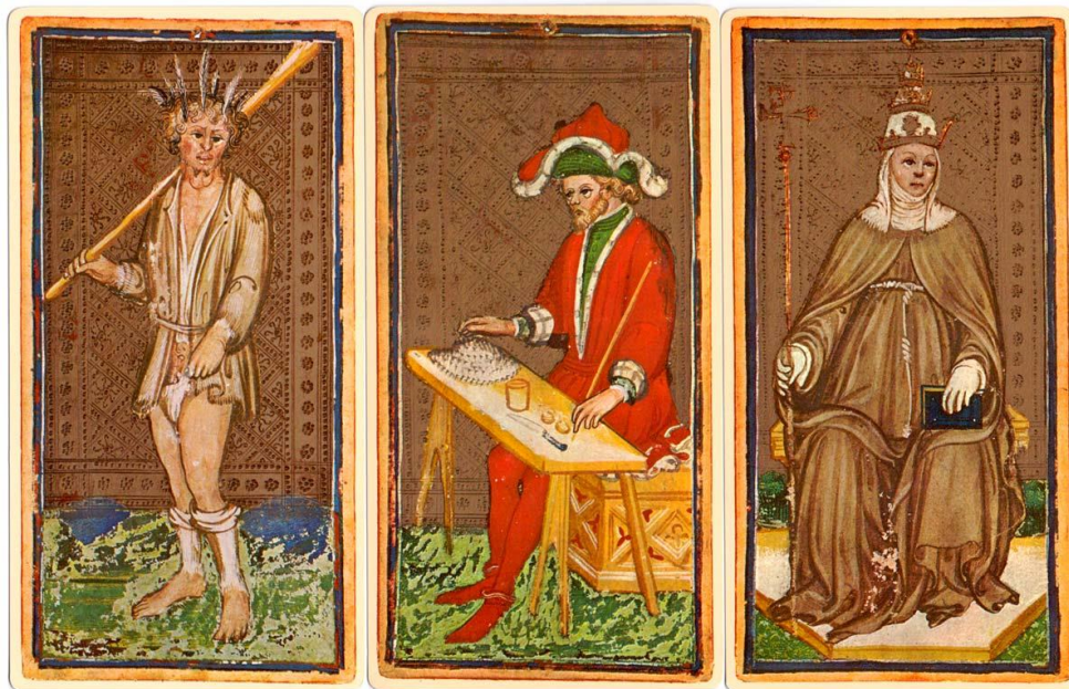
Slika 1. Tri tarot karte iz Visconti-Sforza špila slikara Bonifaccia Bemba iz 1450-ih (izvor: https://www.wopc.co.uk/italy/visconti -The World of Playing Cards (31.8.2019.))

Prvi prorok koji je predviđao budućnost pomoću tarot karti te ujedno i autor „Eteilla ili kako se zabaviti špilom karata nazvanih tarot“, najstarije knjige s uputama za njihovo korištenje i tumačenje bio je Jean-Baptiste Aliette 1770. godine, pod istoimenim pseudonimom „Eteilla“. Osim njega kroz povijest se pojavljuje još nekoliko bitnih ličnosti koje su razvijale i proučavale tarot. Jedan od njih bio je Antoine Court pod pseudonimom De Gébelin, koji je smatrao da je tarot dio egipatske kulture i misterija. Po njegovim zaključcima, to je bio skup egipatskih učenja dugo čuvanih u Rimu od Crkve i Pape, koja su se s vremenom ponovno otkrila i proširila svijetom. Alphonse Louis Constant, pod pseudonimom Éliphas Lévi Zahed također je provodio istraživanja o tarotu kao i njegov učenik Papus koji se složio sa Gébelinovim teorijama o povezanosti tarota i Egipta, ali je odbio prihvatiti da ga je papinstvo čuvalo. Papus iznosi svoju teoriju da su ga očuvali i razvili Romi koji su se u tom razdoblju proširili Europom iz Indije. Bili su poznati po nomadskom životu te se vjerovalo da su proricali budućnost. Lévi, kao i De Gébelin su otkrili povezanost tarota i Kabbale, židovske teozofije i hebrejskog pisma. [2]