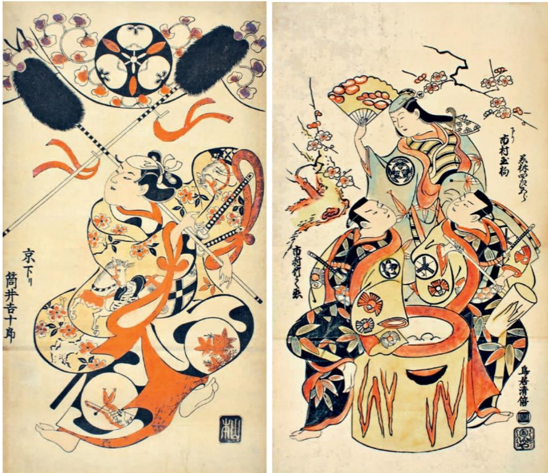
Slika 10. (lijevo) Torii Kiyonobu I., „Glumac Tsutsui Kichijuro“, 1700-te ; Slika 11. (desno) Torii Kiyomasu I., „Tri kabuki glumca rade pastu od riže“ (izvor: Harris Frederick (2010) Ukiyo-e: The Art of Japanese Print. Singapore: Tuttle Publishing )

U 18. stoljeću se razvijaju dvije škole drvoreza: Torii i Kaigetsudo škola. Prvu od njih osnovao je Torii Kiyonobu te je ona bila poznata po otiscima inspiriranim japanskim kabuki predstavama, glumcima i njihovim kostimima. Kabuki je naziv za grupu glumaca čije su predstave pune plesa i komedije, a taj naziv u prijevodu znači neobično ili šokantno. Glavni predstavnici ove škole su bili Torii Kiyomasa I, Torii Kiyomasa II i Torii Kiyotada I. (slike 10. i 11.) [6]