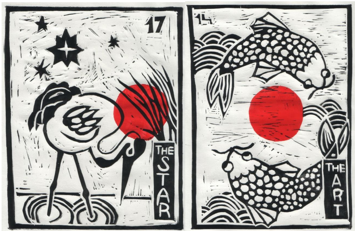
Slika 21. (lijevo) „Zvijezda“; slika 22. (desno) „Umjerenost“