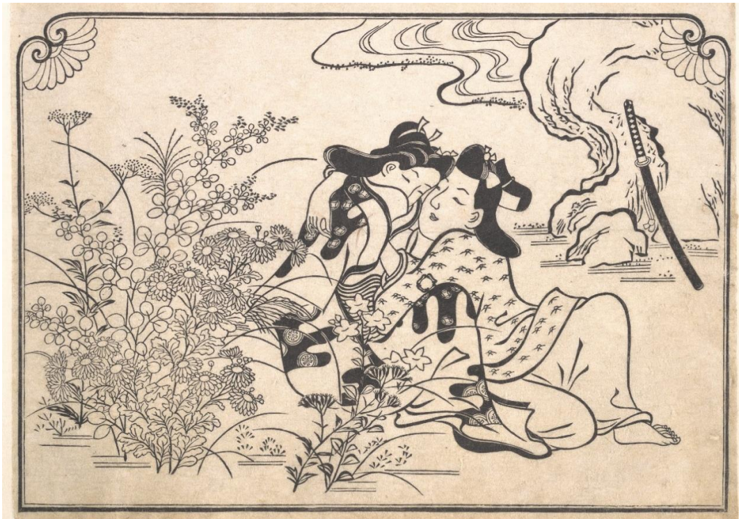
Slika 8. Hishikawa Moronobu, „Ljubavnici pokraj jesenskih trava u cvatu“, 1690-te.