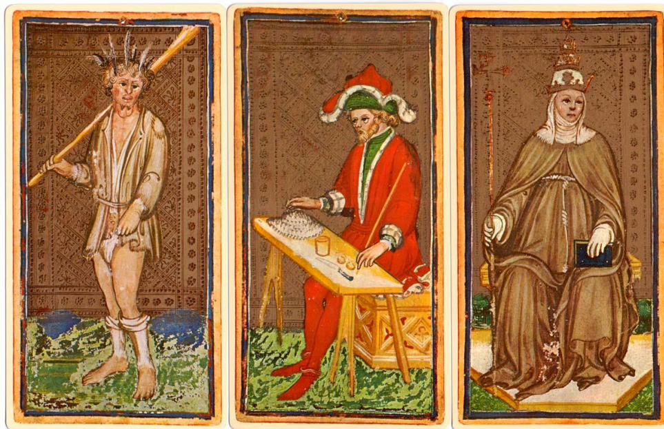
Slika 1. Tri tarot karte iz Visconti-Sforza špila slikara Bonifaccia Bemba iz 1450-ih (izvor: https://www.wopc.co.uk/italy/visconti -The World of Playing Cards (31.8.2019.))

Prvi prorok koji je predviđao budućnost pomoću tarot karti te ujedno i autor „Etteilla ili kako se zabaviti špilom karata nazvanih tarot“, najstarije knjige s uputama za njihovo korištenje i tumačenje bio je Jean-Baptiste Aliette 1770. godine, pod istoimenim pseudonimom „Eteilla“. Osim njega kroz povijest se pojavljuje još nekoliko bitnih личности koje su razvijale i proučavale tarot. Jedan od njih bio je Antoine Court pod pseudonimom De Gébelin, koji je smatrao da je tarot dio egipatske kulture i misterija. Po njegovim zaključcima, to je bio skup egipatskih učenja dugo čuvanih u Rimu od Crkve i Pape, koja su se s vremenom ponovno otkrila i proširila svijetom. Alphonse Louis Constant, pod pseudonimom Éliphas Lévi Zahed također je provodio istraživanja o tarotu kao i njegov učenik Papus koji se složio sa Gébelinovim teorijama o povezanosti tarota i Egipta, ali je odbio prihvatiti da ga je papinstvo čuvalo. Papus iznosi svoju teoriju da su ga očuvali i razvili Romi koji su se u tom razdoblju proširili Europom iz Indije. Bili su poznati po nomadskom životu te se vjerovalo da su proricali budućnost. Lévi, kao i De Gébelin su otkrili povezanost tarota i Kabbale, židovske teozofije i hebrejskog pisma. [2]