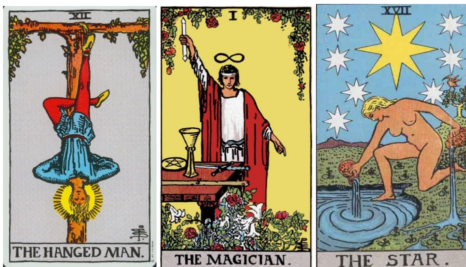
Slika 5. Pamela Colman Smith i Arthur Edward Waite, tri karte iz Waite-Smith špila, 1909.