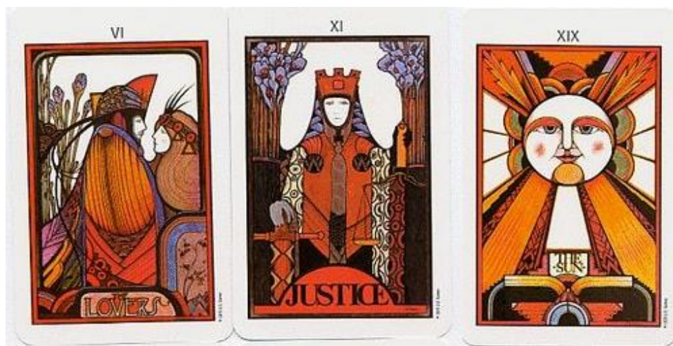
Slika 6. David Palladini, tri karte iz Aquarian špila

David Palladini je dizajnirao prvi new-age tarot 1970-ih godina pod imenom Aquarian tarot špil. Na njegove tarot karte utjecala je secesija, ali i stil art deco temeljem geometrijskih oblika koji se pojavljuju na ilustracijama. Palladini je koristio Waite-Smith špil kao referencu, no za razliku od tih ilustracija, svoje je likove na kartama prikazivao u profilu te u uvećanom izdanju ističući uglavnom samo glavu i poprsje. (slika 6.) [4]