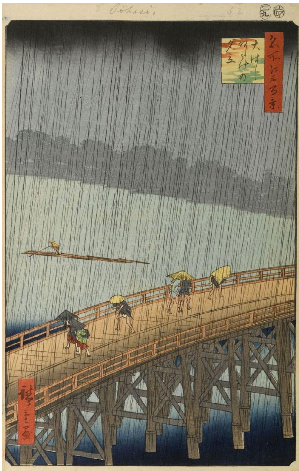
Slika 17. Utagawa Hiroshige „Iznenadni pljusak nad Shin-Ohashi mostom i Ataki“, iz serije „100 poznatih prizora Eda“, 1856.-1858.