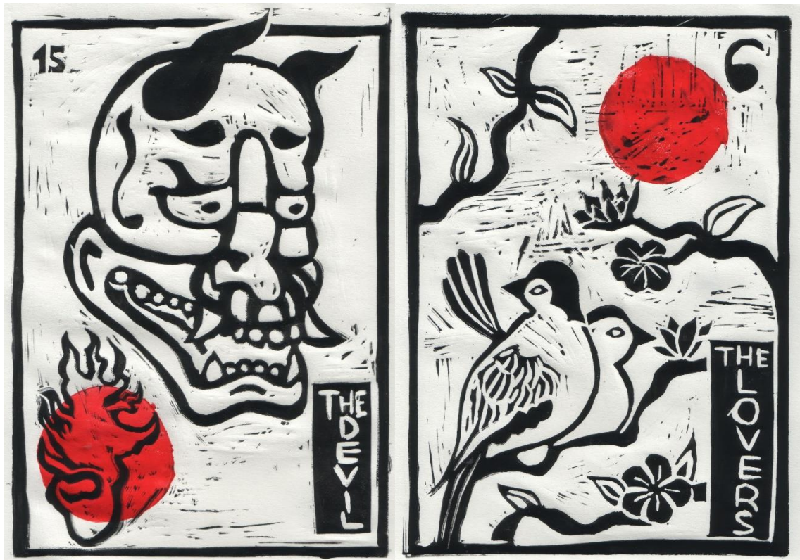
Slika 23. (lijevo) „Đavo“; slika 24. (desno) „Ljubavnici“