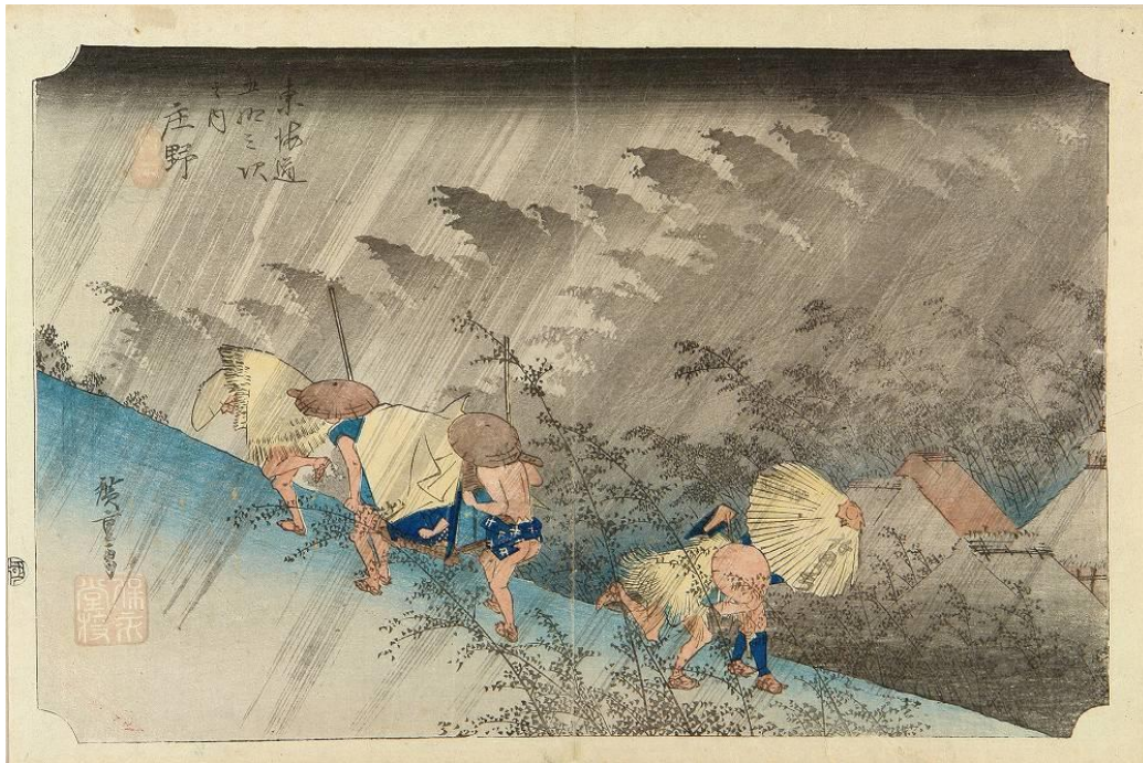
Slika 15. Utagawa Hiroshige „Bijela kiša u Shonou“, iz serije „53 postaje Tokaida“, 1833.-1834.