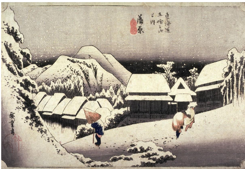
Slika 16. Utagawa Hiroshige „Noćni snijeg u Kambari“, iz serije „53 postaje Tokaida“ 1833.-1834.