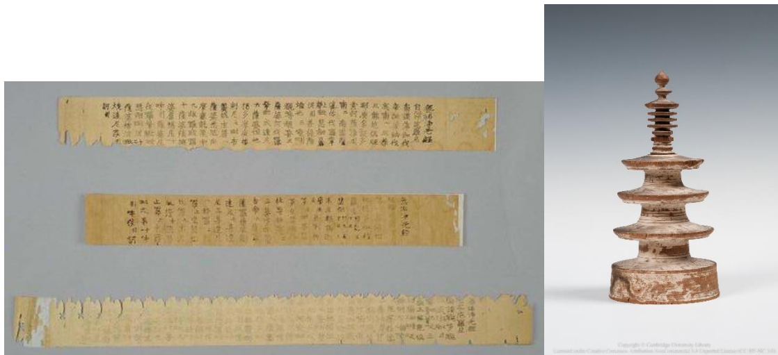
Slika 7. Molitve koje su se umetale u pagode i pagoda iz 8. stoljeća (izvor: *** https://www.atlasobscura.com/articles/japanese-buddhist-scroll-gutenberg -Atlas Obscura (31.8.2019.), https://cudl.lib.cam.ac.uk/view/PR-FG-00870/1 -Univerity of Cambridge (31.8.2019.) )

Hishikawa Moronobu se smatra začetnikom japanskog drvoreza te su njegovi otisci isključivo crno bijeli. Ponekad su neki motivi bili obojeni, no u početku su bili klasični sumizuri-e . (slika 8.) Drugi, veoma važan umjetnik za tu eru bio je Nishikawa Sukenobu čiji su prvi radovi nastali 1699. godine. Njegovi likovi žena na slikama su se činili vjernima i prestale su izgledati kao lutke. (slika 9.) [6]