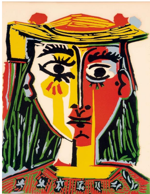
Slika 18. Pablo Picasso „Bista žene sa šeširom“, 1962.

Linoleum je poprilično novoizumljeni materijal, nastao u kasnom 19. stoljeću. Prvi koji je vidio njegov potencijal i iskoristio ga u likovne svrhe bio je Franz Cižek. On ga je odlučio uvesti u svoje sate likovne kulture pošto je njime bilo lako rukovati tako da su se njime mogla koristiti i djeca. Erich Heckel, član i osnivač Die Brücke skupine ekspresionista, izradio je svoj prvi otisak u 1903. godini. Nakon njega popularnost linoreza je porasla te su se slijedom toga mnoge velike ličnosti upustile u ovu grafičku tehniku poput Matisa i Picassa (slika 18.). [9]