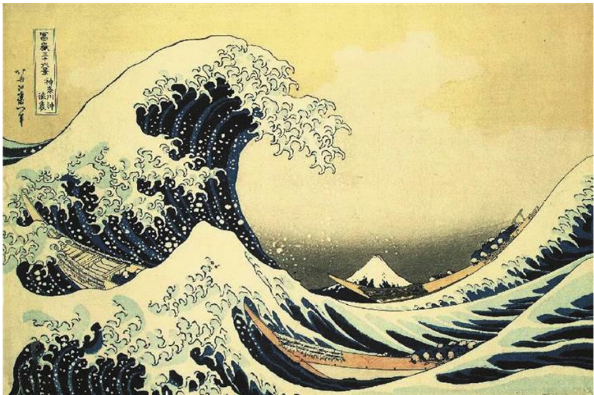
Slika 13. Katsushika Hokusai, „Veliki val kod Kanagawe“, iz serije „36 pogleda na planinu Fuji“, 1826.-1831.

Ukiyo-e su obilježili i brojni pejzaži, a Katsushika Hokusai i Utagawa Hiroshige su bili među najutjecajnijim i najuspješnijim umjetnicima te vrste drvoreza. Mnogi slikari su se pokušali upustiti u izrađivanje pejzaža, no njih dvojica su ostali jedini koji su ih uspjeli revolucionirati. Mjesta koja se prikazuju na pejzažima su često tvorevina mašte autora bez da su ih autori ikada posjetili. Svejedno, to nije umanjilo njihovu sposobnost da ih precizno dočaraju promatraču koji bi se osjećao kao da je zaista dio scene. Dokaz da su njihovi pejzaži uistinu remek djela, je taj da je rad Hokusaia, „Veliki val kod Kanagawe“ djelo koje se danas najčešće asocira sa japanskom umjetnošću. (slika 13.) Ono pripada poznatoj seriji radova „36 pogleda na planinu Fuji“ koja sadrži niz monumentalnih otisaka. Hokusai je također i popularizirao monokromatične otiske u prusko plavoj boji, prvoj sintetskoj boji korištenoj u drvorezu. Njome se mogla postići široka lepeza nijansi, a djela u kojima se ona koristila bila su poznata pod nazivom aizome-e . (slika 14.) [6]