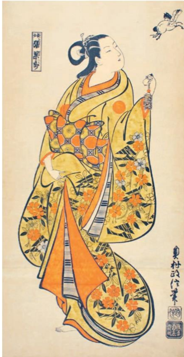
Slika 12. Okomura Masanobu, „Kurtizana Chokaro“, 1710-te

kimonima su bili raznoliki, veoma raskošni te ručno obojeni. Motiv žene i tematika oko njih se kroz vrijeme razvijala i mijenjala. Kako su kabuki glumci ostali kostimirani u kasnijim razdobljima jednako kao i u srednjem vijeku, prikaz žene se kroz godine preinačivao. Od njihove odjeće do urbanih scena te prikaza geisha i kurtizana, žene su postale bitan i popularan motiv u drvorezu. Razvitkom bordela i čajana porasla je potražnja za takvim otiscima i potaknula evoluciju stilova. Ženski portreti postaju realističniji i vjernije prikazuju ženstvenost i njihovu ljepotu. (slika 12.) [6]