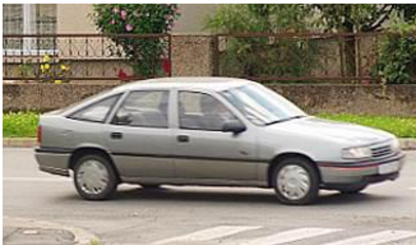
Slika 2.4.6. Velika brzina eksponiranja