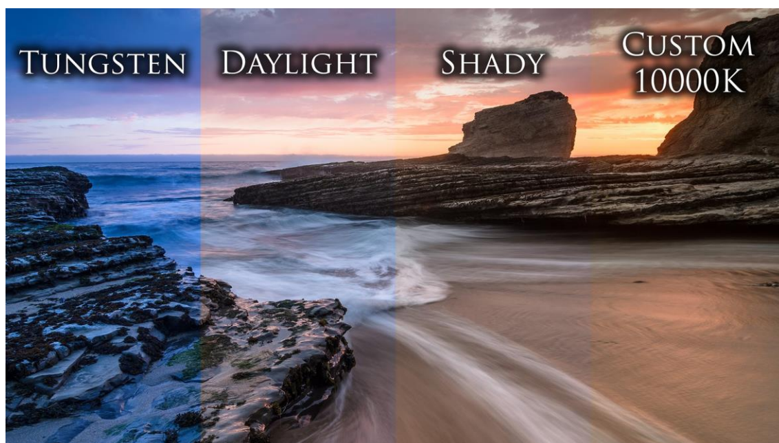
Slika 2.4.12. Fotografije pod različitim opcijama snimanja

Kada gledamo oko sebe, uspoređujemo stvari koje vidimo s našim prijašnjim iskustvima, tj. gledamo kroz „filter“ koji obrađuje naš vidni podražaj. Na primjer, gledamo li bijeli papir pod bilo kojim osvjetljenjem on će nam uvijek izgledati bijelo, jer iz iskustva znamo da je većina papira bijela. To znači da ljudi prilagođavaju balans bijele spontano, tj. automatski, dok fotoaparati snimaju stvarne boje objekata. Digitalni fotoaparati također mogu automatski prilagođavati balans bijele, no taj sustav može imati problem s određivanjem temperature boje, jer ne zna što je autor htio snimiti (npr. snimanje zalaska sunca će uzrokovati probleme).