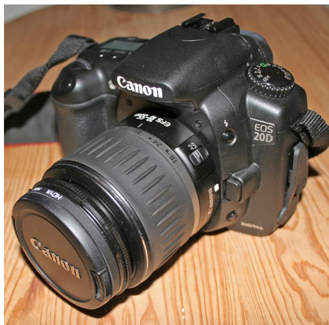
Slika 2.3.2. Canon EOS 20D