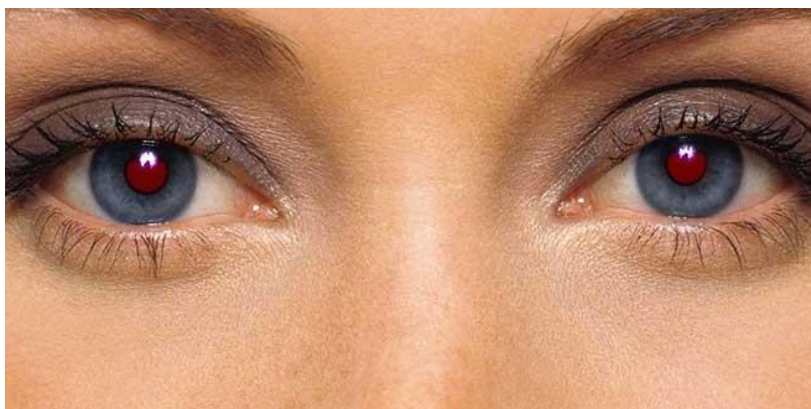
Slika 2.4.9. Crvene oči

Korištenje bljeskalice često zna uzrokovat pojavu tzv. „crvenih očiju“. Ta pojava se događa zbog toga što svjetlo upada u mrežnicu oka, pa zjenice budu osvjetljene iznutra te poprimaju svijetle narančaste ili crvene nijanse. Postoje napredni fotoaparati koji mogu umanjiti efekt „crvenih očiju“ korištenjem predbljeska koji zatvara zjenice. Efekt se može potpuno ukloniti računalnim programima za obradu slike, npr. „Photoshop“, a sam taj proces se naziva „Red eye removal“ ili „Red eye correction“.