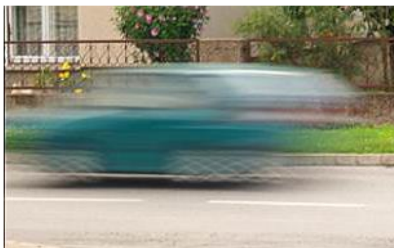
Slika 2.4.7. Mala brzina eksponiranja