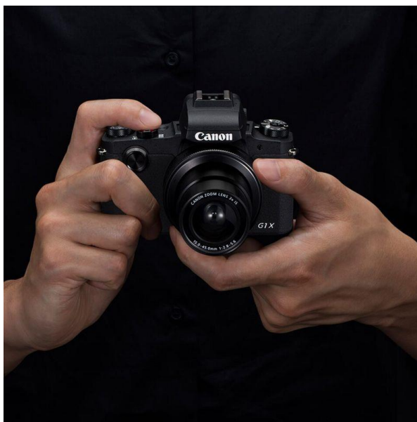
Slika 2.3.3. PowerShot G1 X Mark III