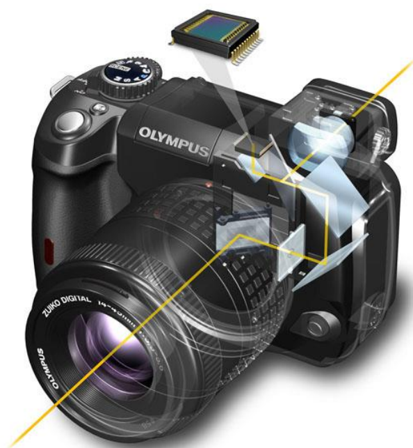
Slika 2.4.2. Refleksno tražilo na fotoaparatu

Za vrijeme kadriranja svjetlosni snop putuje kroz objektiv i udara u koso ogledalo kojim se slika skreće prema staklenoj prizmi na vrhu aparata. Prizma okreće sliku stvorenu na donjoj, matiranoj plohi, jer se u aparatu inače stvara zrcalna slika stvarnosti, postavljena naglavce. Slika je pomoću prizme usmjerena u okular aparata s mogućnošću korekcije vida (podešavanja dioptrija). Kod refleksnog tražila (SLR sustav) nema paralakse, tj. u tražilu se vidi točna slika koja se projicira na CCD sustav. Prije okidanja zrcalo se preklapa (uklanja s puta svjetlosti) nakon čega se otvara zatvarač aparata i počinje ekspozicija. Čim se zatvarač zatvori, zrcalo se vraća u položaj za skretanje svjetlosnog snopa u tražilo, koje je u klasičnim izvedbama "slijepo" za trajanja ekspozicije. Pojavom LCD tražila, refleksno tražilo je nešto izgubilo na značaju, ali je kod profesionalnih fotoaparata još je uvijek obavezno.