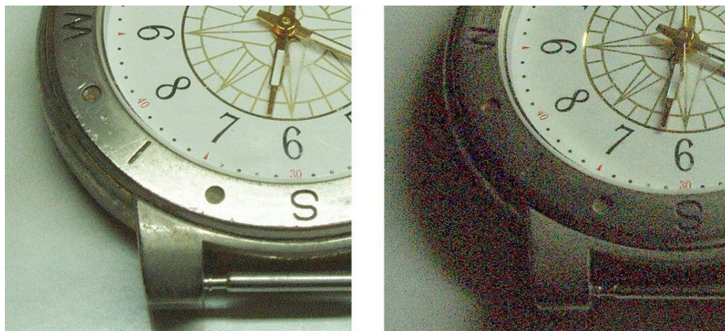
Slika 2.5.3. Normalna slika / zrnata slika

Zrnatost je pojava kojom nastaju raznobojni dodatni pikseli, tj. „zrna“ pri fotografiranju. Javlja se pri snimanju s visokom ISO osjetljivošću te pri lošijim svjetlosnim uvjetima. Slabo osvijetljenje fotoaparata automatski kompenzira većom osjetljivošću te povećavanjem relativnog otvora objektiva. Ako bi nakon toga ručno smanjili objektiv, fotografija bi bila podeksponirana. Da bi dobili prihvatljivu sliku, potrebno je dobro osvijetliti objekt.