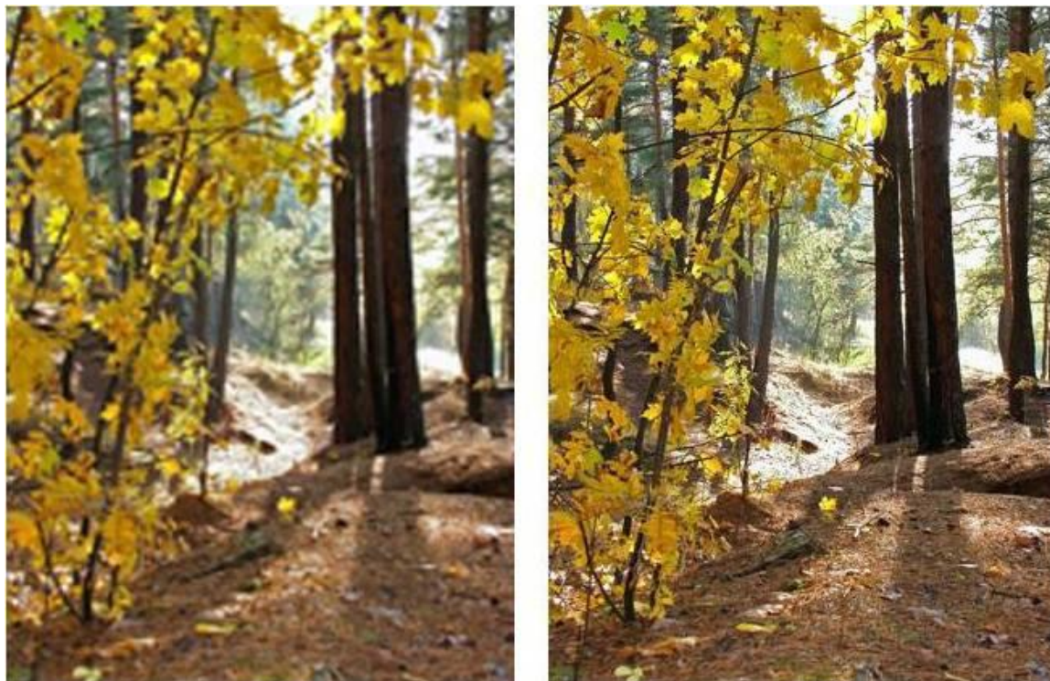
Slika 2.4.11. Mala i visoka razlučivost

Snimanje u memorijski manjoj HQ kvaliteti čak i na skromnijim digitalnim fotoaparatom s dobrim objektivom daje bolju razlučivost od klasičnih 35 milimetarskih aparata. Promjena izvorne veličine slike (također i u fotoeditorima opcijom Resize/Resample) snažno utječe na njezinu memorijsku potrebu.