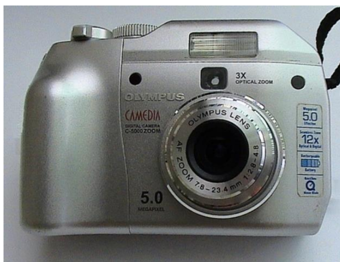
Slika 2.3.1. Digitalna kompaktna napredna amaterska kamera