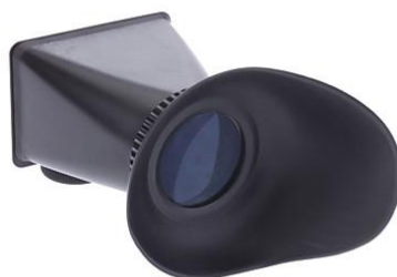
Slika 2.4.3. LCD Tražilo V6

tražilo da bi se uštedila baterija. Mnogi aparati posjeduju automatsku funkciju koja isključuje neaktivne dijelove aparata. Neke kamere imaju LCD ekran umjesto optičkog tražila što rješava problem paralakse.