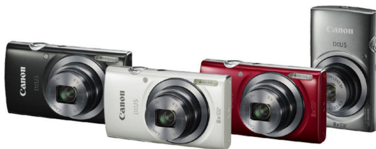
Slika 2.3.4. IXUS 160