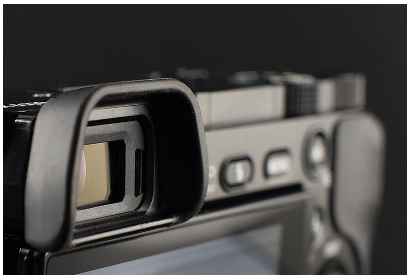
Slika 2.4.1. Tražilo na Sony A6000 „mirrorless“ fotoaparatu

Optičko tražilo je sastavljeno od nekoliko leća i treba pratiti promjenu obuhvata prilikom zumiranja. Napredni aparati se mogu prilagođavati dioptrijama korisnika. Jedna od najvećih problema optičkih tražila je pojava paralakse, tj. slika u tražilu ne može biti identična onoj koju objektiv projicira na CCD zaslon. To se događa zbog toga što se tražilo i objektiv ne nalaze na istoj osi, stoga nemaju „isti pogled“. Na većim udaljenostima to nije problem, ali pri bliskom fotografiranju greška može biti toliko velika da se na slici niti ne vidi objekt koji smo htjeli fotografirati. Paralaksu je moguće ublažiti zbližavanjem tražila i optičke osi objektiva, ali ga nije moguće potpuno ukloniti.