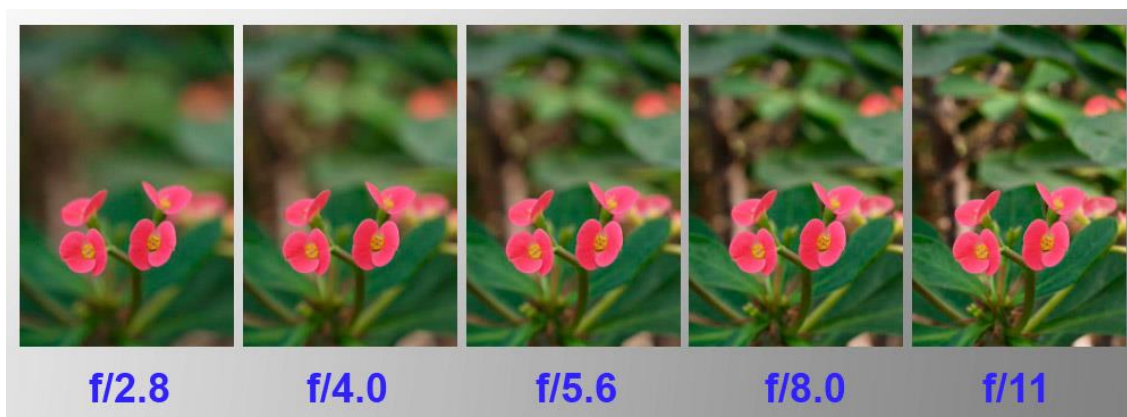
Slika 2.4.5. Dubinska oština

Dubinska oština zavisi o tri faktora: udaljenosti predmeta od objektiva, žarišnoj duljini objektiva, i veličini relativnog otvora. Manji otvori blende i manje žarišne duljine nam daju veće područje dubinske oštine. Teleobjektive odlikuje velika žarišna duljina, stoga su više osjetljivi na izoštravanje, odnosno imaju malu dubinsku oštinu. Uvjeti izoštravanja su osjetljivi na sitne pomake aparata pri velikim žarišnim duljinama tako da je potrebno imati dobru stabilnost pri snimanju. Svladavajući mogućnosti dubinske oštine, možemo sami usmjeriti pažnju na određene objekte fotografije i odrediti njihovu važnost.