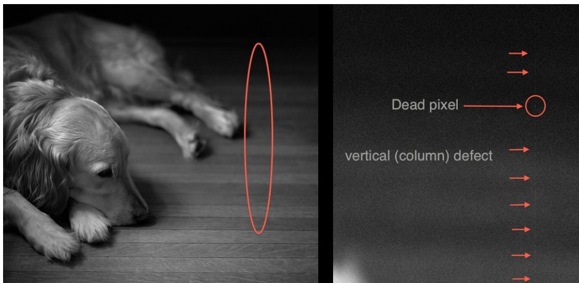
Slika 2.5.4. Mrtvi piksel na slici

„Mrtvi pikseli“ ili „Artefakti“ su bijeli pikseli koji su višak na slici. Oni mogu biti posljedica grešaka CCD zaslona ili prijenosa informacija prilikom konvertiranja formata snimaka. Prilikom montaže video snimke pojedinačne sličice s „artefaktima“ se mogu brisati ako ih nema suviše. Na fotografijama se mogu ručno retuširati foto-editorskim programima.