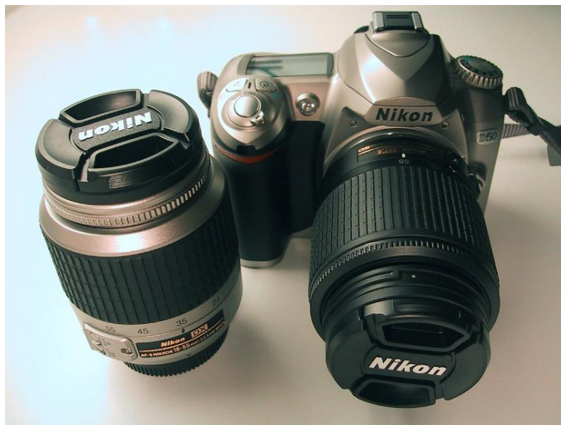
Slika 2.3.5. SLR (polu)profesionalna zrcalno-refleksna digitalna kamera s izmjenjivim objektivima