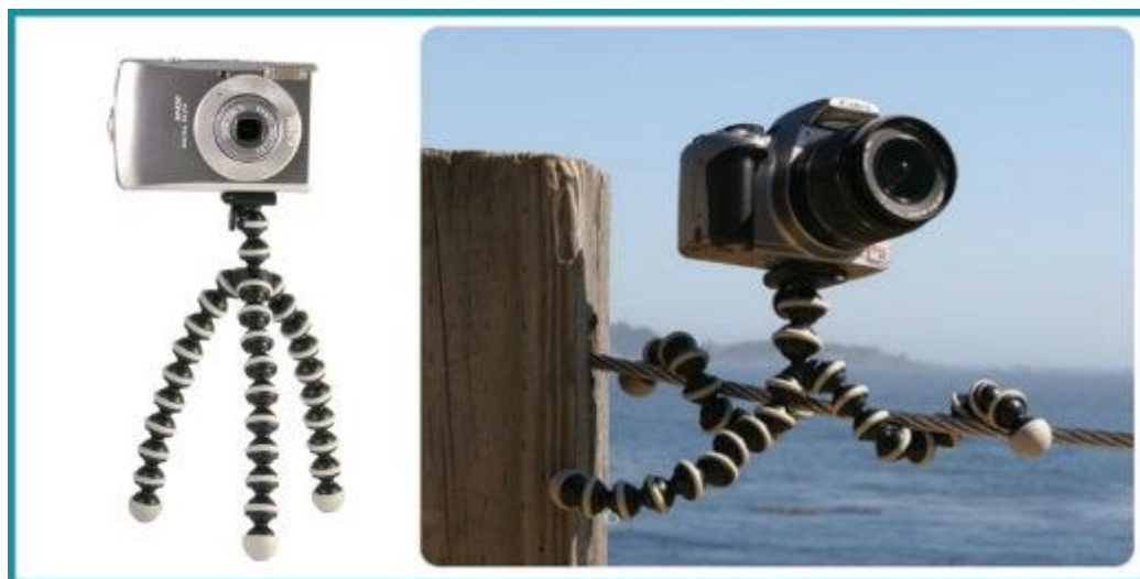
Slika 2.4.8. Fleksibilni stativ

Vrijednosti trajanja ekspozicije u ekstremnim slučajevima mogu biti od pola sata do ispod 1/1000 sekunde, ali najčešće variraju od 1/500 do 1/15 sekunde. Objektivima normalne žarišne duljine (kut obuhvata cca. 50°) je moguće snimati „iz ruke“, tj. bez stativa. Kod dužih ekspozicija snimanje „iz ruke“ bi prouzrokovalo mutnu i neoštru sliku, stoga se mora stabilizirati fotoaparat. Što imamo veću žarišnu duljinu i zum, to je teže snimati „iz ruke“ jer trešnja i vibracija imaju znatno veći utjecaj na kvalitetu fotografije.