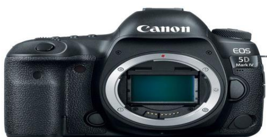
Slika 14. Canon EOS 5D.

Tijekom ranih 2000-ih Canon je nastavio poboljšavati svoje AF leće i proizvodnju serije Powershot. Godine 2005. je izašao legendarni EOS 5D (Slika 14) i (Slika 15), prvi full-frame DSLR fotografski aparat s tijelom standardne veličine, sličnim onom 35 mm SLR-a, a u studenom 2008., iste godine kada je tvrtka proizvela svoj 500-milijuntu SLR jedinicu fotografskog aparata, Canon je lansirao prvi DSLR s mogućnošću snimanja videozapisa u punoj HD rezoluciji, EOS 5D Mark II.