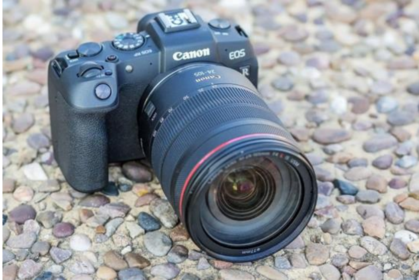
Slika 22. Canon EOS RP.

Od ovih izdanja, veliku popularnost bilježi Canon RF 85 mm f/1.2L, s jednom dodanom tehnologijom koja se zove 'izgladivanje defokusa', namijenjena poboljšanju bokeha 1 na ionako tankom objektivu dubinske oštine.