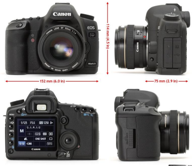
Slika 15. EOS 5D Mark II.

Godine 2011. nastaje EOS Cinema sustav s EOS C300 i uvođenjem Canonovih filmskih leća (Slika 16). Ova je serija ažurirana 4k kamerama 2012. U lipnju 2012. Canon je opet postao hit predstavljanjem svog kompaktnog APS-C EOS-M 'bez ogledala', iako nije bio osobito ozbiljan konkurent na takvom tržištu. U rujnu 2012. predstavljen je Rebel T4i s prvim zaslonom osjetljivim na dodir na DSLR-u.