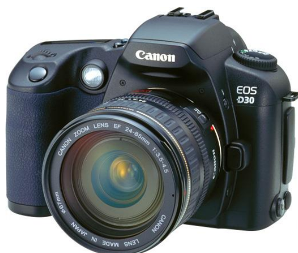
Slika 13. EOS D30.