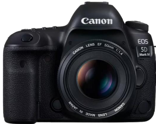
Slika 19. EOS 5D Mark IV.

Rujan 2016. konačno je donio ono što su DSLR videografi priželjkivali godinama - Canonov DSLR s mogućnošću 4k videa. Stigao je u obliku 5D Mark IV (Slika 19).