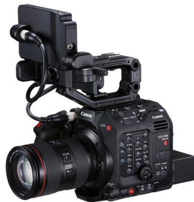
Slika 16. Canon EOS Cinema C300 mk III.

Godine 2011. nastaje EOS Cinema sustav s EOS C300 i uvođenjem Canonovih filmskih leća (Slika 16). Ova je serija ažurirana 4k kamerama 2012. U lipnju 2012. Canon je opet postao hit predstavljanjem svog kompaktnog APS-C EOS-M 'bez ogledala', iako nije bio osobito ozbiljan konkurent na takvom tržištu. U rujnu 2012. predstavljen je Rebel T4i s prvim zaslonom osjetljivim na dodir na DSLR-u.