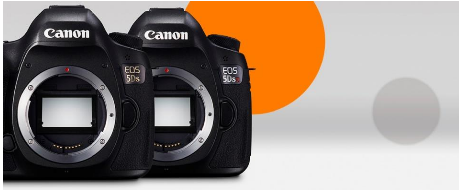
Slika 17. EOS 5DS.

U lipnju 2015. Canon predstavlja dva modela, EOS 5DS i EOS 5DS R (Slika 17) i (Slika 18), od kojih oba imaju broj piksela od 50 megapiksela, zajedno s približno 50,6 milijuna piksela 35 mm full-frame CMOS senzorem i Dual DIGIC 6 slikom procesora koji omogućuju kontinuirano snimanje do približno 5,0 sličica u sekundi, kao i maksimalni standardni ISO od 6400.