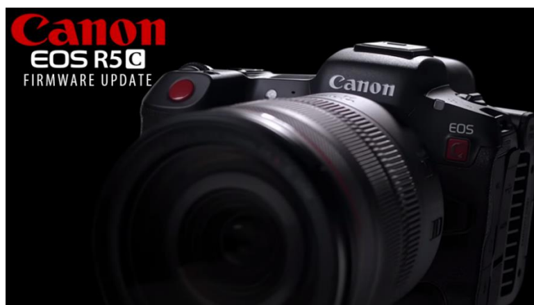
Slika 24. Canon R5.

Do srpnja 2020. Canon je pripremio tržište s najavom za Canon R5 (Slika 23) i (Slika 24), Canonov najambiciozniji fotografski aparat do sada. S 44,8 megapiksela i mogućnošću snimanja 8K neobrađenih videozapisa do 30 sličica u sekundi, Canon R5 je vrlo napredan uređaj [22].