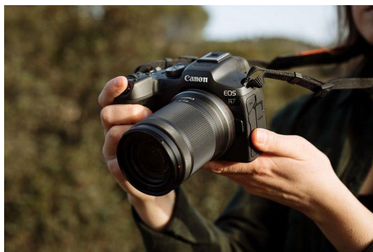
Slika 28. EOS R3.

Canon EOS R7 je najnoviji uređaj ove kompanije. Nudeći brzinu koja odgovara Canon EOS R3 (Slika 28), i razlučivost koja je jednaka, ako ne i bolja od Canon EOS R5, Canon EOS R7 je tehničko čudo. Po uzoru na Canon EOS 90D i Canon EOS 7D Mark II, snimatelji će iskoristiti njegov crop faktor od 1,6x za povećanje efektivne žarišne duljine objektiva punog kadra. Kao takav, ovo bi mogao postati najbolji fotografski aparata za fotografiranje prirode, životinja, ljudi u pokretu (idealno za sportske događaje) zahvaljujući svojoj jedinstvenoj kombinaciji rezolucije, crop faktora i čiste brzine [9].