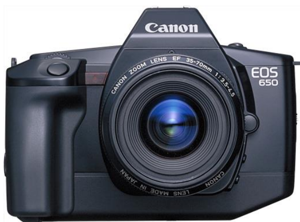
Slika 11. EOS 650.

U ožujku 1987., u poveznici s njihovom 50. obljetnicom, Canon je debitirao sa svojom linijom EOS (Electro-Optical System) u obliku EOS 650 (Slika 11), SLR fotografski aparat s autofokusom koji je dizajniran da konkurira Minolta A-9000 i Nikon F-501 izdanim u 1985. odnosno 1986. godine. Prethodno su proizveli SLR s autofokusom 1985. godine u obliku T80, ali njegova izvedba nije uspjela parirati konkurentima, a proizvodnja je trajala samo nešto više od godinu dana. EOS 650 uključuje mikroprocesor, motor super visoke preciznosti (koji je ultrazvučni) i visokoosjetljivi senzor pohranjene slike u bazi. Kao i kod F-1 i novog F-1 (Slika 10), njegove visokokvalitetne performanse učinile su ga popularnim među profesionalnim fotografima, posebno onima koji snimaju sportove uživo [21].