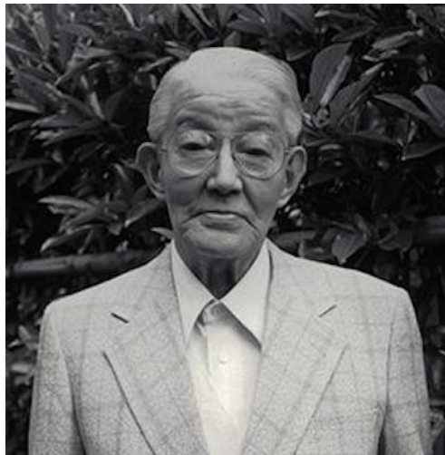
Slika 1. Goro Yoshida, kreator Canona.

Canon Inc. najveći je svjetski proizvođač fotografski aparata s poviješću dugom preko 80 godina, tijekom kojih su napravili neke od najvažnijih inovacija u fotografskoj i video tehnologiji. Njihovi su počeci, međutim, bili skromni: mala ulična radionica u Tokiju gdje je čovjek po imenu Goro Yoshida popravljao fotografske aparate i projektore (Slika 1).