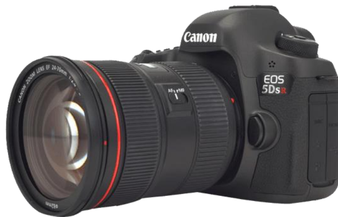
Slika 18. EOS 5DS R.