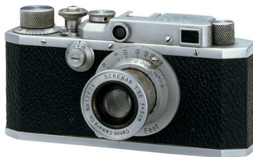
Slika 6. The Canon SII.

10. kolovoza 1937. službeni je datum osnivanja Canona, a Takeshi Mitarai, prvi predsjednik, započeo je s ambicioznom misijom da se prestigne Leica. Drugi svjetski rat će zaustaviti velik dio japanske proizvodnje.