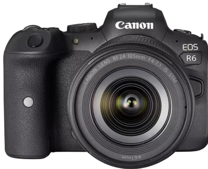
Slika 25. Canon EOS R6.

Osim izgradnje svojih vodećih fotografskih aparata s više opcija, Canon je također nastavio svoj trend nevjerojatno brzog razvoja objektivna za platformu RF objektivna u 2020. – izdao je 7 novih objektivna. Ti objektivna, Canon RF 24-105 mm f/4-7.1 IS, Canon 100-500 mm f/4.5-7.1L IS, Canon RF 600 mm f/11 IS, Canon RF 800 mm f/11 IS, Canon RF 85 f/2 Macro IS, Canon RF 50 mm f/1.8 i Canon RF 70-200 mm f/4L IS nisu privukli mnogo pozornosti, jer su se usredotočili na ponudu jeftinijih opcija za fotografe [26].