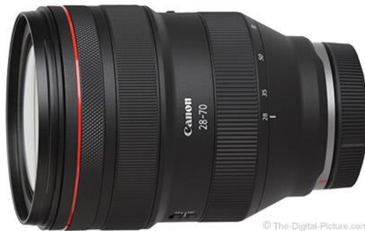
Slika 21. Canon RF 28-70mm f/2L objektiv.

Četiri objektiva za lansiranje zaokružio je Canon RF 28-70mm f/2L (Slika 21). To je moderan način redizajna klasika industrije. Ovaj golemi objektiv dočekan je s puno pohvala i uzbuđenja u vezi s time što Canon može učiniti s ažuriranim nastavkom za objektiv, dajući mu točku u odnosu na standardne objektivne od 24-70 mm pri f/2,8 [15].