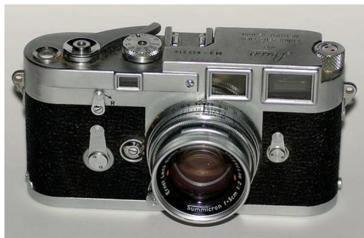
Slika 8. Leica M3.

Objavljivanje M3 označilo je ključan trenutak u povijesti proizvodnje fotografski aparata i zapravo u povijesti fotografije općenito. Umjesto da pokušaju razviti izravnog konkurenta modelu M3, Canon, Nikon i neki drugi japanski proizvođači fotografski aparata usmjerili su pozornost na razvoj refleksnih (engl. single-lens reflex, SLR) fotografskih aparata s jednom lećom. SLR fotografski aparati postojali su u nekom obliku od kasnog devetnaestog stoljeća i obično su kombinirali zrcalo i sustav prizme, dajući fotografu točniju sliku od fotografskog aparata s daljinomjerom. Međutim, sve do tada, obično su bili teški i komplicirani za korištenje, što je znatno kočilo njihovu popularnost [12].