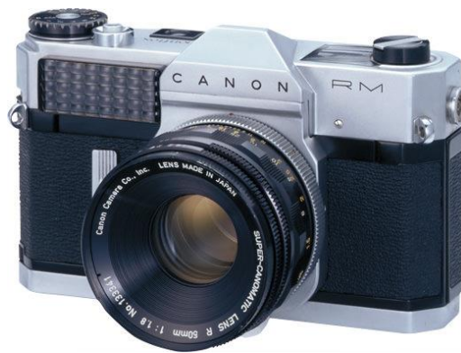
Slika 9. Canonflex iz 1959. g.

U svibnju 1959. Canon je izbacio Canonflex (Slika 9), 35 mm SLR, koji je sadržavao brojne jedinstvene značajke, npr. polugu na navijanje koja je pomagala pri brzom okidanju. Njegova proizvodnja trajala je samo godinu dana kada je nastao Canonflex R2000, ali zajedno s nizom drugih japanskih fotografski aparata koji su pušteni u prodaju otprilike u isto vrijeme, uključujući kulturni Nikon F, odigrao značajnu ulogu u dominaciji SLR fotografski aparata u sljedećih 50 godina [25].