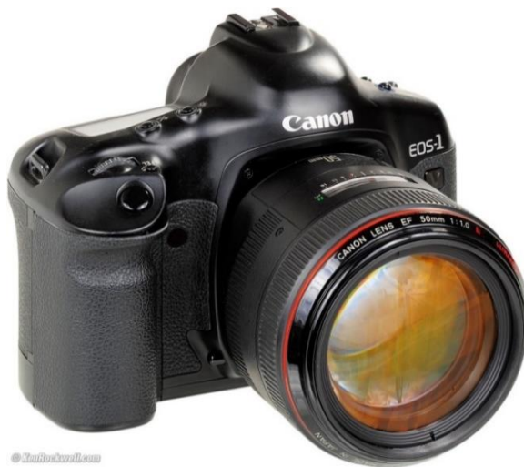
Slika 12. EOS-1V.

Tijekom 90-ih i ranih 2000-ih došlo je do velikog napretka u tehnologiji digitalnih fotografskih aparata i video kamera, a u skladu s ovime je Canon nastavio razvijati oba formata. U ljeto 2000. Canon je predstavio EOS D30, njihov prvi DSLR koji je u potpunosti dizajniran i napravljen isključivo u Canonu. Iako su prethodno izdali dva DSLR-a, kasnih 1990-ih, Canon EOS D2000 i EOS D6000, sastavljeni su od dijelova Canonovih fotografski aparata s Kodakovim digitalnim komponentama, kao dio dogovora između dviju kompanija. Do tada SLR fotografski aparati koristili su gotovo isključivo profesionalni fotografi, uglavnom zbog njihove veće cijene, a digitalni SLR fotografski aparati su obično bili veliki i nezgrapni [7]. EOS D30 (Slika 13), osim što je najmanji i najlakši DSLR na tržištu, bio je jednostavan za korištenje, posjedujući značajke kao što su potpuno automatski način rada, značajka evaluativnog mjerenja u 35 zona i ugrađena E-TTL automatska bljeskalica, što olakšava snimanje prirodnih i jasnih slika, bez obzira na uvjete [8].