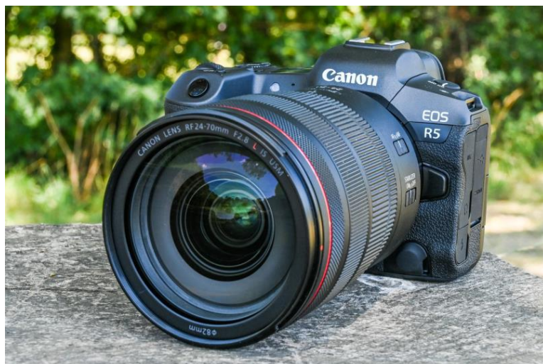
Slika 23. Canon EOS R5.

Do srpnja 2020. Canon je pripremio tržište s najavom za Canon R5 (Slika 23) i (Slika 24), Canonov najambiciozniji fotografski aparat do sada. S 44,8 megapiksela i mogućnošću snimanja 8K neobrađenih videozapisa do 30 sličica u sekundi, Canon R5 je vrlo napredan uređaj [22].