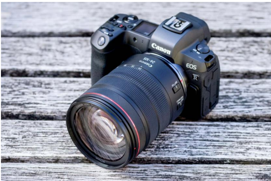
Slika 20. Canon EOS R.

Krajem listopada 2018. Canon EOS R je debitirao s četiri dostupna objektiva i tri EF/EF-S adaptera dostupna pri lansiranju (Slika 20). Fotografski aparat je odmah dočekan s određenim skepticizmom, ponajviše zbog promjene na novi bajonet za objektiv nakon što je Canon desetljećima dominirao cijelom industrijom sa svojim EF bajonetom. Ipak je bio izvrstan uvod u tržište bez zrcala, budući da platforma Canon EF-M nije nailazila na dobar prijem, a kupci su uglavnom bili uzbuđeni zbog budućnosti koju Canon gradi sa svojom platformom. Ovaj full-frame sustav bez ogledala od 30 megapiksela mnogi su smatrali Canon 5D Mark IV, u obliku bez zrcala, s nekoliko nadogradnji sustava fokusa i procesora [1].