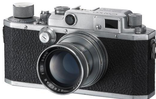
Slika 7. The Canon IIB. global.canon