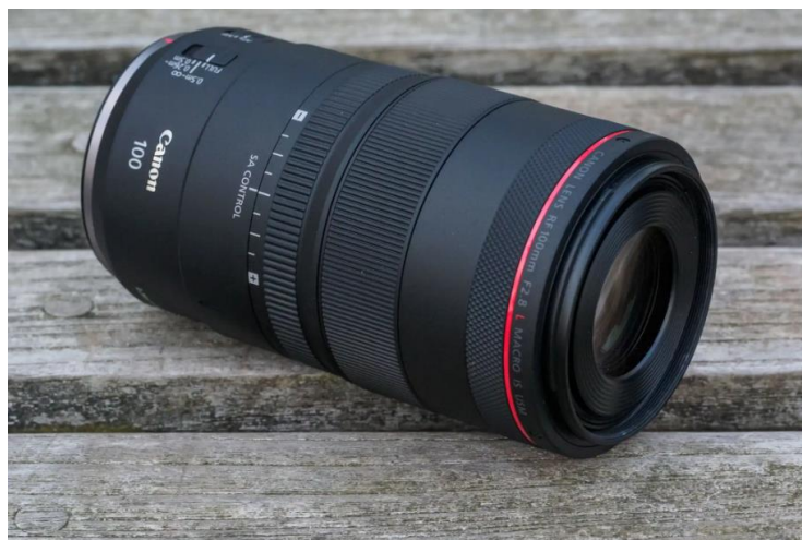
Slika 27. Canon RF 100mm f/2.8L Macro IS.