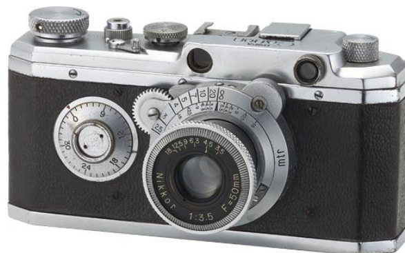
Slika 5. Hansa Canon.

Kwanon je bio samo prototip, ali njegov nasljednik Hansa Canon pušten je u prodaju u veljači 1936. godine, iako postoje neki sporovi oko ovog datuma jer neki tvrde da je zapravo pušten u promet krajem 1935. g. Prvi visokokvalitetni fotografski aparat s daljinomjerom od 35 mm dizajniran i proizveden u Japanu, Hansa Canon (Slika 5), temeljila se na Kwanonu, a prodavala ju je ekskluzivno Omiya Shashin Yohin Co. Ltd. iz Tokija, trgovina fotografskim aparatima i priborom Omiya. Hansa je bila zaštitni znak trgovine [11].