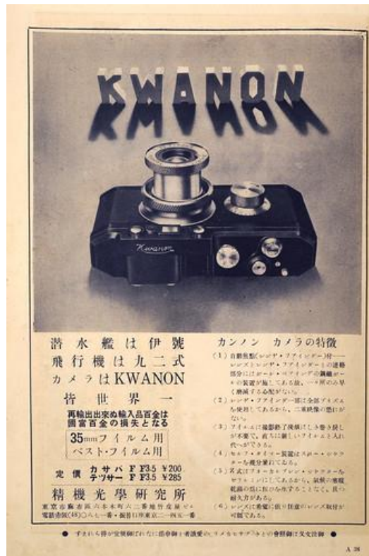
Slika 4. Reklama za Kwanon 1934. g.

Kwanon je bio samo prototip, ali njegov nasljednik Hansa Canon pušten je u prodaju u veljači 1936. godine, iako postoje neki sporovi oko ovog datuma jer neki tvrde da je zapravo pušten u promet krajem 1935. g. Prvi visokokvalitetni fotografski aparat s daljinomjerom od 35 mm dizajniran i proizveden u Japanu, Hansa Canon (Slika 5), temeljila se na Kwanonu, a prodavala ju je ekskluzivno Omiya Shashin Yohin Co. Ltd. iz Tokija, trgovina fotografskim aparatima i priborom Omiya. Hansa je bila zaštitni znak trgovine [11].