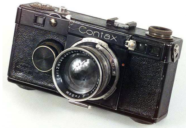
Slika 2. Contax Model 1.