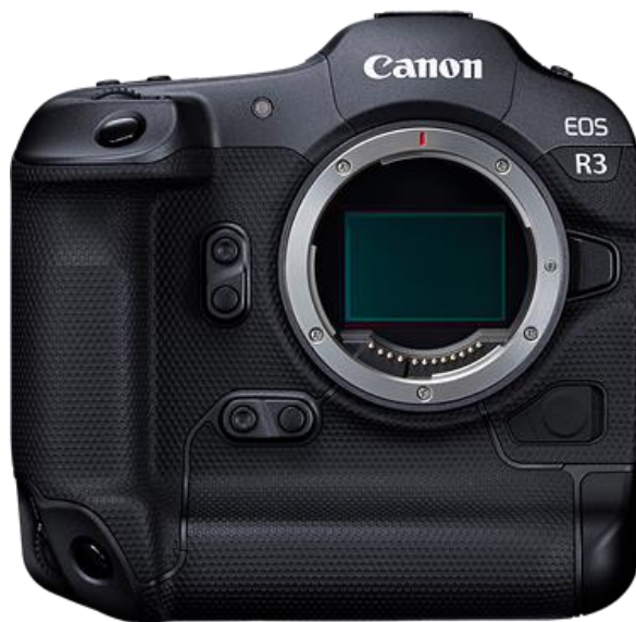
Slika 26. Canon EOS R3.

Canon R3 je izašao na tržište u 2021. Godini i je više nalik njihovim EOS 1DX platformama (Slika 26), nudeći bolju otpornost na vremenske uvjete i robusnije tijelo usmjereno na sportske i akcijske fotografe i videografe. Ostajući pri tom trendu, Canon R3 je veoma brz, dopuštajući snimanje od 30 fps na svom senzoru od 24,1 megapiksela, s mogućnošću proširivanja ISO-a od 204-800. Također pruža najsuvremeniji sustav autofokusa, koji koristi tehnologiju ‘dubokog učenja’ za detekciju oka i tijela. S 6K 60p RAW video funkcionalnošću, R3 postaje Canonov najbolji uređaj [18].