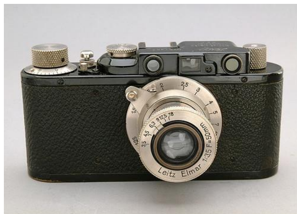
Slika 3. Leica Model II.

U želji da otkrije tajne njezinog unutarnjeg funkcioniranja, Yoshida je rastavio Leicu i bio potpuno iznenađen koliko su materijali jeftini i jednostavni, a uređaj tako skup. Njegovo ga je otkriće nadahnulo da dalje istražuje te je 1933. godine, zajedno sa svojim šogorom, Saburom Uchidom (1899 - 1982) i sa Takeom Maedom (1909 - 1977), osnovao Laboratorij za precizne optičke instrumente, čija je svrha bila provesti daljnja istraživanja mehanike fotografskih aparata. Godinu dana kasnije, rezultat njihovog istraživanja očitovao se u obliku prvog japanskog fotografskog aparata sa zatvaračem od 35 mm u žarišnoj ravnini, The Kwanon, nazvan po budističkoj božici milosrđa [16] (Slika 4).