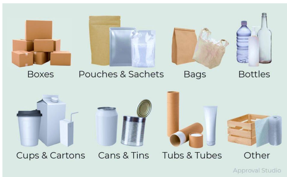
Slika 1: različiti oblici ambalaže

Ambalaža je materijal kojim se roba omotava ili unutar kojeg se roba smješta da bi se ona ili okoliš zaštitili, da bi se sigurno transportirala, skladištila i da bi se lako i bez opasnosti njome rukovalo.