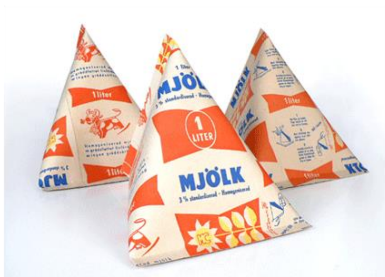
Slika 2: tetraedarski karton mlijeka

Piva i tekućine u limenci i šlag u spreju samo su neki primjeri početaka pakiranja hrane u ambalažu. Plastične boce su predstavljene 1956. kada je i Tetra Pak lansirao svoj tetraedarski karton mlijeka izrađenog od kartona obloženog polietilenom niske gustoće.