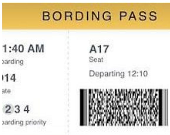
Slika 6: ukrajna avionska karta sa PDF417 bar-kodom

Dvodimenzionalni bar-kod PDF417 koristi vlada i logistika, pa ćemo ovaj primjer 2D koda vidjeti na vozačkim dozvolama ili primjerice na ukrajnim kartama. Može pohraniti ogromne količine podataka kao što su fotografije, otisci prstiju i potpise pa su time jedni od najmoćnijih bar-kodova sa mogućom pohranom od čak 1,1 kilobajta čitljivih podataka [15].