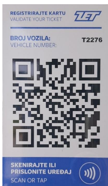
Slika 5: QR kod za registraciju ZET karte

2D crtični kodovi mogu pohraniti dodatne informacije, uključujući količinu slike i URL web stranice. Najčešći i najupotrebljavaniji 2D kod je QR (Quick response) kod koji ima mogućnost usmjeriti korisnika na određenu web stranicu putem kamere na mobitelu. Putem QR koda može se pristupiti Wi-Fi mreži, a koriste ga na primjer kafići i restorani za beskontaktni pristup meniju i tvrtke kako bi omogućile beskontaktno plaćanje.