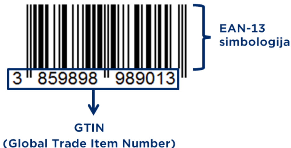
Slika 4: EAN-13 bar-kod

Struktura EAN koda sastoji se od grupe brojeva koji sadrže podatak o zemlji porijekla, proizvođaču i samom proizvodu. U standardnom EAN 13 kodu uz dvanaest znamenki, trinaesta znamenka je kontrolna znamenka. Svaki EAN bar-kod sastoji se od graničnih linija na lijevoj i desnoj strani od samog bar-koda, te obaveznih tihih zona (bijeli prostor sa svake strane) [14].