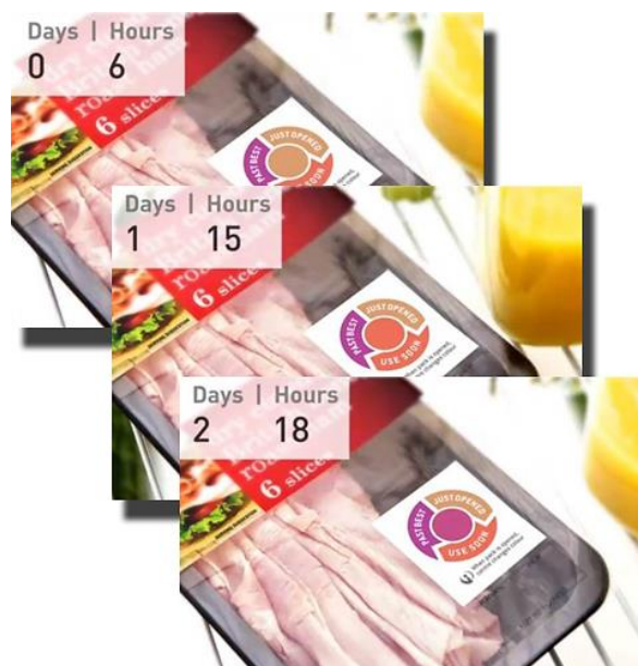
Slika 7: naljepnica s promjenom boje kao indikator svježine

Kada su svježi prehrambeni proizvodi pakirani, njihovi metaboliti se stalno mijenjaju zbog unutarnjih kemijskih promjena, bioloških aktivnosti i drugih čimbenika. Indikator svježine prenosi informacije o kvaliteti potrošačima i distributerima otkrivanjem ovih metabolita ili vidljivim promjenama boje s metabolitima. Metaboliti kao što su glukoza, organske kiseline, etanol, biološki amini, ugljikov dioksid i sulfidi obično se koriste za procjenu svježine hrane, zbog čega se indikatori svježine pretežno koriste za svježiju hranu, uključujući voće i plodove mora.