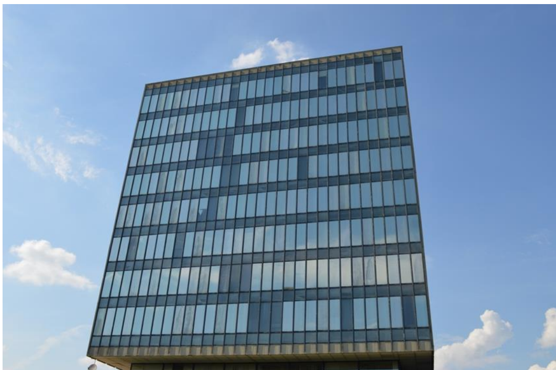
slika 26: Zgrada ministarstva snimana sa stražnje strane