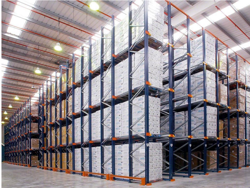
Slika 3. – Sustav regala s prolazom unutar skladišnog prostora