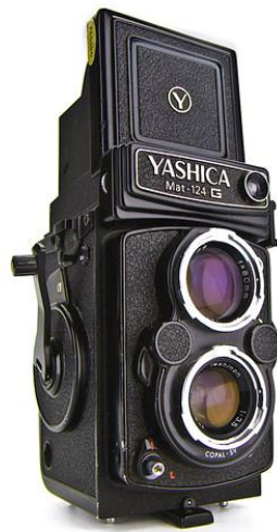
Slika 1: Dvoooki zrcalni fotoaparat

Fotoaparat se sastoji od tijela i objektiv, a definiraju ga razne karakteristike kojima taj aparat postaje odgovarajući ili neodgovarajući za određene vrste fotografiranja. U ovom radu korišten je dvoooki zrcalni fotoaparat (slika 1). To je aparat srednjeg formata koji ima dva objektiv smještena jedan iznad drugog koji imaju istu žarišnu duljinu. Svrha gornjeg objektiv je da sliku vodi u tražilo, a donji objektiv sliku vodi na film. Objektivi se nalaze na istoj optičkoj osi, a kako bi slika u tražilu bila svjetlija, gornji objektiv je svjetlosno jači što omogućava preciznije izoštravanje. U trenutku snimanja moguće je na ovakvoj vrsti fotoaparata vidjeti scenu zbog odvojenih leća što može biti korisno na primjer kod fotografiranja pri dužoj brzini zatvarača. Ovakvi fotoaparati su teški, objektiv im je fiksiran, tj. ne može se mijenjati, a film koji se koristi kod ovakvih fotoaparata je 120mm [1, 2].