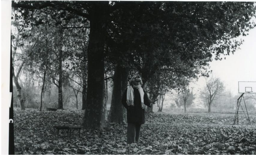
Slika 25 : Dorotea_filter3_IIFord

Slike 24 i 25 dobivene su razvijanjem pod filterom 3 na IIFord papiru. Fotografije dobivene s ovim filterom imaju veliki kontrast i gustoću zacrnljenja pa na nekim mjestima može doći do gubitka detalja. Na fotografiji 24 sa ovim filterom je postignut odličan kontrast kojim je oko došlo do lijepog izražaja, lišće u pozadini se lijepo vidi, a ten izgleda prirodno. Na slici 25 ovim filterom je također postignut dobar kontrast, što je vidljivo na lišću, međutim mjesta koja su u sjeni ovim se filterom na njima skroz izgubili detalji.