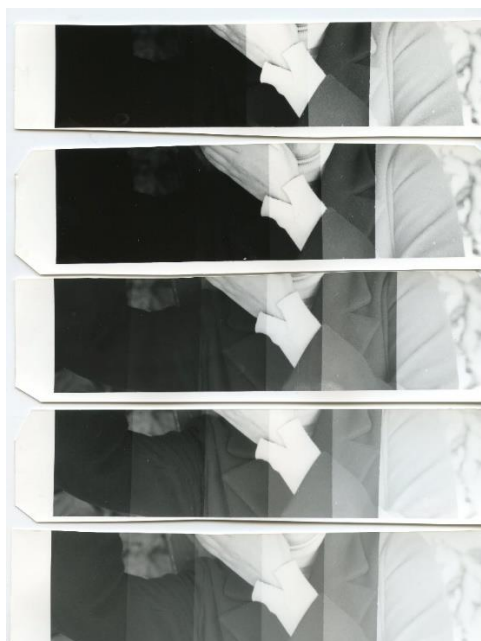
Slika 9: Probni klin motiva pejzaž na Ilford papiru