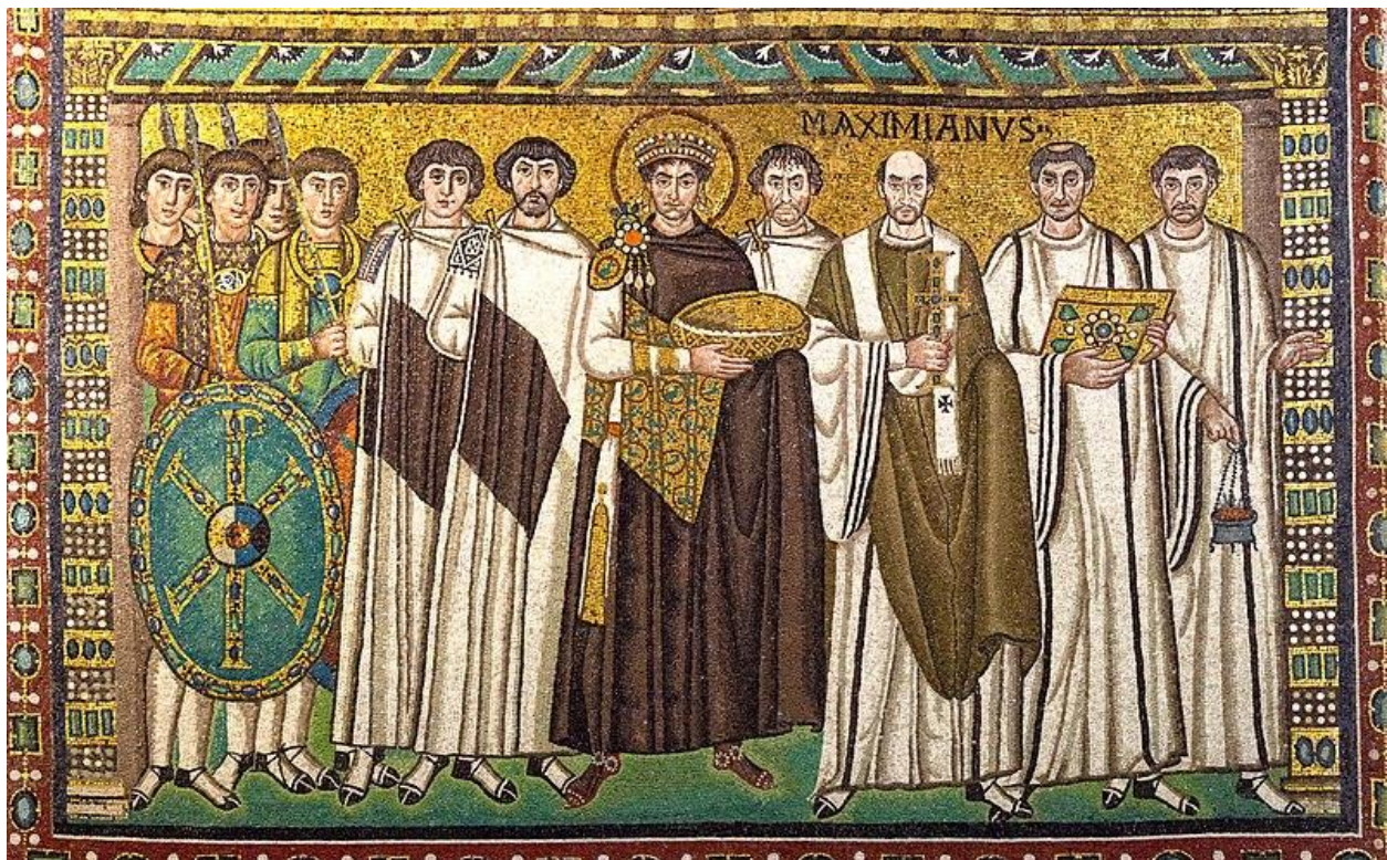
Slika 1. Bazilika, Car Iustinianus i njegova pratnja

Nije se samo razvijalo pismo, nego i umjetnost. Novije, ali još uvijek drevne nacije izrađivale su ilustracije, kao što su skupine ljudi koje gledaju krunidbu ili serije crteža koji pričaju priču. U različitim periodima i na različitim područjima nastao je pregršt stilova pomoću kojih se može prepoznati od kud je neki drevni crtež došao.