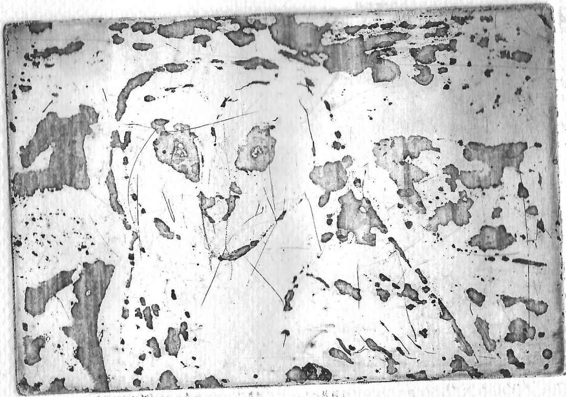
Slika 8. Kristina Čop, „Kukuvija drijemavica“

Kod rezervaža postiže se teksturirani izgled motiva koji se vrlo jasno vidi na otisku. Tekućina koja se koristi mješavina je vode, šećera i cinkovog bjelila, te se preko nje premazuje zaštitni lak nakon što se u potpunosti osuši. Ploča se onda stavlja u toplu vodu kako bi se osušeni rezervaž otopio, za što može trebati vremena. Proces otapanja može se pospješiti laganim prijelazom krpom prego ploče. Kada se rezervaž otopi, ploča se onda može odjetkati na određeno vrijeme te odvesti u tisak.