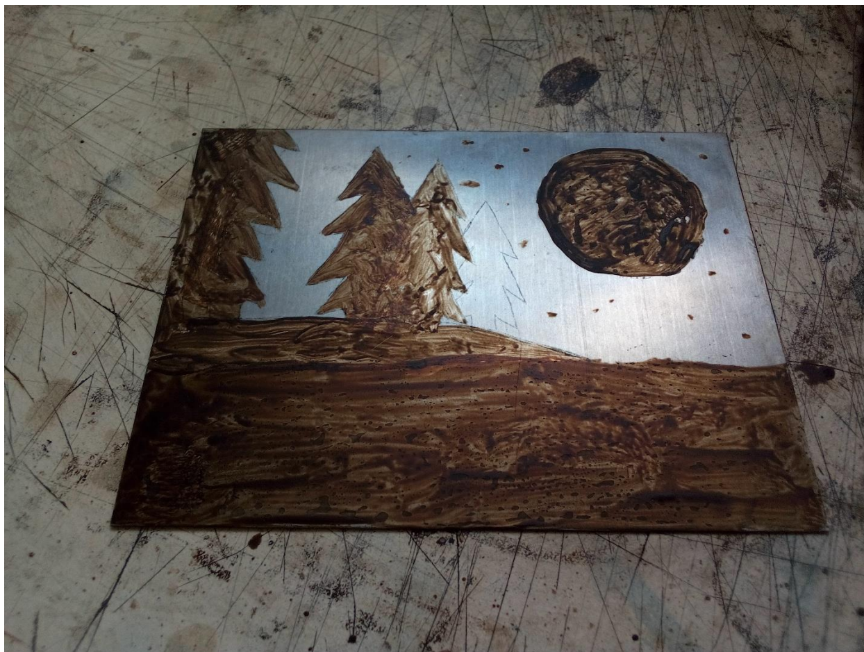
Slika 9. Ploča u procesu izrade akvatinte

Kada se odjetka i posljednji ton, potrebno je ukloniti sav lak s ploče. To se postiže primjenom petroleja na ploču, koji otapa lak i omogućuje lako ukljanjanje. Ploča se briše krpom kako bi bila što čišća.