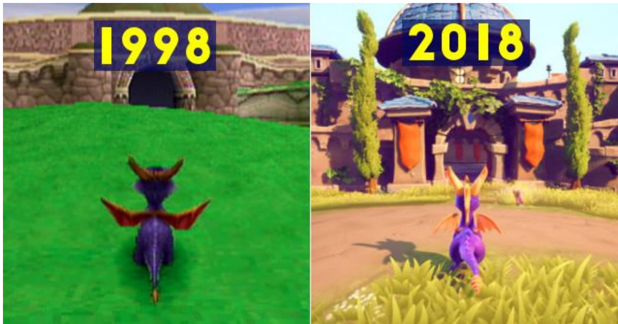
Slika 2. Usporedba grafike od igre iz 1998. godine koja je prerađena 10 godina kasnije

U novijim vremenima, osim tiskanih knjiga, pojavili su se i novi mediji. Svijet je doživio izum fotografije, pojavili su se televizija i računalo, i grafika se više nije samo nalazila otisnutom na papirima. Danas, grafika se može naći na mnogim mjestima; na proizvodima, u prolazu kao plakat, na računalnom ekranu... Iz dana u dan, osim pojava novih tehnika za izradu grafike, razvija se i sama grafika, mjenjajući svoj izgled.