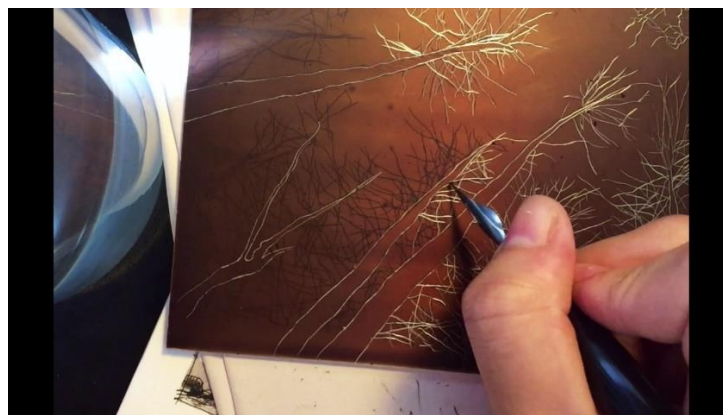
Slika 5. London umjetnički studio, urezivanje motiva iglom za bakropis