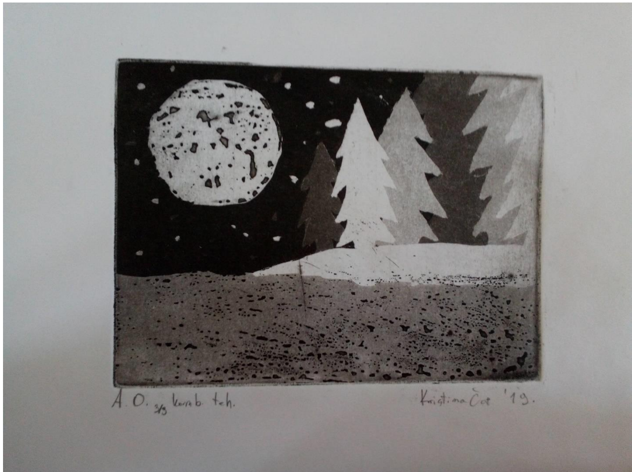
Slika 10. Konačni otisak

Rezultat praktičnog dijela je otisak rađen kombiniranom tehnikom. Na ovome radu razaznaju se obje tehnike i međusobno su komplementarne; akvatinta je zadala jasne tonove i oblike koje je teško dobiti samo s rezervažom, a rezervaž je dao teksturu vodi i mjesecu koju je skoro nemoguće prikazati samo s akvatintom. Po kvaliteti otiska vidi se vrlo uspješno zapečenje asfaltnog praha. Jedina očita mana jest vrlo vidljiva linija u sredini otiska koja je nastala od ogrebotine u samoj ploči.