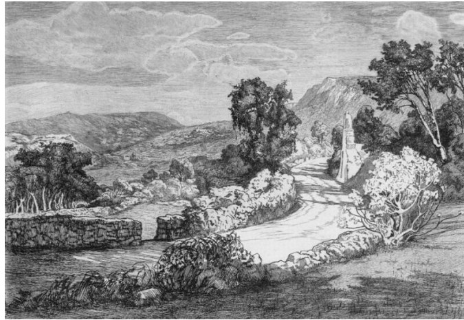
Slika 4. Crnčić Menci Clement, „Ogulinska cesta“

papirom te se onda ucrtava iglom za bakropis koja lagano uklanja zaštitni lak gdje se povuče. Kada je motiv gotov, ploča se stavlja u razrijeđenu nitratnu kiselinu koja je dovoljno jaka da odjetka ploču, i isto tako nedovoljno jaka da izazove ozljede tako da se privremeno može uroniti ruka kada se stavlja ili vadi ploča (uronjena ruka mora se isprati vodom). Ploča onda mora stajati u kiselini nekoliko minuta, ovisno o željenom tonu bakropisa, te se vadi i odmah ispiru vodom. S ploče se zatim uklanja zaštitni lok pomoću petroleja, koji ga vraća u tekuće stanje.