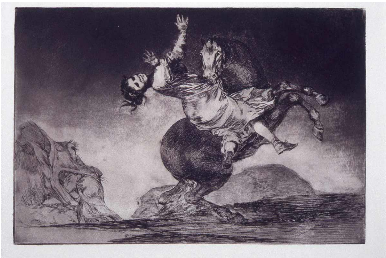
Slika 6. Francisco de Goya, „El caballo raptor“

Akvatinta je tehnika tiska koja se postiže postepenim jetkanjem ploče. Svojim izgledom podsjeća na sliku rađenu vodenim bojama ili razrijeđenim tušem, predstavljajući razne nijanse boje. Nije mehanička tehnika kao suha igla i bakropis gdje se motiv urezuje, nego se umjesto toga nanosi zaštitni lak na određenim elementima motiva, ali je zato slična bakropisu budući da se isto jetka i koristi se lakom da bi se spriječilo jetkanje slobodnih površina. Nakon svakog nanosa ploča se jetka u razrijeđenoj kiselini na određeno vrijeme, te se opet nanosi zaštitni lak na nezaštićene elemente prije još jednog jetkanja. Ovaj se proces ponavlja više puta sve dok se ne odjetkaju sve željene nijanse, a počinje sa zaštitom elemenata koji će biti neobojeni sve do jetkanja nezaštićenih elemenata koji će biti najtamnije nijanse na motivu.