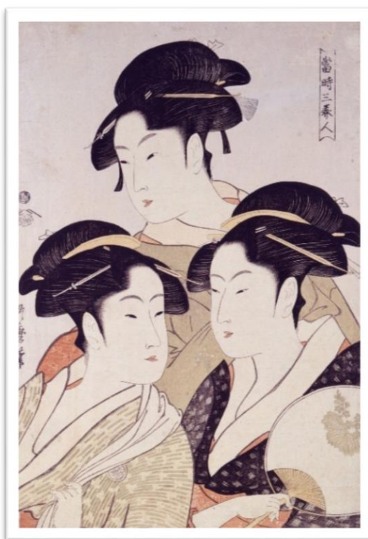
Slika 7 "Three Beauties of the Present Day" ; autor: Utamaro; godina 1793.;

dimenzije: 38,7 x 26,2 cm; drvorez u boji