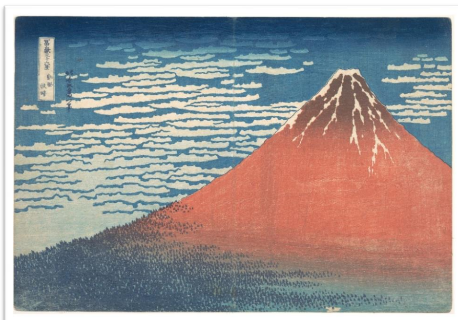
Slika 9 "South Wind, Clear Sky", poznat kao "Red Fuji"; autor: Hokusai; godina: 1830.-1833.; dimenzije: 25,4 x 37,8 cm; drvorez u boji; iz serije „Trideset i šest pogleda na planinu Fuji“