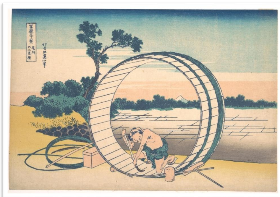
Slika 10 "Fujimigahara in Owari Province"; autor: Hokusai; godina: 1830.-1832.; dimenzije: 25,4 x 38,1 cm; drvorez u boji; iz serije „Trideset i šest pogleda na planinu Fuji“