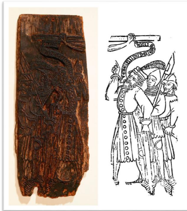
Slika 1 „Bois Protat“, drvorez (ploča i otisak); zastavica koja izvire uz usta centuriona glasi „Vere filius Dei erat iste“ („Ovo je stvarno bio sin Božji“)

stvoreni su prvi drvorezi u boji, tehnika koju će uskoro usvojiti umjetnici poput Luka Kranacha i Hans Burkmera. Ova tehnika, nazvana chiaroscuro (svijetlo-tamno), sastoji se od ispisa nekoliko prolazaka iste boje u različitim tonovima, počevši od najlakših. Tipičan predstavnik ove tehnike je Hugo Da Carpi. Europski majstori drvoreza su svojim djelima davali oznaku brutalnosti dok je drvorez japanskih umjetnika bio oličenje profinjenosti i sofisticiranosti. Upravo zbog tih kvaliteta je europski drvorez bliži crtežu dok je japanski bliži slici.