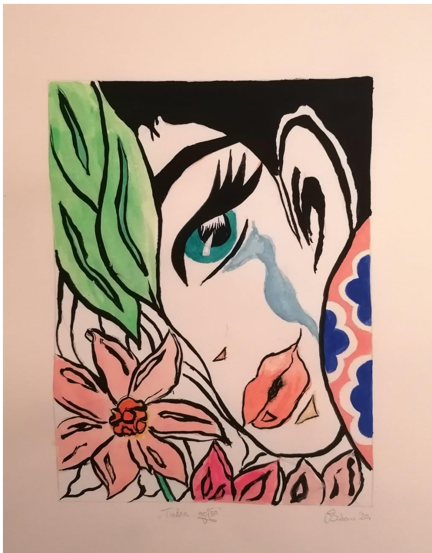
Slika 13 "Tužna gejša" 2020.