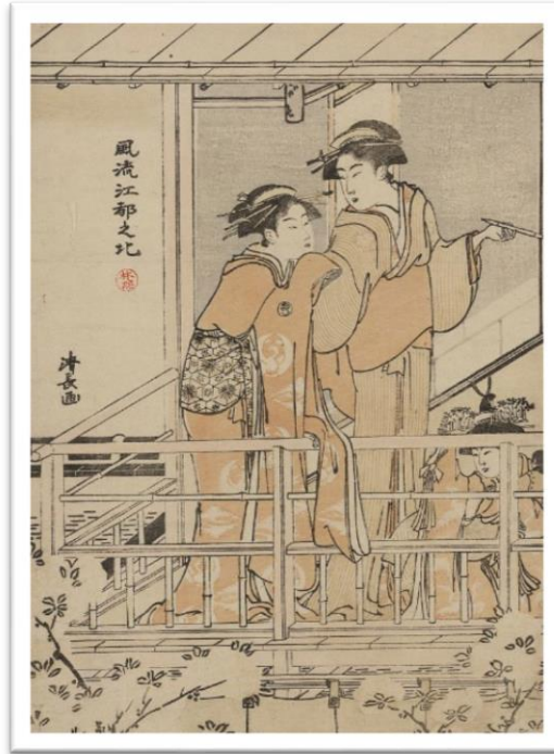
Slika 5 "Viewing Cherry Blossoms; autor: Torii Kiyonaga;

raspoloženjima koja su prenosili. Tajanstveni umjetnik aktivan pod imenom Tōshūsai Sharaku stvorio je zapanjujuće glumačke slike od 1794. do 1795., ali o njemu se malo toga zna.