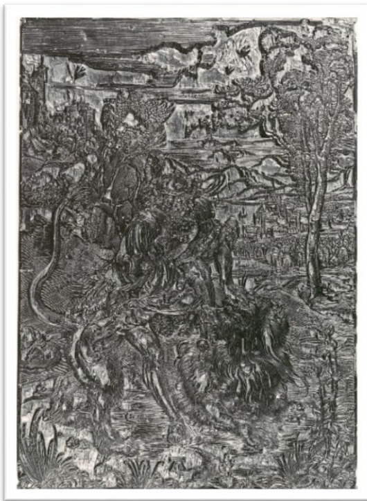
Slika 2 „Samson razbija lava“ ; Albrecht Dürer; 1497.-1498. godina; drveni blok

U 19. stoljeću u Parizu su japanski drvorezbari postali nadahnuće mnogim suvremenim umjetnicima koji su inspirirani japanskim otiscima postignutim drvoreznom tehnikom u svoja djela ugradili taj Ukiyo-e koncept. Iako je drvorez u Japanu bio sve manje popularan tada, dosta snažno je sve i dalje utjecao na europsku avantgardu. Umjetnici kao što su bili Paul Gauguin, Van Gogh, Henri de Toulouse-Lautrec, James Whistler, Édouard Manet, Camille Pissarro su prihvatili utjecaj asimetrične kompozicije, snažnog crtanja i stiliziranih oblika japanskih umjetnika, isto kao i ravnih površina boje, uzoraka i crta kao sastavnih dijelova kompozicije. Utjecaj se osjetio ne samo na njihovim slikama nego također i u grafičkim radovima tih umjetnika. Najistaknutiji predstavnici novog uspona drvoreza su svakako Paul Gauguin i Edvard Munch. Njemački ekspresionisti i grupa Most (Die Brücke) odgovorni su za daljnji razvoj i uspon drvoreza. Ovi su se umjetnici okrenuli jednostavnosti i izražajnosti ove tehnike stvorene u srednjem vijeku i pronašli su u njoj sredstvo snažne izraženosti. Erich Haeckel, Karl Schmidt Rothluff, Ernst Ludwig Kirchner, Emil Nolde, Otto Miller članovi su ove skupine koji su se okušali