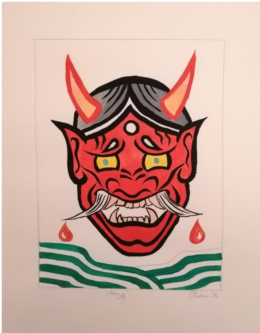
Slika 14 "Hannya", 2020.