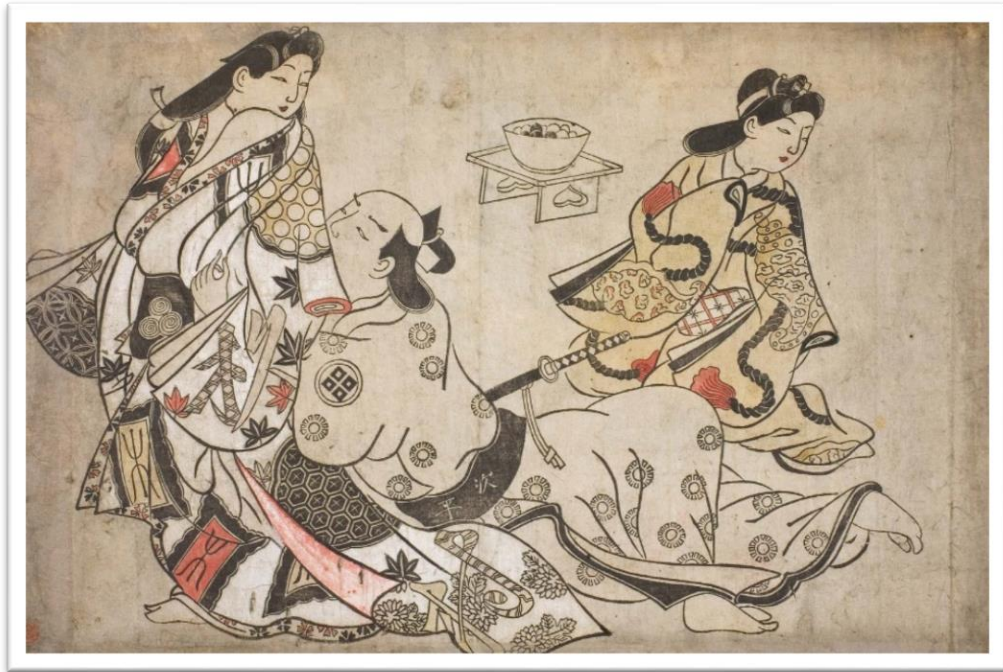
Slika 4 „The Insistent Lover“; autor Sugimura Jihei; 1680. godina;

pretpostavkom da će razina potrošnje nadmašiti troškove proizvodnje. Nisu svi otisci proizvedeni suptilno i pažljivo kao Harunobuovi, ali zaokret prema cjelovitim obojanim otiscima bilo koje kvalitete bilo je nepovratan.