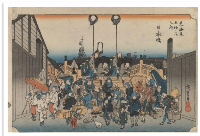
Slika 12 "Japan Bridge"; autor: Hiroshige; godina: 1833.-1834.; drvorez u boji;

dimenzije: 33,3 x 22,5 cm; drvorez u boji