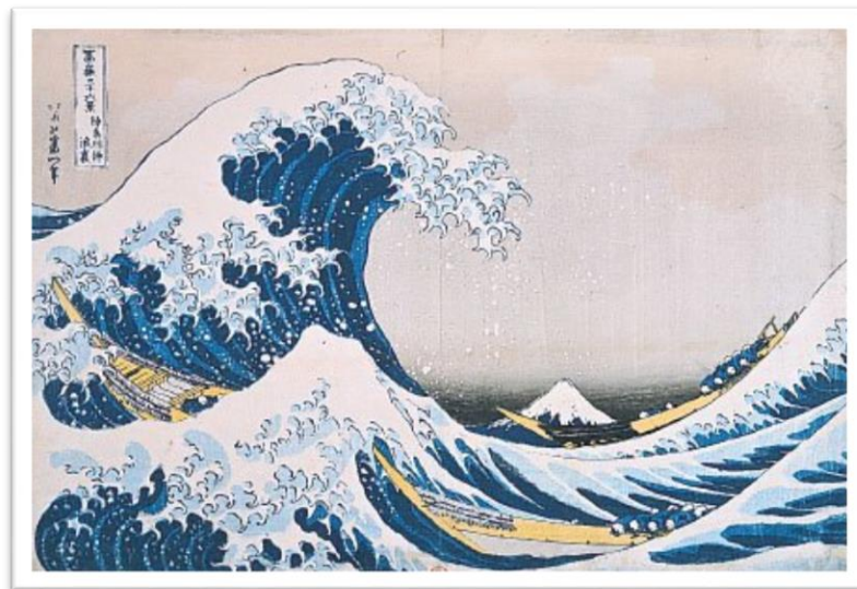
Slika 8 "The Great Wave", autor: Hokusai; godina 1829.-1833.; dimenzije: 25.7 × 37.8 cm;

drvorez u boji; iz serije „Trideset i šest pogleda na planinu Fuji“