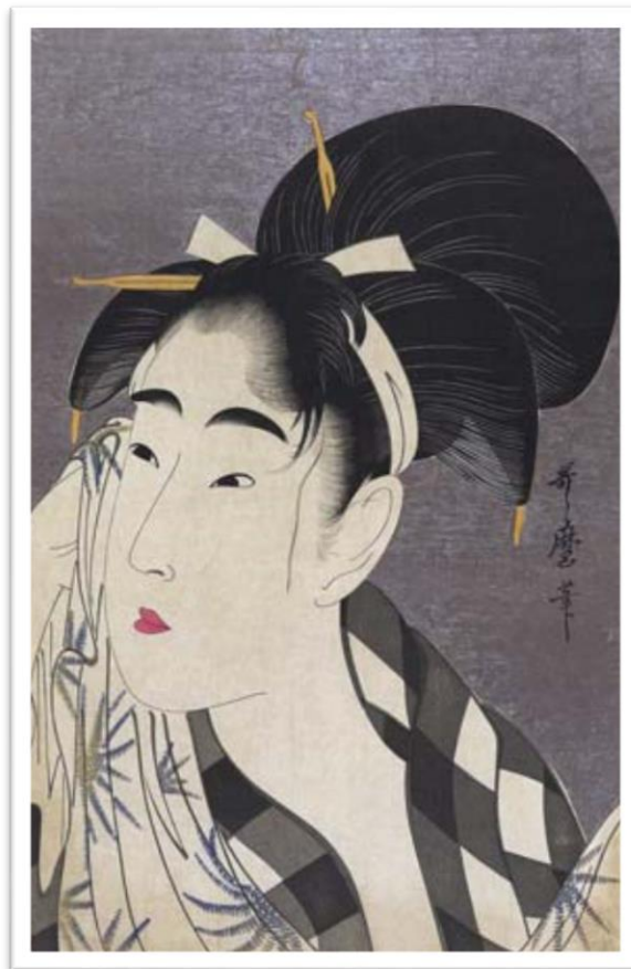
Slika 6 "Woman wiping sweat", autor: Utamaro; godina 1798.; drvorez u boji

ilustrirane knjige od kojih je najpoznatija „Gahon chūsen“ (1788. „Insects“). Oko 1791. godine Utamaro je odustao od dizajniranja otisaka za knjige i koncentrirao se na izradu pojedinih portreta žena za razliku od ostalih umjetnika tog pokreta koji su radili otiske žena u skupinama. 1804. godine na vrhuncu svog uspjeha je napravio grafike koje su prikazivale suprugu vojnog vladara Toyotomi Hideyoshija i njegove konkubine (ljubavnice ljudi iz visokih aristokratskih krugova ili vladara). Slijedom toga je optužen za vrijeđanje Hideyoshijevog dostojanstva i naređeno mu je stavljanje lisica 50 dana. To iskustvo ga je emocionalno srušilo i okončalo karijeru umjetnika. Među njegovim najpoznatijim djelima su serije drvoreznih otisaka u boji „Fu ninsōgaku jittai“ („Deset fiziognomija žena“), „Seirō jūni-toki“ („Dvanaest sati u gejevskim četvrtima“), „Seirō nanakomachi“ („Sedam ljepota homoseksualnih četvrti“) i „Kasen koi no fu ” („Zaljubljene žene“).