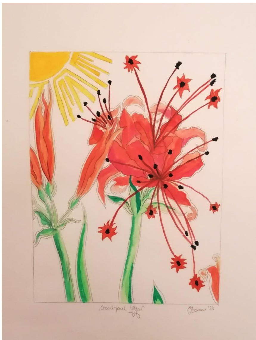
Slika 15 "Crveni pauk liljan" 2020.