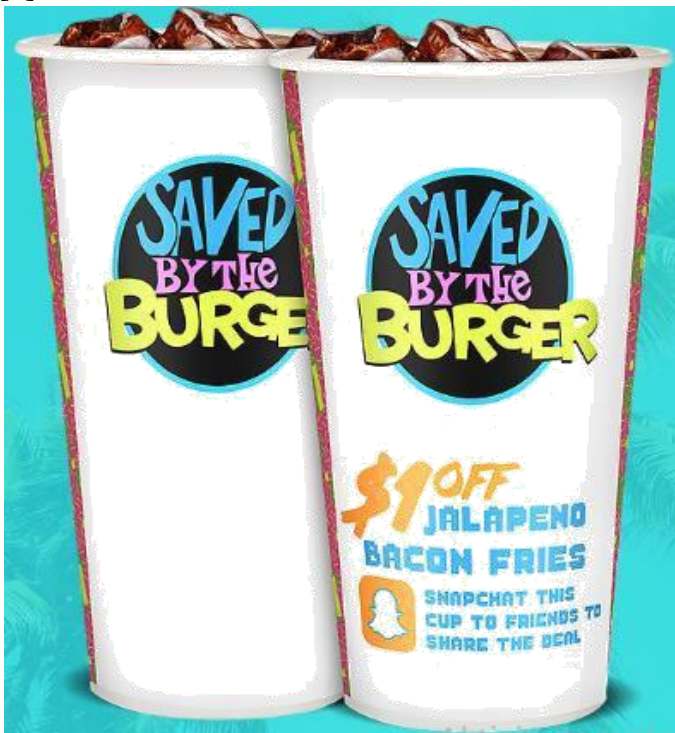
Slika 13. Primjer korištenja fotokromne boje na ambalaži [15]

Jedan od primjera fotokromne boje je plastisol fotokromna boja proizvođača SFXC. Proizvođač nudi 17 različitih tonova ove boje među kojima su : plava, žuta, cijan, crvena, crna, zelena, tamno plava, ljubičasta, smeđa, narančasta, svijetlo plava, ružičasta zlatna. Ako se ovakvom bojom otisnuti materijal izloži direktnoj sunčevoj svjetlosti u trajanju od barem 15 sekundi, početno stanje tona mijenja se u jednu od 17 navedenih boja. Nakon što se otisnuti materijal skloni sa sunčeve svjetlosti, nakon 5 minuta boja se vraća u početno stanje [5].