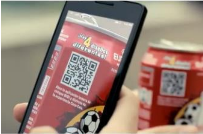
Slika 8. QR kod na limenci Coca-Cole vodi na web stranicu proizvođača na kojoj se nalaze posebne promocije [10]

Skeniranjem kodova, možemo dobiti važne informacije o proizvodu, ali oni mogu služiti i za zabavne svrhe, npr. link na besplatnu igricu ili video.