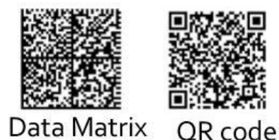
Slika 7. Primjeri 2D kodova [5]

Dvodimenzionalni barkodovi su kvadratnog ili pravokutnog oblika ispunjenih kvadratima, krugovima i drugim geometrijskim oblicima. U odnosu na jednodimenzionalne, oni mogu sadržavati više informacija i imati funkciju direktnog skeniranja. Datamatrix je jedan od popularnih izbora za 2D kod zbog mogućnosti ugrađivanja velikog broja podataka i dobrog uklapanja na ambalažu proizvoda. U velikim centrima za kupovinu se pretežitom koriste QR kodovi (engl.quick response code) koji omogućuju brzo skeniranje svih podataka o proizvodu kao što su geografski položaj proizvoda, najnovije akcije i promocije proizvoda i pronalaženje najkraćeg puta od njihovog trenutnog položaja do odredišta.