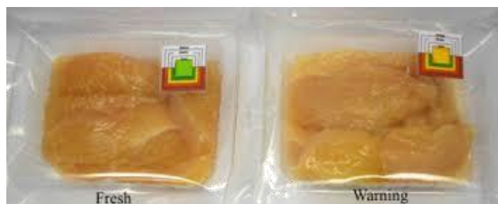
Slika 3. Primjer indikatora svježine [3]

Indikator koncentracije štetnih plinova mijenja boju ako količina plina unutar ambalaže raste i time ukazuje da se proizvod kvari. Većina prehrambenih proizvoda bi trebala sadržavati vrlo mali postotak kisika u ambalaži (0-2%), izuzev mesnih namirnica koji sadrže velik udio kisika zbog održavanje boje proizvoda. Taj mali postotak otežava održavanje kvalitete proizvoda jer i mala promjena u koncentraciji znači vidljive promjene u boji. Zbog toga se često kombinira aktivna i inteligentna ambalaža jer se dodaju aktivne tvari koje apsorbiraju kisik. Vizualni indikator koncentracije ugljikovog dioksida sastoji se od kalcijevog hidroksida koji apsorbira CO 2 i često se primjenjuje za pakiranje mesnih proizvoda. Indikatori mikroorganizama ili indikatori svježine detektiraju mikrobiološki rast i kemijske promjene unutar ambalaže. Rade na principu reakcija između indikatora unutar ambalaže i metabolita koji nastaju kao rezultat mikrobiološkog djelovanja. U anaerobnim pakiranjima, visoke koncentracije etanola i CO 2 te octene i mliječne kiseline su pokazatelji kvarljivosti proizvoda jer ukazuju na fermentativni metabolizam bakterija [3].