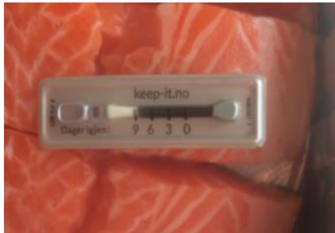
Slika 1. „Keep-it“ indikator[4]

Kao indikator temperature, sa svrhom upućivanja na idealno rashlađen proizvod, koristi se termokromna boja osjetljiva na temperaturne promjene koja mijenja obojenje ovisno o temperaturi kojoj je proizvod izložen.