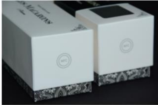
Slika 9. Kutija za kolačiće „Les Macarons“ (Stora Enso) [7]

NFC (engl. near field communication) je tehnologija kraćeg dometa koju možemo usporediti s tehnologijama 3G,4G, Wi-Fi s razlikama da NFC tehnologija koristi drugu frekvenciju, drugu razinu električnog napajanja i drugi komunikacijski protokol. Omogućava jednostavniju razmjenu podataka i brže transakcije zbog razvoja pametnih telefona koji danas uglavnom imaju NFC čitače. Time je kupcima olakšana provjera stanja proizvoda i mogu biti sigurni u ono što kupuju.