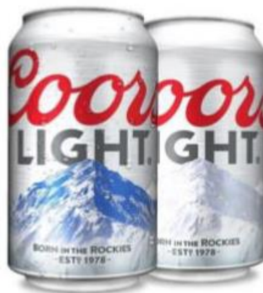
Slika 12. Primjeri termokromne boje na indikatorima vremena i temperature [14]