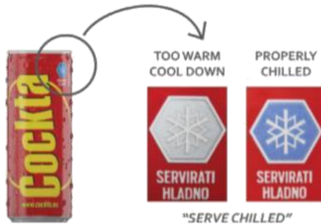
Slika 2. Primjer indikatora promjene temperature [4]

Kao indikator temperature, sa svrhom upućivanja na idealno rashlađen proizvod, koristi se termokromna boja osjetljiva na temperaturne promjene koja mijenja obojenje ovisno o temperaturi kojoj je proizvod izložen.