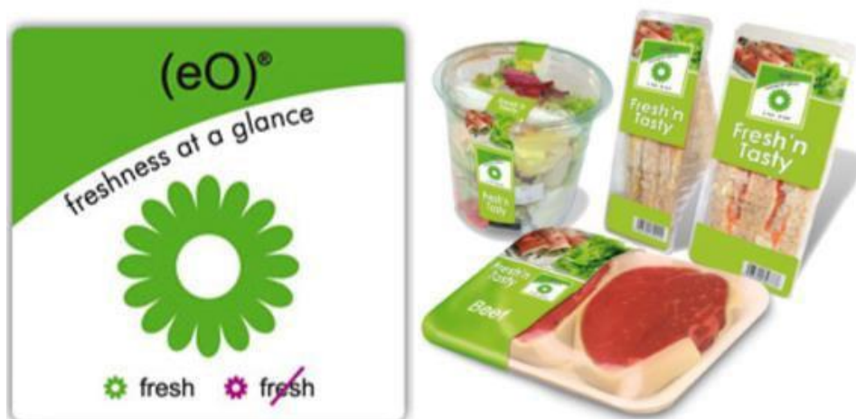
Slika 14. Primjer indirektnog vremensko-temperaturnog bioindikatora [14]

Iako bioindikatore možemo podijeliti na direktne i indirektne, u prehrambenoj industriji se češće koriste indirektni zbog premale osjetljivosti direktnih bioindikatora. Primjer indirektnog vremensko-temperaturnog bioindikatora je (eO) ® naljepnica tvrtke Cryolog. Tehnologija se bazira na mikroorganizmima koji simuliraju kvarenje zapakiranog proizvoda. Indikator sadrži gel s mikroorganizmima koji se izrađuje posebno prema vrsti namirnice, uvjetima skladištenja i razini tražene svježine. Ukoliko je proizvod bio predugo izložen nepovoljnim temperaturnim uvjetima ili je prestar za uporabu boja naljepnice će se promijeniti iz zelene u ljubičastu.[14]