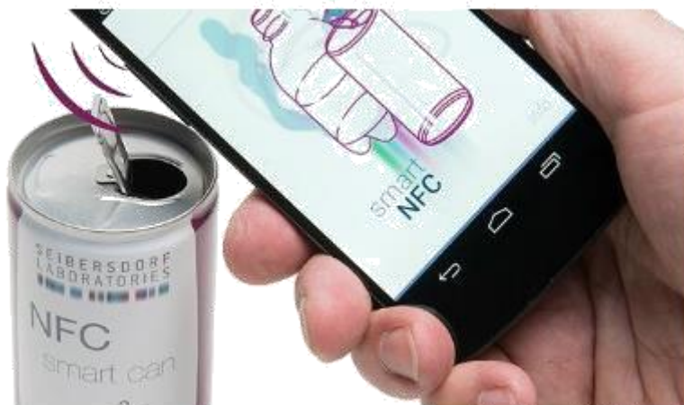
Slika 10. „Pametna“ limenka s NFC oznakom [12]

Primjer korištenja NFC tehnologije prikazan je na slici 9. koja prikazuje interaktivnu ambalažu temeljenu na kratkodometnoj tehnologiji prijenosa podataka (NFC) koja pruža kupcima informacije o alergenima putem NFC oznake i mobilne aplikacije. Ako proizvod sadrži potencijalno štetne tvari, mobilni telefon će upozoriti potrošača o njihovoj prisutnosti. Osim NFC interakcije, ambalaža također sadrži i skrivenu UHF RFID antenu i čip kako bi spriječili neovlašteno otvaranje [4].