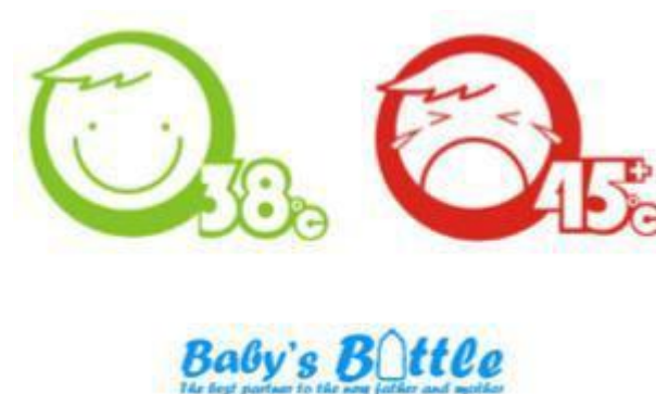
Slika 11. Primjer termokromne boje na indikatorima [8]

Leukobojila osim prelaska iz obojenog stanja u bezbojno stanje, mogu prelaziti iz jedne boje u drugu tj. promjenom temperature izmjenjuju se dva obojenja npr. ako su pomiješane boje plava i žuta na nižim temperaturama dolazi do zelene boje, a pri višim temperaturama dolazi do pojave žute boje. To se postiže miješanjem leukobojila s konvencionalnim pigmentima, u opisanom slučaju leukobojila su nositelji plavog obojenja, dok su konvencionalni pigmenti žute boje. Dok se kod termokromnih boja na bazi tekućih kristala za tisak koristi apsolutno crna podloga, kod termokromnih boja na bazi leukobojila preporuča se otiskivanje termokromnih boja na što svjetliju tiskovnu podlogu, najbolje bijelu.