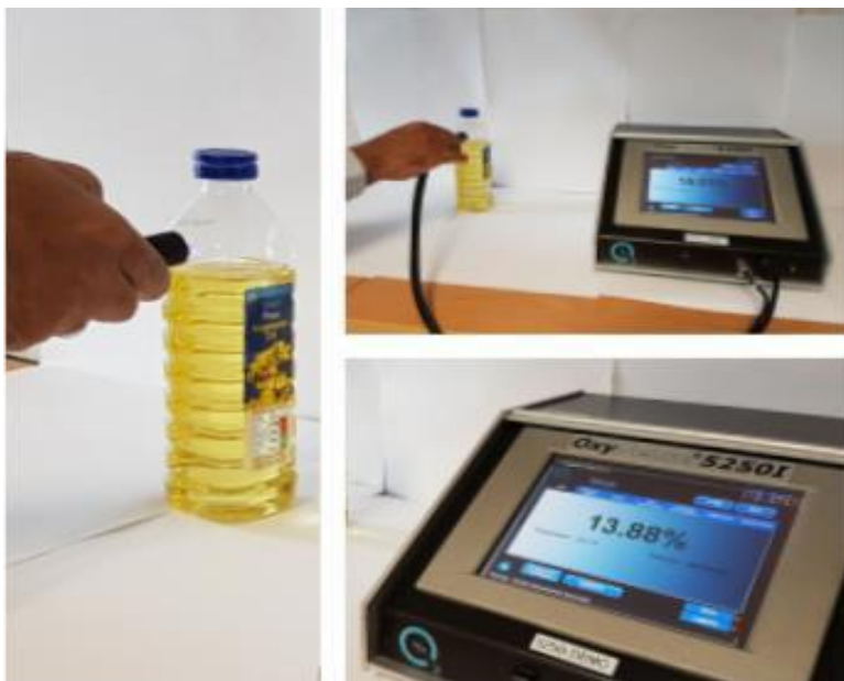
Slika 5. Uređaj za otkrivanje prisutnosti kisika unutar ambalažnog proizvoda [4]

Biosenzori su uređaji koji detektiraju i daju informacije o biološkim reakcijama. Ovakav uređaj se sastoji od bioreceptora, koji je specifičan za svaki analit koji se detektira i pretvornika, koji biološke signale pretvara u mjerljive električne signale. Biosenzori su organske tvari: enzimi, antigeni, hormoni, nukleinske kiseline, te mikroorganizmi. Pretvornik može biti elektrokemijski, optički, kalorimetrijski itd. [3].