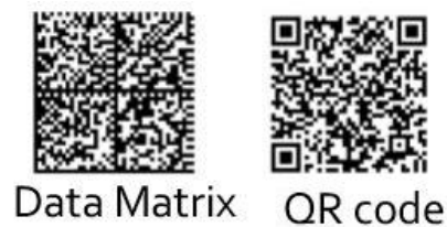
Slika 7. Primjeri 2D kodova [5]

Dvodimenzionalni barkodovi su kvadratnog ili pravokutnog oblika ispunjenih kvadratima, krugovima i drugim geometrijskim oblicima. U odnosu na jednodimenzionalne, oni mogu sadržavati više informacija i imati funkciju direktnog skeniranja. Datamatrix je jedan od popularnih izbora za 2D kod zbog mogućnosti ugrađivanja velikog broja podataka i dobrog uklapanja na ambalažu proizvoda. U velikim centrima za kupovinu se pretežito koriste QR kodovi (engl.quick response code) koji omogućuju brzo skeniranje svih podataka o proizvodu kao što su geografski položaj proizvoda, najnovije akcije i promocije proizvoda i pronalaženje najkraćeg puta od njihovog trenutnog položaja do odredišta.