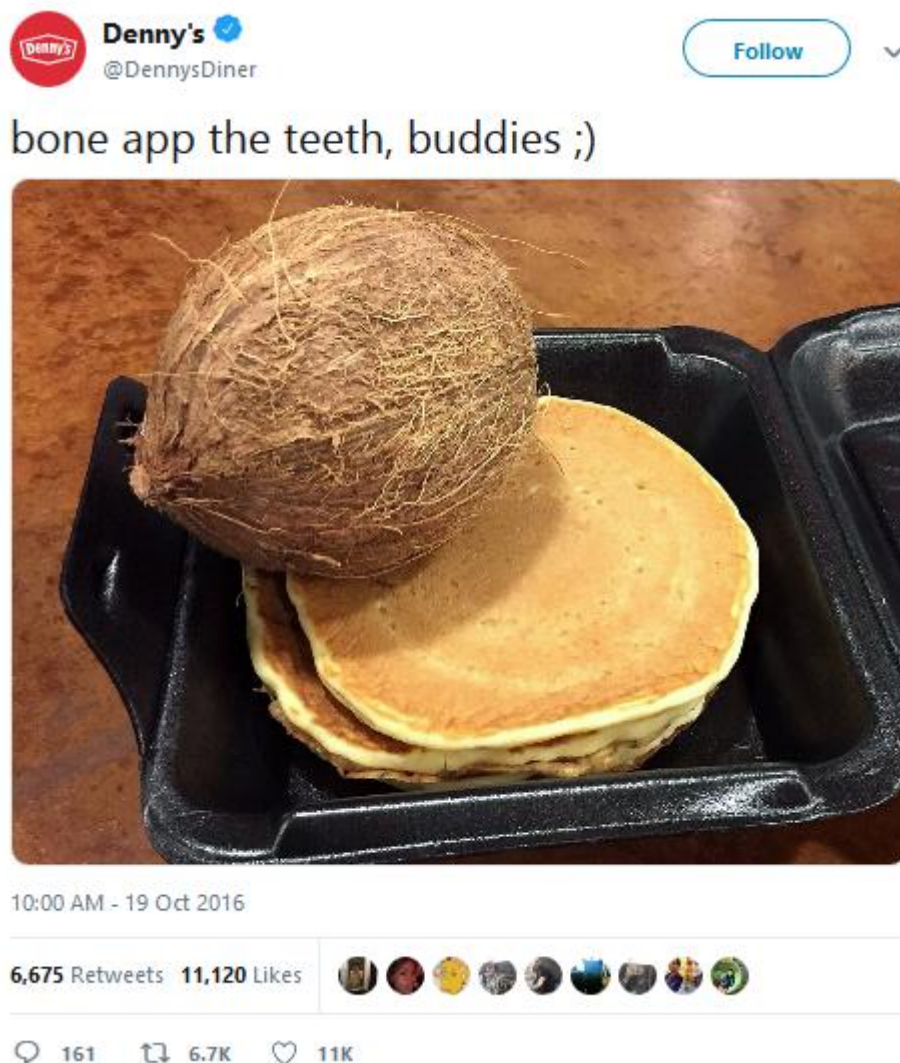
Slika 4.2.1. – Twitter objava profila restorana Denny's [33]

razinu svjetski poznatog. Primjer jednog takvog tweeta je na slici 4.2.1 gdje je odlučeno koristiti tada popularni meme koji se služio neispravnom gramatikom engleskog jezika u kombinaciji sa fotografijama upitno jestivih jela. Iako široj publici bez poznavanja internet kulture ovaj tweet možda može biti besmislen, populaciji upućenoj u trendove komuniciranja je u potpunosti jasno na koji je način proveden humor u konkretnom slučaju. Iako je u vremenu pisanja rada ovaj meme izišao iz optičaja relevantnosti, ostaje i dalje pozitivna asocijacija brenda Denny's sa humorom.