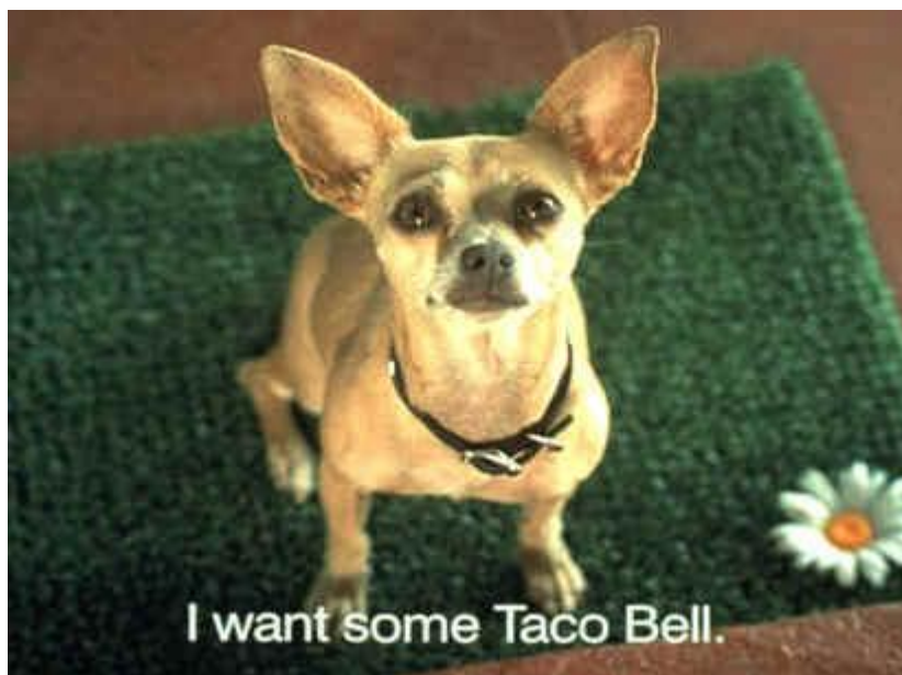
Slika 4.1.1. – isječak iz Yo Quiero Taco Bell reklame[19]

Humor je vrlo individualna pojava koja gotovo uvijek privlači pažnju, bez obzira na izvedbu. U doba u kojem je marketing vrlo snažna grana, dobro je zapitati se je li moguće implementirati humor u obliku reklame. No, s obzirom na njegovu individualnu prirodu, logično je pretpostaviti da postoje protivnici ideje korištenja humora kao marketinško sredstvo. Razlozi tome su mnogi, primjerice, odvlačenje pozornosti od samog proizvoda na humor, sama neuniverzalnost humora i iritacija gledatelja pri konstantnom ponavljanju. Suprotno toj struji postoje pobornici ideje da je humor u reklamama savršeni alat koji može postići memorabilnost i privući klijente ka nekom brendu (primjerice „ Yo Quiero Taco Bell “ reklama koja je uvelike pomogla tada umirućem brendu (čiji je isječak prikazan na slici 4.1.1.)).[18]