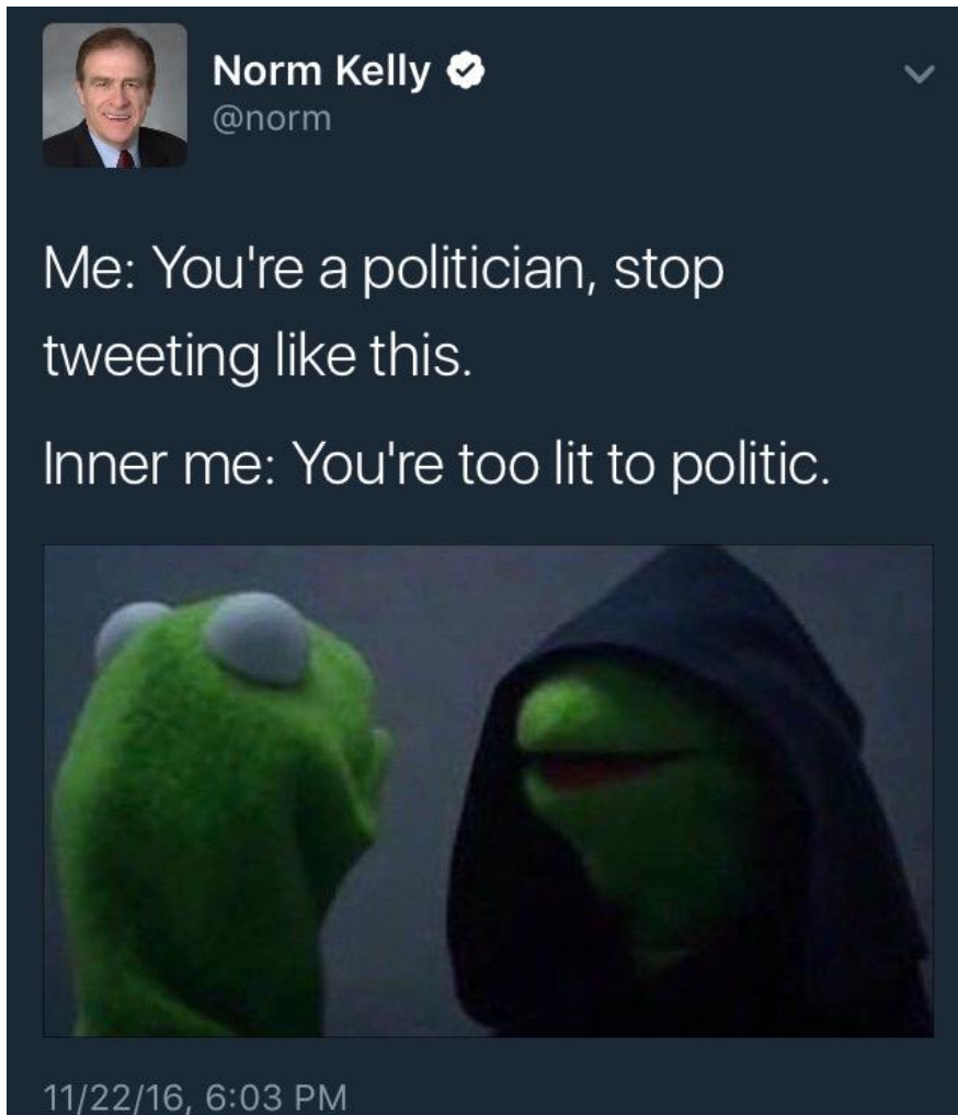
Slika 4.3.2. – Tweet kanadskog političara Norma Kellya [36]