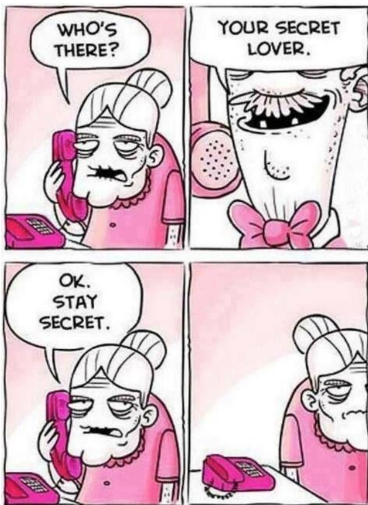
Slika 2.2.1. – korištenje humora u stripu [16]