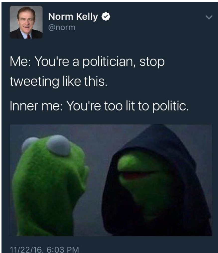
Slika 4.3.2. – Tweet kanadskog političara Norma Kellya [36]