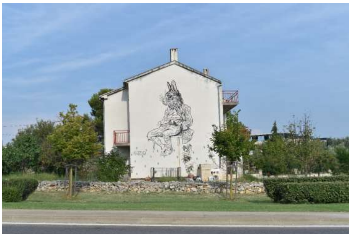
Slika 6 Oko