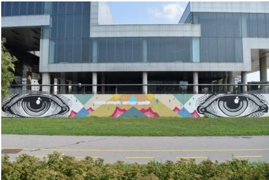
Slika 5 Oko