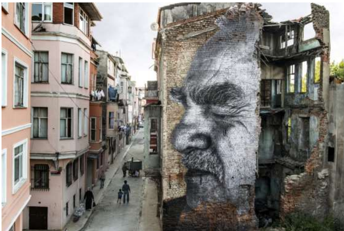
Slika 19. Portret, JR