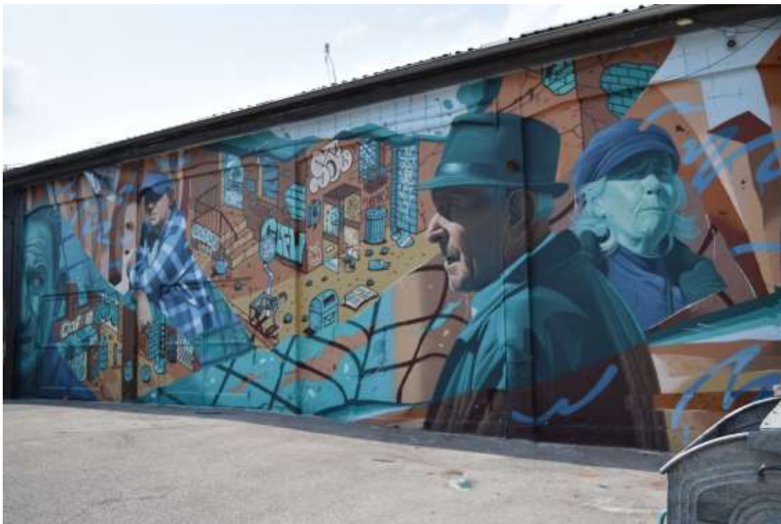
Slika 2 Lonac