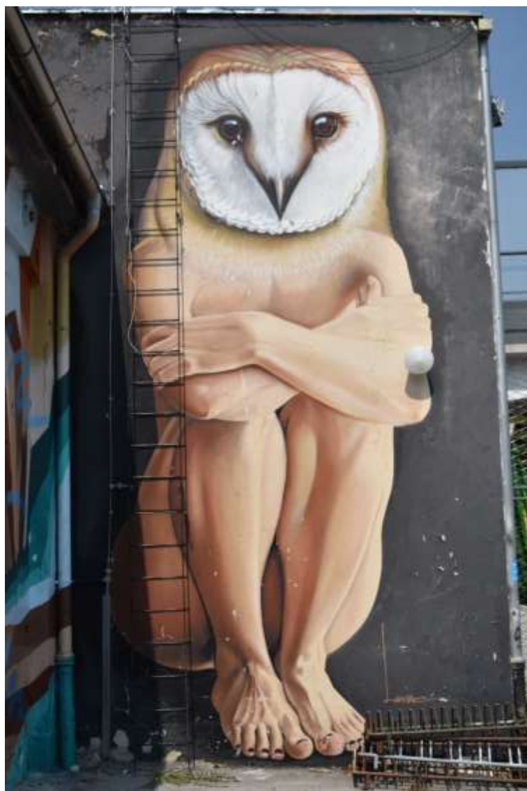
Slika 7 Oko