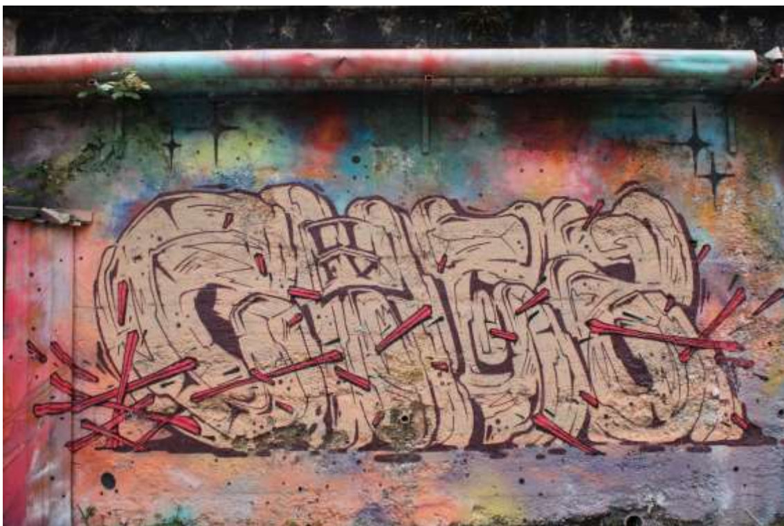
Slika 9 Chez