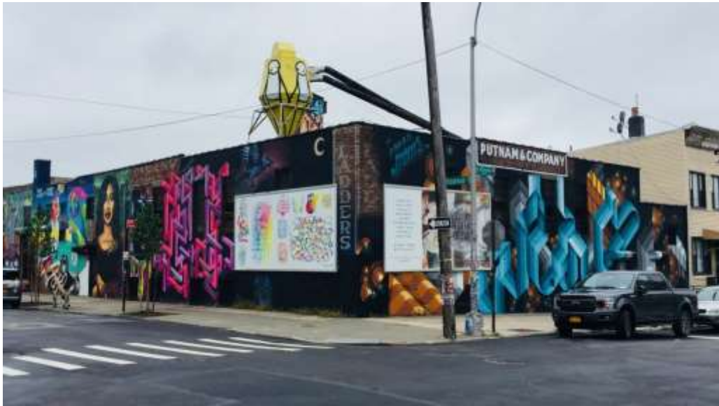
Slika 11. Bushwick naselje u New Yorku, primjer uređenja ulice i cjelokupnog prostora

Razlog tome je što većina promatrača ne razumije poruku i način izražavanja grafitera. To sa uličnom umjetnošću nije slučaj. Mnogi ulični umjetnici koriste gradske zgrade i ulice za oblikovanje i uređivanje prostora (Slika 13). Samim time daju novi i svježi izgled nekada ružne i monotone zgrade ili zapuštenog prostora (Slika 12). Postoje i cijela naselja gdje je legalno crtati i uređivati zidove. Jedan od primjera je naselje Bushwick u Brooklynu koje je postalo turistička atrakcija i turisti dolaze tamo samo da bi vidjeli radove umjetnika (Slika 11).