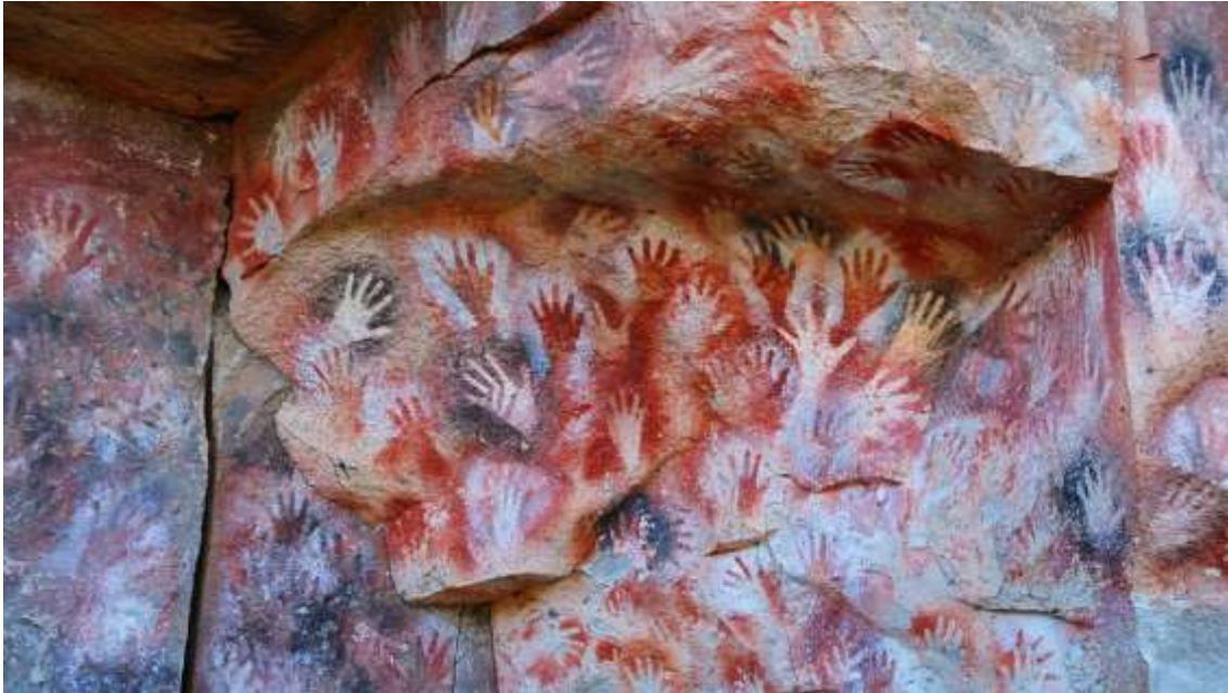
Slika 4. Cueva de las Manos, Argentina

grebanjem i crtanjem tupim objektom po kamenu i često su predstavljali lov. Izraz grafiti odnosio se i na natpise i slikovne crteže pronađene na zidovima drevnih grobova, ruševina ili spilja (Slika 4). Takve natpise arheolozi su pronašli u rimskim katakombama i u Pompejima (Slika 3). Stari Grci i Rimljani su svoju pismenost i način života izražavali pisajući ljubavne poruke, političke slogane ili misli pomoću grafita po zidovima gradova [3].