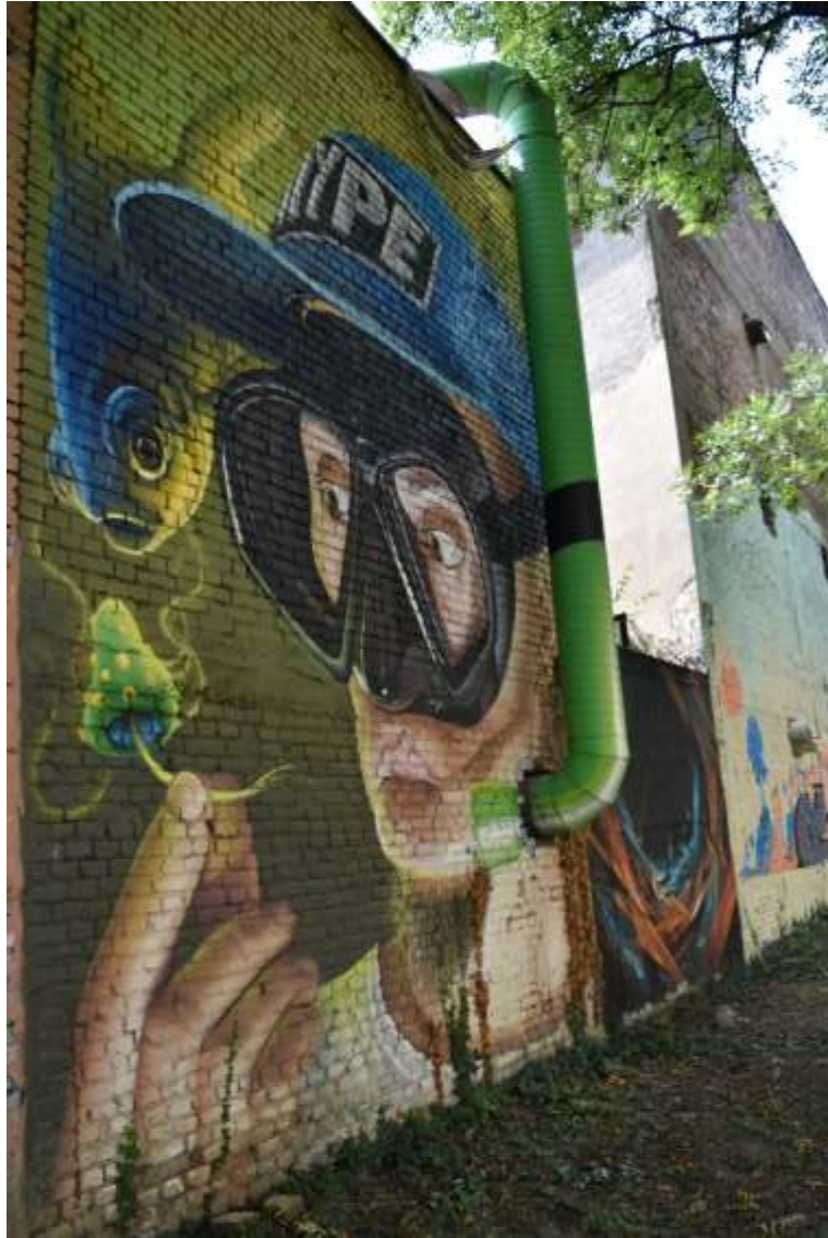
Slika 3 Lonac