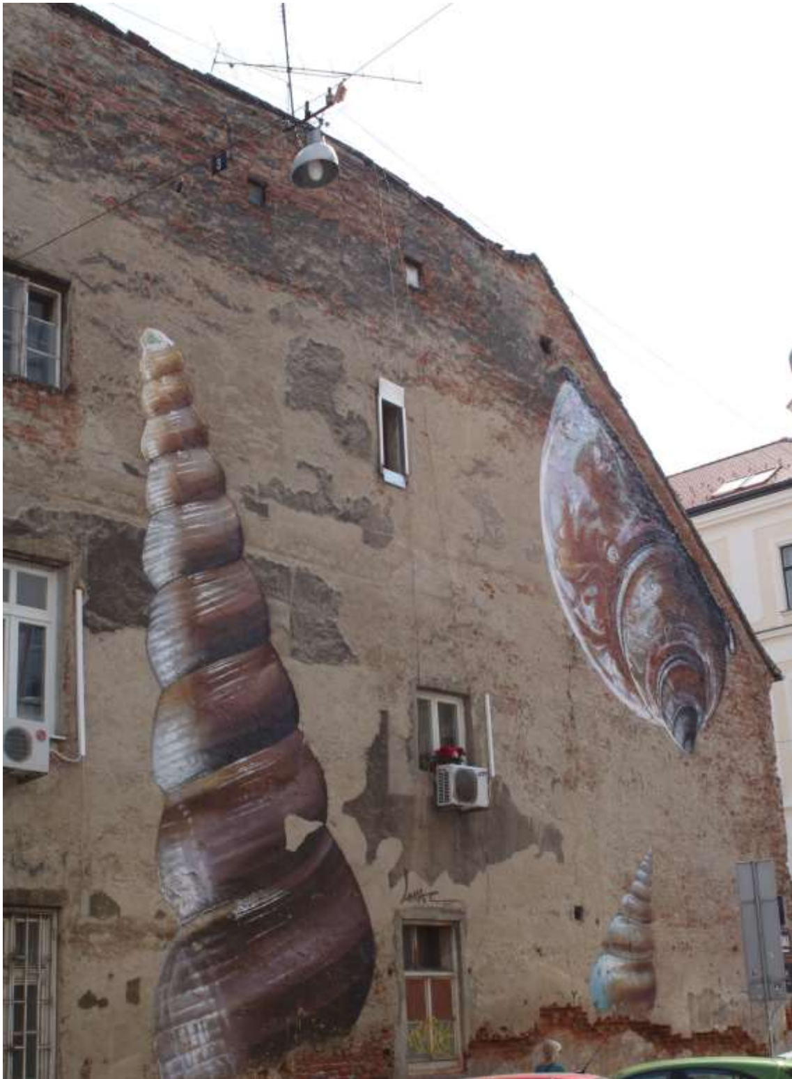
Slika 4 Lonac