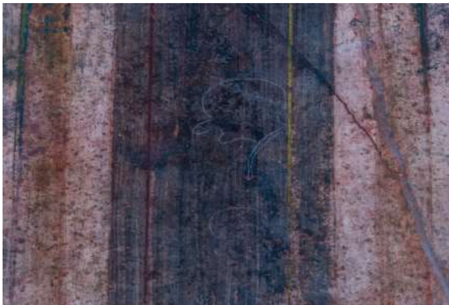
Slika 3. Primjer grafita/karikature političara, Pompeji

Ljudi smatraju umjetnost grafita novom i modernom vrstom umjetnosti, ali zapravo sama umjetnost je stara tisućama godina. Kada govorimo o umjetnosti ne mislimo o grafitersku umjetnosti kakvu danas poznajemo. Govorimo o crtežima koji su nastali još u mlađe kameno doba i nalaze se unutar špilja. Takvi stari crteži su nastali