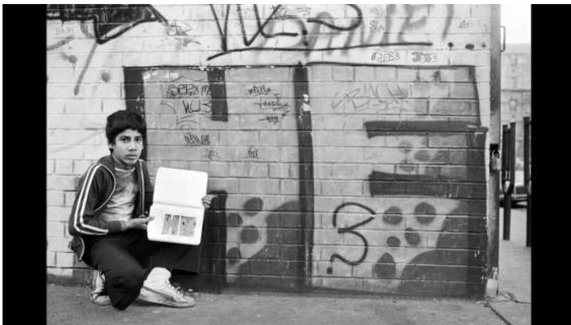
Slika 14. fotografija HE3, Martha Cooper

Martha Cooper je jedna od najpoznatijih fotografa ulične umjetnosti. Porijeklom iz Baltimorea, najpoznatija je po svojoj dokumentaciji tijekom samih početaka grafita 80-tih godina u New Yorku. Ona je počela tako što je upoznala grafitere Dondia i HE3 i počela pratiti svaki njihov korak po podzemnim željeznicama (Slika 14). Njezina najpoznatija