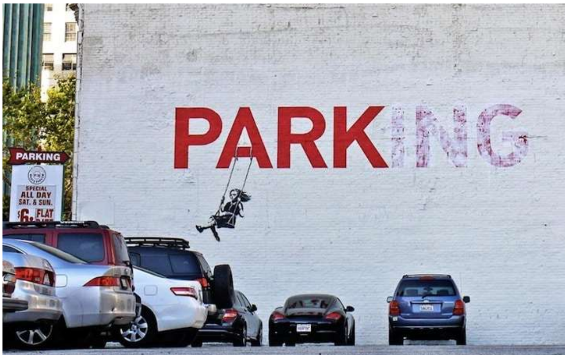
Slika 9. Ulična umjetnost sa porukom, Banksy

Ljudima je teško raspoznati uličnu umjetnost od grafita jer se oni često nalaze jedan s drugim. Lijepljeni radovi i stencili su često postavljeni na vrhu grafita ili u neposrednoj blizini. Grafiti pisci u većini slučajeva komuniciraju sami sa sobom i sa svojom zajednicom i svakodnevni promatrač ih teško može razumjeti, za razliku od ulične umjetnosti, koju promatrač može razumjeti, jer je to slika grafičke umjetnosti. Na prvu se možda ne može naći razlika, ali nakon nekog vremena razlika postaje očigledna [6].