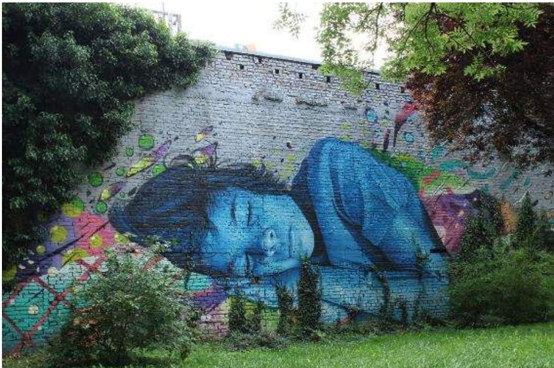
Slika 1 Lonac/Chez