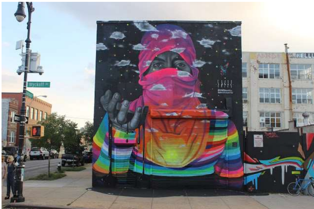
Slika 12. Brooklyn, uređenje privatnog prostora, Dasic Fernandez