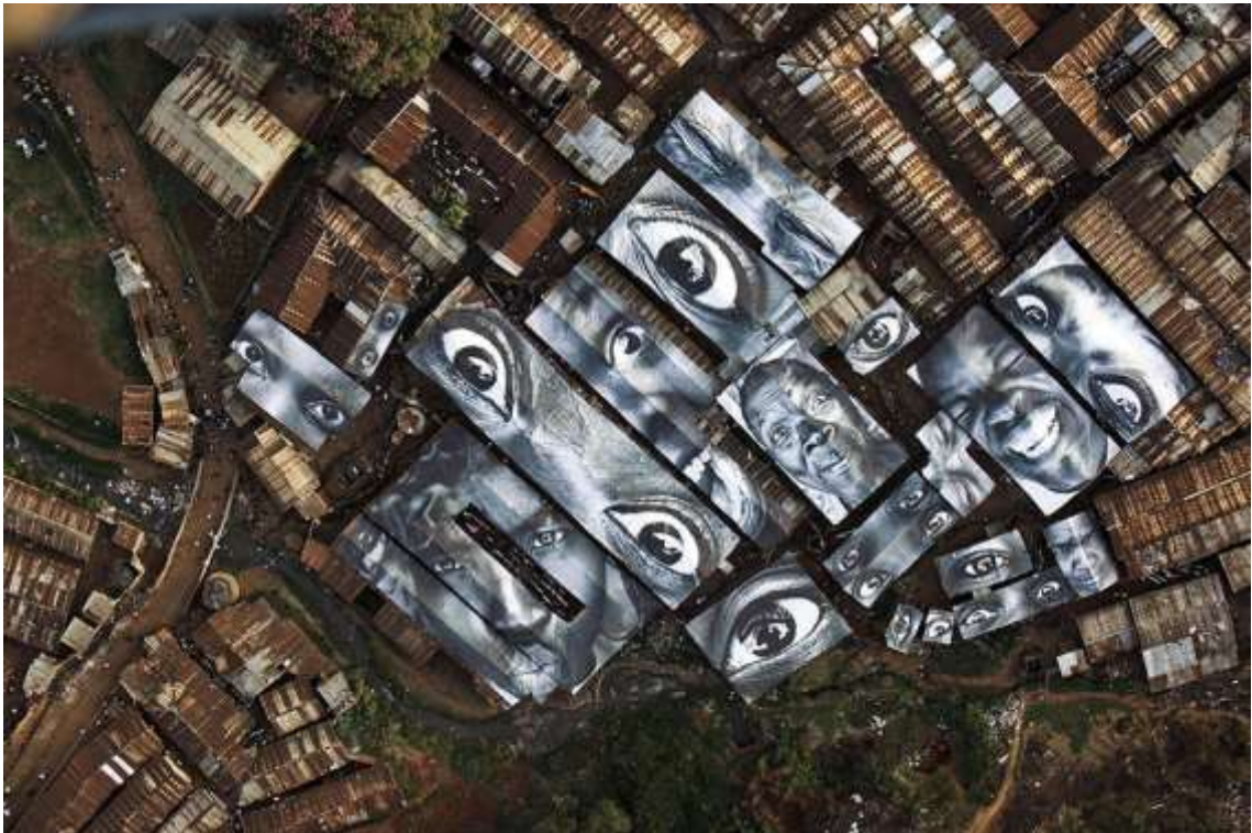
Slika 17. Womens are Heroes projekt, JR

are Heroes (Slika 17), gdje je predstavio lica žena koje su imale tešku prošlost i žele bolju budućnost [9].