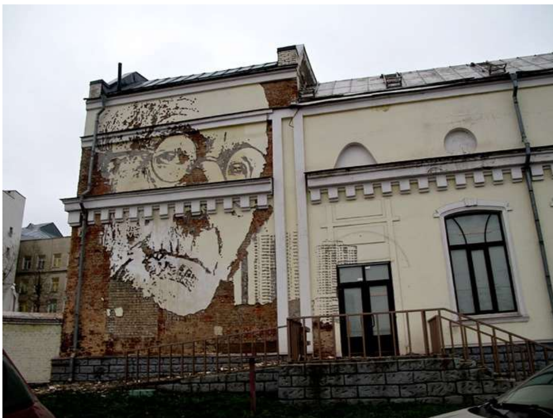
Slika 10. Vhils

Nakon što promatrač razumije temu, vrlo brzo postaje jasno što je ulična umjetnost, a što grafit. Pisanje grafita ima vrlo specifičnu estetiku: radi se o tagovima, grafičkom obliku, pismu, stilovima i nanošenju boje u spreju, te o dolasku do teških lokacija. Definicija ulične umjetnosti je jako širok pojam. Možemo reći da sva ulična umjetnost, koja ne predstavlja grafite, je ulična umjetnost.[6]