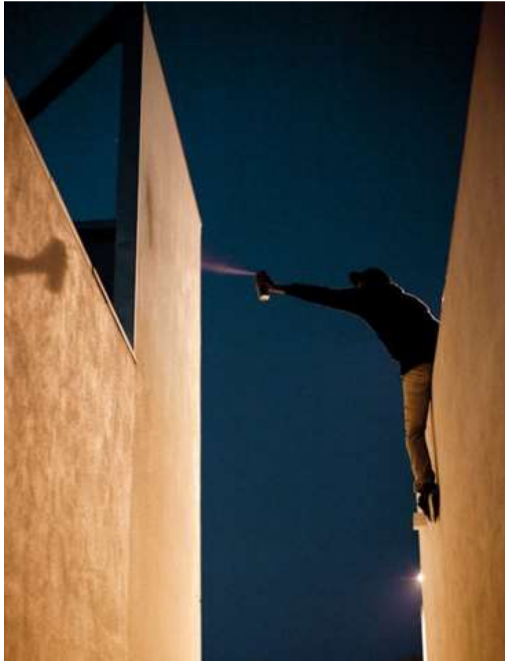
Slika 16. Grafiter, Keegan Gibbs

umjetniku i načinu kako je proveden izlazak s umjetnikom. Zato je počeo pratiti svoje fotografije esejima i pričama o noćnim izlascima s umjetnicima [9].