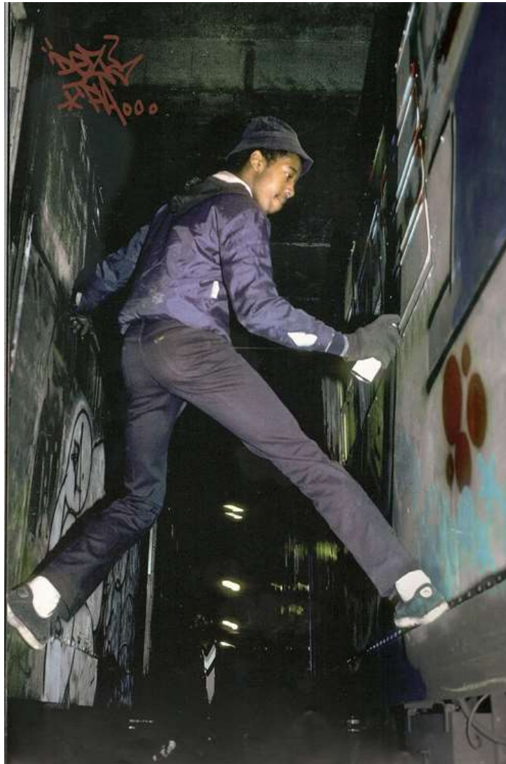
Slika 15. fotografija grafitera, Martha Cooper

knjiga je Subway Art koju je napisala u suradnji s Henry Chalfantom. Knjiga sama po sebi je portfolio grafita koji su nastali 80-ih godina i označavaju početak same kulture [9].