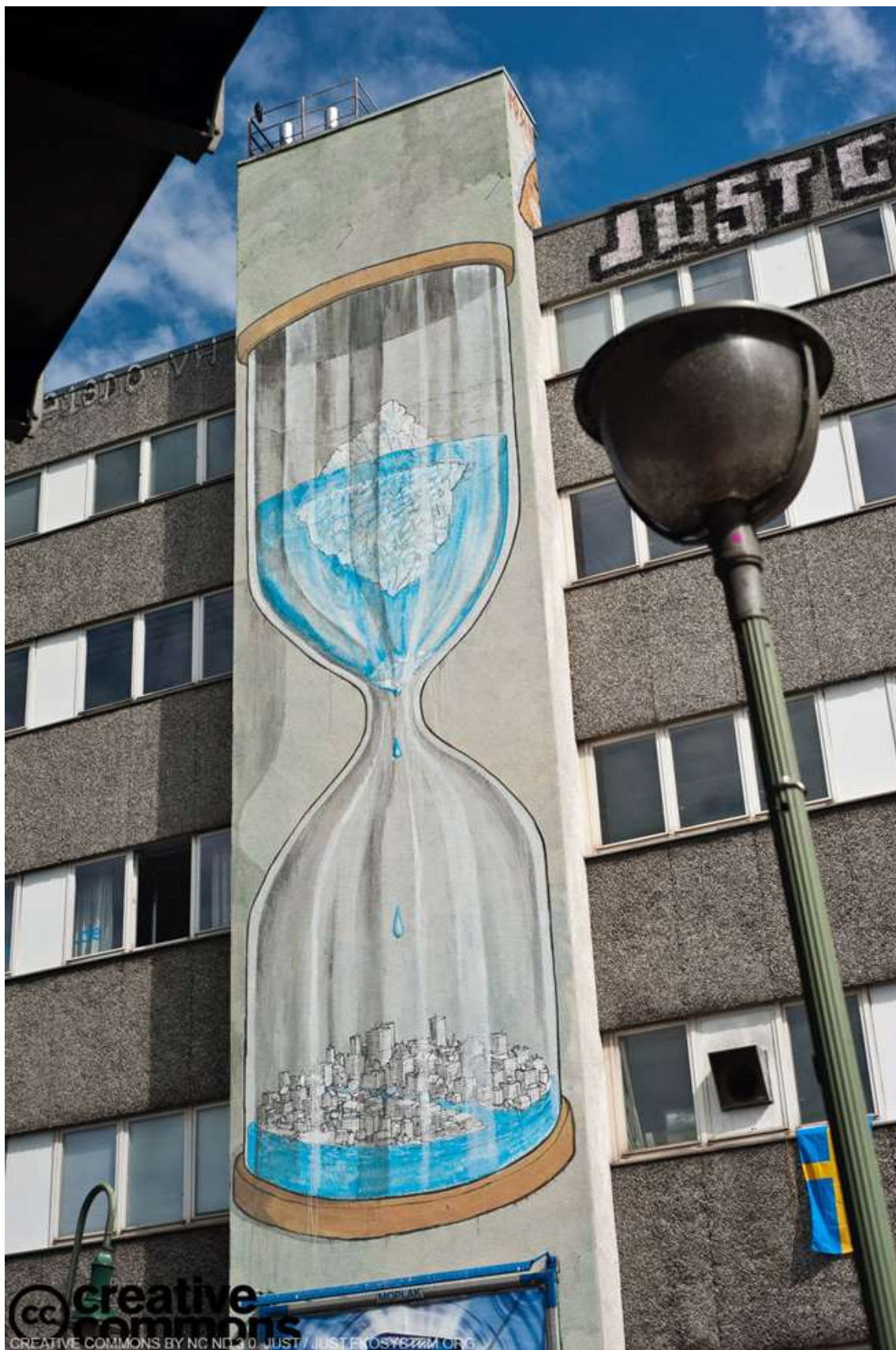
Slika 13. Ulična umjetnost sa porukom i uređivanje javne površine, Blu