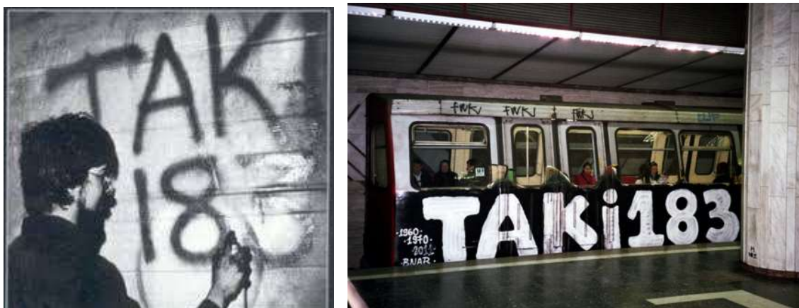
Slika 6. i 7. Taki183

Jedan od prvih poznatijih grafitera iz New Yorka je TAKI183 (Slika 6 i 7). Postao je poznat kad je jedan novinar, koji je tada radio za New York Times, 1971. godine,