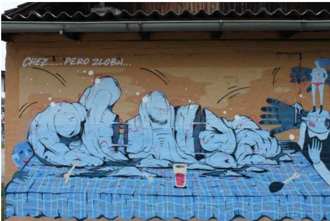
Slika 8 Chez