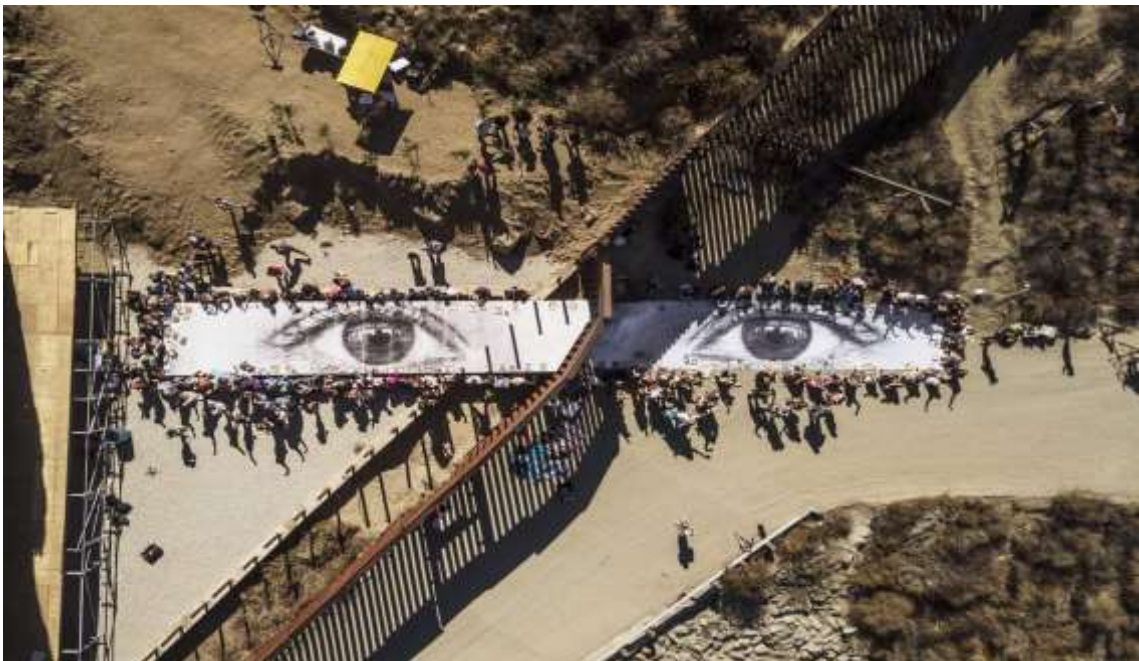
Slika 18. Ulična umjetnost sa porukom, JR