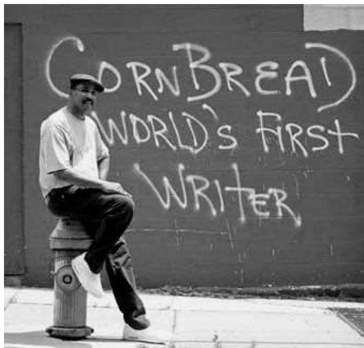
Slika 5. Cornbread

„Ironično, iz uništenja nekada održivih urbanih četvrti, pojavila se nova zajednica, ona koja se ne može srušiti, grafiti“. Novo stanje svijesti u New Yorku je pridonjelo razvoju cjelokupne hip-hop kulture. Mladi su našli nove načine izražavanja osjećaja i kreativnosti crtajući po zidovima i vlakovima. Izjave vlasti u to vrijeme su bile da grafiti moraju biti uništeni jer su simbol društva koje je izgubilo kontrolu. To nam govori o tome koliko su u prošlosti grafiti bili neprihvaćeni [6].