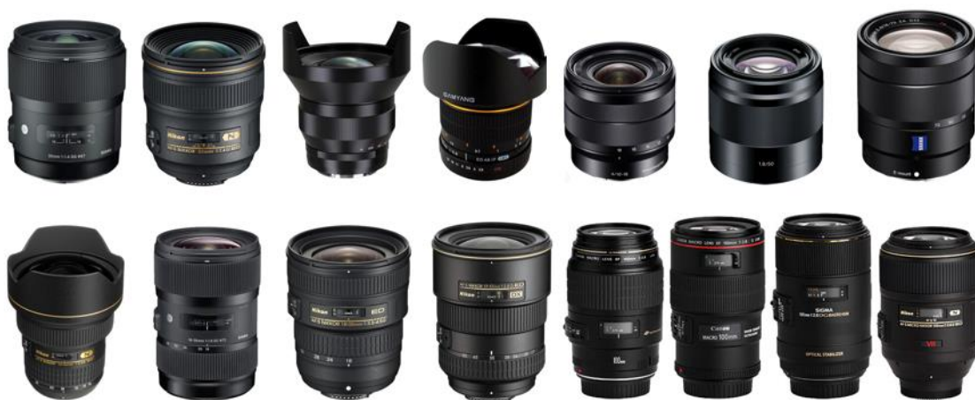
Slika 2.4.4. Objektivu

Žarišna duljina normalnog objektivu je jednaka dijagonali senzora fotoaparata, a vidni kut mu je od 40 do 50° te slike djeluju prirodno. Širokokutni objektiv prikazuju širi kut od ljudskog oka (60-100°), stoga će gledanje motiva kroz taj objektiv izgledati dalje te će polje dubinske oštine biti veće usporedno s normalnim objektivom. Za razliku od normalnog i širokokutnog objektivu, vidni kut teleobjektivu je manji od 35°, a super teleobjektivu manji od 8°. Žarišna duljina teleobjektivu kreće se od 85 mm preko 135 i 200 mm do čak 1200 mm. Što je žarišna duljina veća, to je polje dubinske oštine manje, iz tog razloga fotografije s teleobjektivima imaju spljoštene perspektive. Za veću kvalitetu fotografija potrebno je imati objektiv sa fiksnom žarišnom duljinom.