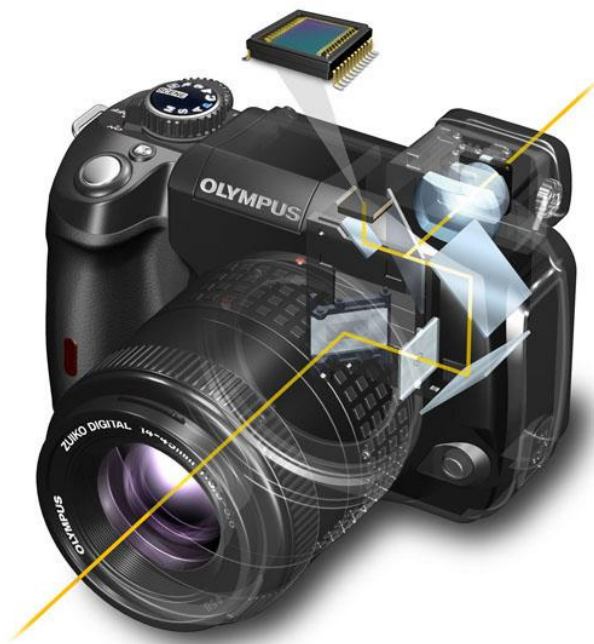
Slika 2.4.2. Refleksno tražilo na fotoaparatu

Za vrijeme kadriranja svjetlosni snop putuje kroz objektiv i udara u koso ogledalo kojim se slika skreće prema staklenoj prizmi na vrhu aparata. Prizma okreće sliku stvorenu na donjoj, matiranoj plohi, jer se u aparatu inače stvara zrcalna slika stvarnosti, postavljena naglavce. Slika je pomoću prizme usmjerena u okular aparata s mogućnošću korekcije vida (podešavanja dioptrija). Kod refleksnog tražila (SLR sustav) nema paralakse, tj. u tražilu se vidi točna slika koja se projicira na CCD sustav. Prije okidanja zrcalo se preklapa (uklanja s puta svjetlosti) nakon čega se otvara zatvarač aparata i počinje ekspozicija. Čim se zatvarač zatvori, zrcalo se vraća u položaj za skretanje svjetlosnog snopa u tražilo, koje je u klasičnim izvedbama "slijepo" za trajanja ekspozicije. Pojavom LCD tražila, refleksno tražilo je nešto izgubilo na značaju, ali je kod profesionalnih fotoaparata još je uvijek obavezno.