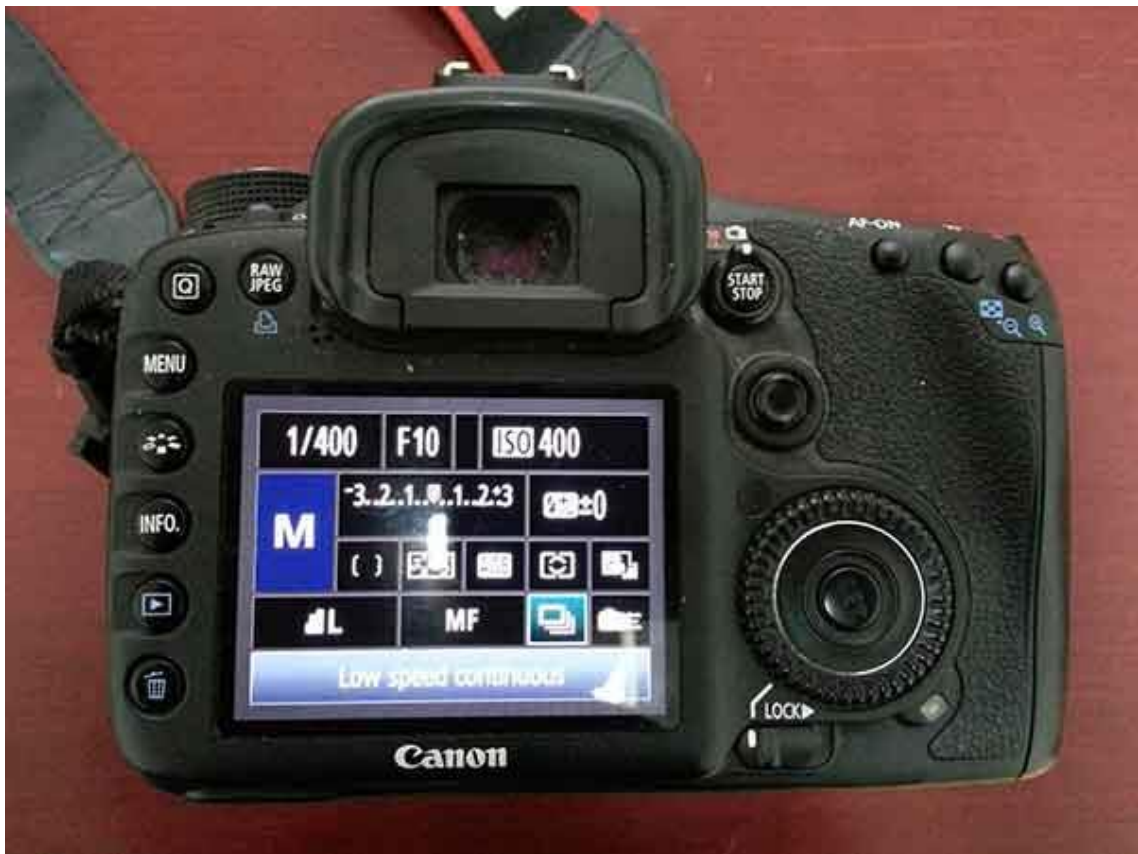
Slika 2.1.1. Digitalni fotoaparati

S razvojem digitalne tehnologije znatno raste i stupanj automatizacije te mogućnosti dodavanja efekata u procesu samog snimanja ili fotografiranja. Digitalni fotoaparati mogu imati mogućnost snimanja u potpunom mraku detektiranjem infracrvenog zračenja, snimanja panoramskih fotografija koje automatski spajaju više pojedinačnih fotografija, primjene različitih drugih efekata i slično. Ako želimo možemo reproducirati snimke kamere ili fotografije fotoaparata na ugrađenom LCD monitoru ili na TV ekranu direktno iz kamere bez velike intervencije snimatelja.