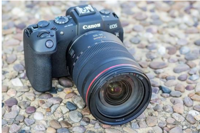
Slika 22. Canon EOS RP.

Od ovih izdanja, veliku popularnost bilježi Canon RF 85 mm f/1.2L, s jednom dodanom tehnologijom koja se zove 'izgladivanje defokusa', namijenjena poboljšanju bokeha 1 na ionako tankom objektivu dubinske oštine.