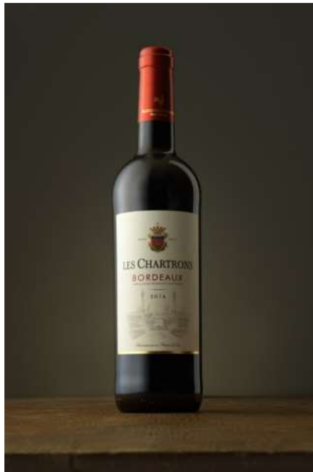
Slika 1: Fotografija proizvoda postignuta korištenjem prirodnog svjetla

Prirodno svjetlo dolazi od Sunca ili Mjeseca te ovisi o vremenu. Sunce je glavni prirodni izvor svjetla te odabirom odgovarajućeg doba dana pa i vremenskih prilika može se odrediti kakvo će biti osvjetljenje na fotografiji. Kada je vani vedro te je Sunčeva svjetlost jaka stvaraju se oštre sjene i ima malo polusvjetla, a kada je vani oblačno sjene postaju puno mekše i manje guste, odnosno ima puno više polusvjetla. Polusvjetla se nalaze na rubovima sjene, odnosno to je prijelaz između sjene i svjetla te postaju veća ili manja ovisno o uvjetima osvjetljenja. U ranim jutarnjim satima ili predvečer, kada Sunce nije jako, dobiva se toplo svjetlo s dugim sjenama te su boje bogate. U popodnevним satima kada je Sunce najintenzivnije, dobiva se grubo i oštro svjetlo s jasno oblikovanim predmetima.