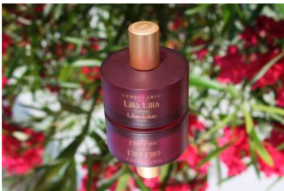
Slika 20: L'erbolario Lilla Lilla – Fotografija prije i poslije naknadne obrade

Na fotografiji proizvoda parfem L'erbolario Lilla Lilla u naknadnoj obradi primijenjene su manje promjene. Podešena je svjetlost i kontrast kako bi se smanjila refleksija Sunčeve svjetlosti na samom proizvodu te kako bi više došao do izražaja. Uklonjena su manja oštećenja, 'mrlje', koje su bile prisutne radi oštećenja rekvizita. Pojačan je intenzitet određenih boja radi boljeg isticanja.