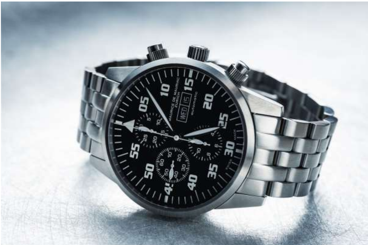
Slika 8: Primjer nekvalitetne pozadine za fotografiju proizvoda

Osim toga, neprikladna pozadina ili orijentacija mogu učiniti da proizvod izgleda kaotično i neprofesionalno. Ne treba zanemarivati pozadinu jer ona igra sastavnu ulogu u poboljšanju privlačnosti proizvoda. Obična bijela ili svijetla pozadina može pomoći za stvaranje kontrasta te isticanje proizvoda.