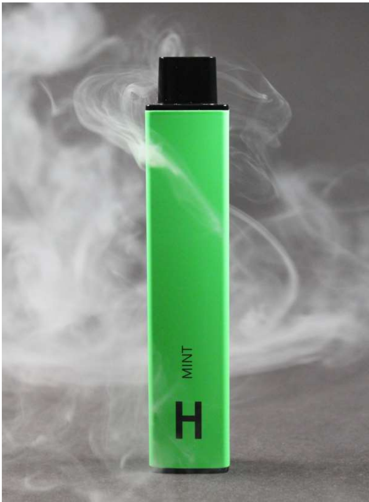
Slika 9: Hyla