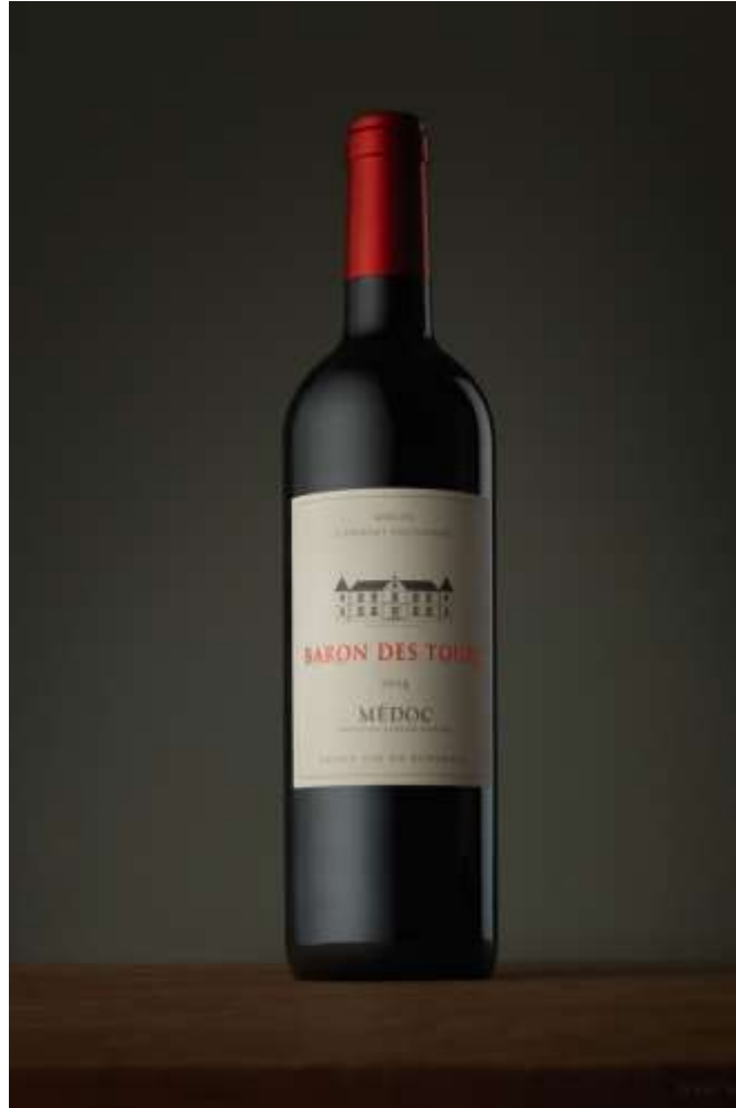
Slika 2: Fotografija proizvoda postignuta korištenjem studijske rasvjete