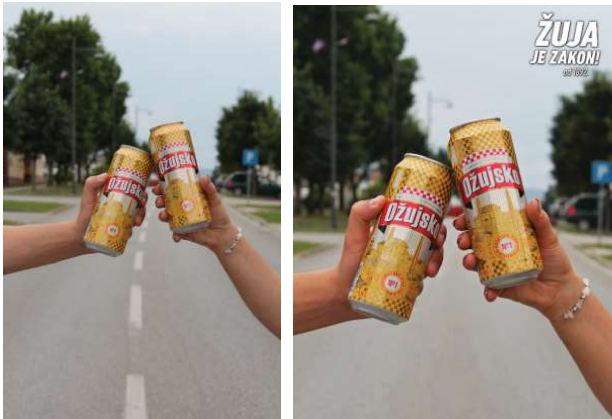
Slika 22: Autorska fotografija – Ožujsko – Fotografija prije i poslije naknadne obrade

Na fotografiji za promociju proizvoda Ožujsko pivo promijenjen je format, izrezan je dio fotografije radi boljeg vizualnog dojma, kako bi proizvod više došao do izražaja. U malim količinama je podešena svjetlost i kontrast, te pojačan intenzitet boje radi boljeg dojma u oku promatrača, odnosno potencijalnog kupca. Uklonjene su linije ceste u donjem dijelu fotografije kako ne bi odvrćale pozornost. U negativnom prostoru u gornjem desnom kutu fotografije dodan je slogan proizvoda radi boljeg emocionalnog povezivanja kupca s proizvodom.