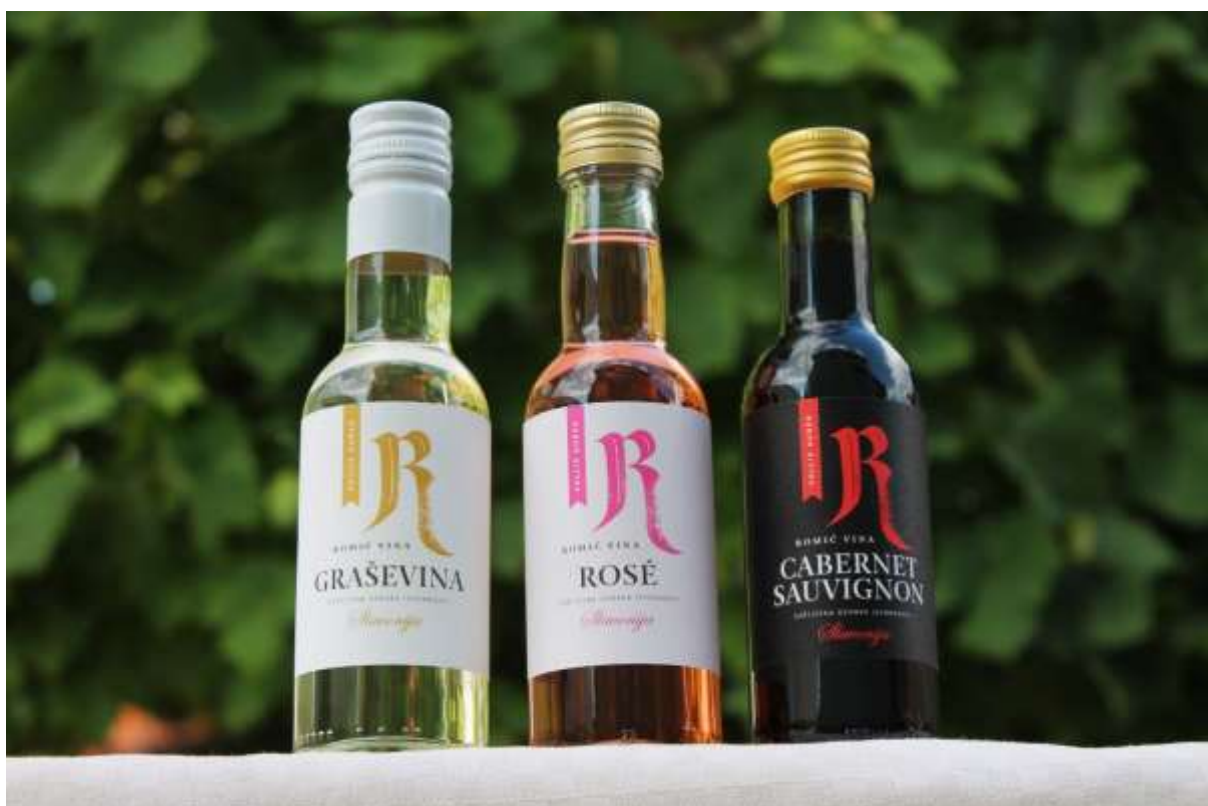
Slika 15: Vina Romić butelje 25 ml