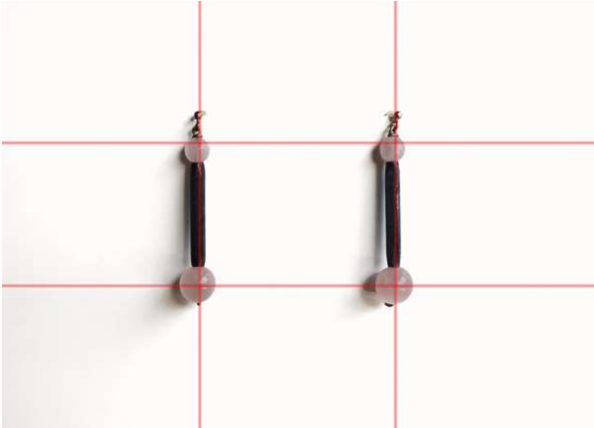
Slika 5: Primjer pravila trećine u produkt fotografiji

stupca te se elementi postavljaju na sjecišta okomitih i vodoravnih linija (koje čine redove i stupce).