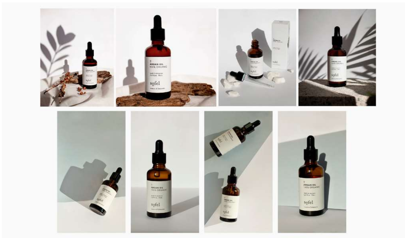
Slika7: Primjer korištenja više fotografija za jedan proizvod