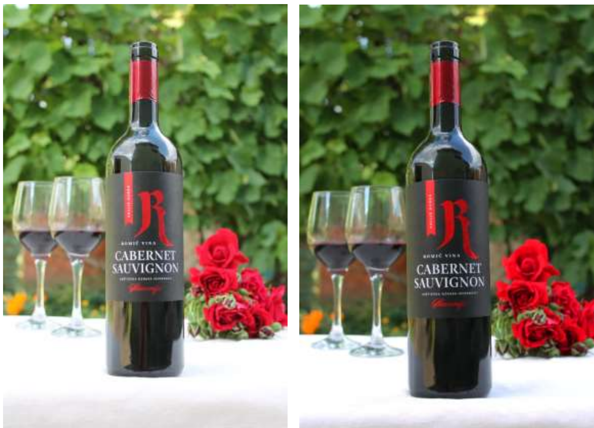
Slika 23: Autorska fotografija – VINA ROMIĆ Cabernet Sauvignon – Fotografija prije i poslije naknadne obrade

Za fotografiju proizvoda VINA ROMIĆ Cabernet Sauvignon također su izvršene manje promjene u Adobe Photoshopu radi boljeg vizualnog dojma. Fotografija je nastala u eksterijeru te je intenzitet Sunčeve svjetlosti bio jak pa je svjetlost i kontrast podešena u naknadnoj obradi kako bi fotografija izgledala kvalitetnije. Također je malo pojačan intenzitet crvene boje kako bi se podigla dinamičnost te su uklonjena određena manja oštećenja, točkice, koje su se nalazile na ambalaži proizvoda. Fotografija je obrezana sa svih strana u manjim količinama kako bi se postigao željeni izgleda fotografije.