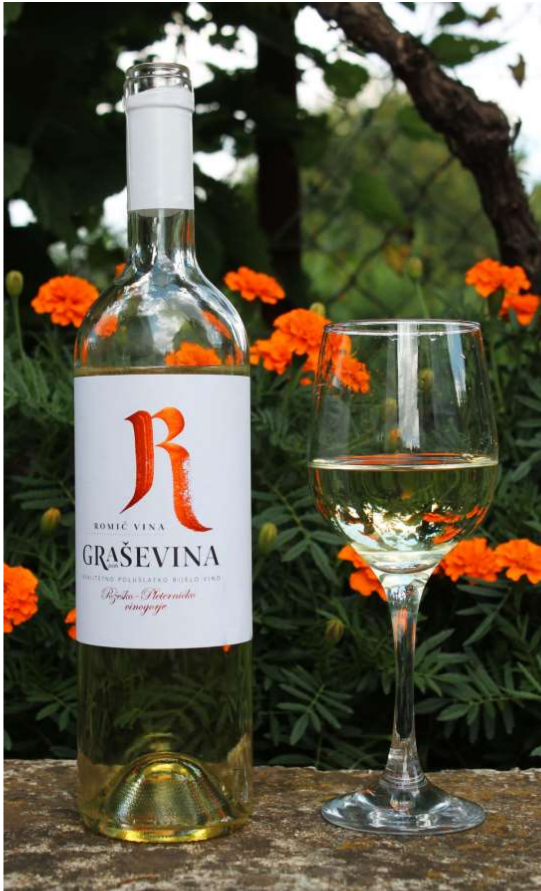
Slika 16: Autorska fotografija – Vina Romić Graševina, poluslatko bijelo vino