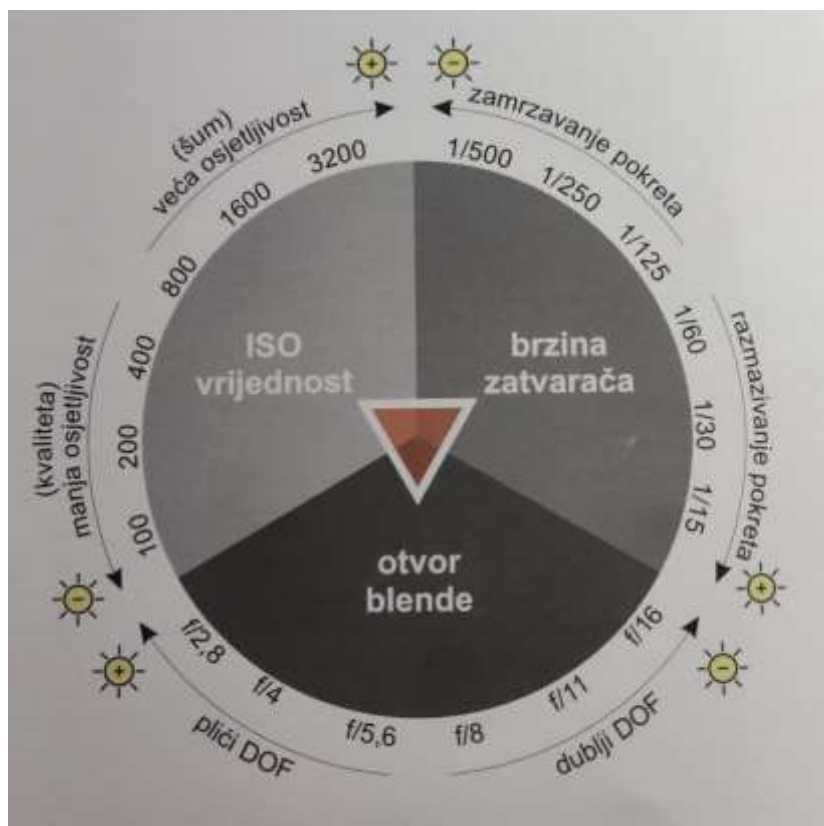
Slika 3: Shema ekspozicijskog trokuta

Kako bi se mogla napraviti tehnički kvalitetna fotografija, odnosno pravilo osvjetljenja, moraju se uskladiti tri čimbenika ekspozicije. "Ekspozicija će ovisiti o f-broju, tj. o otvorenosti objektiva (količini svjetlosti koju propušta objektiv), o vremenu osvjetljavanja senzora (to vrijeme određuje zatvarač, tj. koliko je dugo otvoren) i ISO vrijednosti (osjetljivost senzora na svjetlo)." 5