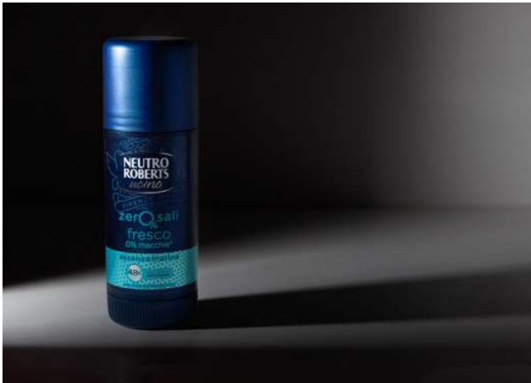
Slika 6: Primjer postizanja kompozicije korištenjem svjetla i sjene

Kompozicija se također može postići korištenjem svjetla i sjene. Treba znati dobro manipulirati svjetlom kako bi se stvorila kvalitetna kompozicija. Potrebno je postići najveći kontrast tamo gdje želimo privući najviše pažnje, dakle na proizvod, a okolinu najviše ostaviti u sjeni. Iako je najvažnije osvijetliti proizvod, ne možemo svo svjetlo zadržati samo na njemu, treba se igrati sa sjenama i pustiti da padnu posvuda. Za kvalitetan rezultat, najvažnija je ravnoteža, odnosno balans između svjetla i sjene. Treba poznavati proizvod kako bi znali postići tu pravilnu ravnotežu jer isticanje proizvoda svjetlom može biti vrlo korisno, no, u nekim situacijama može biti i previše dramatično.