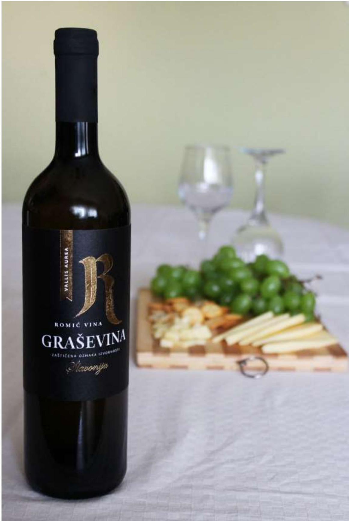
Slika 17: Autorska fotografija – Vina Romić Graševina, suho bijelo vino