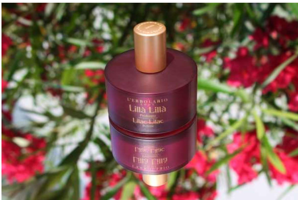
Slika 10: L'erbolario Lilla Lilla