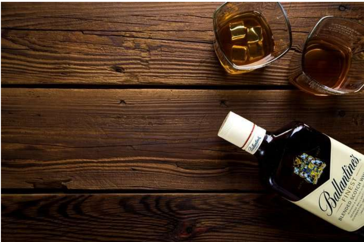
Slika 4: Primjer negativnog prostora u fotografiji proizvoda

Kod fotografije proizvoda se često zna ostavljati negativan prostor koji pozornost usmjerava na sam proizvod. Također taj prostor je vrlo koristan kada je u pitanju produkt fotografija jer se takve fotografije koriste za reklamiranje proizvoda te se u naknadnoj obradi često dodaje tekst, a ostavljanjem negativnog prostora to se može napraviti na jednostavan način. Iako je negativan prostor u određenim situacijama vrlo koristan, treba paziti kako se njime služi i kako ga postići na pravilan način.