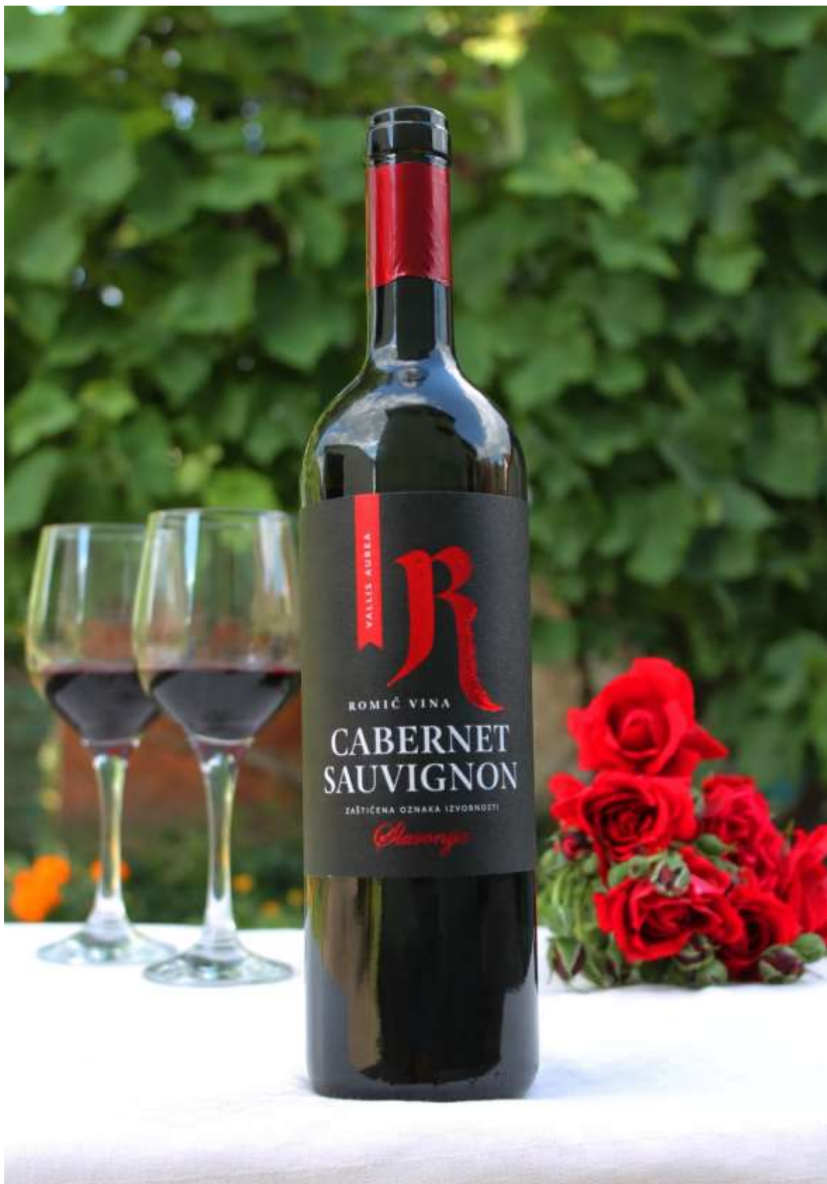
Slika 18: Autorska fotografija – Vina Romić Cabernet Sauvignon