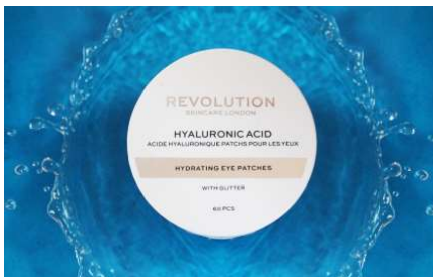
Slika 21: Autorska fotografija – Revolution Hyaluronic acid Hydrating eye patches – Fotografija prije i poslije naknadne obrade

Na fotografiji proizvoda Revolution Hyaluronic acid Hydrating eye patches uređeni su određeni dijelovi fotografije kako bi izgledala privlačnije potencijalnim kupcima. Desni dio originalne fotografije na kojemu je prikazana raspršena voda je kopiran te prenesen na lijevu stranu fotografije kako bi se postigla simetrija te željeni efekt. Na plohi na samom proizvodu na kojemu je napisan naziv proizvoda "Hydrating eye patches" uklonjena je neželjena refleksija u desnome kutu, popravljene su boje te su uklonjena manje smetnje koja su prisutne radi oštećenja proizvoda. Također je u manjim omjerima povećan intenzitet svjetlosti, kontrasta i boje kako bi fotografija izgledala privlačnije.