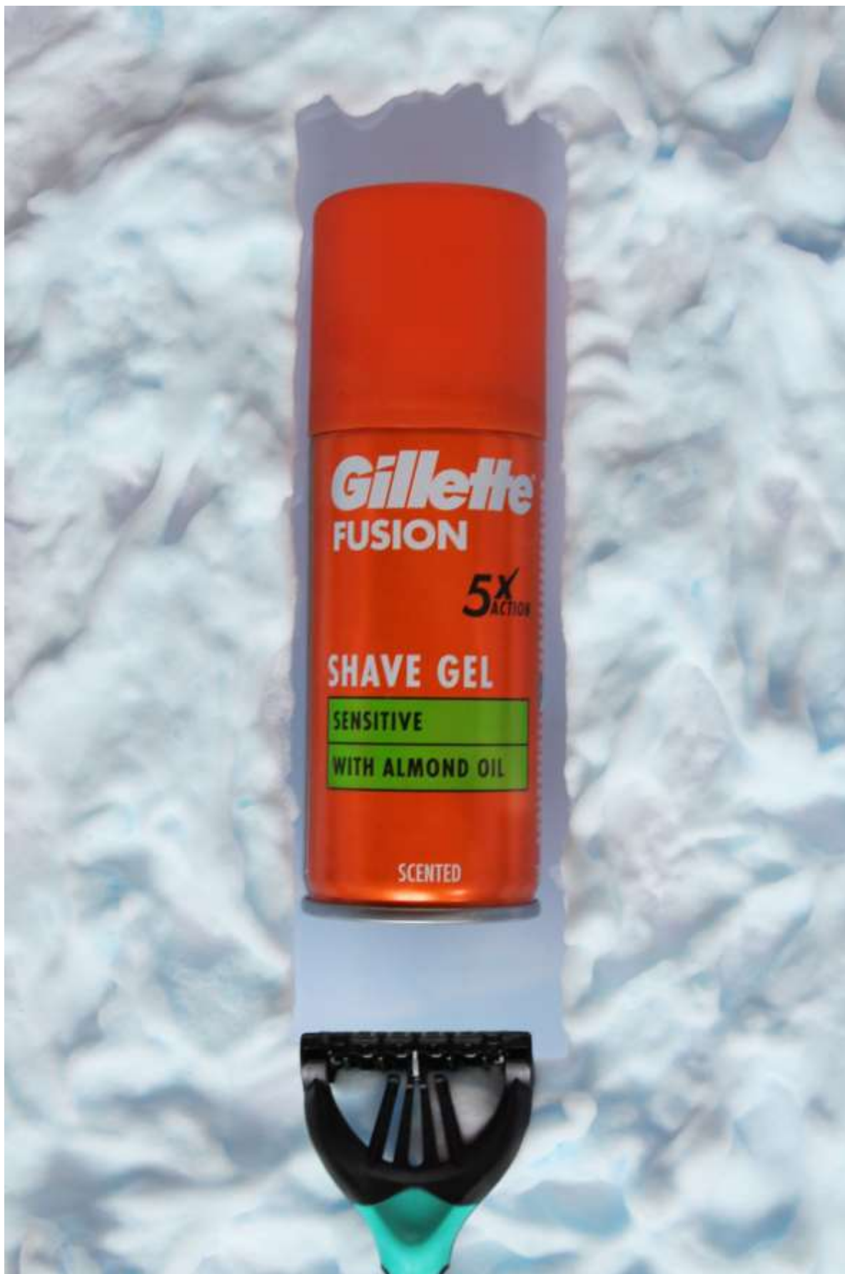
Slika 11: Gillette Shave gel