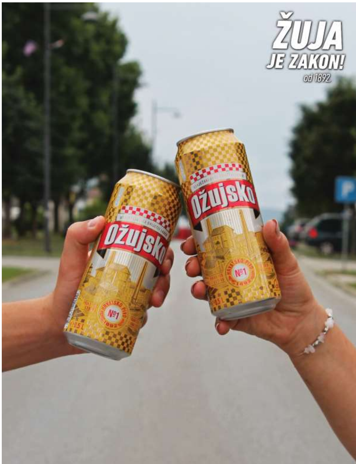
Slika 13: Ožujsko