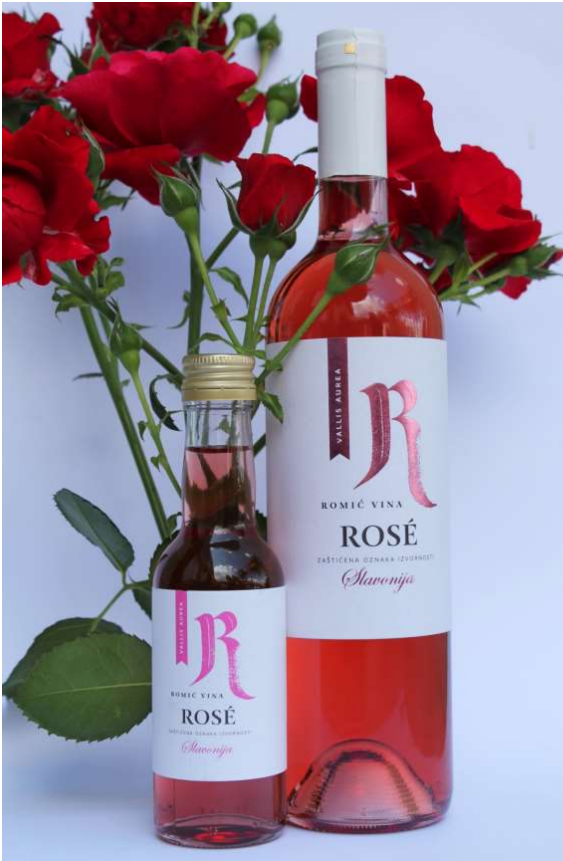
Slika 19: Autorska fotografija – Vina Romić Rose