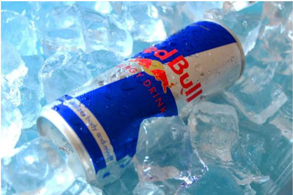
Slika 14: Autorska fotografija – Red Bull