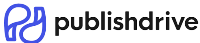
Slika 11. Publish Drive logo

Jedna od mlađih tvrtki, osnovana je 2015. u Mađarskoj, ali je sada u američkom vlasništvu., no još uvijek ima urede i u Budimpešti. Osnovala ga je Kinga Jenetics kako bi objavila svoj magistarski rad te da pomogne drugim autorima u ostvarenju svojih snova. Omogućavaju fokus na najvažniji dio izdavanja, a to je stvaranje tog sadržaja, dok će operativni dio biti riješen od strane tvrtke. Publish Drive je jedan od glavnih agregatora koji su odobrili Apple i Google što ga čini centrom za globalnu distribuciju. Nude 100% profit od sadržaja, uz plaćanje mjesečne pretplate ili fiksnu stopu od 10% na cjelokupnu prodaju ukoliko nema mjesečne pretplate [16].