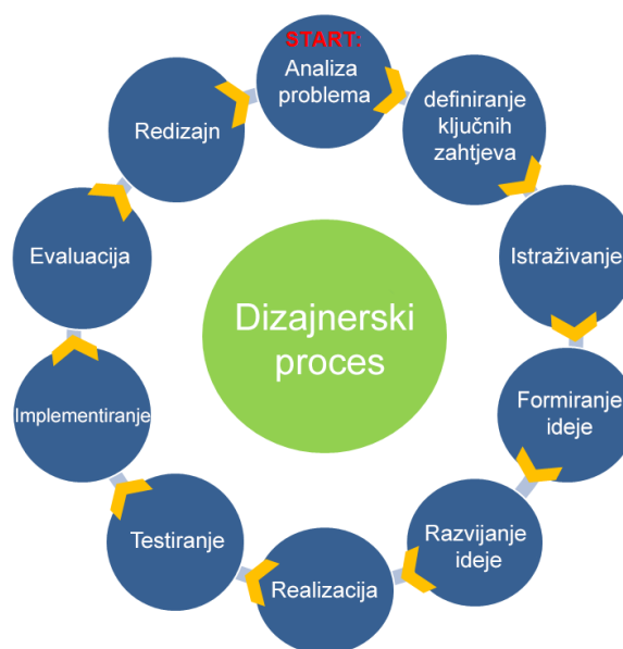
[13] Slika 5. Shematski prikaz održivog dizajnerskog procesa

Dizajnerski proces na ovaj način formira spiralu čiji svaki slijedeći ciklus sadrži sve više informacija i postaje osnova za slijedeći ciklus upravo onako kako funkcionira evolucija bilo kojeg prirodnog sistema.