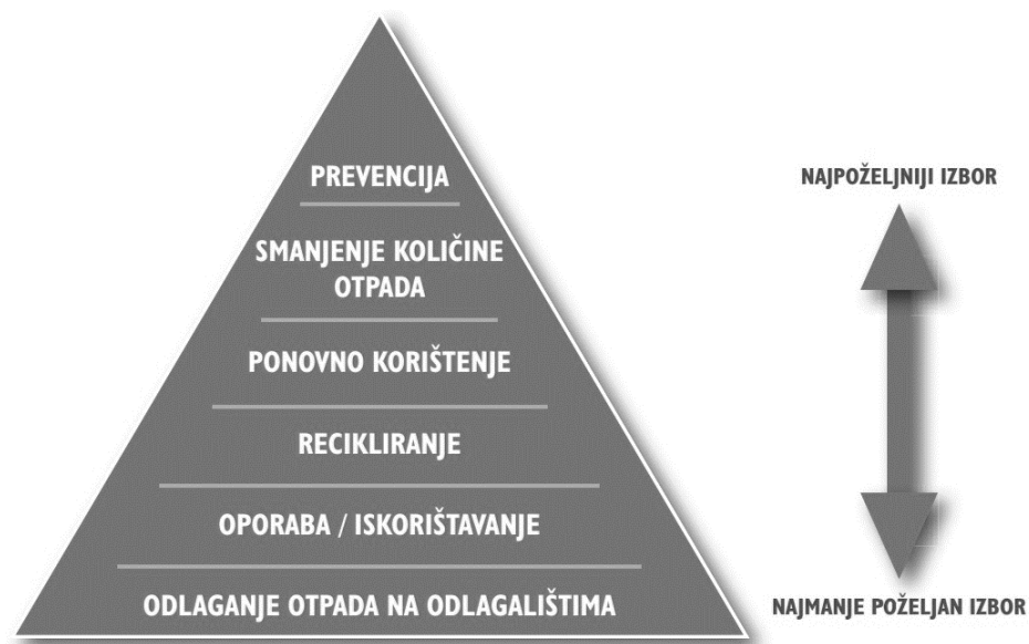
Slika 1. Hijerarhija gospodarenja otpadom [5]

Hijerarhijom gospodarenja otpadom u načelu se određuje slijed prioriteta u skupini najboljih opcija za okoliš u okviru okolišnog zakonodavstva i okolišne politike, pri čemu odstupanje od te hijerarhije može biti nužno za pojedine tokove otpada, tamo gdje je to opravdano na temelju razloga koji uključuju, među ostalim, tehničku izvedivost, gospodarsku održivost i zaštitu okoliša.