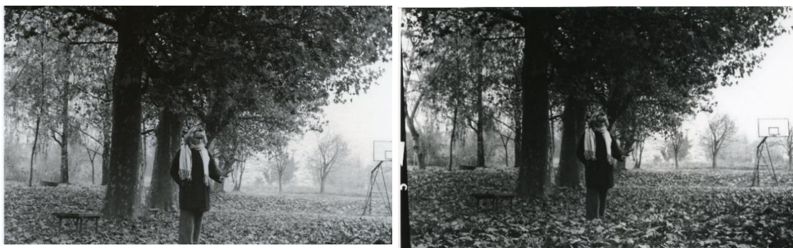
Slika 38: a) Dorotea_filter4_foma, b)Dorotea_filter4_IIFord