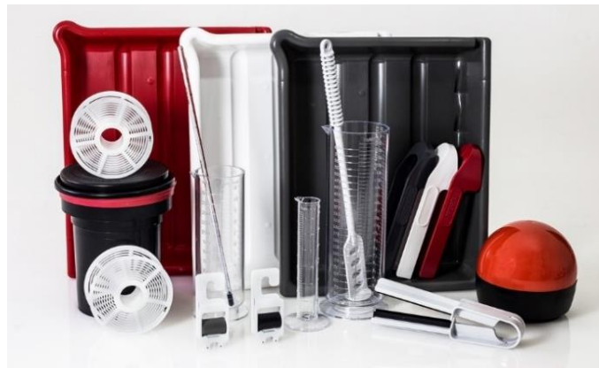
Slika 4: Oprema za razvijanje film