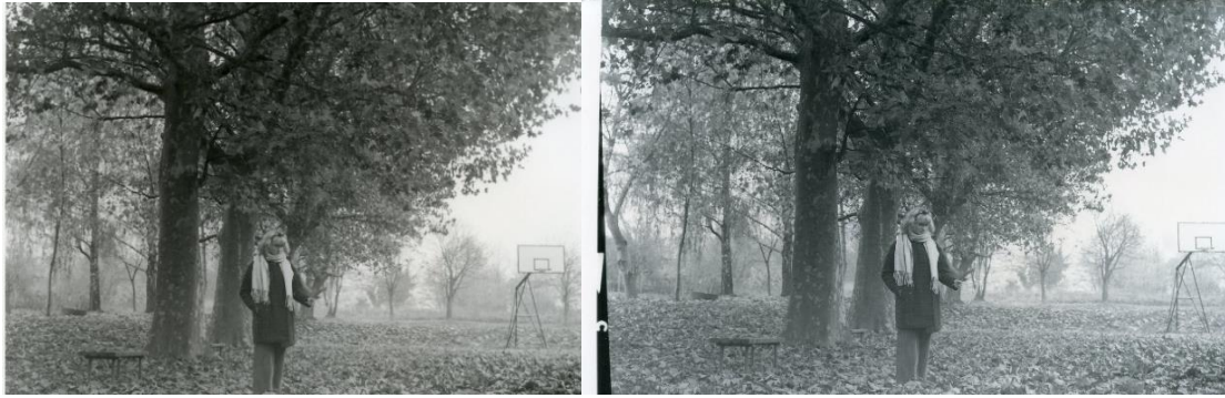
Slika 35: a) Dorotea_filter1_foma, b)Dorotea_filter1_IlFord

Unatoč tomu, fotografije na IlFord -ovim papirima izgledaju čišće iako imaju veću zrnatost fotografije. Također, postoji i veći raspon sive. Na njima su detalji za isti filter jasnije prikazani i sveukupno fotografija na ovim papirima izgleda ljepše, izgleda više vintage i to joj daje posebnost.