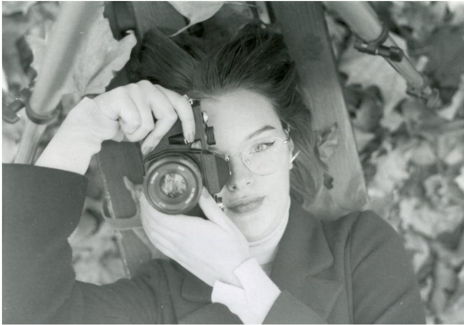
Slika 10: Ana_filter1_foma