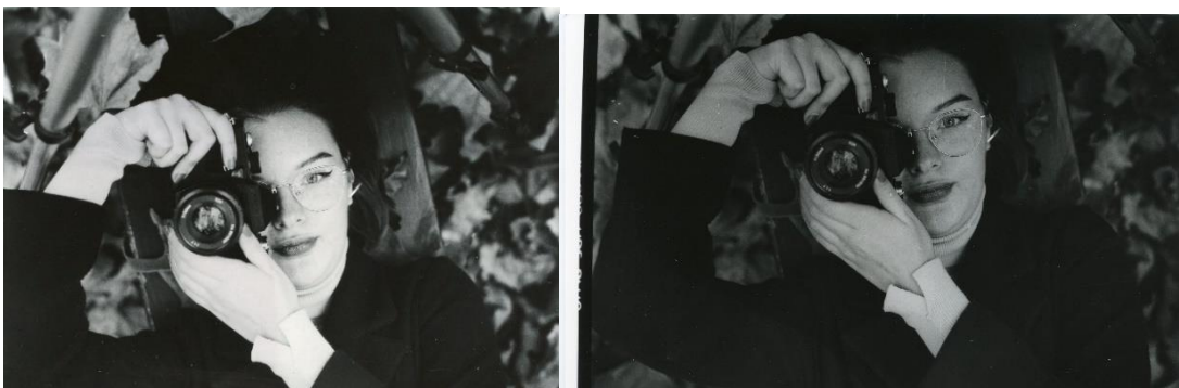
Slika 33: a) Ana_filter4_foma, b)Ana_filter4_IIFord