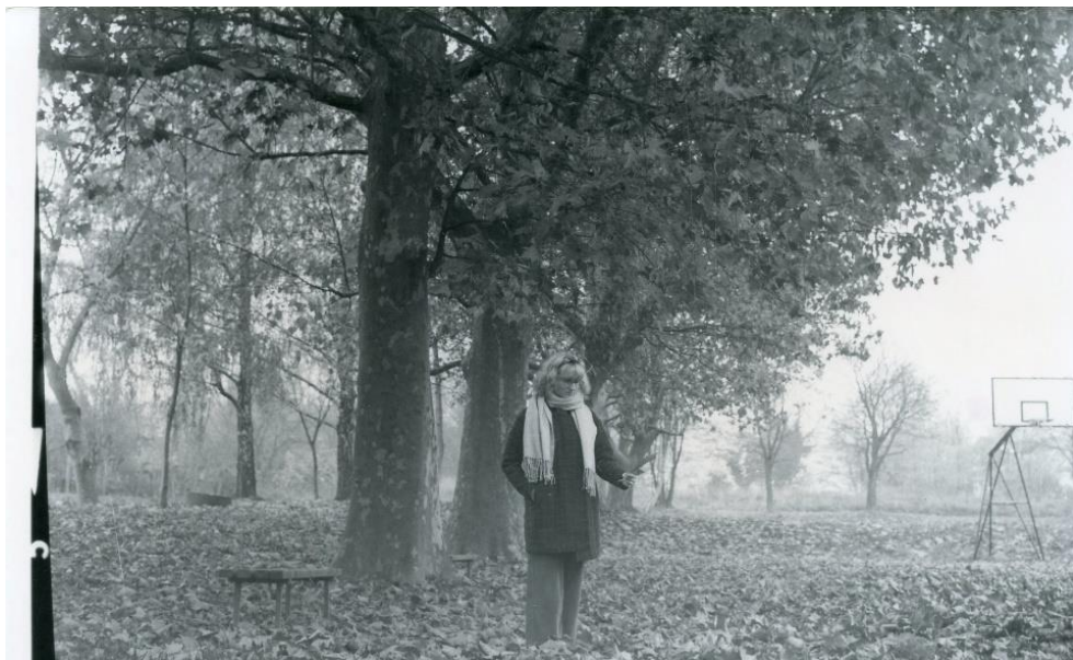
Slika 21 : Dorotea_filter1_IIFord

Kao rezultat korištenja filtera 1 dobiju se svijetle fotografije kod kojih su kontrast i gustoća zacrnenja slabi. Slika 20 ima ispran efekt, ali sve nijanse su se lijepo uklopile i fotografija izgleda lijepo, ima šum koji joj daje posebni efekt, a isto to postignuto je i na