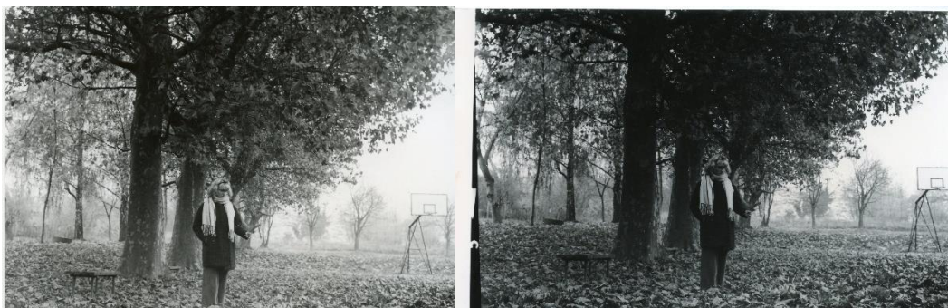
Slika 37: a) Dorotea_filter3_foma, b)Dorotea_filter3_IlFord