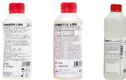
Slika 7: a)Fomadon LQN, b)Fomatol LQN, c)Fomafix

Korišteni razvijач za film je Fomadon LQN (slika 7a), a razvijач za fotoosjetljivi papir je Fomatol LQN (slika 7b). Nakon razvijanja sliku na filmu i papiru bilo je potrebno fiksirati, a taj korak se izvodio korištenjem Fomafix fiksira (slika 7c). I razvijач i fiksir su koncentracije koji se miješaju sa vodom u određenom omjeru prema uputama proizvođača.