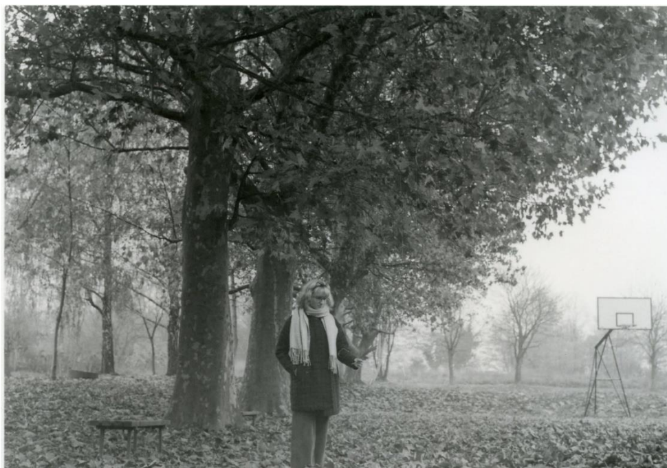
Slika 11: Dorotea_filter1_foma

Slika 10 predstavlja fotografiju motiva portreta koja je razvijena na Foma multigrade papiru koji je osvjtljen kroz filter 1. Filter 1 je najmekši filter kojim se dobivaju slabi kontrasti na fotografiji i zbog toga se fotografija doima blijedo, ima „isprani“ efekt, te se radi slaboga kontrasta detalji gube i manje dolaze do izražaja. Ovaj filter se koristiti za postizanje maglovitog i blijedog efekta jer se njime dobivaju najsvjetlije fotografije, ali za prikazivanje detalja nije najbolja opcija.