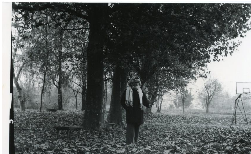
Slika 25 : Dorotea_filter3_IIFord

Slike 24 i 25 dobivene su razvijanjem pod filterom 3 na IIFord papiru. Fotografije dobivene s ovim filterom imaju veliki kontrast i gustoću zacrnljenja pa na nekim mjestima može doći do gubitka detalja. Na fotografiji 24 sa ovim filterom je postignut odličan kontrast kojim je oko došlo do lijepog izražaja, lišće u pozadini se lijepo vidi, a ten izgleda prirodno. Na slici 25 ovim filterom je također postignut dobar kontrast, što je vidljivo na lišću, međutim mjesta koja su u sjeni ovim se filterom na njima skroz izgubili detalji.