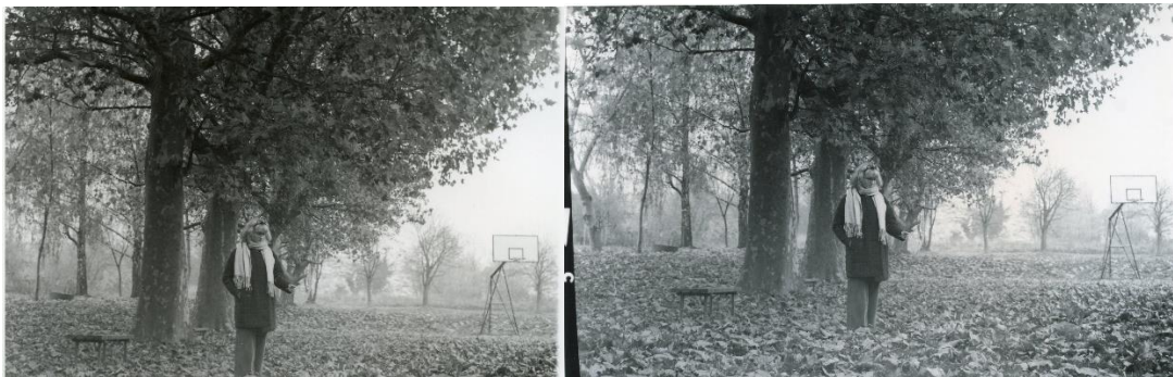
Slika 36: a) Dorotea_filter2_foma, b)Dorotea_filter2_IlFord