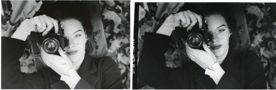
Slika 32: a) Ana_filter3_foma, b)Ana_filter3_IIFord