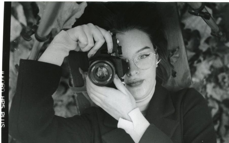
Slika 22 : Ana_filter2_IIFord