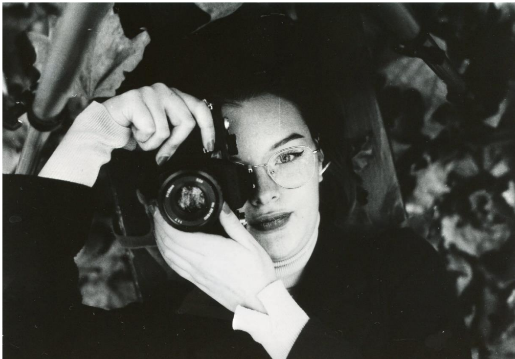
Slika 18 : Ana_filter5_foma