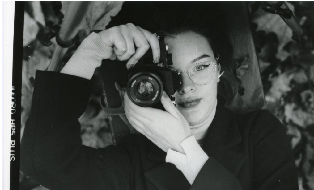
Slika 33 : Ana_split-filtering_IIFord

Na slikama 32 i 33 su prikazane fotografije dobivene tehnikom split-filtering-a. Fotografije su prvo razvijene pod filterom 2 kako bi se postigli lijepi tonovi i malo smanjila gustoća zacrnjenja na tamnijim dijelovima slike, a potom pod filterom 4 kako bi s pravom količinom kontrasta detalji došli do izražaja. Slika 32 je razvijena na Foma fotoosjetljivom papiru, a slika 33 na IIFordu. Međusobnom usporedbom fotografije vidljivo je da su u oba slučaja „zahtjevi“ split-filtering-a zadovoljeni, odnosno, na obje fotografije ostvarena je dobra svjetlina, ten izgleda prirodno, oko se dobro vidi, čisto je, i lišće je dobro prikazano. Ipak, bolji efekt je ostvaren na slici 33 na IIFord-ovom papiru jer je ostvaren malo bolji kontrast, a i detalji su došli do boljeg izražaja (rukav, oko) te zbog šuma koji se ostvaruje na IIFord-ovim papirima, fotografije u kompletu izgledaju ljepše i prirodnije.