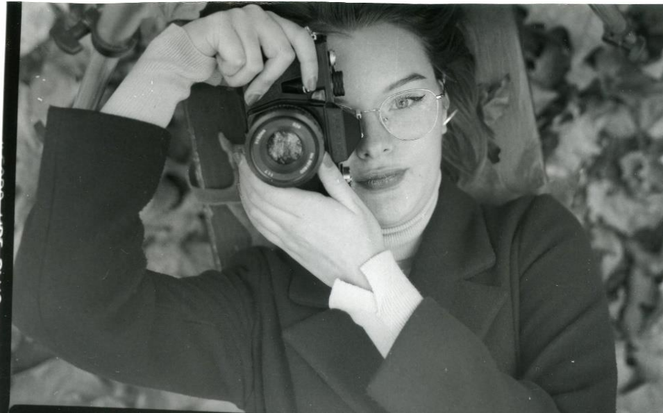
Slika 20 : Ana_filter1_IIFord