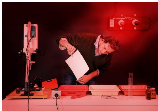
Slika 5: Proces i uređaji za razvijanje fotografije

Nakon što je fotoosjetljiv papir osvjetljen, potrebno ga je razviti kemijskim postupkom u razvijaju. Temperatura bi trebala biti oko 20°C i što je temperatura viša to će vrijeme razvijanja biti kraće i obrnuto. Razvijaj se nabavlja u koncentratu i potrebno ga je prije korištenja razrijediti s vodom prema uputama proizvođača. Razvijajka komponenta reagira s osvjetljenim srebrom halogenidima u emulziji i pretvara ih u crno metalno srebro. Prilikom razvijanja, papir u potpunosti treba biti uronjen u razvijaj i potrebno je konstantno miješanje razvijaja kako bi ravnomjerno dolazio do svih dijelova papira. Postupak razvijanja traje otprilike 3 minute, a nakon toga papir se prebacuje u prekidač. Prekidač je obična, destilirana, voda ili poseban prekidač razvijanja u kojem papir stoji 30-ak sekundi kako bi se s njega skinulo razvijaj i na taj način spriječilo njegovo prenošenje u fiksir. U fiksiru papir stoji nekoliko minuta pri čemu fotografija postaje stabilna na svjetlo i nakon fiksiranja fotografiju je moguće gledati po dnevnim svjetlom, a ne samo pod zaštitnim. Nakon fiksiranja papir je potrebno još jednom isprati običnom vodom nakon čega se stavlja na sušenje [3, 10] (slika 5).