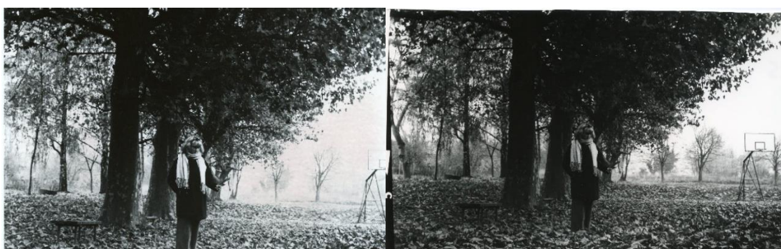
Slika 39: a) Dorotea_filter5_foma, b)Dorotea_filter5_IIFord