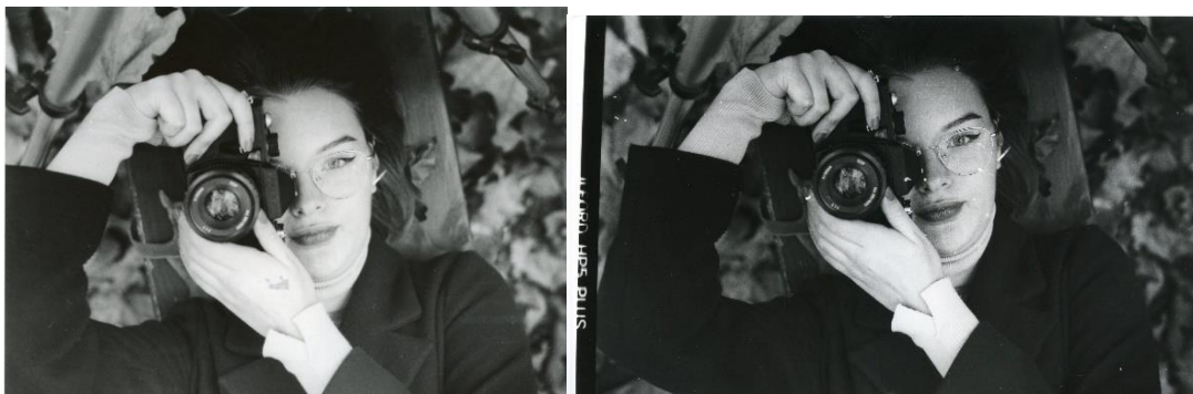
Slika 32: a) Ana_filter3_foma, b)Ana_filter3_IIFord