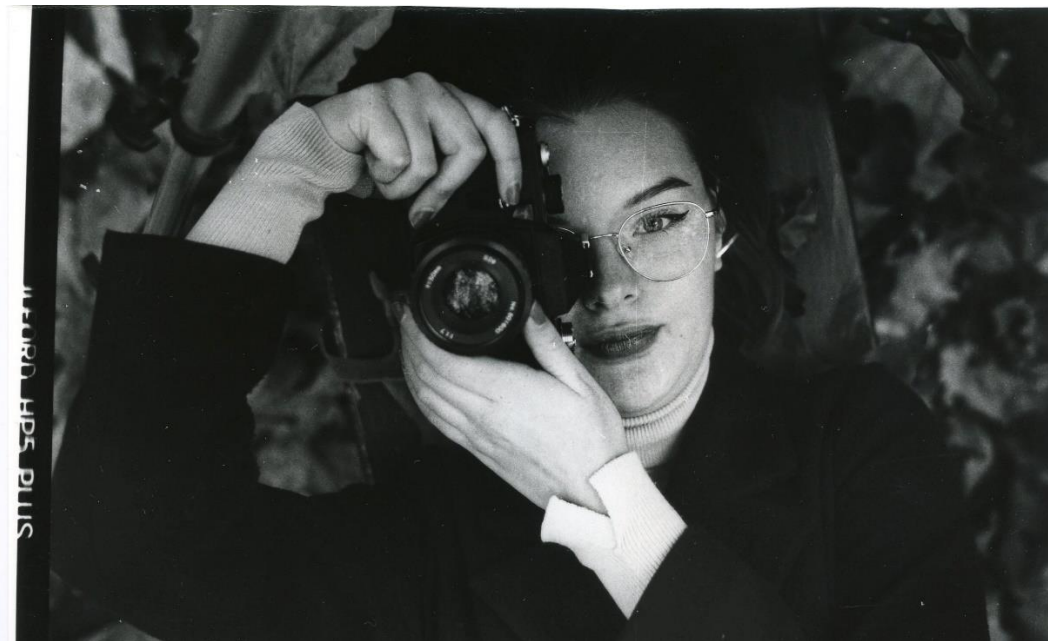
Slika 28 :Ana_filter5_ILFord