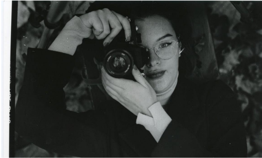
Slika 26 : Ana_filter4_IIFord