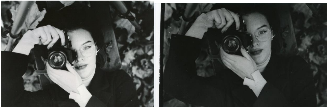
Slika 33: a) Ana_filter4_foma, b)Ana_filter4_IIFord