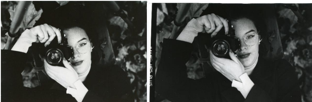
Slika 34: a) Ana_filter5_foma, b)Ana_filter5_IIFord

Na slikama 30, 31, 32, 33, 34, 35, 36 37, 38 i 39 prikazane su jedna kraj druge fotografije razvijene pod istim filterom na IIFord i Foma fotoosjetljivom papiru u svrhu njihove međusobne usporedbe. Razlika između te dvije vrste papira je najvidljivija u svjetlini dobivene fotografije, odnosno, vidljivo je da fotografija razvijena na IIFord-ovom papiru pod istima filterom, za svaki filter, je tamnija nego fotografija razvijena na Foma-inom papiru. Zbog toga dolazi do veće gustoće zacrtnjenja i kontrasta na IIFord-ovim papirima.