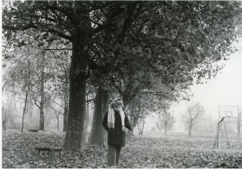
Slika 15: Dorotea_filter3_foma

Na slikama 14 i 15 su prikazane fotografije razvijene kroz filter 3. Filter 3 je „zlatna sredina“ za razvijanje fotografija snimljenih pri normalnom izvoru svjetla (da fotografija nije podeksponirana ili preekspozicionirana). Filterom 3 mogu se dobiti jasni prikazi detalja, dobar omjer svijetlih i tamnih područja na fotografiji, tj. dobar kontrast i gustoća zacrnenja i fotografija izgleda prirodno. Na slici 14 se vidi da je oko, centar fotografije, u odnosu na fotografije razvijene pod filterom 1 i 2, došlo do većeg izražaja te se vide detalji u oku, lice i ruke imaju prirodnu boju, a kod lišća u pozadini postignut je dobar kontrast. Ista stvar je postignuta i na slici 15 gdje je lišće na fotografiji jasno vidljivo, subjekt je također jasno vidljiv, a sve je to postignuto odgovarajućim kontrastom. Pod ovim filterom su vidljivi i detalji kao što su pruge na kaputu, te male grančice u pozadini na drveću, a magla u pozadini je još izraženija.