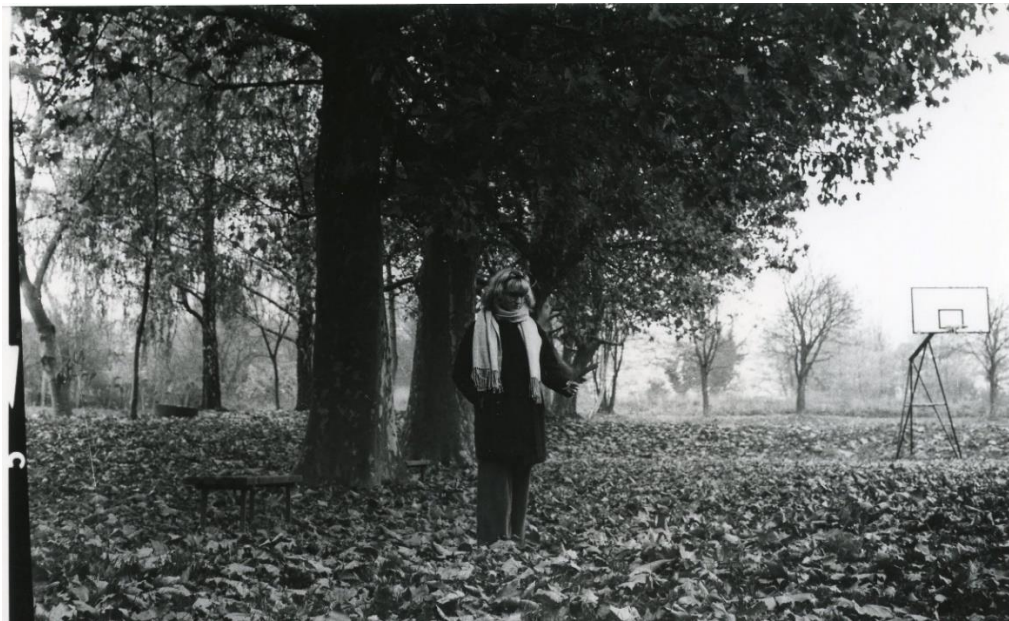
Slika 27 : Dorotea_filter4_IIFord

Prikazane slike dobivene su razvijanjem pod filterom 4 na IIFord papiru. Ovim filterom je postignut još veći i jači kontrast i gustoća zacrtnjenja u odnosu na filter 3, svjetlina je mala, a detalji se gube. Na slikama 26 i 27 dobro se vidi da se sa ovim filterom mogu i dalje dobiti dobri prikazi detalja, koji imaju dobru oštrinu, kao što je oko ili lišće, međutim