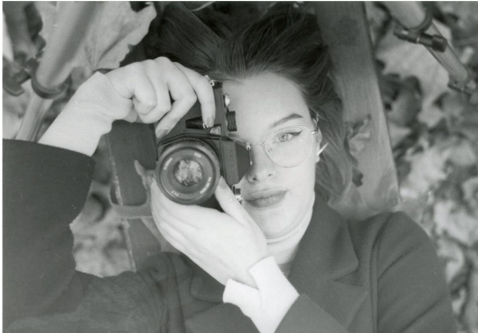
Slika 12 : Ana_filter2_foma