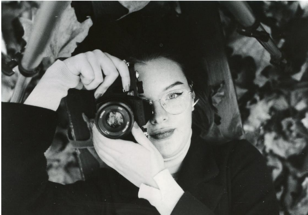
Slika 16 : Ana_filter4_foma