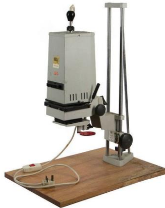
Slika 6: Aparat za povećanje Krokus 66

Za potrebe ovog rada fotografije su snimane fotoaparatom Yashica Mat-124G, a to je dvoooki refleksni fotoaparat srednjeg formata (slika 1). Korišten aparat za povećanje je Krokus 66 (slika 6).