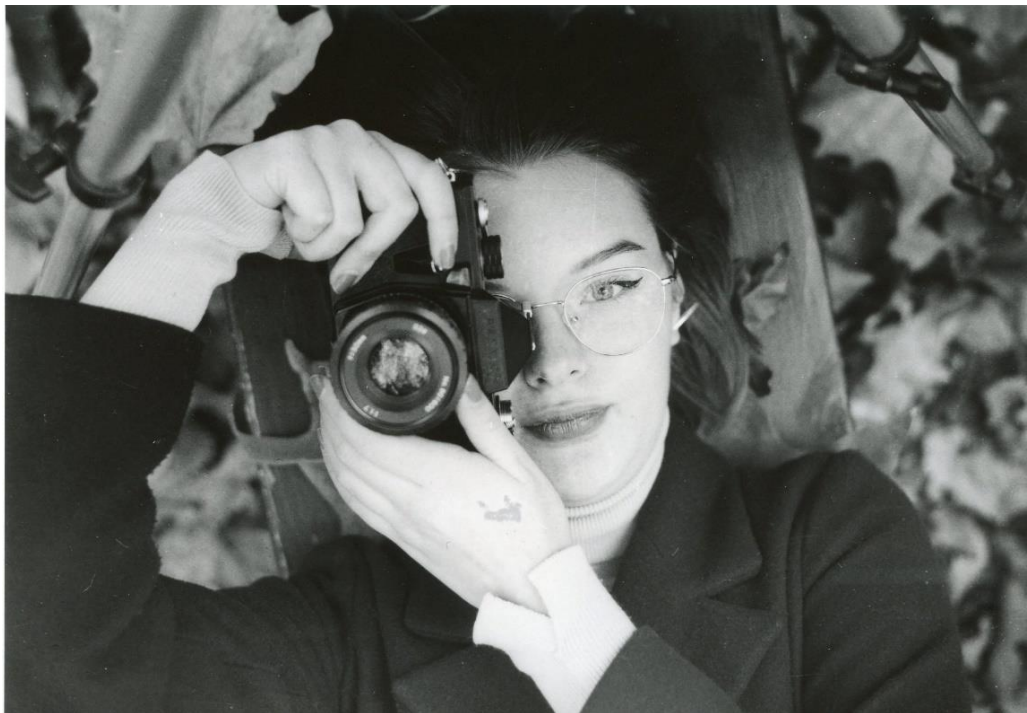
Slika 14: Ana_filter3_foma