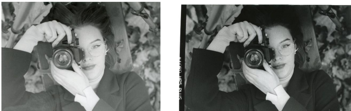
Slika 31 : a) Ana_filter2_foma, b)Ana_filter2_IIFord