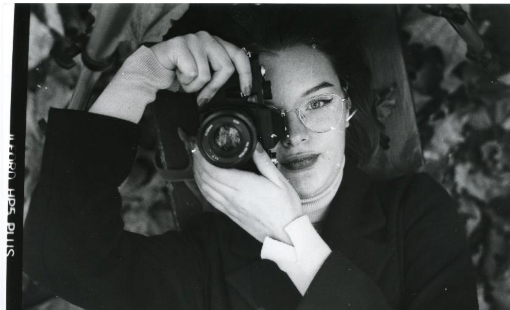
Slika 24 : Ana_filter3_IIFord