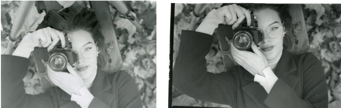
Slika 30 : a) Ana_filter1_foma, b)Ana_filter1_IIFord

Za bolju usporedbu razvijenih fotografija, na dvije različite vrste papira, slike osvjetljavane sa istim filterom su prikazane jedna kraj druge.