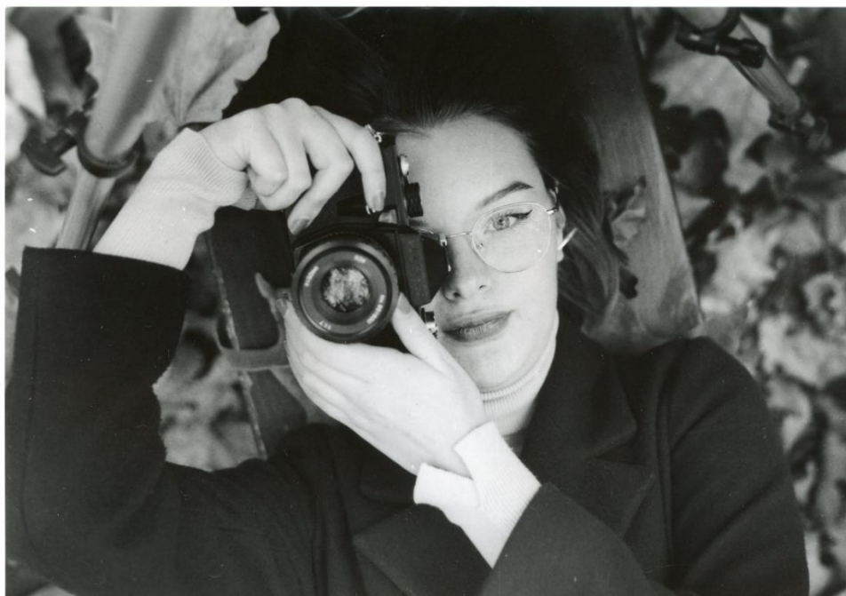
Slika 32 : Ana_split-filtering_Foma