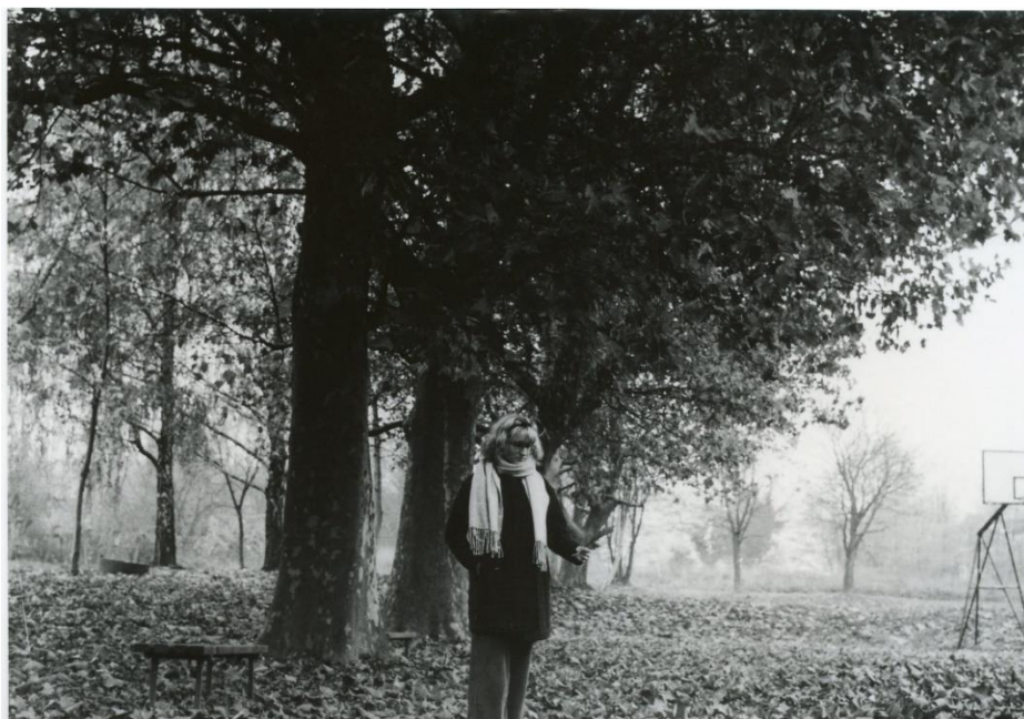
Slika 34 : Dorotea_splitfiltering_Foma