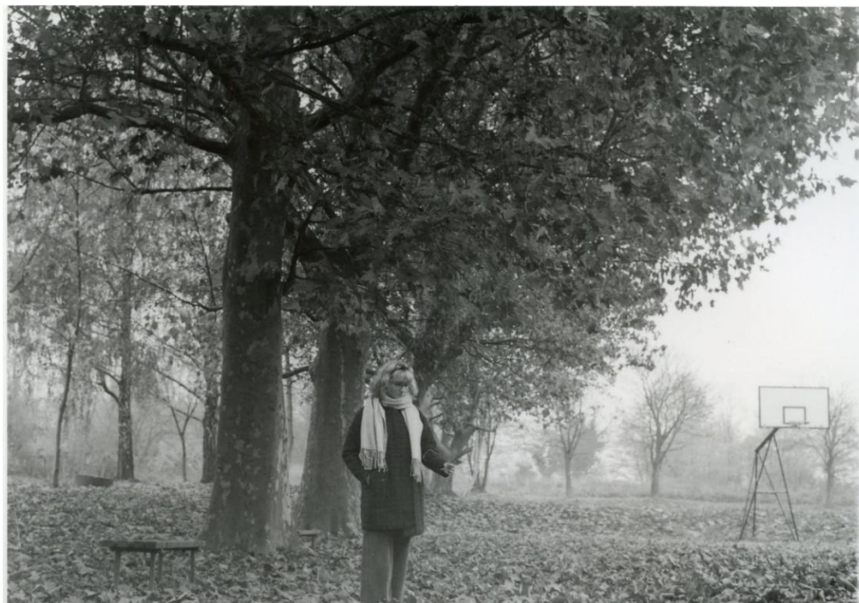
Slika 13 : Dorotea_filter2_foma

Na slikama 12 i 13 prikazane su fotografije razvijene kroz filter 2. Ovaj filter u odnosu na filter 1 je daje malo bolje rezultate jer je malo tvrdi, daje veći kontrast fotografiji,