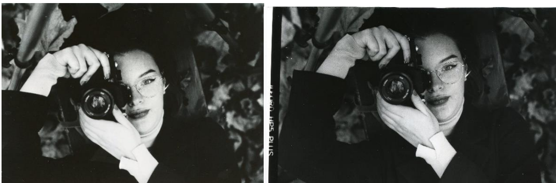
Slika 34: a) Ana_filter5_foma, b)Ana_filter5_IIFord

Na slikama 30, 31, 32, 33, 34, 35, 36 37, 38 i 39 prikazane su jedna kraj druge fotografije razvijene pod istim filterom na IIFord i Foma fotoosjetljivom papiru u svrhu njihove međusobne usporedbe. Razlika između te dvije vrste papira je najvidljivija u svjetlini dobivene fotografije, odnosno, vidljivo je da fotografija razvijena na IIFord-ovom papiru pod istima filterom, za svaki filter, je tamnija nego fotografija razvijena na Foma-inom papiru. Zbog toga dolazi do veće gustoće zacrnjenja i kontrasta na IIFord-ovim papirima.