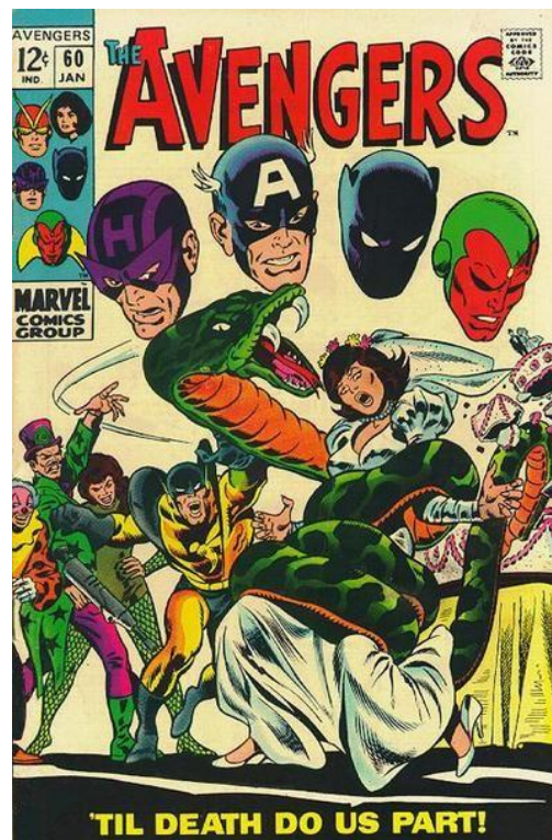
Slika 9. The Avengers, Marvel Comics