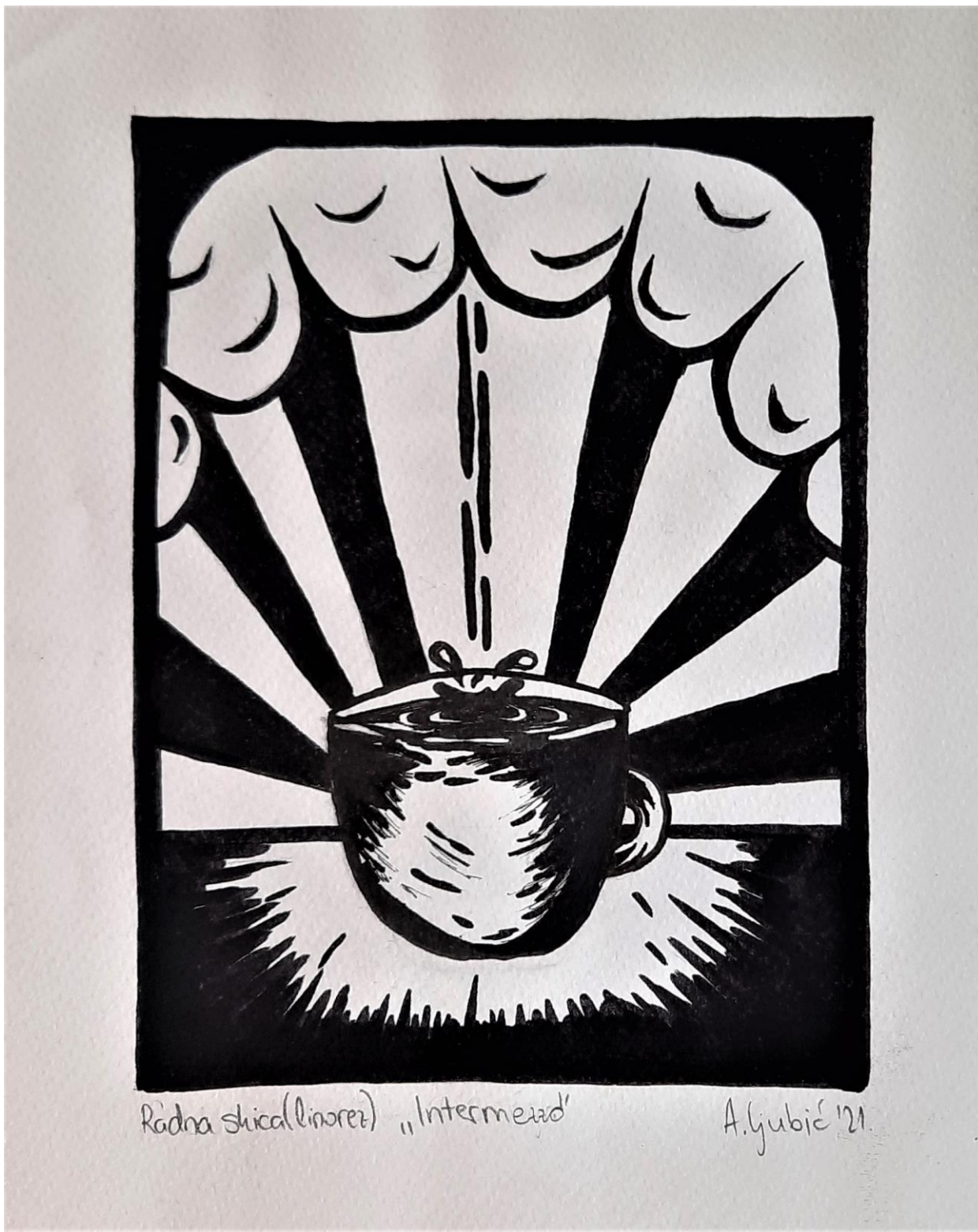
Slika 11. Druga radna skica