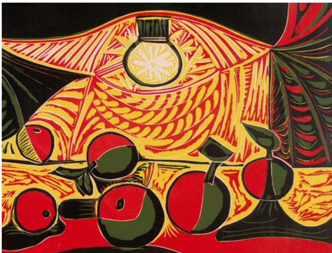
Slika 2. Linorez, P. Picasso, Mrtva priroda pod lampom

Linorez je grafička tehnika visokoga tiska gdje se crtež urezuje u ploču od linoleuma a potom otisne na papir. Često se koristi za plakate, ilustracije i dekorativnu grafiku zbog jednostavnog i brzog postupka . Izvodba mu je u izraženim kontrastima svijetlih i tamnih površina u jednoj ili više boja. [3]