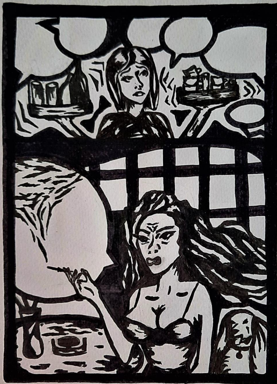
Radna skica (linorez) „Prva scena” A. Jubić '21.