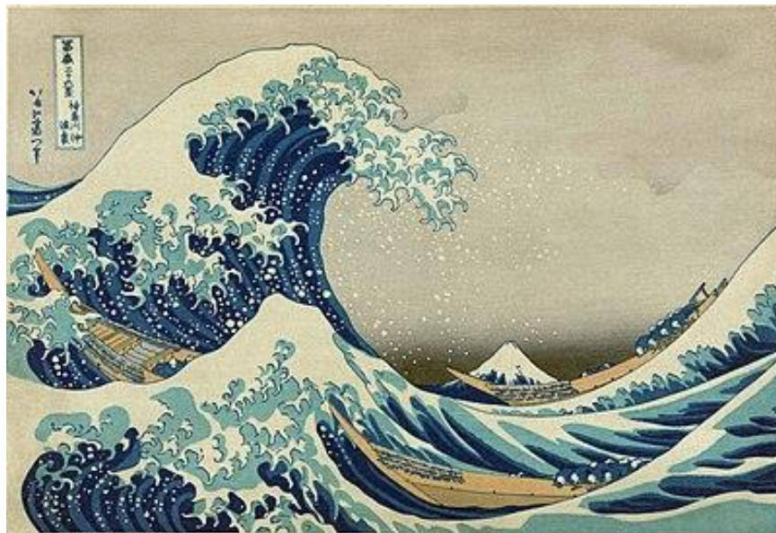
Slika 1. Drvorez u boji, Katsushika Hokusai, Veliki val kod Kanagawe

ilustracije u tiskanim knjigama. U Japanu se drvorez pojavljuje već u 10. stoljeću i s njime specifičan japanski umjetnički izraz. [2]