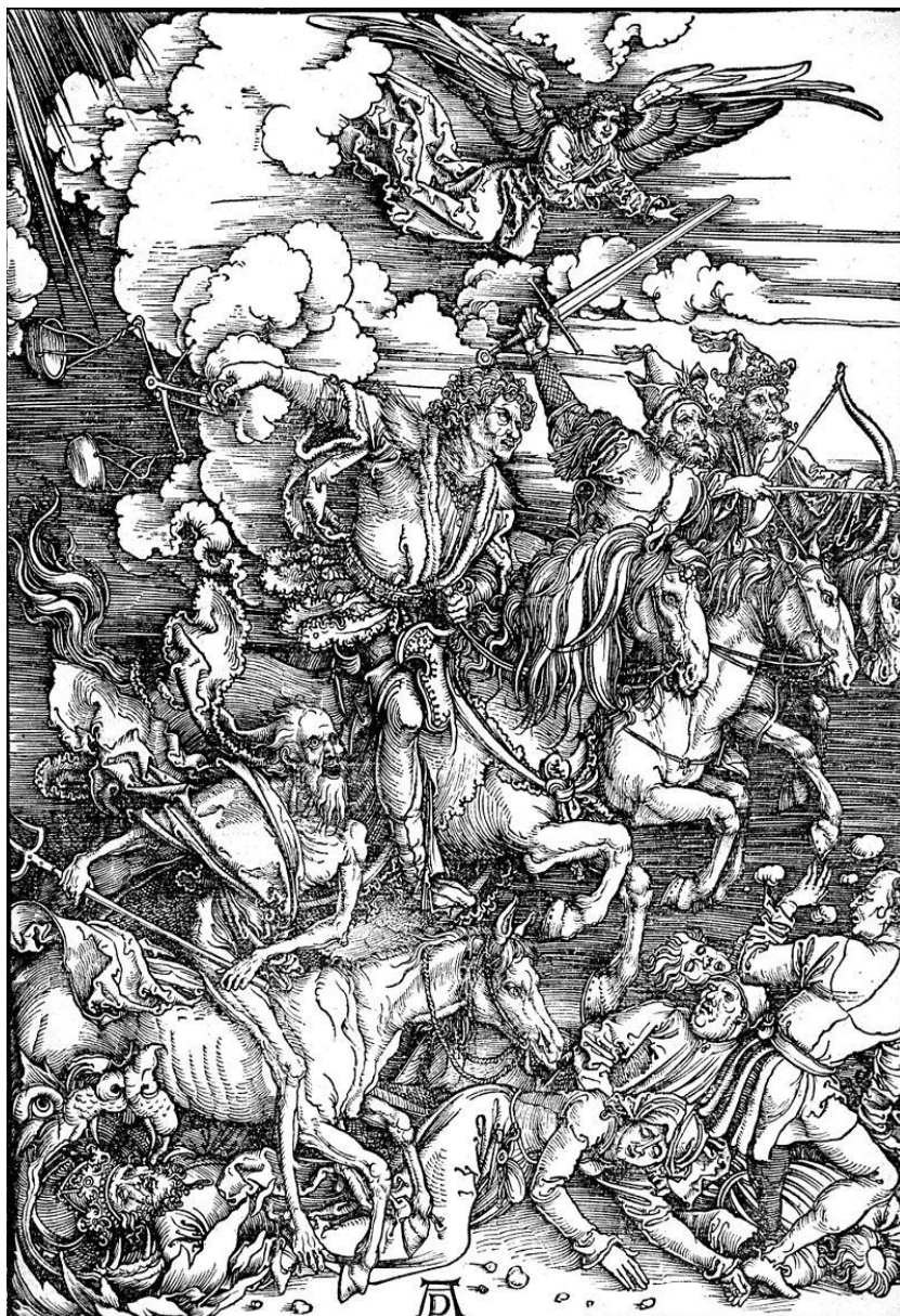
Slika 3. Drvorez, Dürer, Četiri jahača apokalipse

ploči koja se premaže prethodno razrijeđenom bijelom temperom na koju se nanese crtež, a površine koje će biti otisnute prevlače se tušem. Zatim se u dubini 2 mm izdube površine koje nisu pokrivenne crtežom. Ploča na kojoj se matrica crteža reljefno izdiže zatim se premaže bojom, a na ploču se položi ovlažen papir koji se trlja tvrdim zaobljenim predmetom. [4]