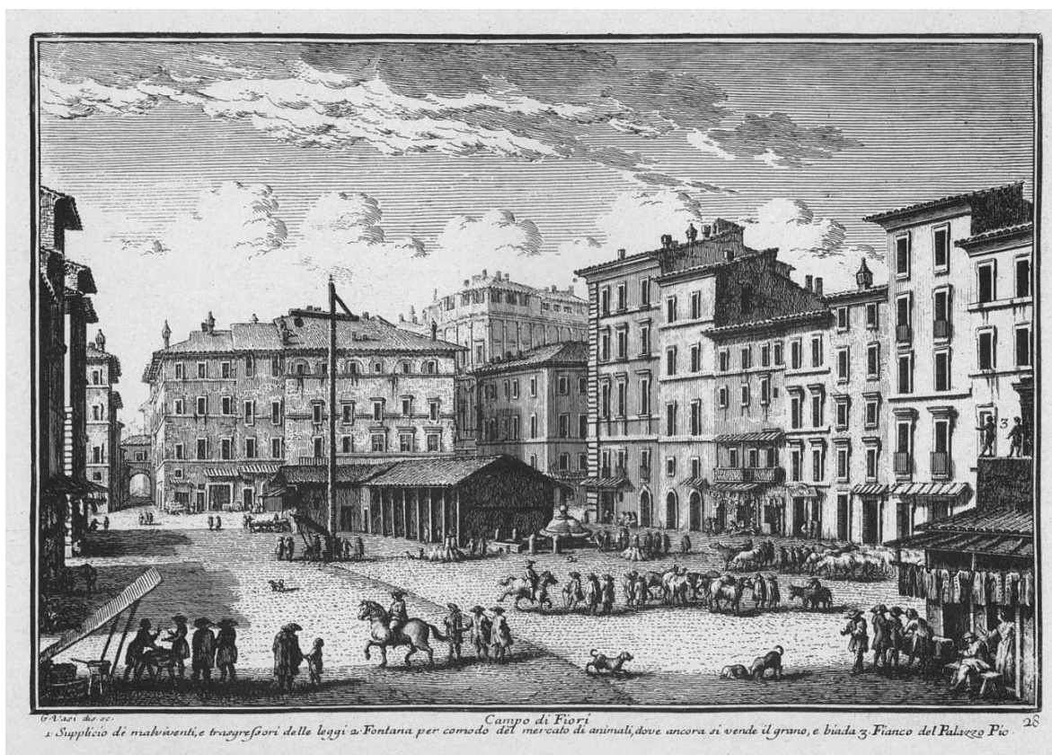
Slika 4. Bakropis, Giovanni Vasi, Campo de' Fiori

ploče, dobivamo matricu sa koje će se otiskivati. Matrica se premaže tiskarskom bojom, zatim se sa slobodnih površina odstrani boja tako da ostane samo u udubljenim dijelovima. Na ploču se položi vlažan i elastičan papir, preko njega ide tkanina (filc) i sve zajedno prolazi kroz prešu pod visokim pritiskom. [5]