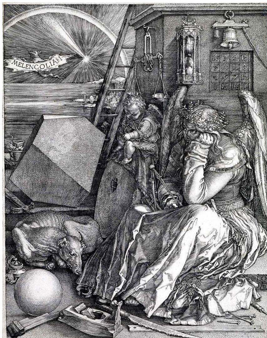
Slika 5. Bakrorez, A. Dürer, Melankolija I

Bakrorez je grafička tehnika dubokoga tiska. Crtež se urezuje direktno dlijetom na bakrenu ploču. Oštri rubovi koji nastaju urezivanjem se izglađuju, ploča se premaže trajnom masnom bojom, koja se sa slobodnih površina obriše i boja ostane samo u urezanim dijelovima bakrene ploče. Na matricu se stavi navlaženi papir, prekrije se filcom i provuče kroz prešu pod velikim pritiskom. [6]