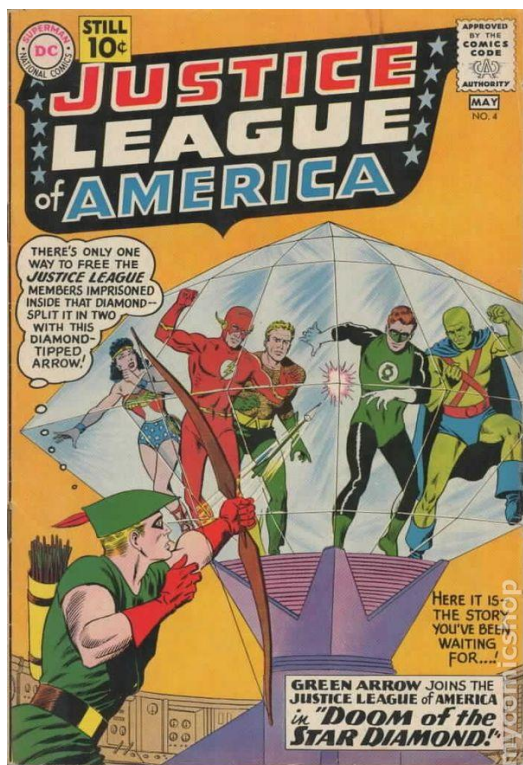
Slika 8. Justice League, DC Comics

superherojima i stripove koji izlaze u novinama ( comics ) i na nevisni strip, koji ustraje na kontra kulturnom nasleđu, comix , i graphic novels . [7]