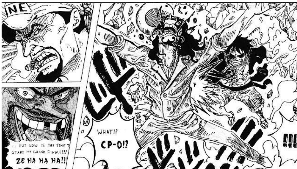
Slika 11. Prizor iz mange One Piece

Japanska tradicija stripa pod nazivom manga (hirovide ili improvizirane slike) datira u 18. stoljeću, ali se u modernom obliku formira sredinom 20. st., a na nju utječe američki strip. Suvremene mange su stripovi koji su masovno dostupni a tiskaju se u ogromnim nakladama i u velikim narativnim serijalima po deset tisuća stranica džepnoga formata. Mange su zato prije svega narativni medij, odnosno crtana književnost; crtež je sporedan uglavnom crno-bijeli i u obliku karikature. Nastaju u raznim žanrovima, a najviše su znanstveno fantastične (o robotima i mechama ), romantične ( shōjo i redisu ), superherojske, homoseksualne i pornografske ( hentai ), a razvrstavaju se na osnovu termina po dobnim skupinama kojima su namijenjene. Tako postoje mange za: djecu ( kodomo ), dječake ( shōnen ), mlađe muškarce od 18. do 30. godine ( seinen ), odrasle muškarce, seksualno eksplicitan sadržaj ( seijin ), djevojčice ( shōjo ), žene ( redisu ) a njih i crtaju žene i ozbiljniji dramski stripovi ( gekiga ), ipak su najpopularnije mange adaptirane u iznimno gledane animirane filmove (tzv. anime ) [7]