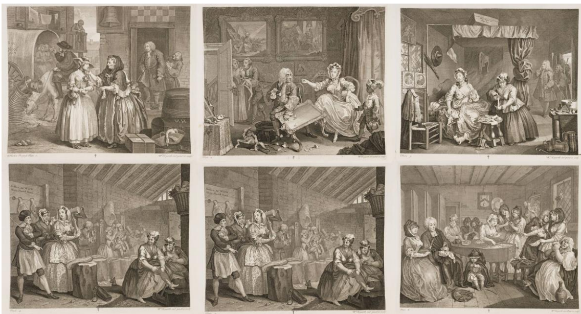
Slika 6. William Hogarth, A Harlot's Progress

pričama u stihovima ( Max und Moritz , 1865.). Preteča stripova (pasice) nastali su u engleskim novinama i tako je nastao međunarodno ime strip, a označavao je vrpcu, odnosno red crtane šale u dnevnim novinama. Takve su pasice bivale redovno u novinama u SAD-u krajem 19.stoljeća . U svojoj povijesti strip je razvio tri velike tradicije u tržišnom i umjetničkom pogledu: angloameričku (u SAD-u i Velikoj Britaniji), europsku (naročito francusko-belgijska tradicija, bande dessinée ) i japansku ( manga ). [7]