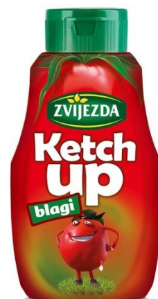
Sl.6/Sl.7.: primjer rebrandinga – Zvijezda ketchup, izvor: Stridon.hr