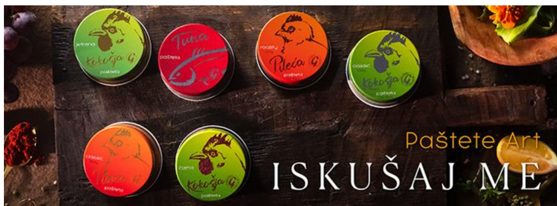
Sl.1. primjer utvrđivanja kategorije proizvoda koherentnim dizajnom ambalaže

„Dizajn ambalaže su oblici, strukture, materijali, boja, slike, tipografija, i regulatorne informacije s pratećim elementima koji čine proizvod pogodnim za marketing i prodaju. Njegov je primarni cilj stvoriti pakiranje koje proizvodu omogućiti: zaštitu, transport, izlaganje na policama, skladištenje i identifikaciju u trgovinama. U konačnici, dizajn treba ispuniti marketinške ciljeve prepoznatljivom komunikacijom osobnosti ili funkcije potrošačkog proizvoda i generiranjem prodaje.“ [2] S obzirom na sve veću konkurenciju proizvoda raste i potreba za tržišnim razlikovanjem i diferencijacijom. Jednostavno rečeno - uspješan dizajn ambalaže stvara želju kod kupca. Dizajn ambalaže jedan je od komponenti u složenom sklopu marketinških aktivnosti koje teže stvaranju lojalnosti marki i prodaji proizvoda. Uspješan dizajn ambalaže ovisi o jasno definiranoj strategiji - taktički plan koji ocrtava prepoznatljive karakteristike proizvoda i kontrast između njega i konkurentnih proizvoda. Možda postoji razlika između sastojaka, izvedbe ili materijala - ili ne mora biti uopće uočljiva razlika između sličnih proizvoda. Marketing je često samo stvaranje percepcija razlike. Što god bilo, marketinški stručnjaci definiraju pristup koji će kapitalizirati ono što njihove proizvode čini dostupnima. Dizajn ambalaže je faktor u natjecateljskom izazovu komuniciranja diferencijacije proizvoda, a za mnoge marke dizajn ambalaže utvrđuje izgled kategorije (primjer na Sl.1.).