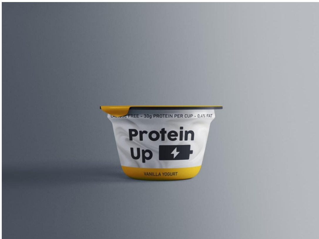
Varijanta 2 – okus vanilija; crna boja #231F20, žuta boja #FFCE00; obrazac: Graphicpear.com