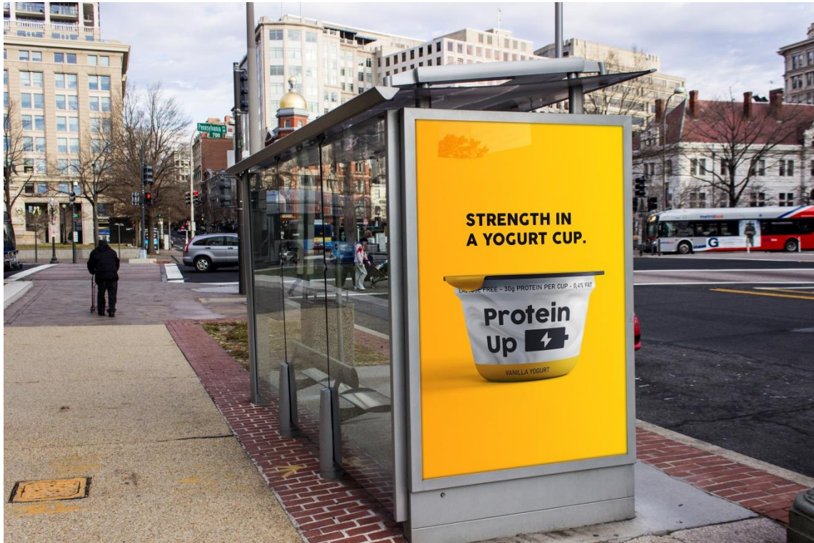
Primjer 1 – autobusna stanica; obrazac: Designbolts.com