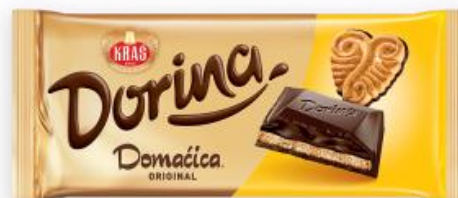
Sl.4/Sl.5.: primjer rebrandinga – čokolada Dorina