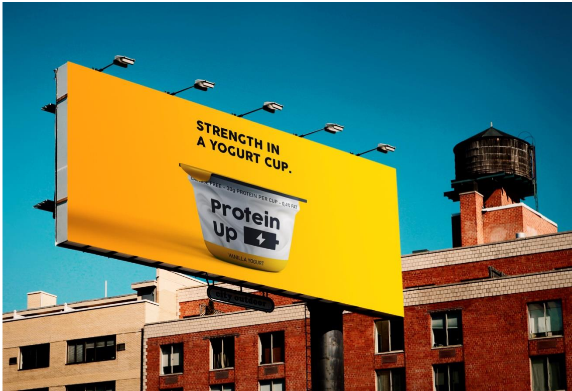
Primjer 2 – billboard; obrazac: Designbolts.com