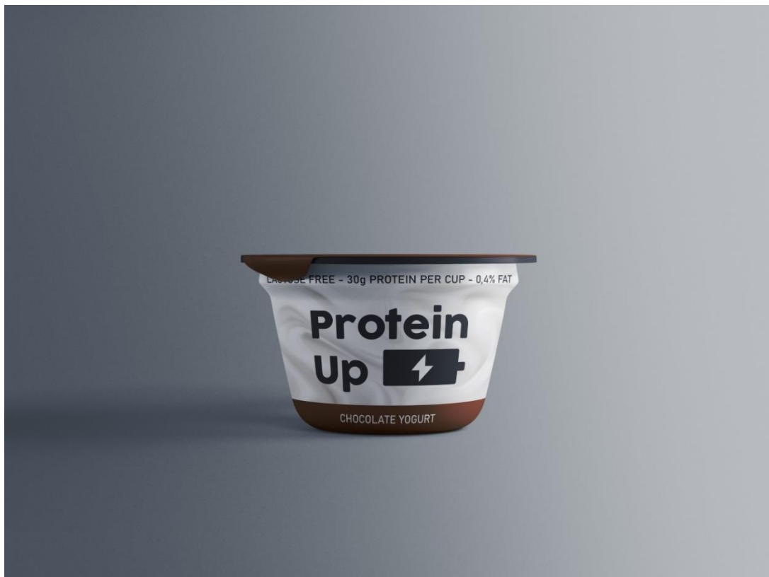
Varijanta 1 – okus čokolada; crna boja #231F20, smeđa boja #77340E; obrazac: Graphicpear.com