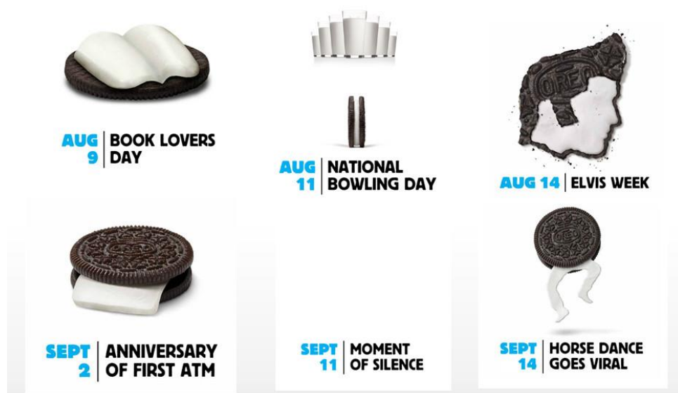
Sl.10. Oreo Daily Twist kampanja

Svi dosadašnji primjeri vizualnog pripovijedanja dokazuju da uspješna marketinška strategija zahtijeva da subjekt pripovijedanja bude kvalitetan jednako kao i upotreba vizualnih sadržaja. Priče mogu dolaziti iz mnogih aspekata poslovanja ili života, bilo da se radi o vrijednostima tvrtke, kako ljudi uživaju u proizvodu, ključnim prekretnicama u životnom vijeku proizvoda itd. U Oreo Daily Twist kampanji za američko tržište 2012. Godine, tvrtka je proslavila stoti rođendan kreiranjem 100 originalnih slika nadahnutih pop kulturom, obilježavajući značajne dane u godini. Ta je kampanja prikupila globalne pohvale i nagrade te redefinirala publicitet za robnu marku Oreo.