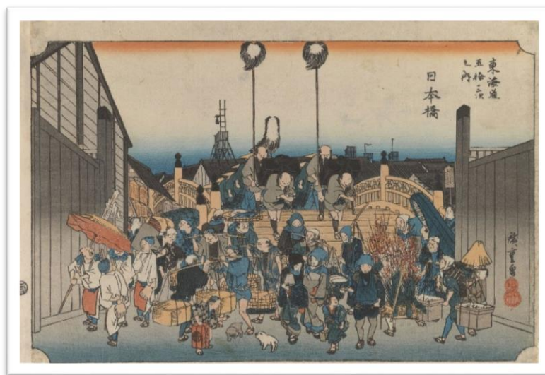
Slika 12 "Japan Bridge"; autor: Hiroshige; godina: 1833.-1834.; drvorez u boji;

dimenzije: 33,3 x 22,5 cm; drvorez u boji