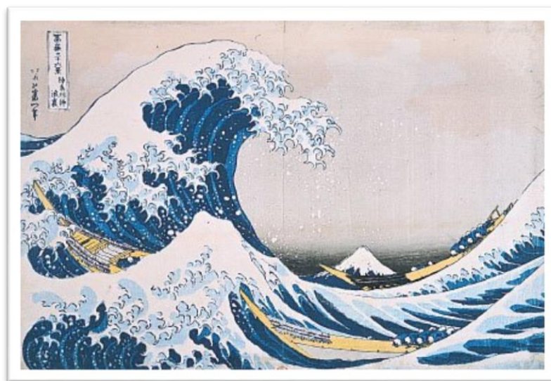
Slika 8 "The Great Wave", autor: Hokusai; godina 1829.-1833.; dimenzije: 25.7 × 37.8 cm;

drvorez u boji; iz serije „Trideset i šest pogleda na planinu Fuji“