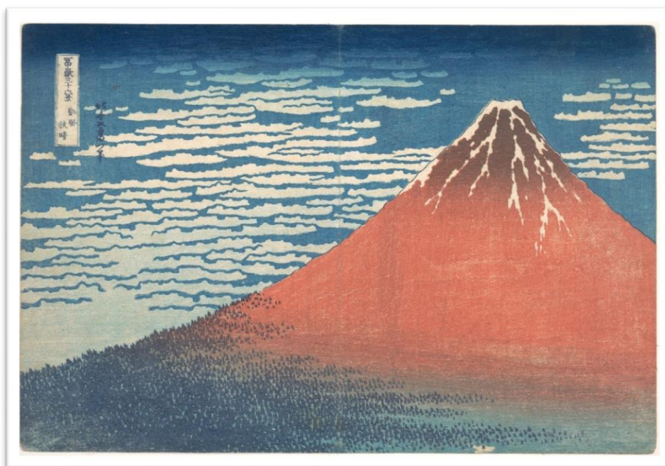
Slika 9 "South Wind, Clear Sky", poznat kao "Red Fuji"; autor: Hokusai; godina: 1830.-1833.; dimenzije: 25,4 x 37,8 cm; drvorez u boji; iz serije „Trideset i šest pogleda na planinu Fuji“