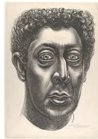
Slika 3.4.14. Autoportret, 1931.