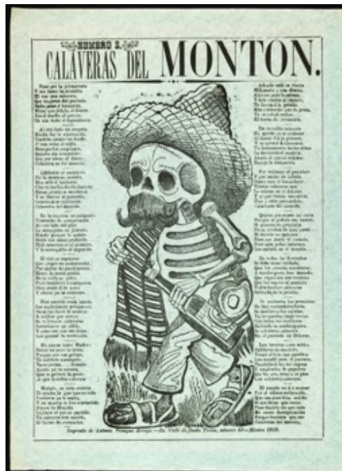
Slika 3.1.9. Calaveras s hrpe, broj 2, 1910.