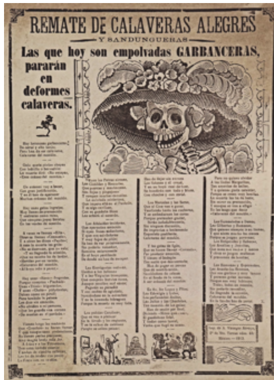
Slika 3.1.1. i 3.1.2., La Calavera Catrina, 1913.

Od izbijanja meksičke revolucije 1910. do njegove smrti 1913. Posada je neumorno radio u tisku. Radovi koje je u to vrijeme dovršio u tisku omogućili su mu da razvije svoju umjetničku snagu kao crtač, graver i litograf. U to je vrijeme nastavio raditi satirične ilustracije i crteže objavljivane u časopisu El Jicote koje su igrale značajnu ulogu za vladu tijekom mandata predsjednika Francisca Madera i tijekom kampanje Emiliana Zapate.