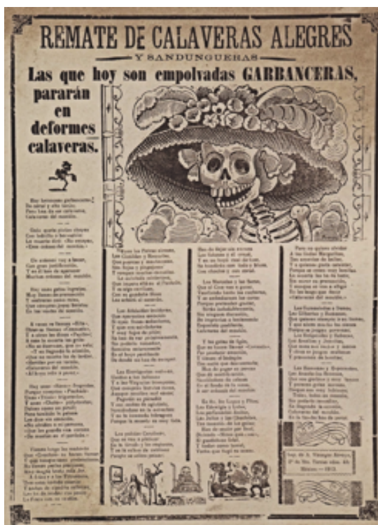
Slika 3.1.1. i 3.1.2., La Calavera Catrina, 1913.

Od izbijanja meksičke revolucije 1910. do njegove smrti 1913. Posada je neumorno radio u tisku. Radovi koje je u to vrijeme dovršio u tisku omogućili su mu da razvije svoju umjetničku snagu kao crtač, graver i litograf. U to je vrijeme nastavio raditi satirične ilustracije i crteže objavljivane u časopisu El Jicote koje su igrale značajnu ulogu za vladu tijekom mandata predsjednika Francisca Madera i tijekom kampanje Emiliana Zapate.