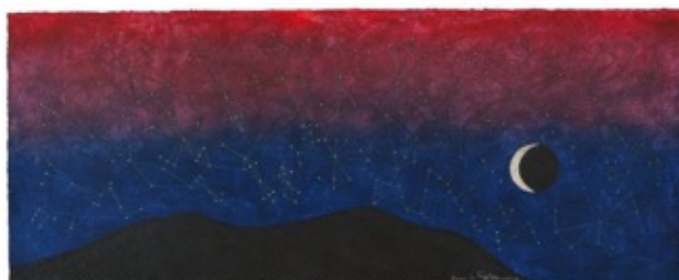
Slika 3.5.2. Galaksija, 1977.