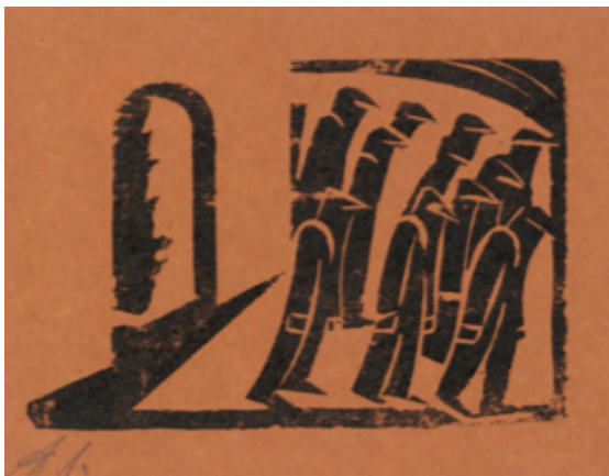
Slike 3.4.1.-3.4.13. Serija 13 drvoreza, 1931.