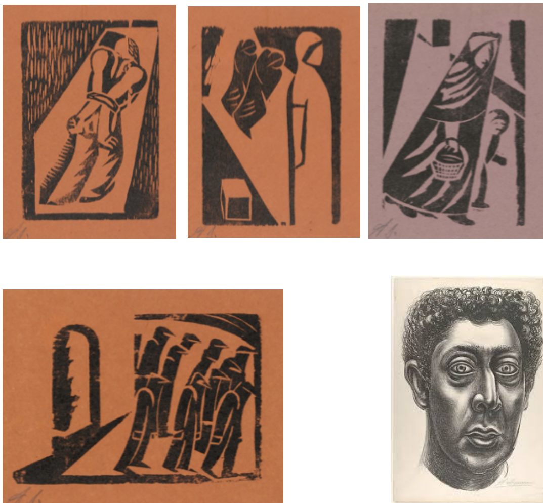
Slike 3.4.1.-3.4.13. Serija 13 drvoreza, 1931.