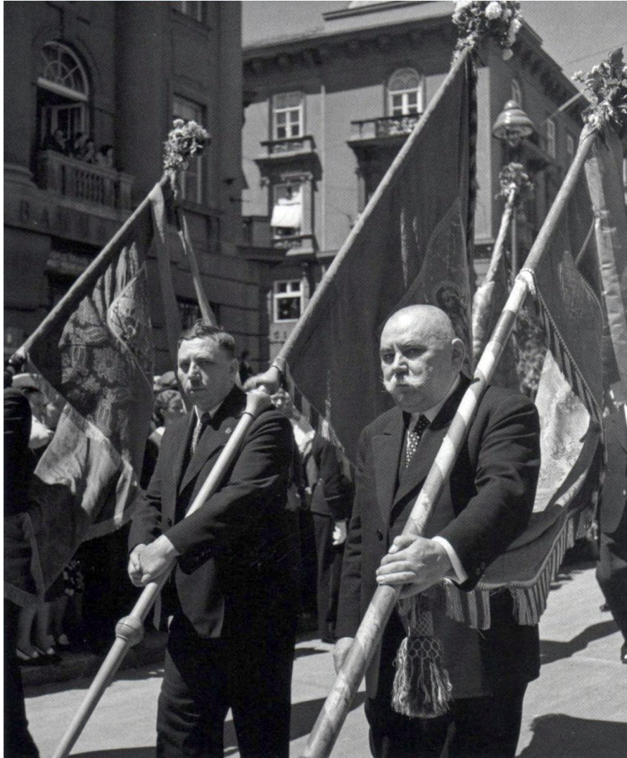
Slika 4: Tošo Dabac, Procesija, 1938. [6]

Njegova fotografija je sačuvala mnoge ličnosti, običaje i ambijente koji danas više ne postoje, bilo da su to ljudi iz područja književnosti i kazališta, sportaši u aktivnim natjecanjima u periodu između dva svjetska rata, radnici, spomenici arhitekture i kulturne baštine.