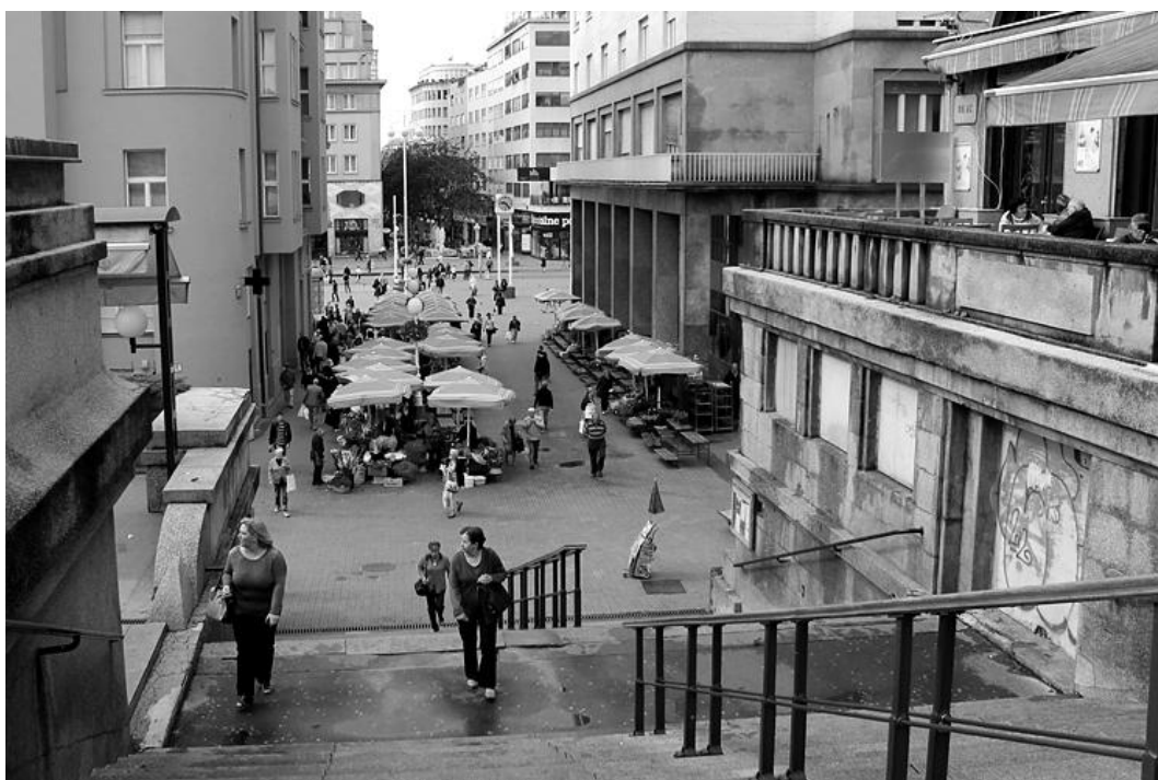
Slika 18: Matko Rončević, Dolac, 2014.