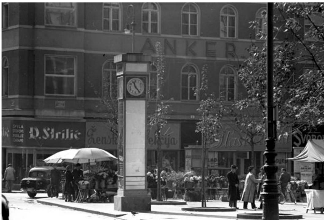
Slika 13: Tošo Dabac, Trg Petra Preradovića, 1936. [21]