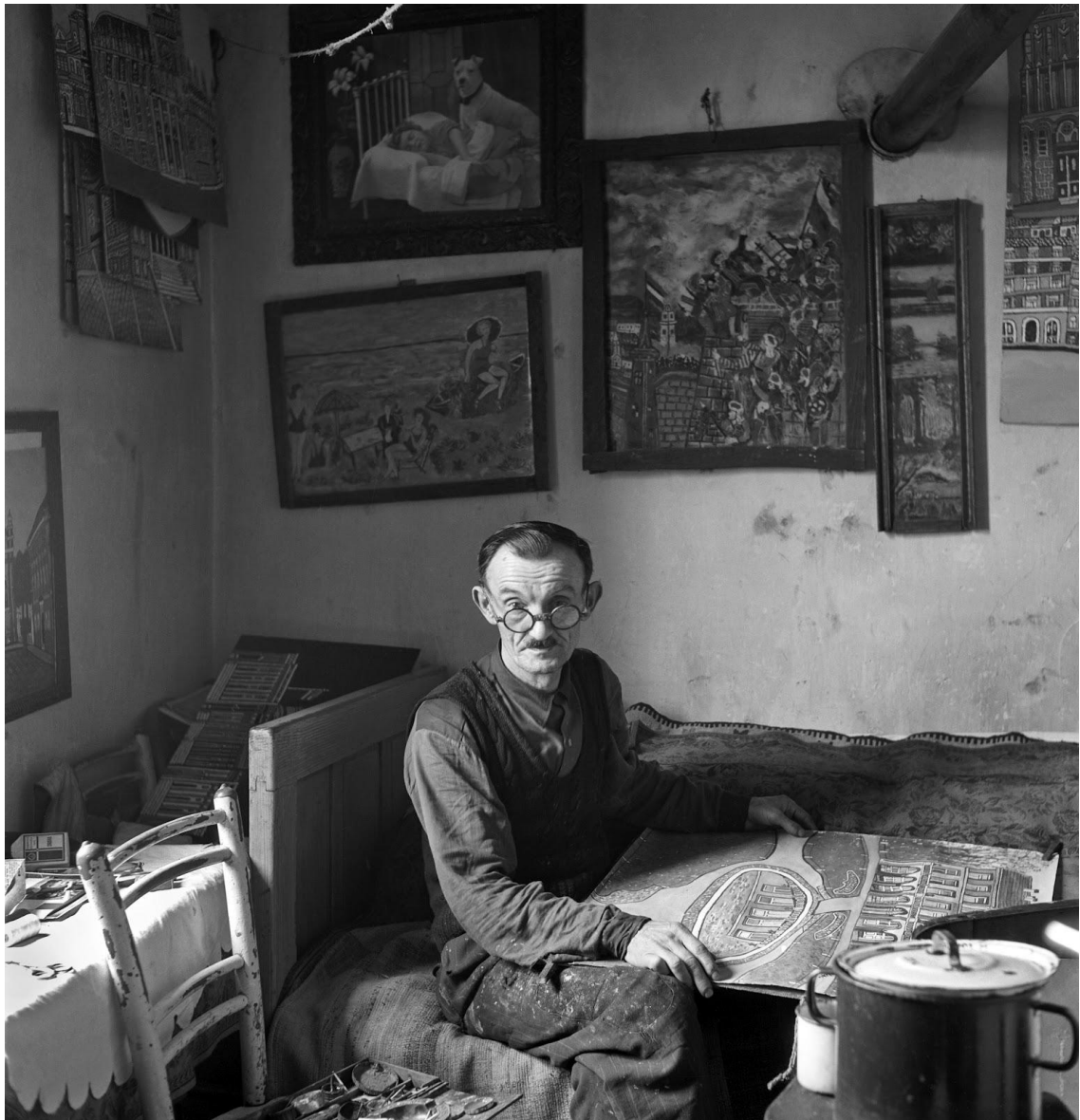
Slika 10: Tošo Dabac, Slikar Emerik Feješ, 1959.[24]

Dabčevi portreti, kako je već navedeno, odišu jednostavnošću i ističu koliko je, usprkos folklornom i upadljivom izgledu odjeće, fotografu puno važniji onaj unutrašnji život lika. Jedan od njegovih najpoznatijih portreta svakako je onaj slikara naivne umjetnosti, Emerika Feješa iz 1959. godine.