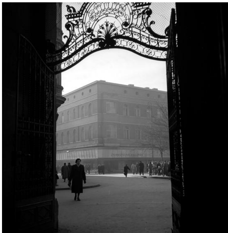
Slika 11: Tošo Dabac, Trg Petra Preradovića, 1960. [15]