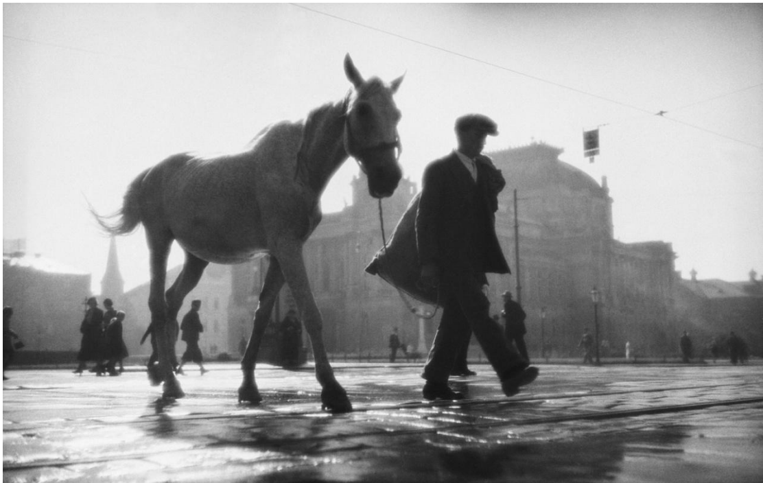
Slika 7: Tošo Dabac, Put na giljotinu, 1932. [6]

Interesantna i nadahnuta je analiza umjetnika Petera Knappa, Dabčeve fotografije pod nazivom „Put na giljotinu“: „Da bi načinio taj snimak, Tošo Dabac je raspolagao samo jednim sredstvom kontrole: trebalo je okinuti u trenutku kad je konj u hodu prekrilo sunce [6].“