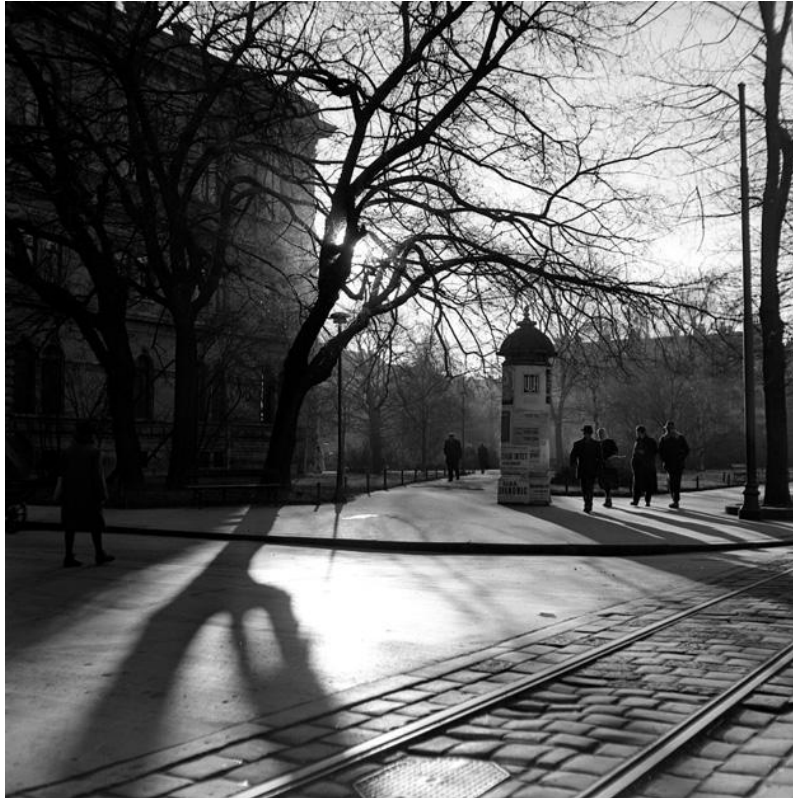
Slika 19: Tošo Dabac, Zrinjevac, zgrada JAZU, 1950. [21]