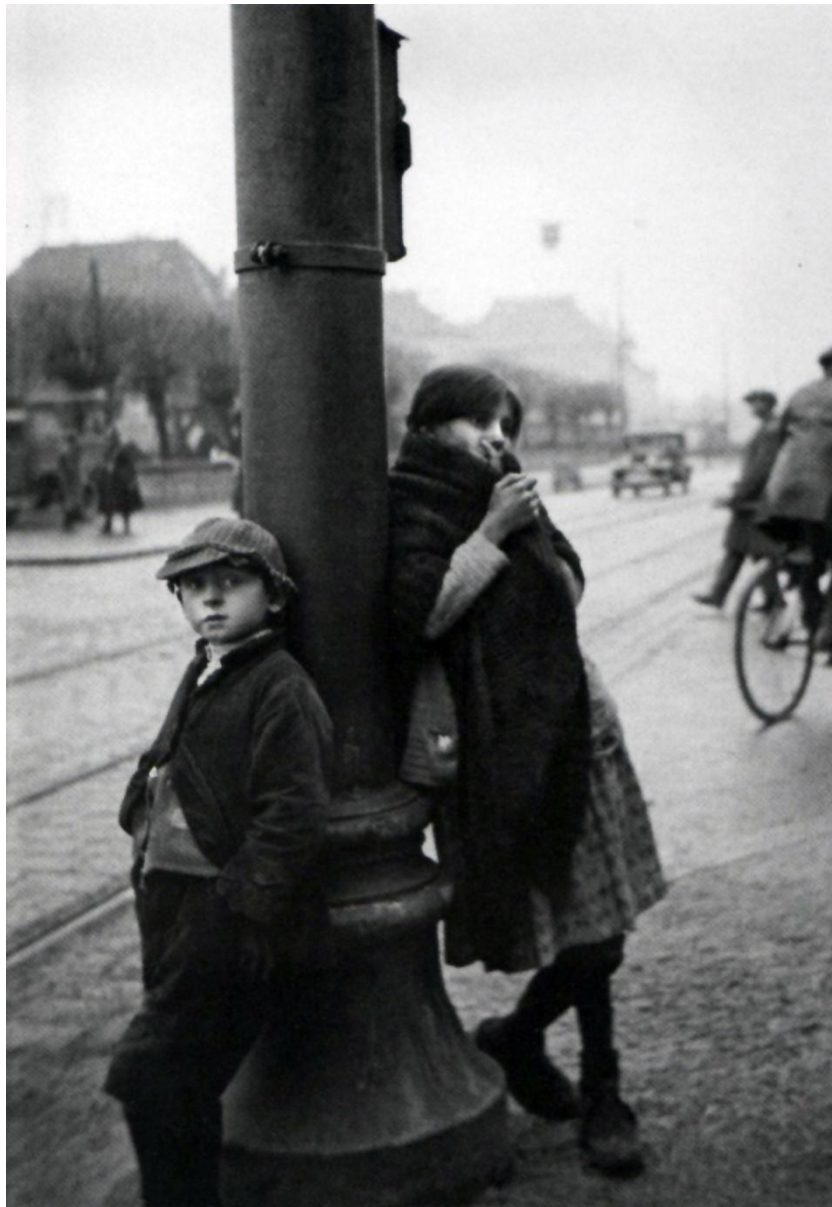
Slika 2: Tošo Dabac, Djetinjstvo, 1933. [6]

Dabac, koji je u to vrijeme bio na početku svoje karijere, usmjerio se u vidu progresivne fotografije čime se uvrstio u jedne od modernih fotografa koji su dali temelje definiranju stavova kakve su imali njemački filozof Walter Benjamin i češki likovni kritičar i teoretičar Karel Teige, tvrdeći da je osjetio vrijeme koje mu je zauzvrat dalo široku panoramu likova i motiva [10].