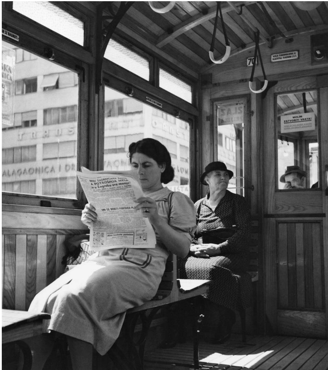
Slika 9: Tošo Dabac, U tramvaju, 1936. [24]

„U tramvaju“ jedna je od najpoznatijih Dabčevih fotografija nastalih tijekom tridesetih godina kada su središte njegove fotografije činili obični ljudi, građani Zagreba, koje je hvatao u najrazličitijim trenutcima i na najrazličitijim mjestima.