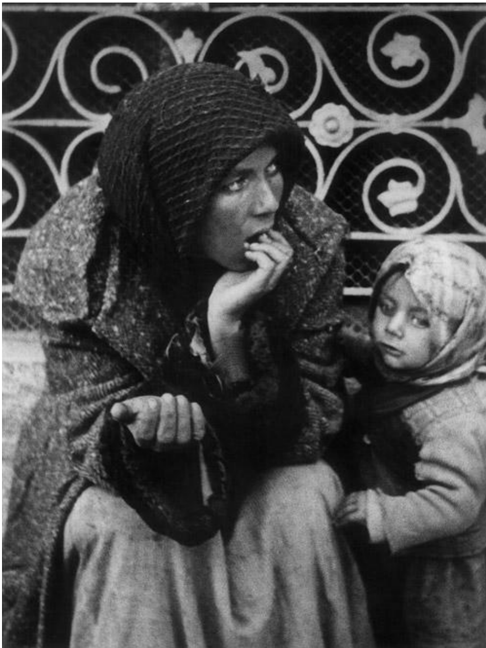
Slika 3: Tošo Dabac, Prosjakinja s djetetom, 1932.-33.[14]

Riječ je o izrazito važnom dijelu Dabčeva opusa koji predstavlja vizualnu lirsku kroniku života njegovog voljenog Zagreba. Serija snimaka nastala je između 1932. i 1935. godine u Zagrebu, te sadrži, ne samo dokumentarnu, nego prije svega ljudsku notu, u kojoj je zabilježeno jedno cijelo povijesno razdoblje. U njima je sabrana tuga onih koji nisu imali mogućnosti da nešto promijene u svome postojanju i egzistenciji, „fatalnost čekanja“, kako tvrdi istaknuti povjesničar umjetnosti, kritičar i kustos Radoslav Putar. Ljudi koji čekaju prolazak teškog doba i pojavu neke bolje budućnosti.