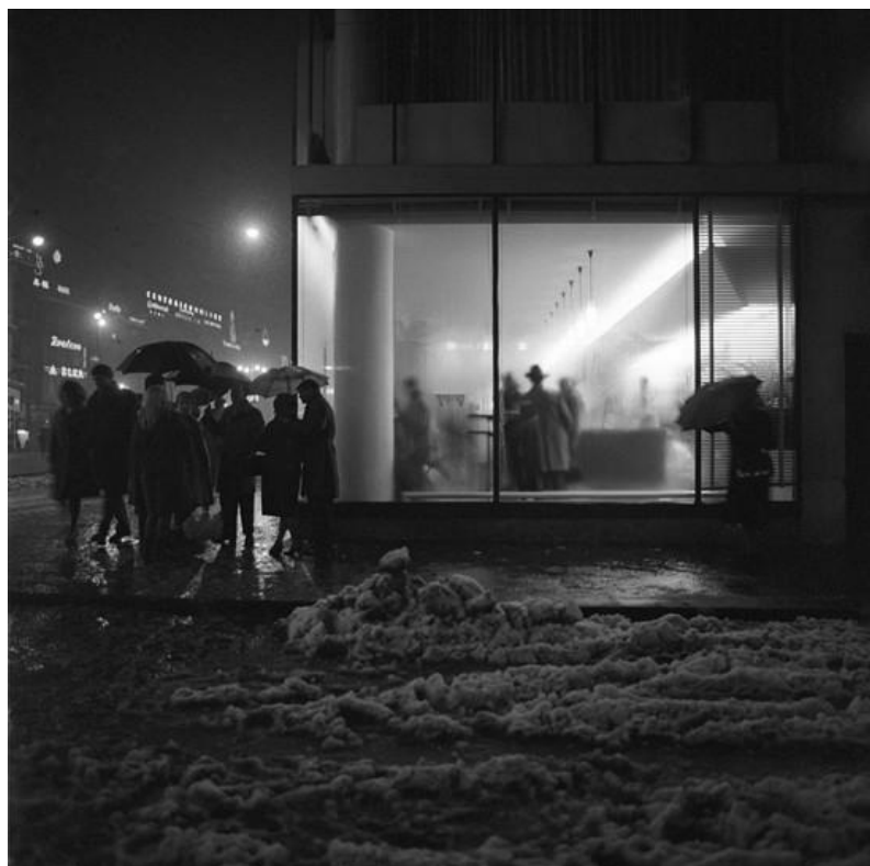
Slika 15: Tošo Dabac, Slastičarna zvana „Majmunjak“, 1960. [21]