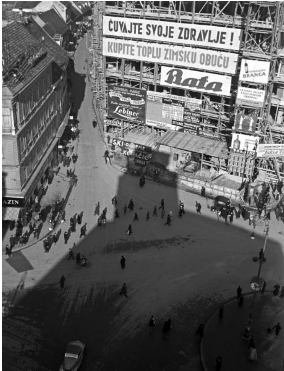
Slika 6: Tošo Dabac, Assicurazioni Generali, 1937. [6]

U monografiji iz 1980. godine fotografija je nazvana „Assicurazioni Generali“, a nešto kasnije, u maloj monografiji objavljenoj 1994. godine koja je rađena u suradnji sa francusko-švicarskim fotografom Peterom Knappom, dobila je naziv „Zgrada Assicurazioni Generali“.