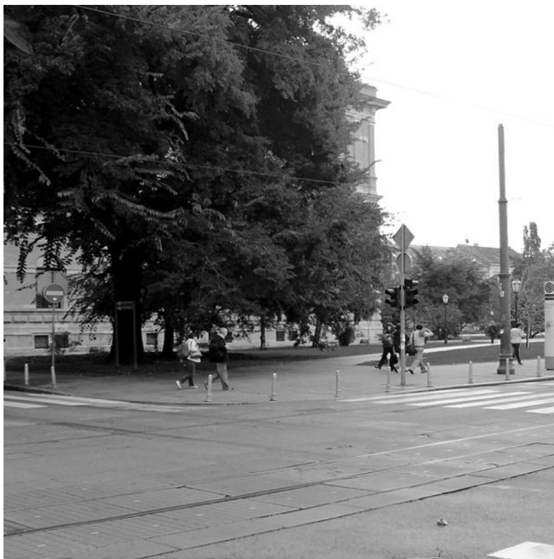
Slika 20: Matko Rončević, Zrinjevac, zgrada HAZU, 2014.