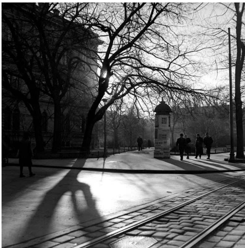
Slika 19: Tošo Dabac, Zrinjevac, zgrada JAZU, 1950. [21]