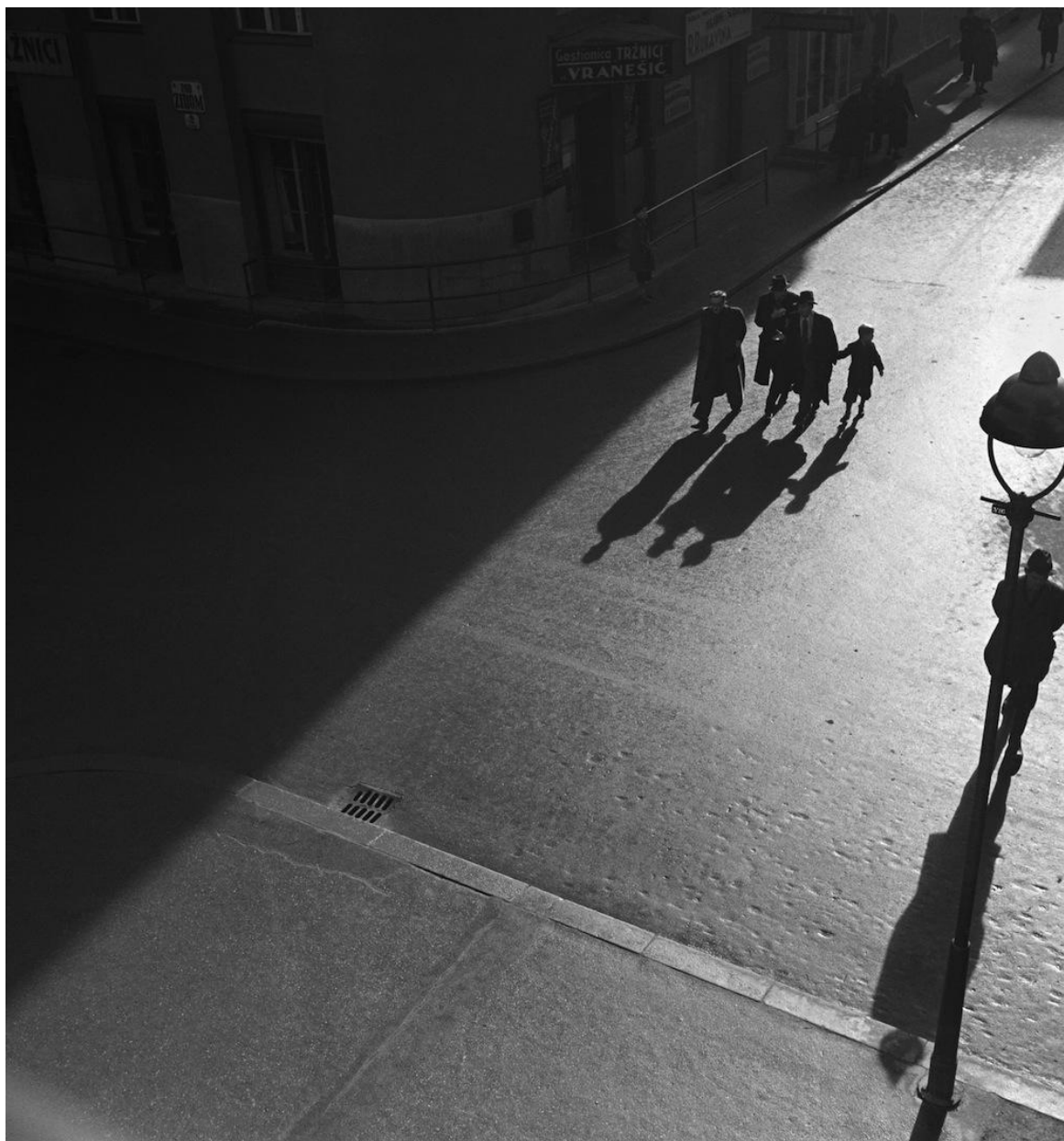
Slika 8: Tošo Dabac, Pod zidom, 1939. [6]

Fotografija „Pod zidom“ nastala je krajem tridesetih godina, točnije, 1939. godine koju je u rujnu obilježio početak Drugog svjetskog rata. Riječ je o jednoj od poznatijih Dabčevih fotografija gdje sjena dijagonalno siječe kadar i čini ga estetski savršenim.