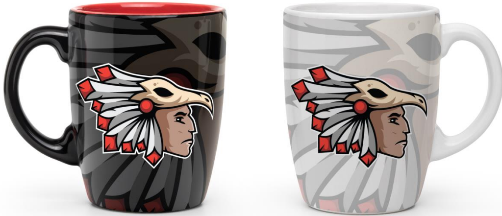
(Slika 24. Crna i bijela šalice s uzorkom tima)

Promotivni materijali, kao što su kape, šalice, majice i sl., koriste se kako bi se promovirao tim te se obično dijele na većim natjecanjima. Isti taj promotivni materijal se prodaje na stranicama tima izvan sezone.