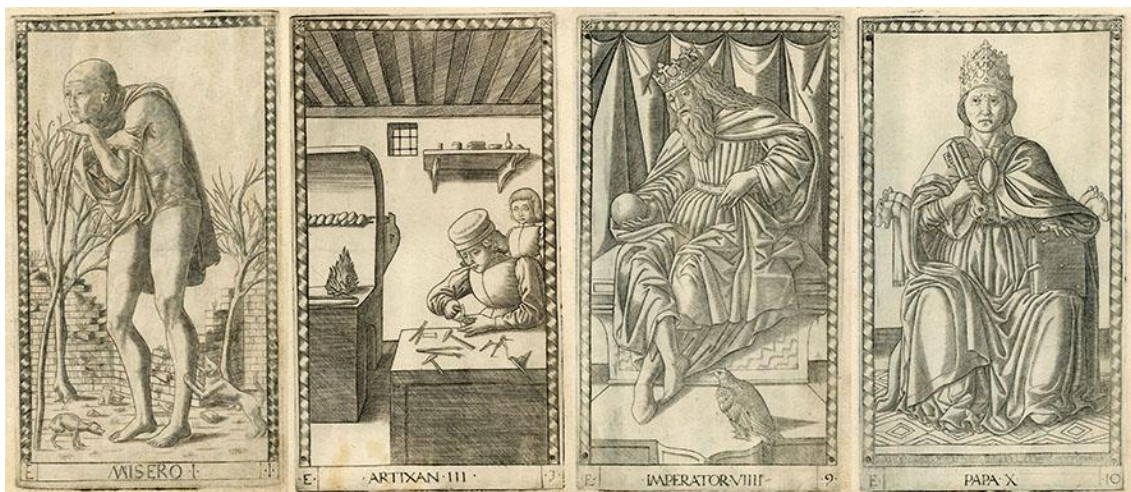
Slika 2. Četiri karte iz Mantegna špila slikara Andreasa Mantegne, 1530. godina.

U srednjem vijeku postojali su razni načini reprodukcije i stvaranja grafičkih produkata i njihovih kopija. Osim što su se slike ručno crtale, postojala je i mogućnost tiskanja koja je bila mnogo brža i isplativija. Uz bakropis i urezivanje motiva u metale, često se koristio i drvorez. Njegovo porijeklo možemo smjestiti u Kinu, nakon izuma papira. Brzo se proširio Azijom i Europom te je bio i jedna od prvih tehnika reproduciranja i tiskanja karata na zapadu. Na ravnim pločama drva, urezivali bi se motivi koji su htjeli biti otisnuti. Dio koji nije trebao biti obojen izrezao bi se iz drveta, a netaknute površine bili su elementi koji su nosili boju i otiskivali sliku. U početku je tiskanje bilo monokromatično, tj. crno-bijelo, a kasnije se iz Japana proširilo otiskivanje u boji. Teško je bilo dodati i urezati detalje u drvo pa su se otisci drvoreza činili veoma plošni zbog nemogućnosti dodavanja nijansi. [2]