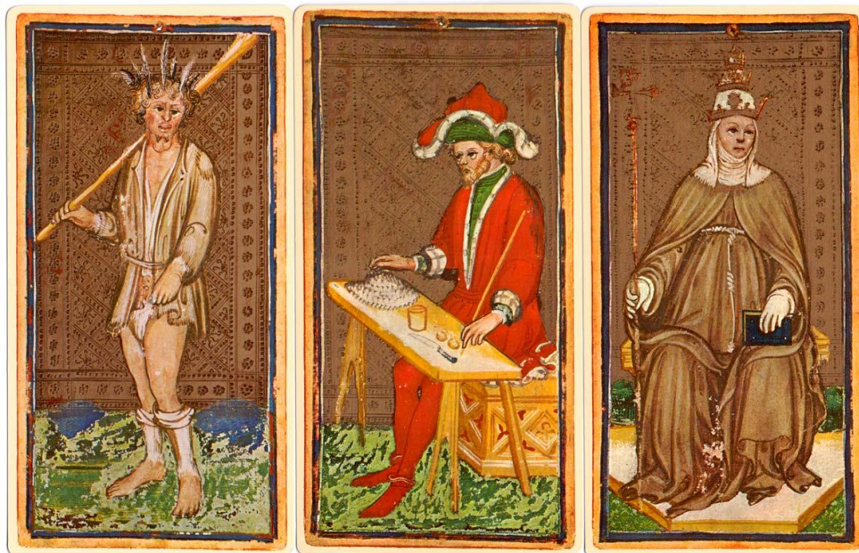
Slika 1. Tri tarot karte iz Visconti-Sforza špila slikara Bonifaccia Bemba iz 1450-ih

Prvi prorok koji je predviđao budućnost pomoću tarot karti te ujedno i autor „Etteilla ili kako se zabaviti špilom karata nazvanih tarot“, najstarije knjige s uputama za njihovo korištenje i tumačenje bio je Jean-Baptiste Aliette 1770. godine, pod istoimenim pseudonimom „Eteilla“. Osim njega kroz povijest se pojavljuje još nekoliko bitnih ličnosti koje su razvijale i proučavale tarot. Jedan od njih bio je Antoine Court pod pseudonimom De Gébelin, koji je smatrao da je tarot dio egipatske kulture i misterija. Po njegovim zaključcima, to je bio skup egipatskih učenja dugo čuvanih u Rimu od Crkve i Pape, koja su se s vremenom ponovno otkrila i proširila svijetom. Alphonse Louis Constant, pod pseudonimom Éliphas Lévi Zahed također je provodio istraživanja o tarotu kao i njegov učenik Papus koji se složio sa Gébelinovim teorijama o povezanosti tarota i Egipta, ali je odbio prihvatiti da ga je papinstvo čuvalo. Papus iznosi svoju teoriju da su ga očuvali i razvili Romi koji su se u tom razdoblju proširili Europom iz Indije. Bili su poznati po nomadskom životu te se vjerovalo da su proricali budućnost. Lévi, kao i De Gébelin su otkrili povezanost tarota i Kabbale, židovske teozofije i hebrejskog pisma. [2]