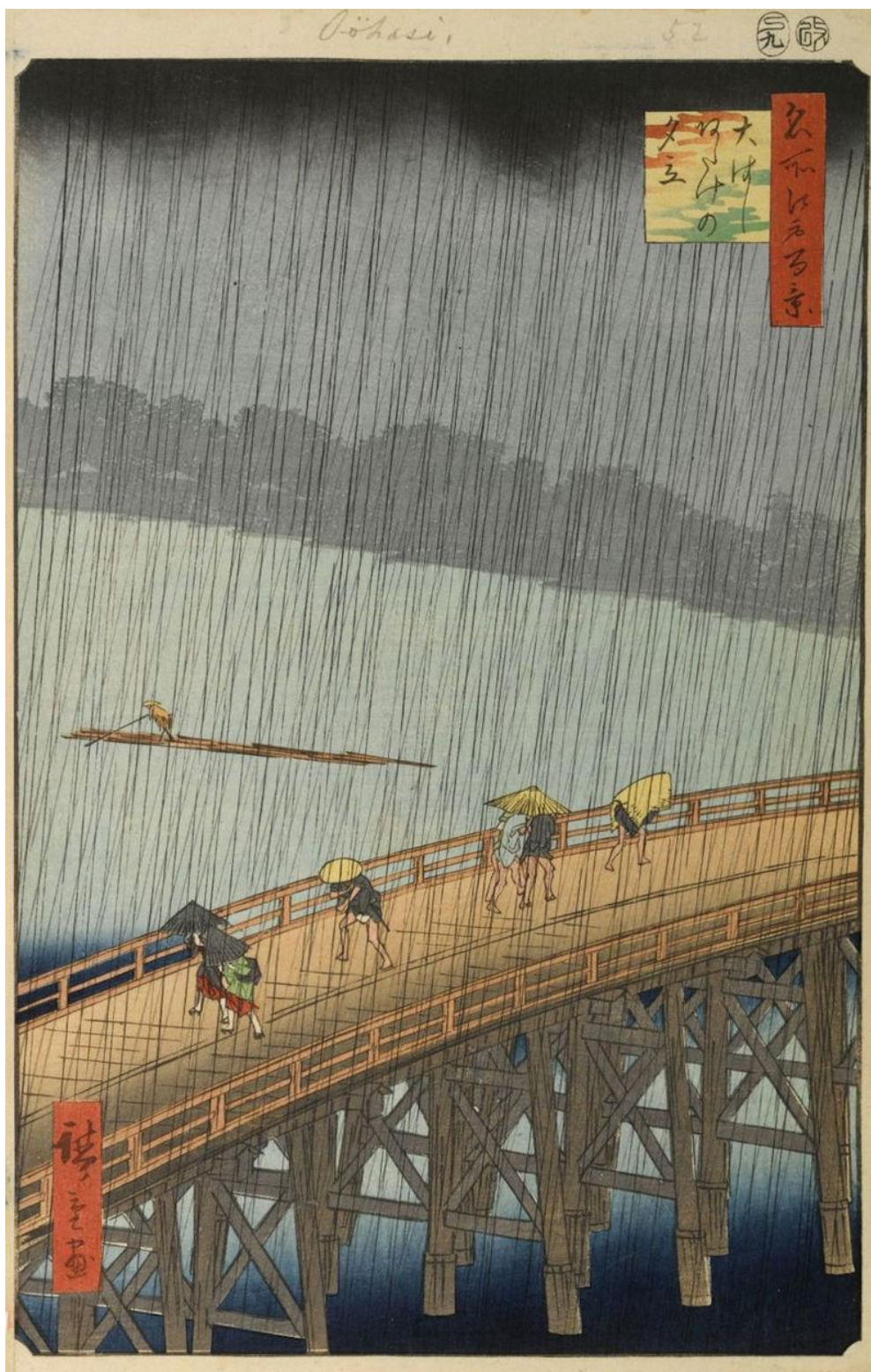
Slika 17. Utagawa Hiroshige „Iznenadni pljusak nad Shin-Ohashi mostom i Ataki“, iz serije „100 poznatih prizora Eda“, 1856.-1858.