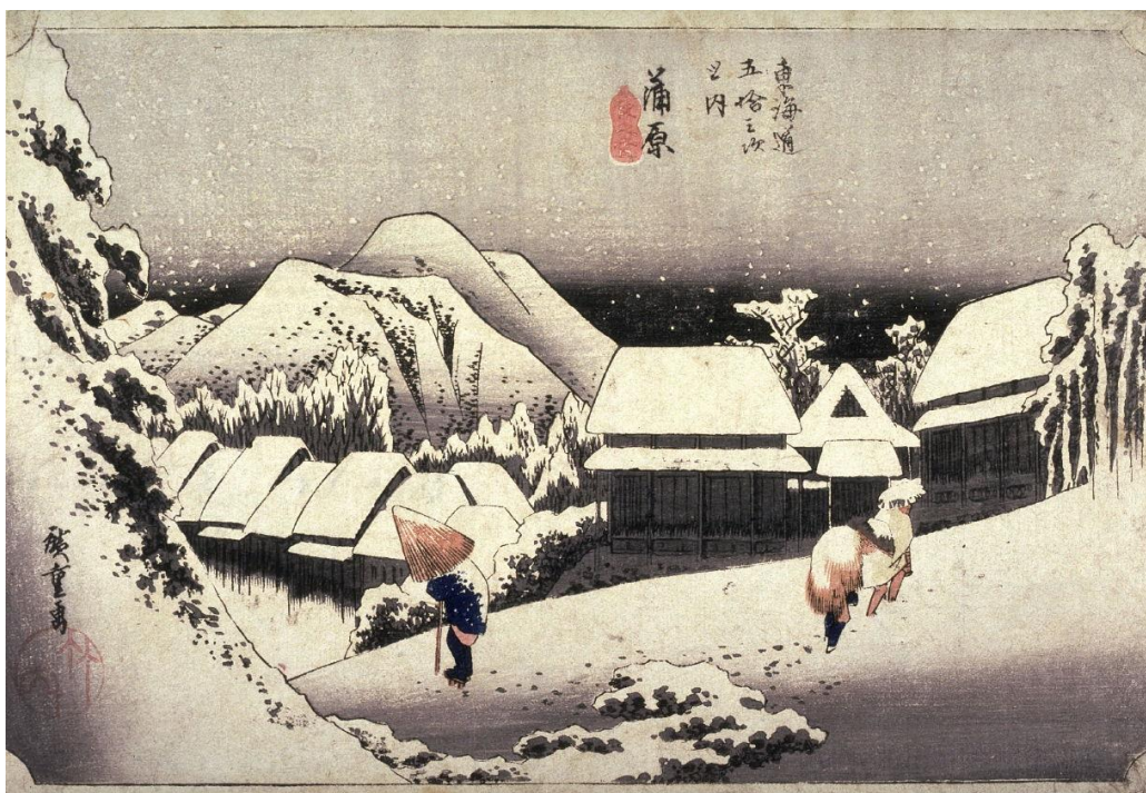
Slika 16. Utagawa Hiroshige „Noćni snijeg u Kambari“, iz serije „53 postaje Tokaida“ 1833.-1834.