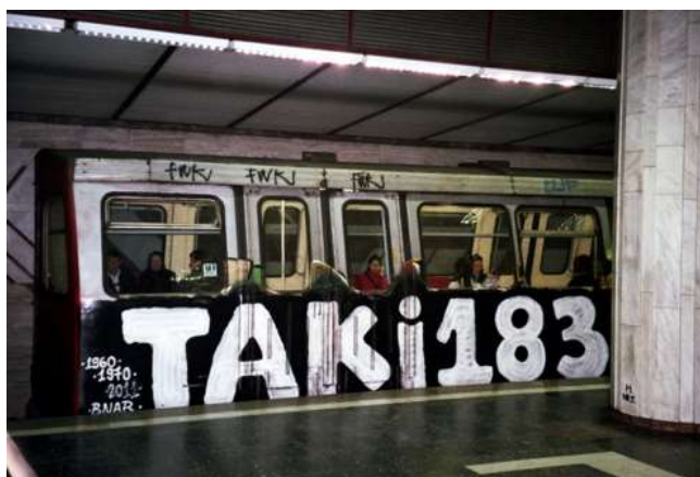
Slika 6. i 7. Taki183