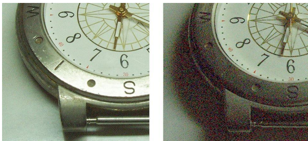
Slika 2.5.3. Normalna slika / zrnata slika

Zrnatost je pojava kojom nastaju raznobojni dodatni pikseli, tj. „zrna“ pri fotografiranju. Javlja se pri snimanju s visokom ISO osjetljivošću te pri lošijim svjetlosnim uvjetima. Slabo osvijetljenje fotoaparata automatski kompenzira većom osjetljivošću te povećavanjem relativnog otvora objektiva. Ako bi nakon toga ručno smanjili objektiv, fotografija bi bila podeksponirana. Da bi dobili prihvatljivu sliku, potrebno je dobro osvijetliti objekt.