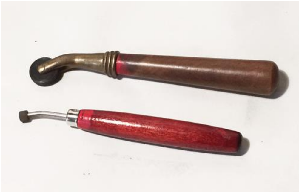
Slika 18. Alat s kotačićem

Danas postoje mnogobrojne opcije pri izboru alata kojima se u metalnu ploču urezuje dizajn. Koriste se uglavnom igle; za bakropis su potrebne igle s vrhom koji je zatupljen, jer je potrebno samo sastrugati osušeni lak koji se nalazi na ploči, a kiselina stvara oštećenje koje će se prikazati na otisku. Igle dolaze u mnogo veličina, a vrhovi mogu biti npr. odrezani pod kutem kako bi se omogućilo stvaranje raznovrsnih oblika linije. Za pokrivanje većih površina mogu se koristiti alati koji na sebi imaju pričvršćen kotačić na kojem se nalaze male izbočine. Te izbočine mogu biti točke ili linije. Kotačićem se prelazi preko površine metalne ploče, i uz mijenjanje smjera urezivanja se brzo može prekriti željeno područje.[14]