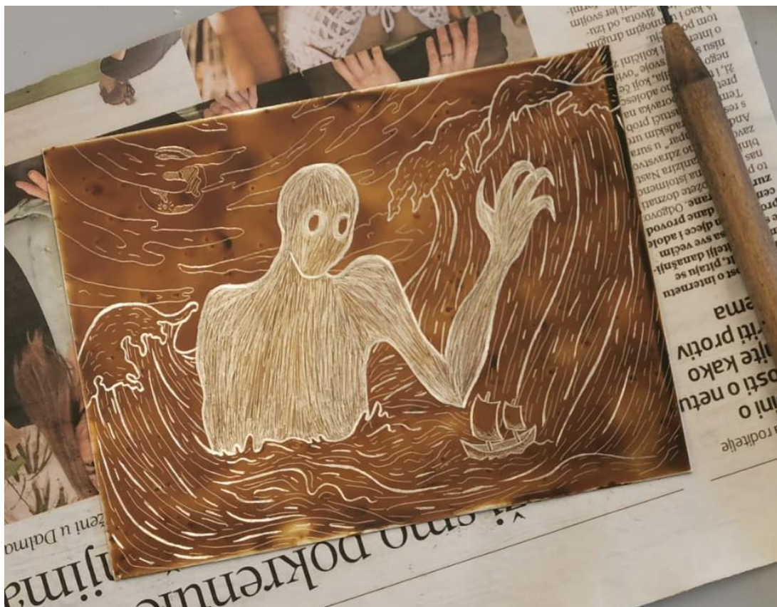
Slika 25. Dizajn urezan u lak