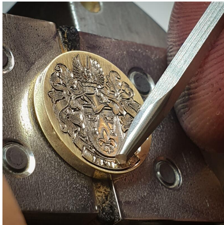
Slika 1. Graviranje

Začeci bakropisa i suhe igle nalaze se u drevnoj tehnici graviranja. Nemoguće je otkriti kada je graviranje započelo, no poznato je da je taj zanat bio poznat već u razdoblju Srednjeg vijeka, a vrlo vjerojatno je postojao i mnogo ranije. Zlatari su graviranjem dekorirali razne metalne predmete, kao što su oružje, oklopi i metalni dekorativni predmeti. [5]