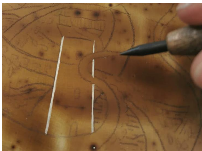
Slika 23. Grebanje laka iglom

Nadalje, iglom prikladnom za bakropis se dizajn urezuje u laku, prateći tragove indigo papira. Linije se mogu podebljavati, i dodaju se finiji detalji.