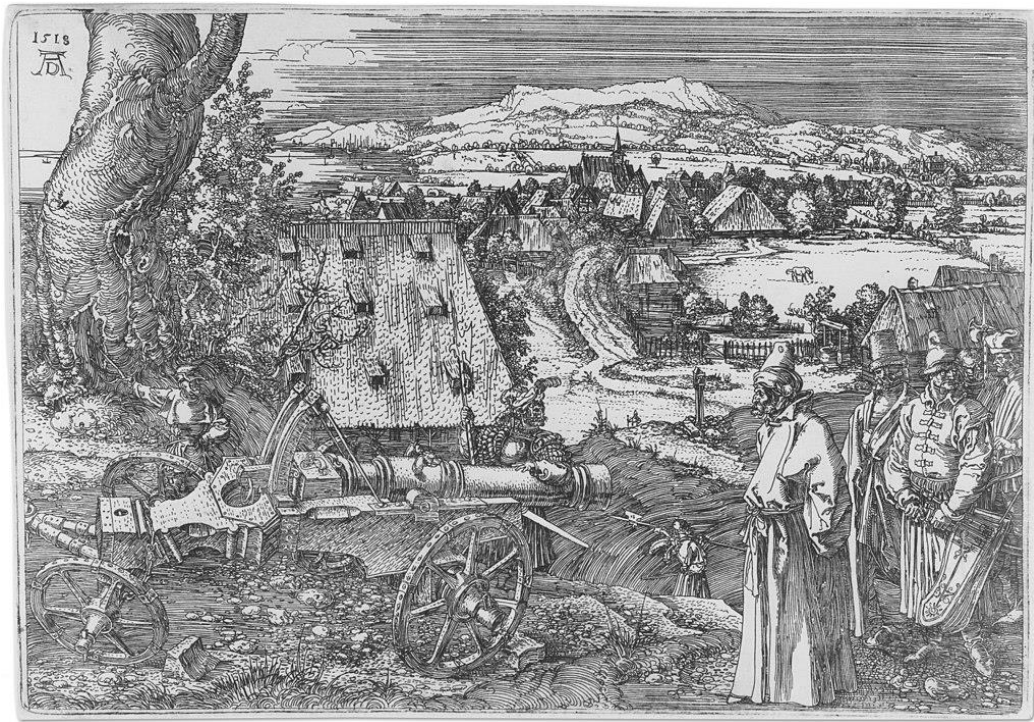
Slika 3. The Cannon, Albrecht Dürer, 1518.

Zatim, važno je spomenuti umjetnika iz Nancyja u Lorraineu (današnja Francuska), Jacquesa Callota. On je prvi počeo koristiti tehniku višestrukog jetkanja kako bi dobio gradaciju i time efekt dubine u svojim bakropisima. Dijelovi crteža koji su se trebali činiti najudaljenijima su ostavljeni da se nagrizažu u kiselini najkraće, i time se dobivaju svjetliji tonovi, dok su se do tada baksopisi izrađivali s jednim vremenom jetkanja, čime se dobivao samo jedan ton. Primjer prostornosti u Callotovim bakropisima vidi se u njegovoj kolekciji grafika pod nazivom „Miseries of War“, izrađenih oko 1633. godine.[7]