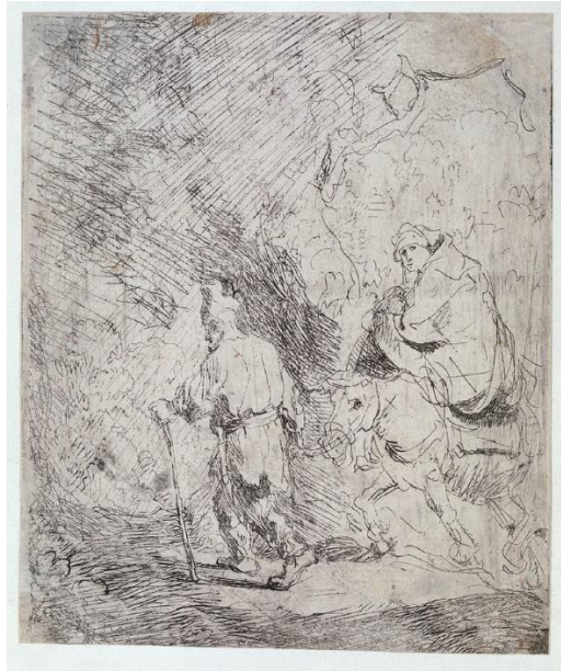
Slika 6. The flight into Egypt, Rembrandt, circa 1627

Već kroz nekoliko godina Rembrandt je postao majstor tehnike bakropisa. Portret njegove majke iz 1628. dokaz je napretka koji se dogodio u samo dvije do tri godine isprobavanja tehnike. Kontrast i teksture koje je postigao njegovim su suvremenicima bile toliko nevjerovatne da je bio optužen za korištenje tajnih tehnika koje ne želi podijeliti s drugima.[8]