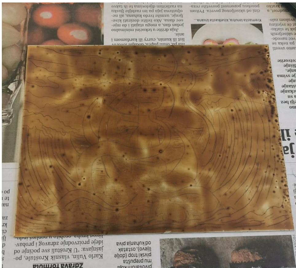
Slika 22. Transfer dizajna na lakiranu ploču

Sada je ploča spremna za urezivanje dizajna u lak. Važno je napomenuti da se na slici vide nečistoće u laku nastale slijeganjem prašine na polumokri lak dok je stajao na kamenu i hladio se, no one ne predstavljaju problem jer je ploča i dalje adekvatno pokrivena lakom.