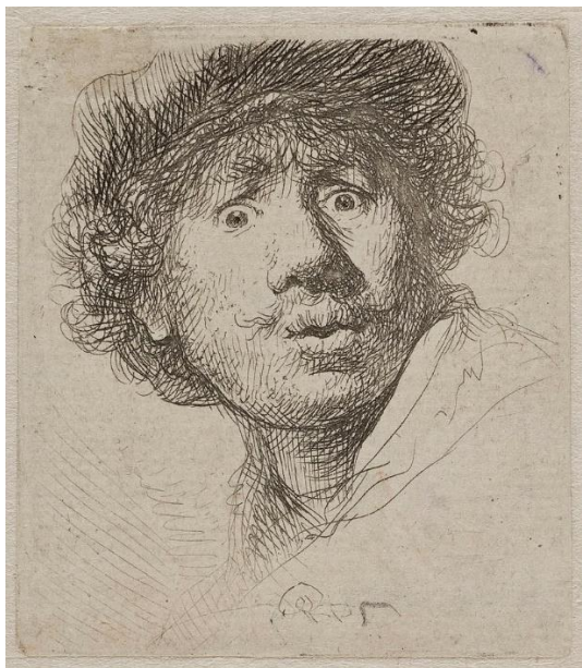
Slika 8. Autoportret s kapom, Rembrandt, 1630.

Jedan od najpozantijih Rembrandtovih bakropisa je „Autoportret s kapom“, koji je dio njegovog poznatog serijala autoportreta u različitim tehnikama.