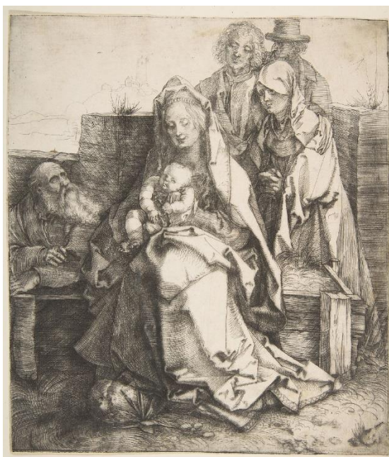
Slika 13. The Holy Family, Albrecht Dürer, 1512.-1513.

Albrecht Dürer je napravio samo tri otiska koristeći tehniku suhe igle, najvjerojatnije jer se reljef nastao iglom na pločici, nakon određenog broja otisaka, istroši te se time smanjuje kvaliteta budućih otisaka. [9]