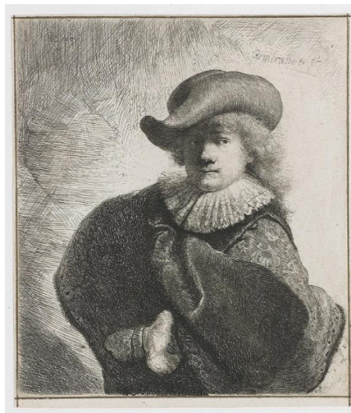
Slika 9. Self portrait in a soft hat and embroidered cloak, 1631.

Rembrandt je također često prepravljao svoje bakropise. To je relativno jednostavan proces u kojem se preko ploče nanosi novi sloj laka i urezuje se novi dizajn preko postojećeg. Kod Rembrandta, nije bilo neuobičajeno pronaći četiri do pet varijacija na neki bakropis. Promjene su ponekad bile minimalne, a ponekad drastične.[8]