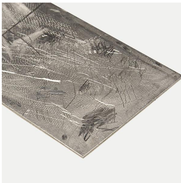
Slika 17. Metalna ploča za bakropis i suhu iglu

Materijali koji se danas najčešće koriste pri bakropisu i suhoj igli su ploče od bakra, cinka ili čelika. Veličina i oblik ploče ovise o umjetnikovoj viziji. Mogu se nabaviti ploče pripremljene upravo za otiskivanje, ili se obična metalna ploča prikladnog materijala može obraditi, što je jeftinija ali kompliciranija opcija.[13] Poželjno je da ploča na površini ima minimalan broj oštećenja, jer se čak i na prvi pogled vrlo slabe ogrebotine kasnije mogu vidjeti na konačnom otisku.