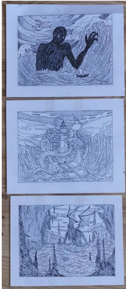
Slika 19. Tri skice

Izabrana tehnika za realizaciju praktičnog dijela ovog rada je kombinirana tehnika bakropisa i suhe igle. Na metalnoj ploči od cinka se prvo izvodi bakropis, a zatim se doraduje suhom iglom. Ovom se tehnikom može efektivno prikazati odabrana tematika: morska čudovišta iz mitologije i fantastike, specifično tri odabranika, Umibōzu, kraken i Cthulhu. Planirana su tri rada, svaki s pojedinim čudovištem. Pripremljene su tri skice dimenzija 16x12cm, sve tri horizontalno orijentirane. Skice su napravljene na običnom papiru flomasterom, koji oponaša bakropis, i osjenčane olovkama različitih mekoća (HB, 3B, 7B) čime se imitira suha igla. Također, zrcalno su okrenute kako bi grafika na konačnom otisku bila ispravno orijentirana.