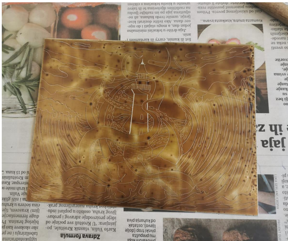
Slika 24. Proces podebljavanja linija

U ovom konkretnom slučaju, prvo su izvedene sve linije jednom debljinom, i zatim su se dodatno podebljavale linije na dijelovima koji su bliži i istaknutiji. U sva tri rada oblaci u pozadini su napravljeni tankim potezima, kako ne bi bili u prvom planu i kako bi prikaz dobio osjećaj prostornosti.