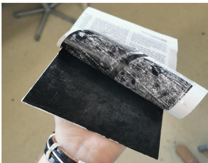
Slika 27. Uklanjanje viška boje

Zatim se mora skinuti višak boje, ali ne previše kako bi se dobio kvalitetan i izražen otisak. Na ploču s bojom se poliježu novine i trljanjem dlana se pločica zagrijava. Novine se podižu i skidaju boju s ploče. Nakon nekog vremena, prestat će se lijepiti za ploču i moći će se direktno trljanjem novina skidati višak boje. Znati koliko boje skinuti stvar je iskustva; ponešto vježbe potrebno je da se nauči ravnomjerno skinuti boja kako bi pozadinski ton bakropisa bio ravnomjeran na otisku.