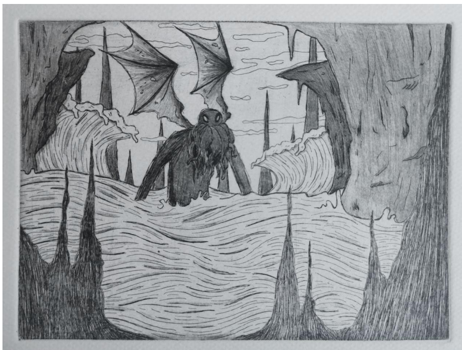
Slika 31. Drugi rad