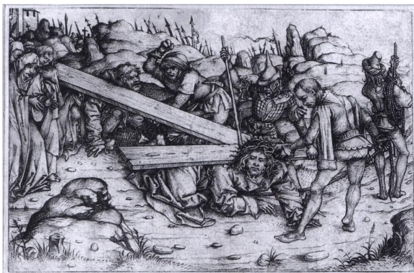
Slika 12. Carrying the Cross, Master of the Housebook, 1480.-e

Prvi primjeri suhe igle pojavljuju se u 15. stoljeću, kada je nepoznati njemački umjetnik, Master of the Housebook, napravio 91 otisak tom tehnikom.