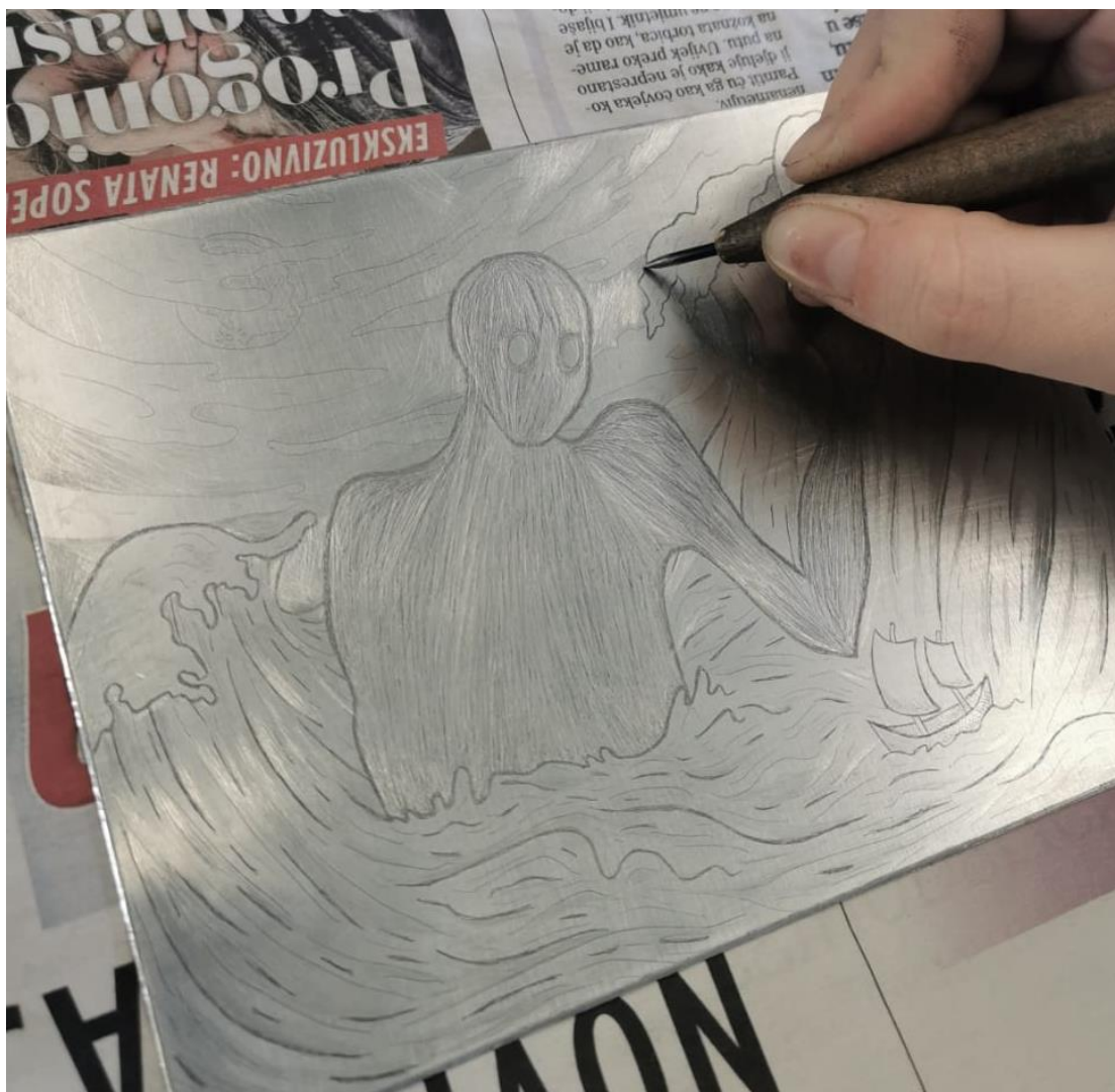
Slika 29. Dodavanje suhe igle

Nakon probnog otiska bakropisa, ploča se petrolejem i krpom očisti i pripremi za daljnji rad. Suha igla je naizgled jednostavniji proces od bakropisa; nema jetkanja, dizajn se direktno urezuje iglom na ploču i zatim se nanosi boja. Problem se pojavljuje kada nema iskustva, jer je na ploči teško vidjeti slabije linije i predvidjeti kako će sve skupa izgledati kada se grafika otisne.