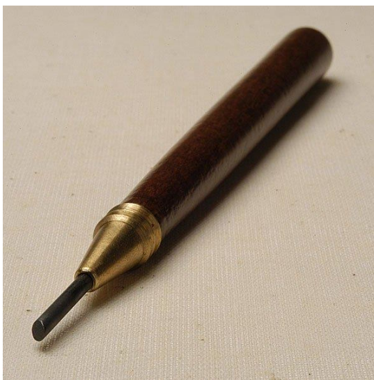
Slika 5. Echoppe bakropisna igla

Također, Callot je zaslužan za izum echoppe bakropisne igle, koja ima ovalni vrh koji je odrezan pod kutem. Time omogućuje kreiranje linija koje se obično izvode pri graviranju.