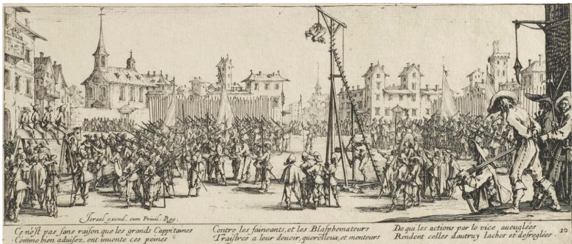
Slika 4. The Miseries of War, Jacques Callot

Zatim, važno je spomenuti umjetnika iz Nancyja u Lorraineu (današnja Francuska), Jacquesa Callota. On je prvi počeo koristiti tehniku višestrukog jetkanja kako bi dobio gradaciju i time efekt dubine u svojim bakropisima. Dijelovi crteža koji su se trebali činiti najudaljenijima su ostavljeni da se nagrizažu u kiselini najkraće, i time se dobivaju svjetliji tonovi, dok su se do tada baksopisi izrađivali s jednim vremenom jetkanja, čime se dobivao samo jedan ton. Primjer prostornosti u Callotovim bakropisima vidi se u njegovoj kolekciji grafika pod nazivom „Miseries of War“, izrađenih oko 1633. godine.[7]