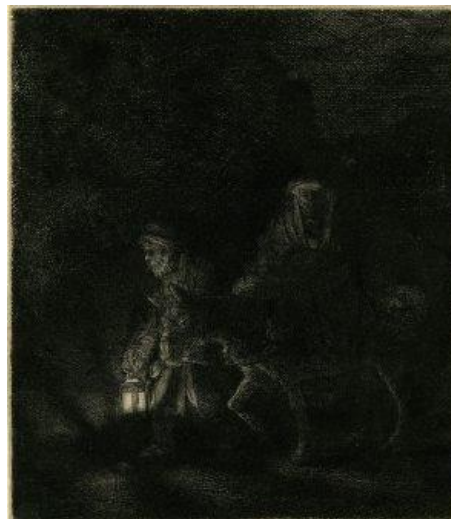
Slika 11. The Flight into Egypt, verzija 2