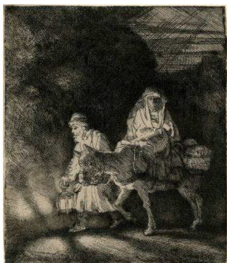
Slika 10. The Flight into Egypt, verzija 1

Rembrandt je također često prepravljao svoje bakropise. To je relativno jednostavan proces u kojem se preko ploče nanosi novi sloj laka i urezuje se novi dizajn preko postojećeg. Kod Rembrandta, nije bilo neuobičajeno pronaći četiri do pet varijacija na neki bakropis. Promjene su ponekad bile minimalne, a ponekad drastične.[8]