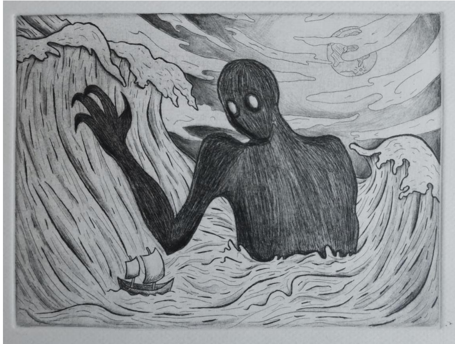
Slika 30. Prvi rad

Rezultat ovog rada su tri grafike dimenzija 16x12cm izvedene u kombiniranoj tehnici bakropisa i suhe igle. Svaka prikazuje jedno morsko čudovište i sve tri su stilski povezane. Bakropisom su izvedene obrisne linije, a suhom iglom je dodano sjenčanje, čime se dobila veća trodimenzionalnost i dramatičnost prikaza.