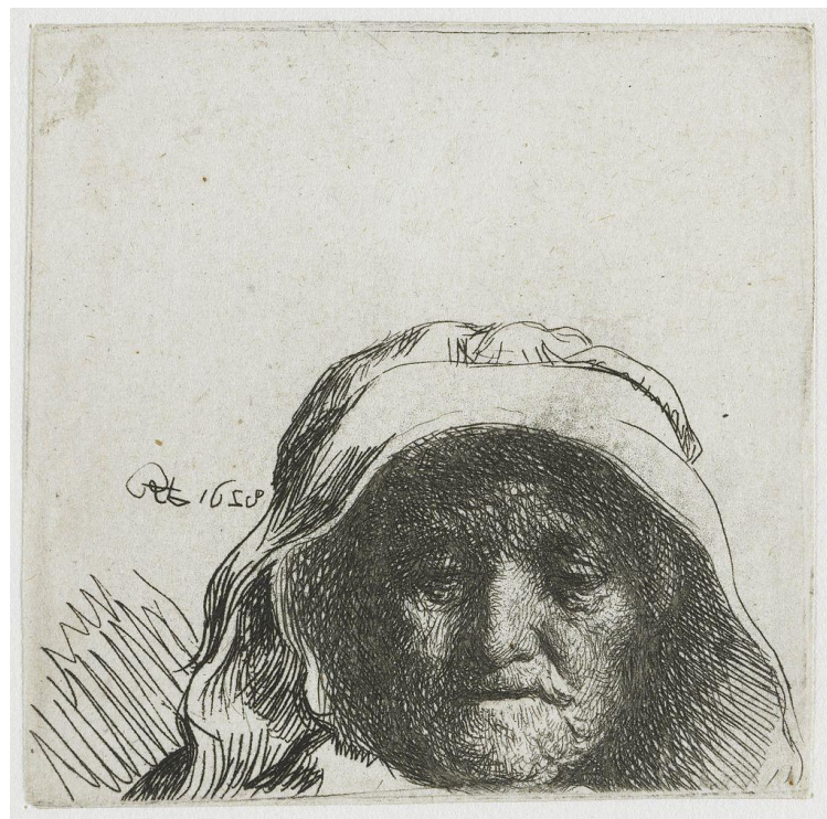
Slika 7. Portret umjetnikove majke, Rembrandt, 1628.

Već kroz nekoliko godina Rembrandt je postao majstor tehnike bakropisa. Portret njegove majke iz 1628. dokaz je napretka koji se dogodio u samo dvije do tri godine isprobavanja tehnike. Kontrast i teksture koje je postigao njegovim su suvremenicima bile toliko nevjerovatne da je bio optužen za korištenje tajnih tehnika koje ne želi podijeliti s drugima.[8]