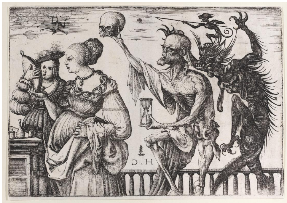
Slika 2. Death and the Devil Surprising Two Women, Daniel Hopper

Krajem 15. stoljeća, njemački umjetnik Daniel Hopper počeo je koristiti materijale koji su bili uobičajeni za graviranje pri otiskivanju. Mnogi ga smatraju začetnikom modernog otiskivanja. Danas se u tehnikama bakropisa i suhe igle najčešće koriste ploče od bakra, cinka ili čelika, no Hopper je koristio željezo, materijal na koji je navikao jer se on koristi u procesu graviranja.[5]