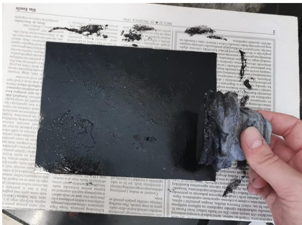
Slika 26. Utrljavanje boje

Zatim se mora skinuti višak boje, ali ne previše kako bi se dobio kvalitetan i izražen otisak. Na ploču s bojom se poliježu novine i trljanjem dlana se pločica zagrijava. Novine se podižu i skidaju boju s ploče. Nakon nekog vremena, prestat će se lijepiti za ploču i moći će se direktno trljanjem novina skidati višak boje. Znati koliko boje skinuti stvar je iskustva; ponešto vježbe potrebno je da se nauči ravnomjerno skinuti boja kako bi pozadinski ton bakropisa bio ravnomjeran na otisku.