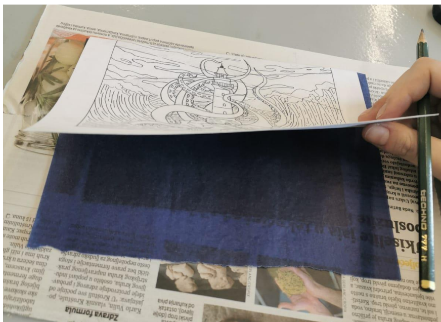
Slika 21. Pozicija indigo papira

Dizajn se prenosio na ploču pomoću indigo papira. Radi preciznosti, skica je ljepljivom trakom učvršćena za stražnju stranu ploče, i između njih se postavlja indigo papir.