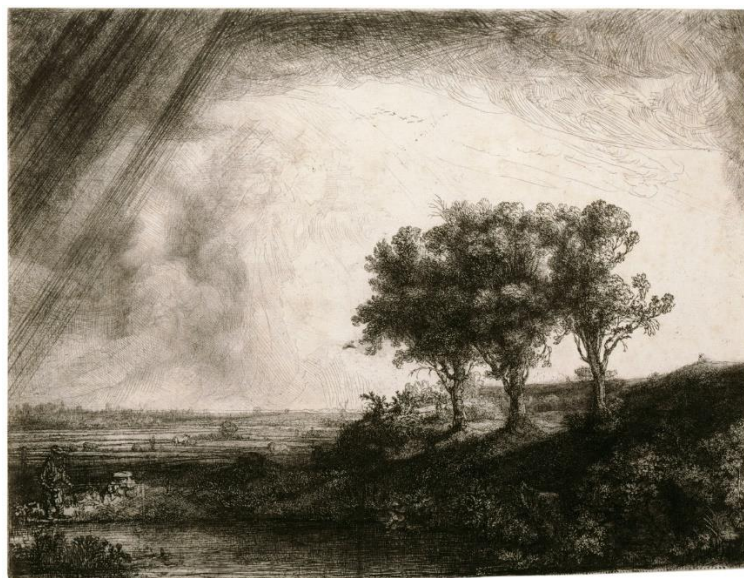
Slika 14. Tri drva, Rembrandt, 1643.

Rembrandt Harmenszoon van Rijn prvi je uvidio potencijal suhe igle, kao samostalnu tehniku i u kombinaciji s bakropisom. [11]