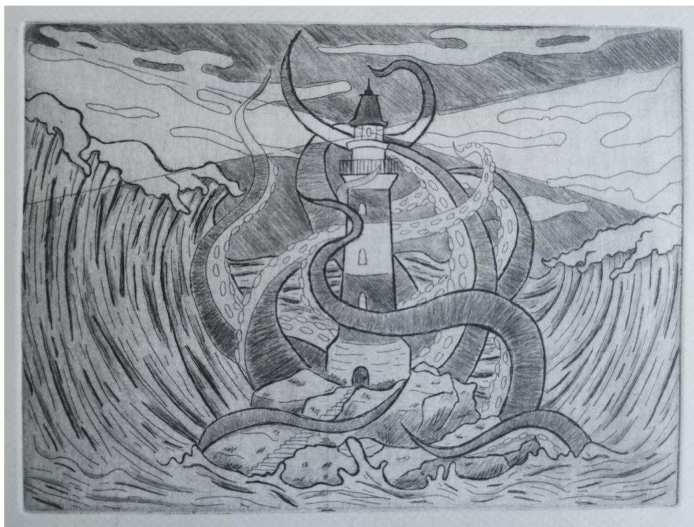
Slika 32. Treći rad

Kod trećeg rada su svjetla na svjetioniku izvedena nakon faze bakropisa. Ploča nije bila pravilno ispolirana te je iz tog razloga pozadinski ton bio tamniji, što je omogućilo da se pasta za poliranje nanese na dijelove gdje se pružaju zrake svjetla iz svjetionika i poliranjem se nakon otiskivanja posvjetljuju. Iako zahtijevaju određenu količinu iskustva i vježbe, rad nije upropašten kada dođe do greške. Štoviše, greška može inspirirati nove ideje i u konačnici poboljšati konačni rezultat.