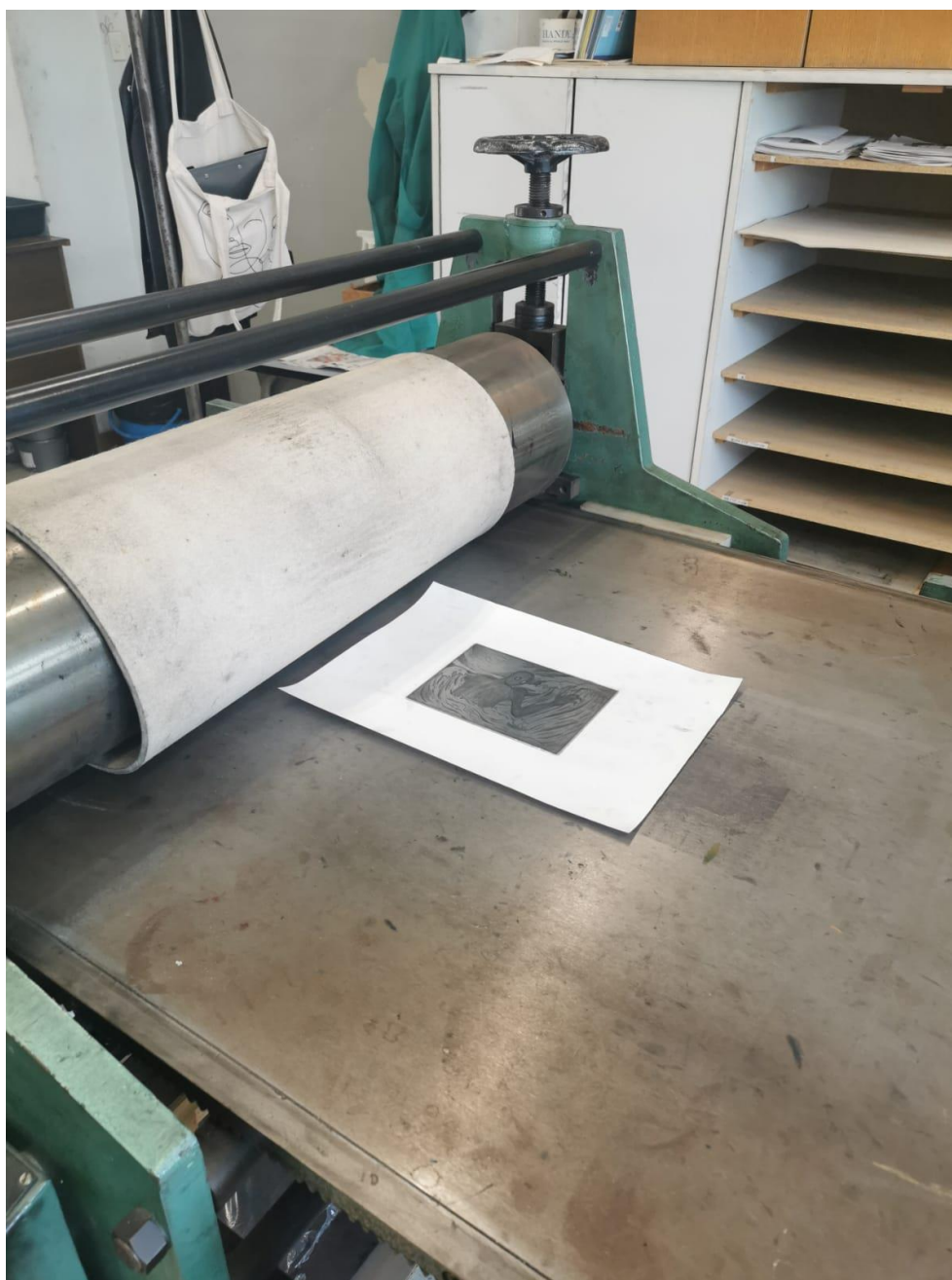
Slika 28. Postavljanje na prešu

Na paser se stavlja ploča s bojom, na nju osušeni ali vlažan papir i sve se preklapa filcem.