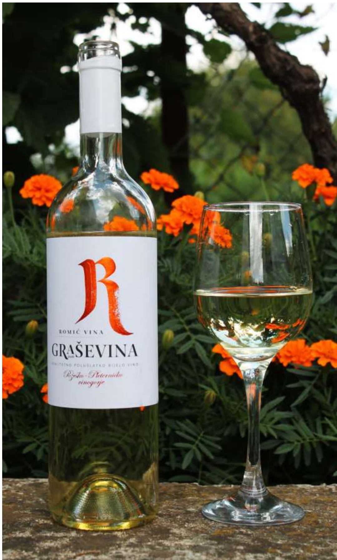
Slika 16: Autorska fotografija – Vina Romić Graševina, poluslatko bijelo vino