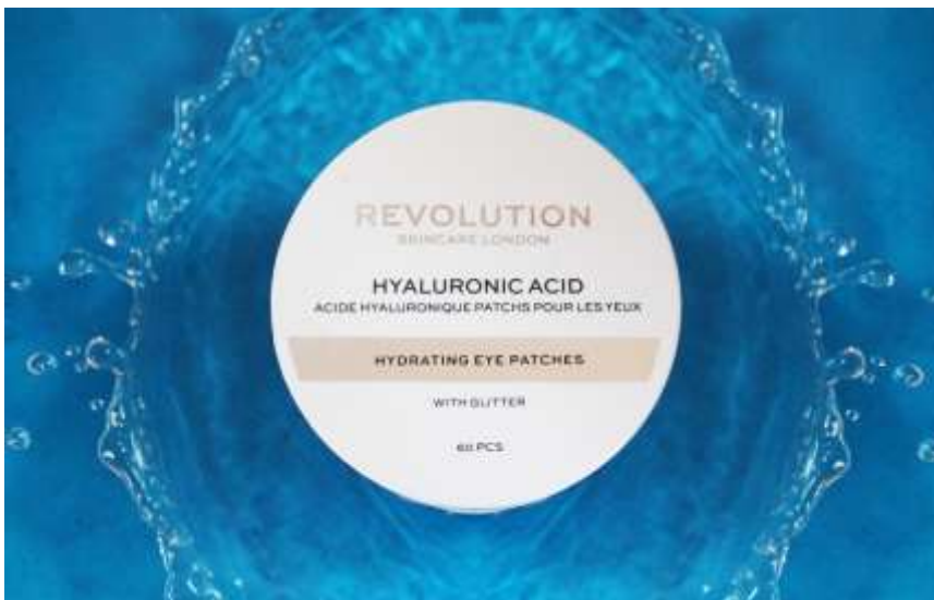
Slika 21: Autorska fotografija – Revolution Hyaluronic acid Hydrating eye patches – Fotografija prije i poslije naknadne obrade

Na fotografiji proizvoda Revolution Hyaluronic acid Hydrating eye patches uređeni su određeni dijelovi fotografije kako bi izgledala privlačnije potencijalnim kupcima. Desni dio originalne fotografije na kojemu je prikazana raspršena voda je kopiran te prenesen na lijevu stranu fotografije kako bi se postigla simetrija te željeni efekt. Na plohi na samom proizvodu na kojemu je napisan naziv proizvoda "Hydrating eye patches" uklonjena je neželjena refleksija u desnome kutu, popravljene su boje te su uklonjena manje smetnje koja su prisutne radi oštećenja proizvoda. Također je u manjim omjerima povećan intenzitet svjetlosti, kontrasta i boje kako bi fotografija izgledala privlačnije.