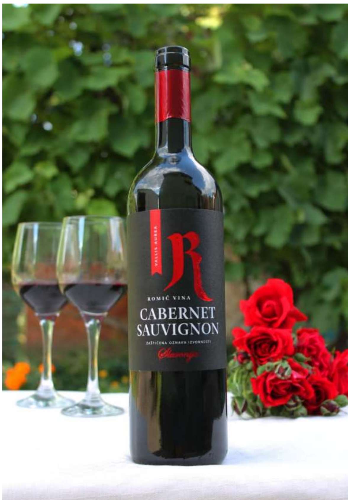
Slika 18: Vina Romić Cabernet Sauvignon