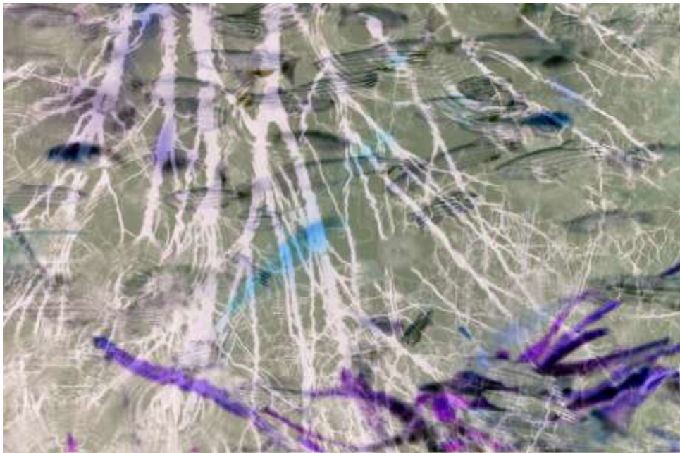
Autorska fotografija 15

Fluidnost i valoviti oblici predstavljaju stalno promjenjivu prirodu naših unutarnjih iskustava, dok figura nalik dimu briše granice između snova i realnosti.