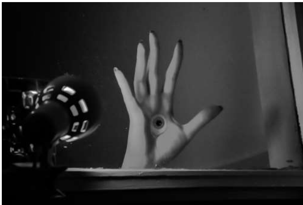
Autorska fotografija 10

Ova nadrealna fotografija predstavlja vizualno upečatljivu i emocionalno nabijenu pripovijest usredotočenu na simboliku ispruženog dlana s jedinstvenim, proganjajućim elementom - očnom jabučicom u svome središtu. Kompozicija potiče gledatelje na razmišljanje o temama ranjivosti, percepcije i uznemirujućeg križanja organskog i mehaničkog.