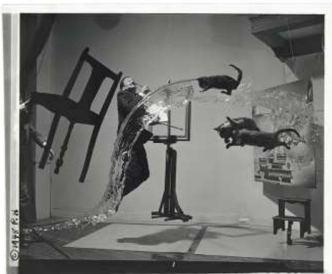
Fotografija 1. Philippe Halsman, Salvador Dali A , 1948.

Jedna od značajki nadrealističke fotografije je njezino korištenje jukstapozicije, distorzije i neočekivanih kombinacija. Nadrealistički fotografi, poput Salvadora Dalíja, kojega vidimo na fotografiji 1, Mana Raya i Claudea Cahuna, vješto manipuliraju svojim subjektima i okolinom kako bi stvorili kompozicije koje su istovremeno intrigantne i dezorijentirajuće. Kroz manipulaciju mjerilom, perspektivom i kontekstom, oni provociraju gledatelje da preispitaju temeljnu prirodu objekata i prizora koji su pred njima. Postavljajući različite elemente jedan pored drugog ili ih spajajući u jedan kadar, nadrealisti nas potiču da istražimo iznenađujuće veze i kontraste koji se pojavljuju između poznatog i nepoznatog. [7]