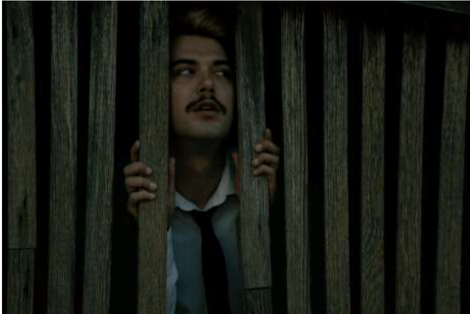
Autorska fotografija 2

Fotografija 2 živopisno prikazuje trenutak suspendiran u vremenu, izazivajući osjećaj intrige i introspekcije. U svojoj srži, prikazuje mladog čovjeka s prepoznatljivim brkovima, odjevenog u čistu bijelu košulju i svečanu crnu kravatu - odabir garderobe koji se često povezuje s formalnošću i društvenim konvencijama, elementima koje je nadrealizam često osporavao. Središnja točka ove kompozicije nalazi se u položaju mladića unutar drvene ograde ili strukture nalik kavezu. Nadrealizam često prihvaća jukstapoziciju i zamagljivanje granica, a ovdje, jukstapozicija između čvrstoće drvenog ograđenog prostora i neizvjesnosti onoga što leži iza nje odražava ovaj nadrealistički etos. Grubo obrađene daske simboliziraju prepreku, ograničenje ili podjelu, slično barijerama svjesnog uma koje nadrealisti nastoje nadići.