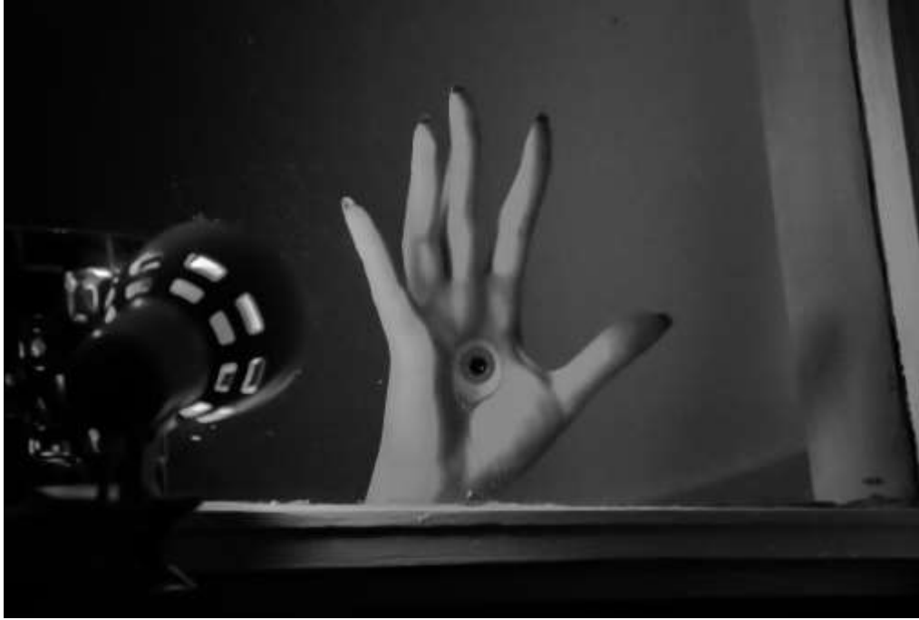
Autorska fotografija 10

Ova nadrealna fotografija predstavlja vizualno upečatljivu i emocionalno nabijenu pripovijest usredotočenu na simboliku ispruženog dlana s jedinstvenim, proganjajućim elementom - očnom jabučicom u svome središtu. Kompozicija potiče gledatelje na razmišljanje o temama ranjivosti, percepcije i uznemirujućeg križanja organskog i mehaničkog.