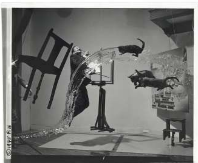
Fotografija 1. Philippe Halsman, Salvador Dali A , 1948.

Jedna od značajki nadrealističke fotografije je njezino korištenje jukstapozicije, distorzije i neočekivanih kombinacija. Nadrealistički fotografi, poput Salvadora Dalíja, kojega vidimo na fotografiji 1, Mana Raya i Claudea Cahuna, vješto manipuliraju svojim subjektima i okolinom kako bi stvorili kompozicije koje su istovremeno intrigantne i dezorijentirajuće. Kroz manipulaciju mjerilom, perspektivom i kontekstom, oni provociraju gledatelje da preispitaju temeljnu prirodu objekata i prizora koji su pred njima. Postavljajući različite elemente jedan pored drugog ili ih spajajući u jedan kadar, nadrealisti nas potiču da istražimo iznenađujuće veze i kontraste koji se pojavljuju između poznatog i nepoznatog. [7]