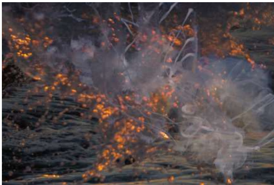
Autorska fotografija 14

U nadrealističkom kontekstu, ova fotografija dovodi u pitanje konvencionalne percepcije stvarnosti i poziva gledatelje da istraže raskrižje struktura koje su napravili ljudi i priroda. Geometrijska struktura može predstavljati red i strukturu koju nameće društvo, dok kružna mrlja i okvir izazivaju osjećaj čuđenja i znatiželje o misterijama prirodnog svijeta i ljudskog uma. Ova fotografija potiče gledatelje na razmišljanje o dinamičnom odnosu između ljudskog i prirodnog, strukturiranog i organskog, te samog čina percepcije.