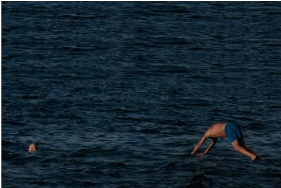
Autorska fotografija 12

trenutak intenzivnih emocija i egzistencijalnog propitivanja, usklađujući se sa srži nadrealističkog istraživanja ljudske psihe i zagonetnih aspekata postojanja.