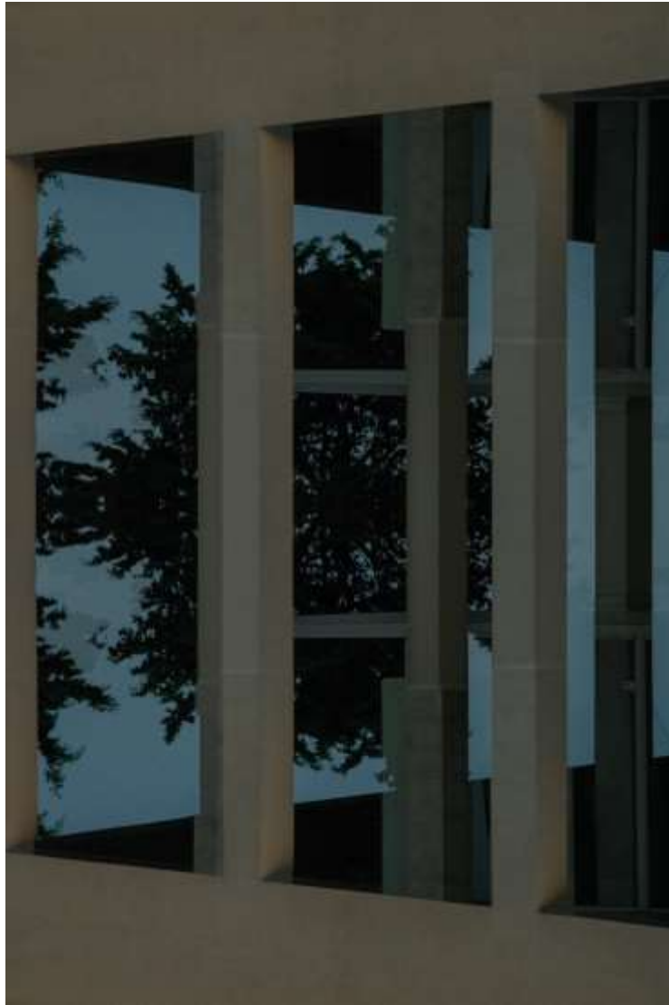
Autorska fotografija 13

Nadrealni aspekt leži u umnažanju čovjeka, što dovodi u pitanje konvencionalne predodžbe o vremenu i identitetu. Potiče gledatelje da razmišljaju o međusobnoj povezanosti naših iskustava i o tome kako naša prošlost, sadašnjost i budućnost koegzistiraju i međusobno djeluju.