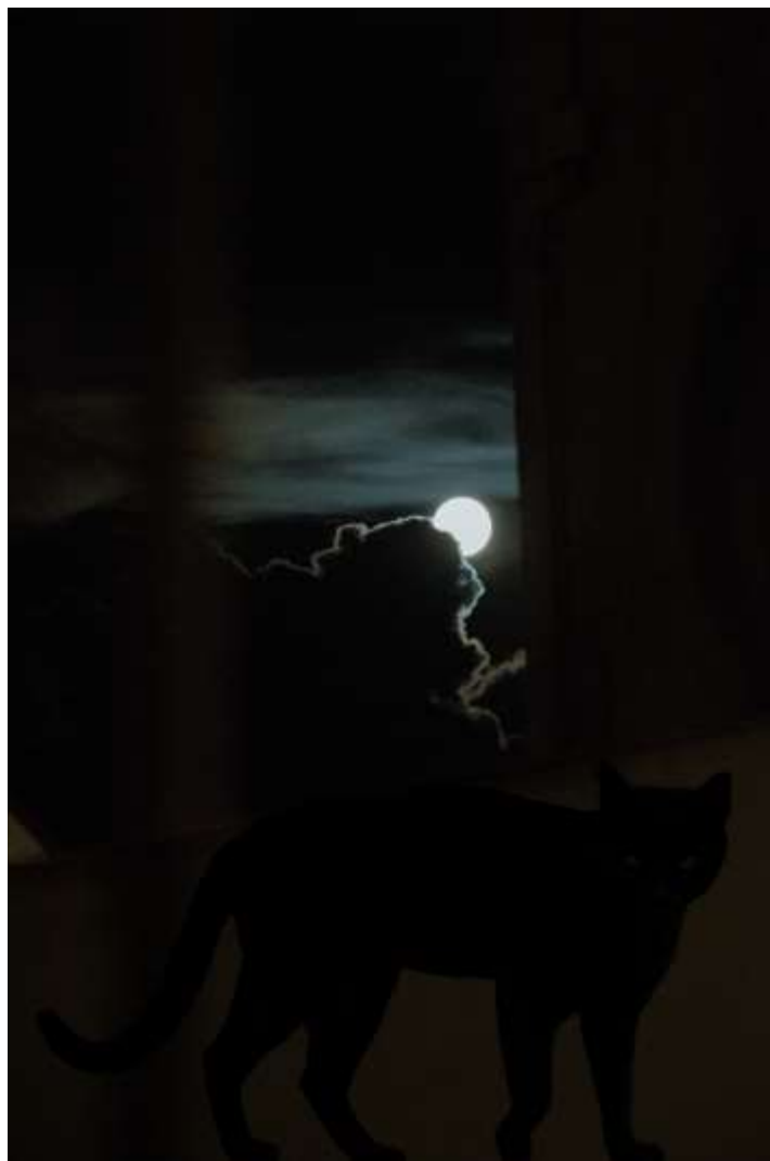
Autorska fotografija 9

Ova fotografija nudi evokativno putovanje u nadrealno, gdje elementi mora i metalni okvir koegzistiraju u carstvu dvosmislenosti i simbolike. Izaziva našu percepciju, potiče nas da razmišljamo o beskonačnom i poziva nas da istražimo paradokse stvarnosti.