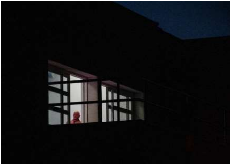
Autorska fotografija 1

Ova enigmatična fotografija bilježi nadrealističku atmosferu u kojoj igra svjetla i sjene stvara jezivu priču. Noćnim prizorom, obavijenim mrakom, dominira oštra silueta zgrade, čiji obrisi bacaju duge, tajanstvene sjene. Središnja žarišna točka ove kompozicije nedvojbeno je prozor na drugom katu, koji služi kao jedini izvor rasvjete u ovoj inače tamnoj sceni. Kao gledatelje, odmah nas privlači ovaj izvor svjetla, a pogled nam je fiksiran na jezoviti prizor iznutra. Na prvi pogled, grimizna figura unutar prozora izgleda poput čovjeka, a njezina prisutnost izaziva osjećaj slutnje i nemira. Upotreba crvene boje, boje koja se često povezuje s emocijama i intenzitetom, pojačava nelagodu, dodajući element visceralne nelagode prizoru.