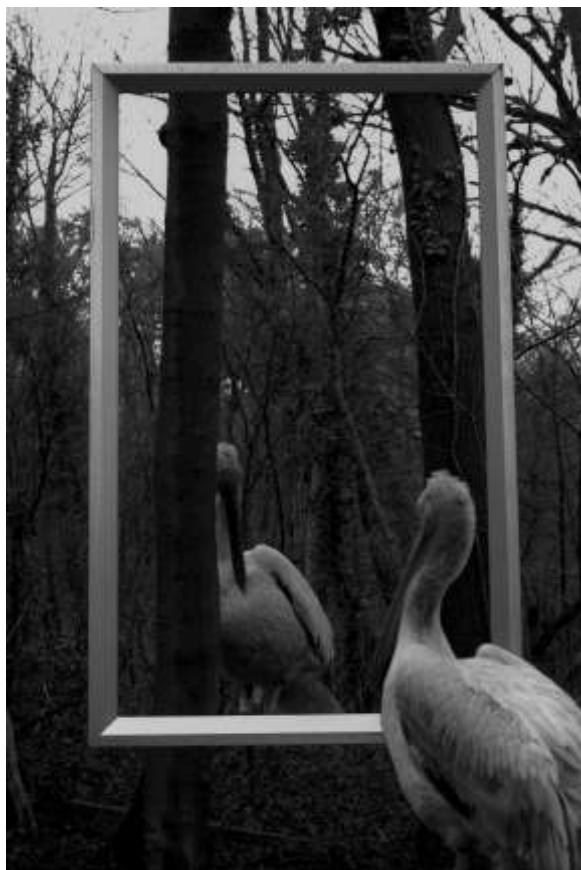
Autorska fotografija 7

Crno-bijela kompozicija fotografije dodatno produbljuje njezinu nadrealnu i zagonetnost. Odsutnost boje eliminira vizualne smetnje koje boja često uvodi, usmjeravajući našu pozornost na temeljne elemente scene - pelikane, pravokutnik i šumu.