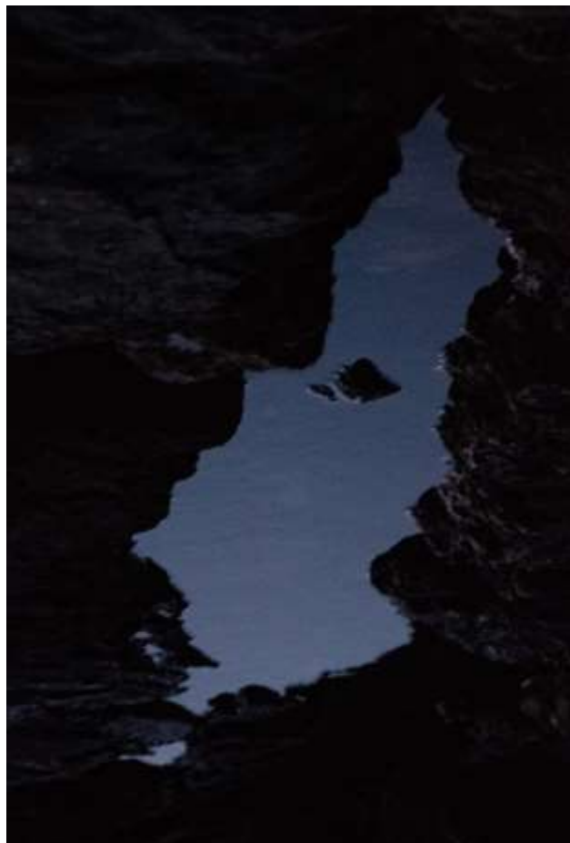
Autorska fotografija 6

Ova nadrealistička fotografija osvaja gledatelje svojim simboličkim bogatstvom i međuigrom boje i crno-bijelih elemenata. Potiče na razmišljanje o dualnosti postojanja, skrivenim aspektima ljudske psihe i međusobnoj povezanosti prirodnog i ljudskog svijeta. Velom obavijene figure, živopisno zelenilo i krajolik iz snova pridonose nadrealnoj atmosferi koja potiče interpretaciju i introspekciju, prihvaćajući duh nadrealizma u vizualnom pripovijedanju.