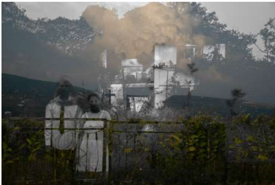
Autorska fotografija 5

Postupci mlade žene dodatno produbljuju nadrealizam unutar fotografije. Njezina ruka poseže u stari kovčeg pun slika - simbol sjećanja, nostalgije ili podsvijesti. Kofer postaje portal u drugu dimenziju, gdje prošlost i sadašnjost koegzistiraju. Nadrealizam često istražuje ideju vremena kao fluidnog i nelinearnog, a kofer utjelovljuje taj koncept dopuštajući pristup području izvan neposrednog. U drugoj ruci drži crno-bijelu sliku muškarca. Korištenje jednobojnih slika usred šarenog okruženja naglašava dualnost postojanja, odražavajući nadrealističke teme kontrasta i jukstapozicije. Identitet i značaj čovjeka na fotografiji ostaju otvoreni za tumačenje, pozivajući gledatelje da razmisle o vezi između dvije figure i implikacijama njihove interakcije.