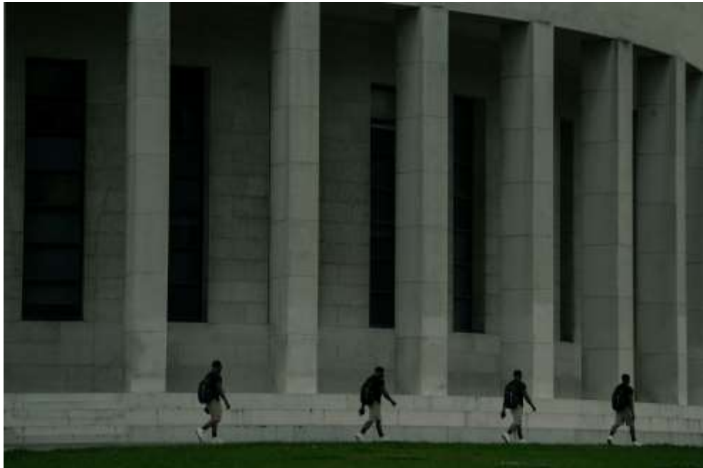
Autorska fotografija 12

Ova fotografija postavlja pitanja o identitetu, odvojenosti i odnosu između pojedinaca i njihove okoline.