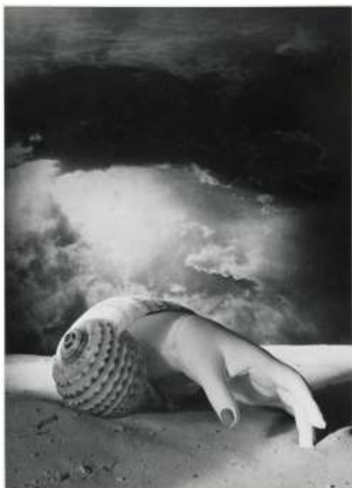
Fotografija 2. Dora Maar, Untitled (Hand-Shell), 1934.

Fotomontaža je složena fotografska slika napravljena: lijepljenjem pojedinačnih otisaka ili dijelova otisaka, uzastopnim izlaganjem pojedinačnih slika na jednom listu papira ili istovremenim izlaganjem sastavnih slika preko superponiranih negativa. U 1880-ima jukstapozicija odvojenih slika kroz uzastopne ekspozicije postala je moderna u "kombiniranom otisku", posebno u obliku izmišljenog grupnog portreta. Subjektivne, fragmentirane, potencijalno apsurdne kvalitete ove jukstapozicije iskorištavali su dadaistički i futuristički umjetnici s početka 20. stoljeća. [8]