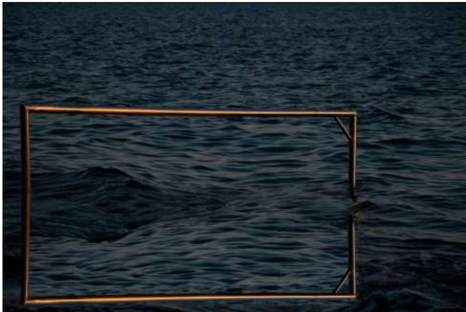
Autorska fotografija 8

U konačnici, crno-bijeli tretman fotografije pojačava njezine nadrealističke kvalitete pojednostavljuvanjem vizualnog narativa i intenziviranjem međuigre svjetla i sjene. Potiče gledatelje da se usredotoče na temeljne teme refleksije, dualnosti i enigmatične prirode percepcije.