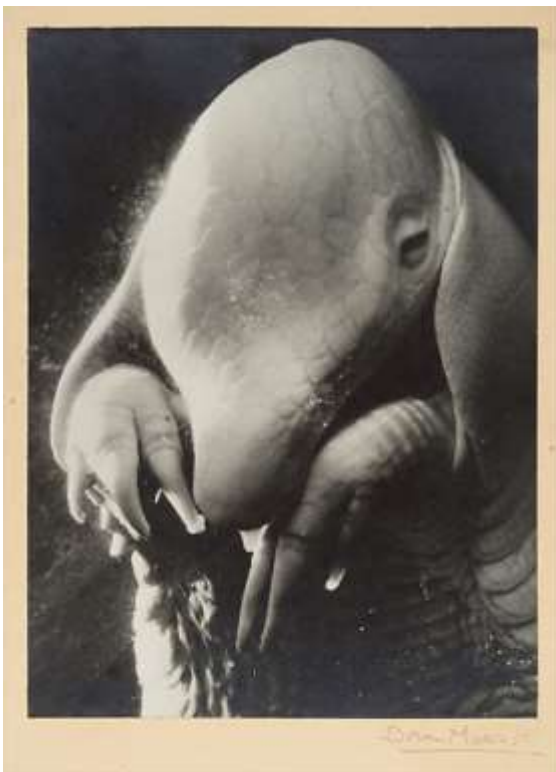
Fotografija 6. Dora Maar, Père Ubu , 1936.

Iako je kasnije godine provela u tišini, Maar je naposljetku pronašla put natrag u tamnu komoru, stvarajući slike bez fotoaparata koje su spojile njezin apstraktni senzibilitet s ispitivanjem samog negativa fotografije. Umjesto izlaganja negativa scenama kroz objektiv, Maar se poigravala s njihovim površinama, koristeći kiselinu, tragove ogrebotina i energične poteze bojom. Kad je ispisivala svaki eksperiment, stavljala je u fokus svaku apstraktnu kompoziciju: poput vlastitog zamršenog života, otkrila je svu njegovu složenost. [14]