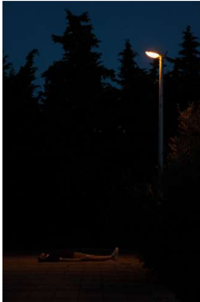
Autorska fotografija 3

svjetla i sjene spajaju kako bi stvorili vizualno upečatljivu i emocionalno nabijenu kompoziciju koja ostavlja promatrača u stanju čuđenja i kontemplacije.