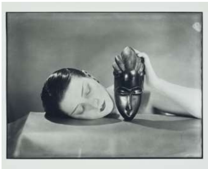
Fotografija 3. Man Ray, Noire et Blanche (Black & White) , 1926.

Umjetnički počeci Man Raya dogodili su nekoliko godina ranije, u pokretu dadaizmu. Oblikovani traumom Prvog svjetskog rata i pojavom moderne medijske kulture — utjelovljene napretkom komunikacijskih tehnologija poput radija i kina — dadaistički umjetnici dijelili su duboko razočaranje tradicionalnim načinima stvaranja umjetnosti i često su se umjesto toga okretali eksperimentiranju sa slučajnošću i spontanošću. Godine 1922., šest mjeseci nakon što je iz New Yorka stigao u Pariz, Man Ray napravio je svoje prve fotograme. Da bi ih napravio, stavljao je predmete, materijale, a ponekad i dijelove vlastitog ili tijela modela na list fotosenzibiliziranog papira i izlagao ih svjetlu, stvarajući negative. Man Ray je u svojim fotogramima prihvatio mogućnosti iracionalnih kombinacija i slučajnih rasporeda objekata, naglašavajući apstrakciju tako napravljenih slika. Otprilike u isto vrijeme, Man Rayevi eksperimenti s fotografijom odveli su ga u središte nadrealističkog pokreta u Parizu. [11]