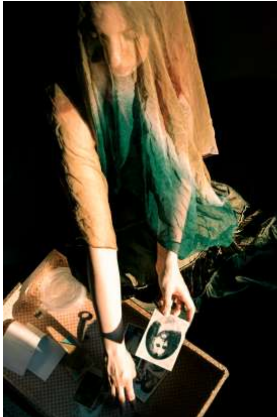
Autorska fotografija 4

dvosmislenosti. Grm, samo djelomično osvijetljen uličnom svjetiljkom, čini se kao živo biće, gotovo osjećajno, kao da krije tajne u svojim granama. Nadrealizam često oživljava nežive predmete, prožimajući ih neočekivanim životom i sviješću. U tom kontekstu, grm poprima nadrealnu kvalitetu, kao da ima ulogu u pripovijesti koja se odvija. Pozadina tamne zimzelene šume naspram tamnoplavog neba pojačava nadrealnu atmosferu. Nadrealisti često koriste prirodne elemente i pejzaže iz snova kako bi pobudili osjećaj nepoznatog ili podsvjesnog. Šuma svojom dubinom i tajanstvenošću postaje metaforička kulisa čovjekovog zagonetnog putovanja.