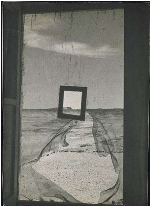
Fotografija 4. Lee Miller, Portrait of Space , 1937.

Millerin nadrealizam ima veze s njezinom sposobnošću da "naopako" gleda na svijet. Ovako hvata inače neprimjetne trenutke i, usprkos njihovoj običnosti, u njima pronalazi veliku dramatičnost. Jedan od Millerinih velikih doprinosa nadrealističkoj fotografiji bila je solarizacija - upravo su Miller i Man Ray otkrili što bi se moglo dogoditi ako bi se svjetla iznenada upalila tijekom procesa razvijanja: tonovi se preokrenu i formiraju se sablasni obrisi. Lee Miller bile je nadrealistica u pravom smislu riječi od početka do kraja svog života. [12]