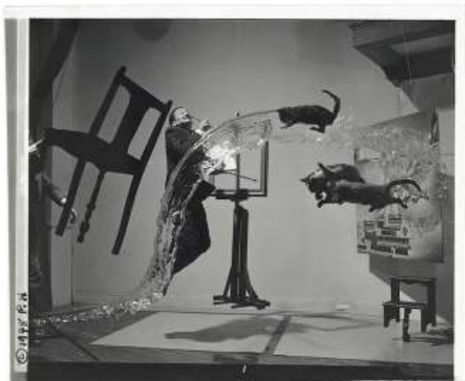
Fotografija 1. Philippe Halsman, Salvador Dali A , 1948.

Jedna od značajki nadrealističke fotografije je njezino korištenje jukstapozicije, distorzije i neočekivanih kombinacija. Nadrealistički fotografi, poput Salvadora Dalíja, kojega vidimo na fotografiji 1, Mana Raya i Claudea Cahuna, vješto manipuliraju svojim subjektima i okolinom kako bi stvorili kompozicije koje su istovremeno intrigantne i dezorijentirajuće. Kroz manipulaciju mjerilom, perspektivom i kontekstom, oni provociraju gledatelje da preispitaju temeljnu prirodu objekata i prizora koji su pred njima. Postavljajući različite elemente jedan pored drugog ili ih spajajući u jedan kadar, nadrealisti nas potiču da istražimo iznenađujuće veze i kontraste koji se pojavljuju između poznatog i nepoznatog. [7]