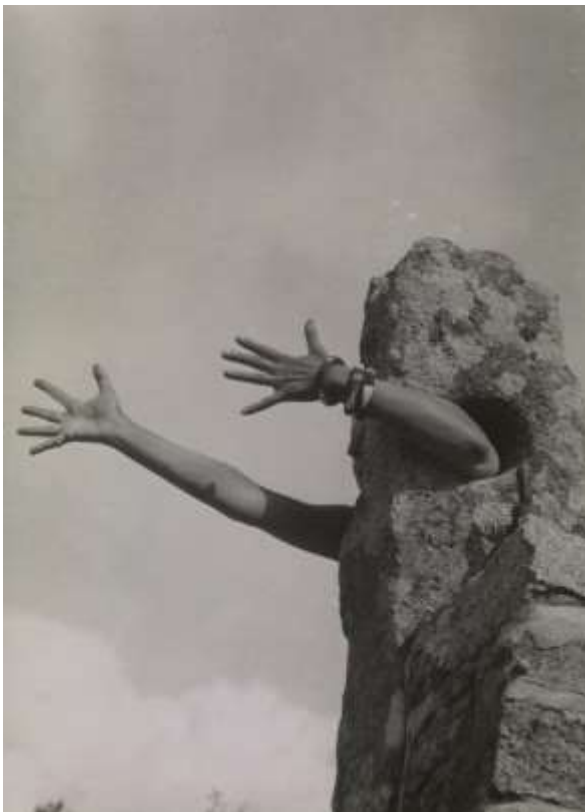
Fotografija 5. Claude Cahun, Extend my arms , 1931. ili 1932.

Tragično, u skladu s fragmentarnom prirodom Cahunina gledišta, velik dio umjetničinog djela uništen je nakon uhićenja i kasnijeg zatvaranja zbog otpora protiv nacista. Ono što ostaje pokazuje zanimljivu paralelu s naslovom Cahunine dnevničke publikacije Aveux Non Avenus , u prijevodu Odricanja , koja zagonetno sugerira da je usprkos svemu što je otkriveno i dano, mnogo toga još skriveno ili izgubljeno. [13]