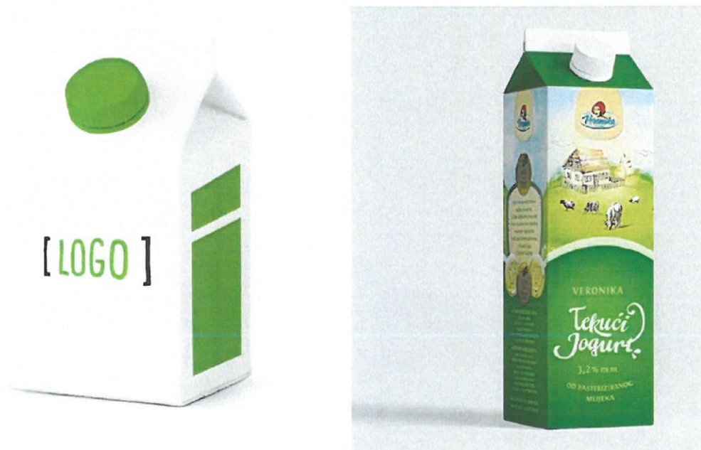
Slika 1: Primjer odnosa ambalaže i logotipa

Logotip i ambalaža trebaju biti usklađeni kako bi zajedno stvorili snažan vizualni identitet brenda. Logotip se često nalazi na ambalaži kao ključni element prepoznavanja brenda. Kroz kreativan dizajn ambalaže i upotrebu logotipa, brendovi mogu istaknuti svoju jedinstvenost na tržištu i privući pažnju potrošača. Dobro osmišljeni logotip i ambalaža mogu postati prepoznatljivi simboli kvalitete, pouzdanosti i dostupnosti proizvoda, oni su neodvojivi elementi vizualnog identiteta brenda. Logotip predstavlja vizualni simbol brenda, dok ambalaža igra ključnu ulogu u privlačenju pažnje potrošača i stvaranju prvog dojma o proizvodu.