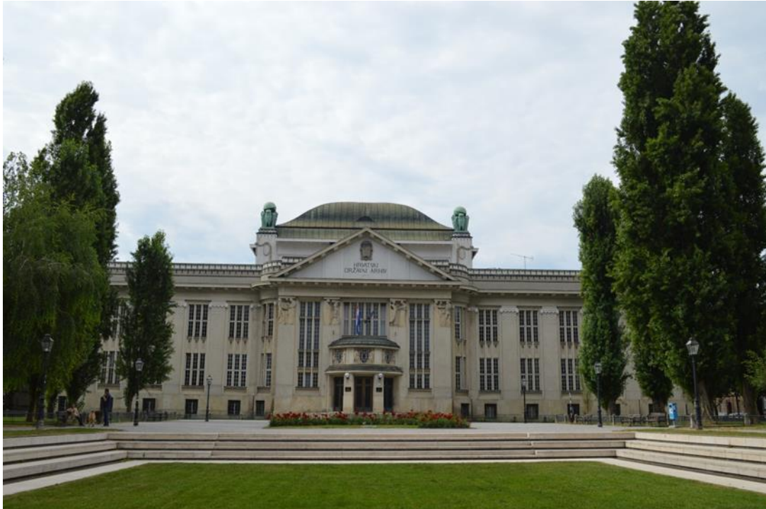
slika 23: Hrvatski državni arhiv

Zgrada Hrvatskog državnog arhiva izgrađena je početkom 20. stoljeća i predstavlja jedan od najljepših objekata iz doba secesije u Hrvatskoj. Uspješna je to kombinacija ranog bečkog secesionizma i moderne europske arhitekture. Zamišljena je kao samostalna zgrada u perivoju što se dobro uklapa u urbanistički model Donjeg grada. [17]