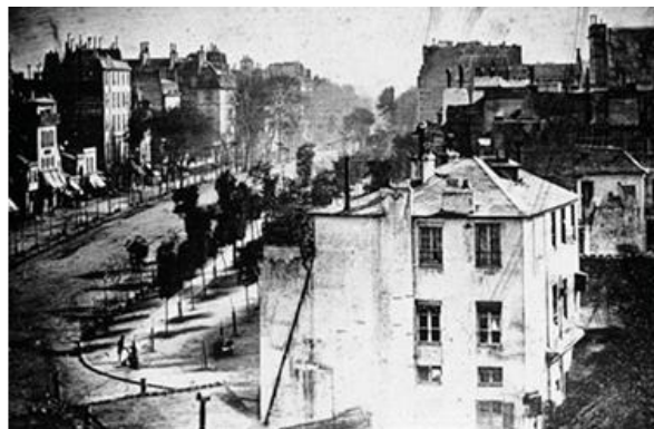
Slika 2: Louis Daguerre, Boulevard du Temple