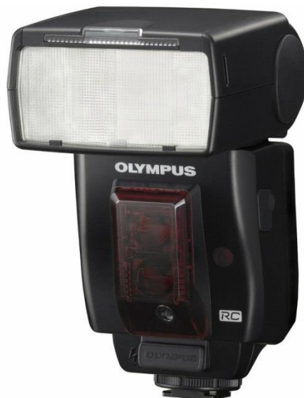
Slika 13: Vanjska, ujedno i bežična bljeskalica

Korištenjem bljeskalice ugrađene u fotografski aparat, dobivaju se fotografije niske kvalitete. Pritiskom na okidač ona daje oštru, nagrđujuću i zasljepljujuću svjetlost. Može osvijetliti objekte udaljene najviše 2 do 4 metra. Da bi se dobila kvalitetnija fotografija, koriste se vanjska i bežična bljeskalica. Vanjska bljeskalica se može pričvrstiti na fotografski aparat ili se koristi odvojeno, upravlja se pomoću kabela ili daljinskim upravljanjem. Ova vrsta bljeskalice ne stvara efekt crvenih očiju, kao što je to slučaj kod ugrađene, može se usmjeriti kamo god se želi, nudi veću kontrolu, a i proizvodi jači bljesak. Vanjske bljeskalice uglavnom funkcioniraju kao bežične (slika 13). Prednost im je da ih se može staviti bilo gdje te kontrolirati pomoću "Triggera". Trigger je naziv za uređaj uz pomoć kojeg se mogu snimati fotografije s udaljenosti. [10]