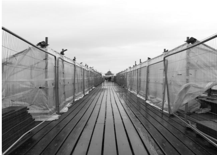
Slika 14: Primjer linearne perspektive u fotografiji

Atmosferska perspektiva se u većini slučajeva odnosi na fotografije u kojima su prikazane veće udaljenosti. Povećanje udaljenosti očituje se slabljenjem jačine boje i gubljenjem detalja predmeta i oblika. Pojave što nastaju u zraku kao što su kiša, magla, oblaci, dim, vlaga i brojne druge utječu na blijede boje proporcionalno s udaljenošću. Boje objekata u daljini su iz tog razloga nezasićene, blijede, nekontrastne, svjetlije i hladnije nego što su u stvarnosti (slika 15).