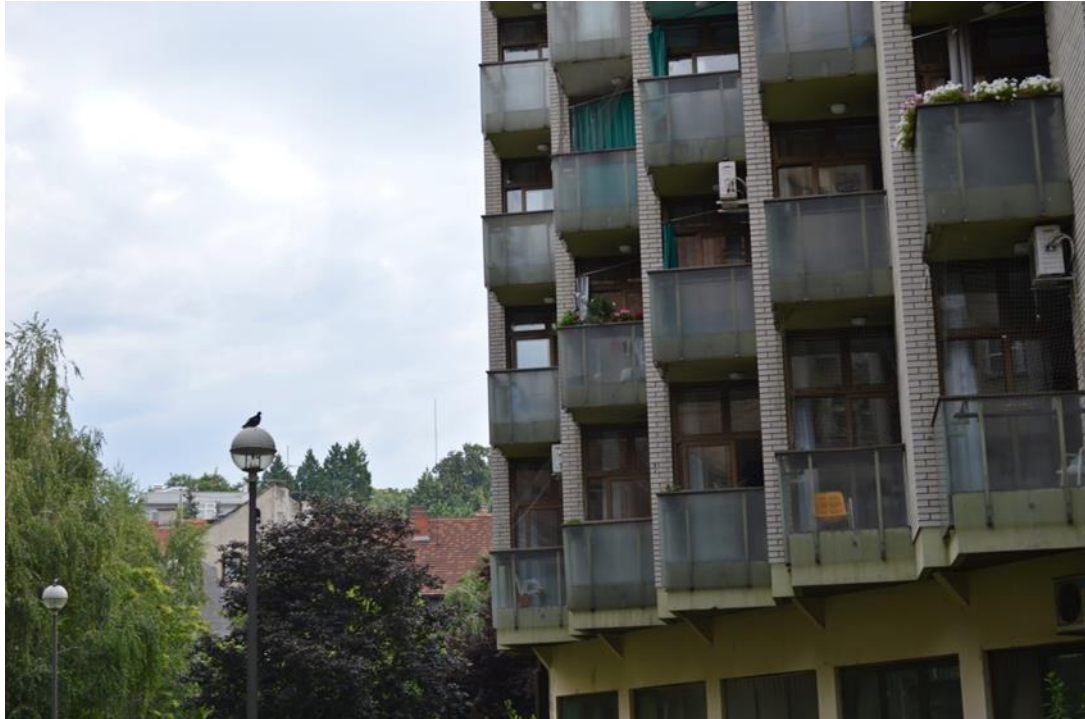
Slika 22: Dom Medveščak