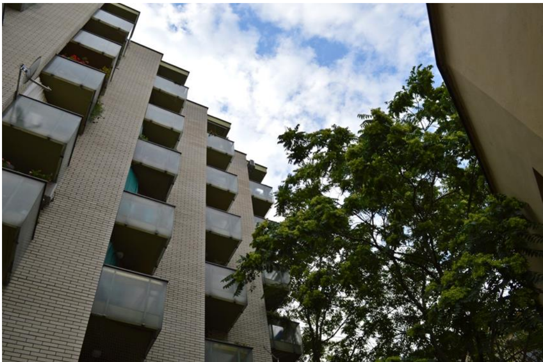
Slika 21: Dom Medveščak, snimano iz donjeg rakursa

Dom za starije i nemoćne sljedeća je snimljena lokacija smještena u staroj jezgri grada Zagreba. Snimljena je zbog svoje zanimljive i pomalo neobične vanjštine koja omogućava različite kreativne pristupe u svrhu dobivanja što boljih fotografija. Na slici 21 u točku fokusa postavljena je zgrada Doma, ali na malo drugačiji način, i to tako da je okružena drugom zgradom koja nije previše bitna, no svejedno doprinosi općem ugođaju fotografije. Okružena je i velikim stablom koje se dobro uklopilo i pripomoglo stvaranju skladne cjeline. Snimanje iz donjeg rakursa povećalo je značaj glavnog objekta snimanja.