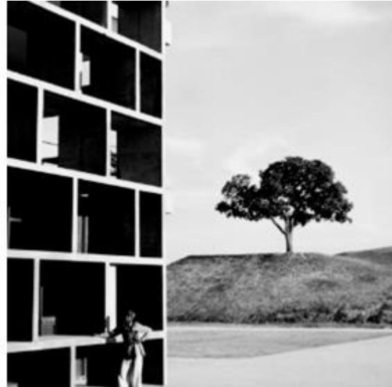
Slika 8: Lucien Hervé, Tree, umjetnička fotografija arhitekture

Navedena podjela nije jedina, tako se fotografiju arhitekture još može podijeliti s obzirom na vrijeme kad je građevina nastala pa se razlikuju klasična i moderna arhitektura.