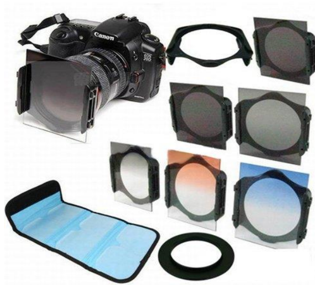
Slika 12: Prikaz različitih filtera

Osim njih, važnost je potrebno pridati i UV filterima koji su primjenu našli u svakoj vrsti fotografije zbog funkcije koju obavljaju. Naime, oni fotografiji ne čine apsolutno ništa, ali štite vanjsko staklo objektivu što je veoma bitno jer u svijetu SLR fotografskih aparata glavninu cijene čine upravo objektivu.