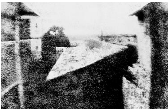
Slika 1: J. N. Niépce, Pogled kroz prozor u La Grasu