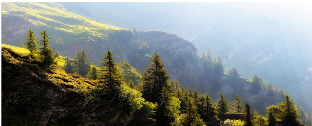
Slika 15: Primjer atmosferske perspektive u fotografiji

Pri snimanju arhitekture, atmosferska perspektiva najviše dolazi do izražaja prilikom snimanja određenog područja ili panorama. Smanjenom dubinskom oštrinom se može naglasiti dubina ili stavljanjem u prvi plan nekoliko tamnijih tonova kao kontrast. Da bi se postigla atmosferska perspektiva, koriste se teleobjektivi s velikim otvorom objektivna.