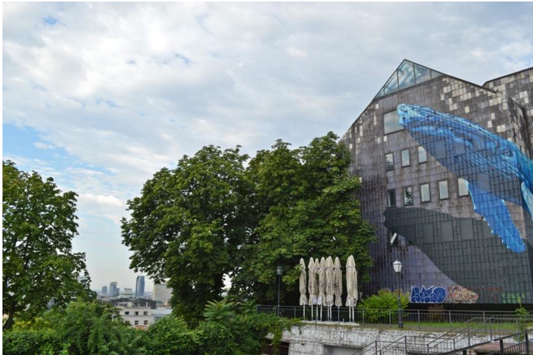
Slika 19: Galerija Gradec

Na slici 18 prikazana je fotografija Galerije Gradec snimana rano ujutro, baš kao i ostale fotografije ovog objekta. Snimano je u navedeno doba dana s ciljem dobivanja što boljeg osvjetljenja. Fokus je stavljen na sklad koji dominira među krovom i ostatkom ove poprilično oronule zgrade.