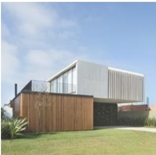
Slika 5: Nico Saieh, House in Linderos, primjer dokumentarne fotografije arhitekture