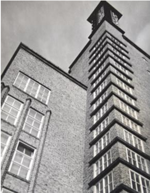
Slika 3: Albert Renger - Patzsch, Der Rogo - Turm

Njezina prednost leži u brzini prijenosa i gotovo neograničenom broju kopija koje se mogu napraviti zbog čega u današnje doba prednjači u svim područjima fotografije pa tako i u fotografiji arhitekture.