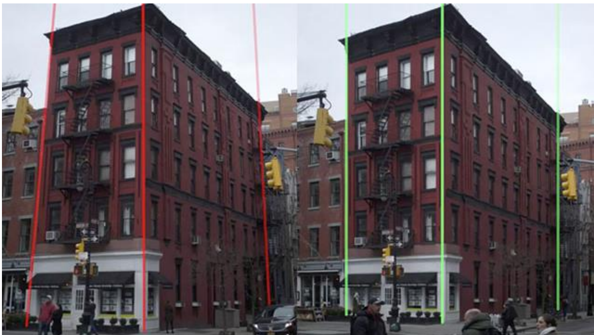
Slika 11. Desni dio fotografije prikazuje učinak fotografije snimljene tilt and shift objektivom

Tilt and shift objektivni svoju primjenu našli su prvenstveno u fotografiji arhitekture. Služe za ispravljanje geometrijskih izobličenja nastalih pri snimanju na širokom kutu. Tilt 1 i shift 2 označavaju dvije osnovne mogućnosti gibanja prednje leće tih objektivni. Tilt je definiran kao kut koji zatvara ravnina prednje leće i ravnina senzora. Time se kontrolira orijentacija fokusne ravnine, što za posljedicu ima oštar samo dio slike. Shift predstavlja pomak osi objektivni spram osi fotografskog aparata pri čemu prednji element objektivni i senzor ostaju u paralelnim ravninama. Tako se pri snimanju visokih zgrada izbjegavaju rušeće linije, točnije one postaju paralelne (slika 11).