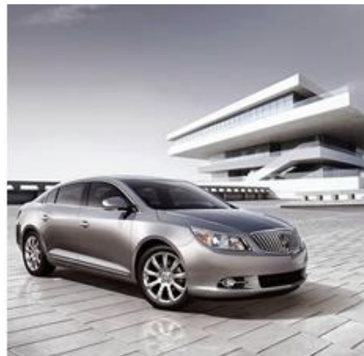
Slika 6: David Chipperfield Architects, Ad for Buick Lacrosse, reklamna fotografija