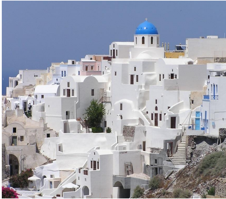
Slika 16: Primjer vertikalne perspektive u fotografiji

Vertikalna perspektiva vezuje se ponajprije uz slikarstvo i drevne staroegipatske crteže gdje je način prikazivanja trodimenzionalnog prostora na dvodimenzionalnoj plohi bio takav da se sve ono što je u stvarnosti jedno iza drugog prikazuje jedno iznad drugog. Kako bi se snimile ovakve fotografije bez izražene dubine, nužna je uporaba teleobjektiva uz što jače zatvaranje otvora objektiva.