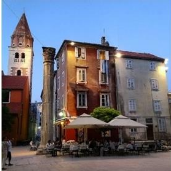
Slika 7: Autorska fotografija, turistička fotografija arhitekture