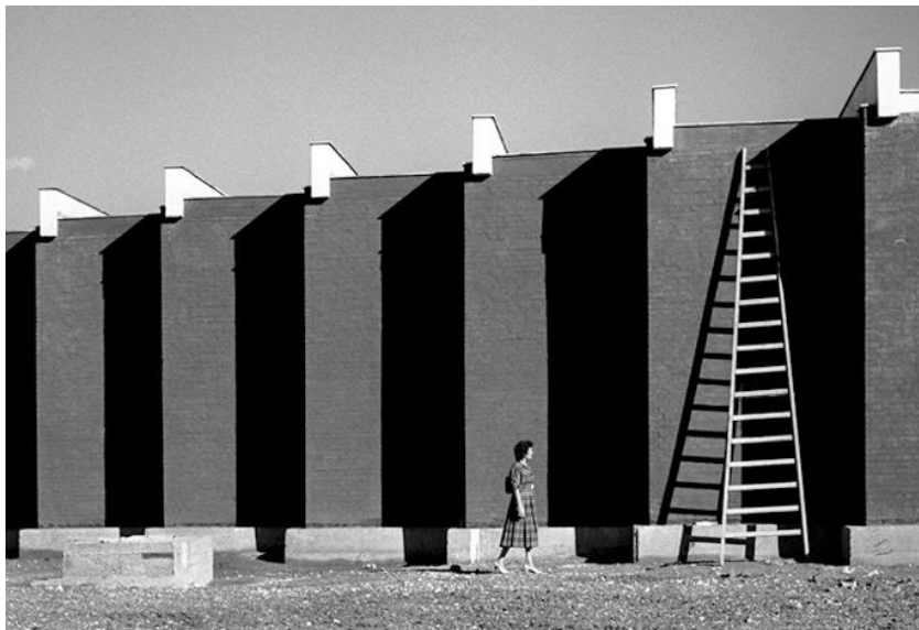
Slika 17: Slavka Pavić, Kompozicija

U fotografiji arhitekture često dominiraju linije, prisutne su paralelne, one koje se sijeku, idu u spiralu, tvore elipsu ili su pod nekim kutem. Za estetsku privlačnost fotografija zaslužne su upravo linije koje tvore građevine (slika 17). Naglasak se stavlja na vertikalne linije, a cilj je postizanje kontrolirane perspektive.