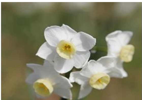
Slika 9: Ilustracija različitih dubinskih oštrina, otvor objektiva - 5.6