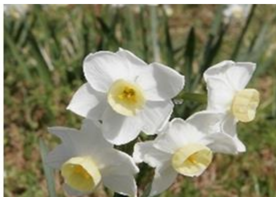
Slika 10: Ilustracija različitih dubinskih oštrina, otvor objektiva - 32

SLR fotografski aparati prihvaćaju široki raspon objektiva, koji se mijenjaju ovisno o motivu koji se snima, izgledu i kvaliteti fotografije koja se želi postići. Mogućnošću izbora bitno se proširuju kreativne mogućnosti snimanja. [9]