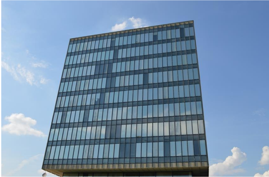
slika 26: Zgrada ministarstva snimana sa stražnje strane