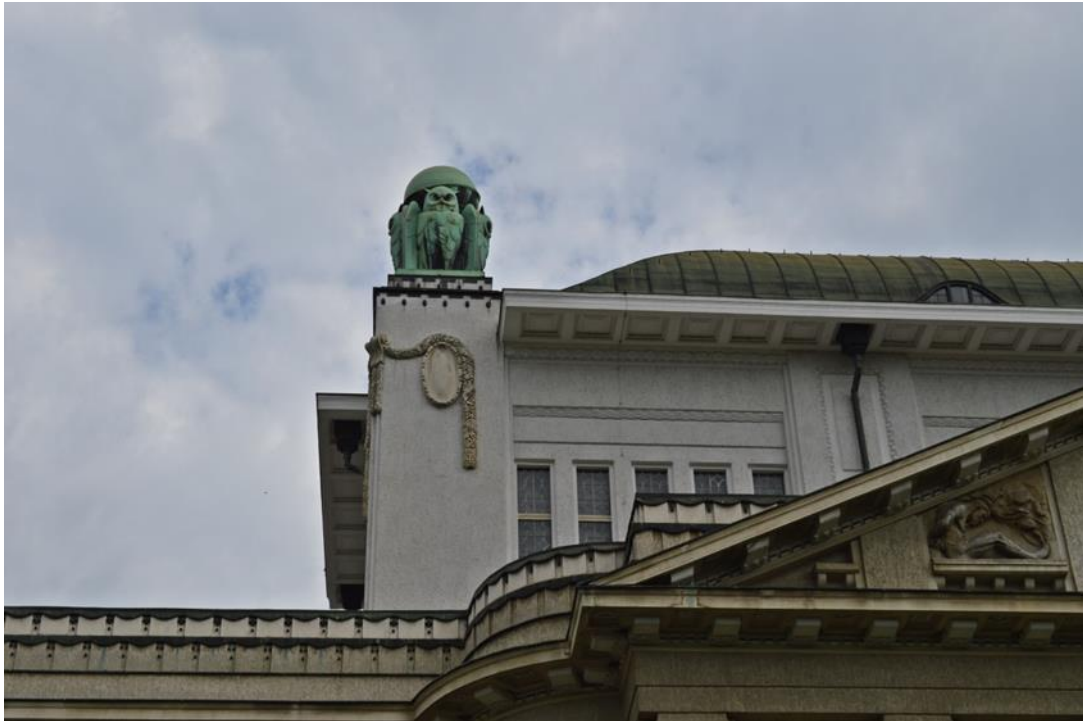
Slika 24: Hrvatski državni arhiv, detalj

Otvorenost objektiva tijekom snimanja ove fotografije je manja, a time se postigla željena oštrina. Vrijeme eksponiranja nije ni predugo niti prekratko, i upravo se ono najčešće koristi prilikom snimanja.