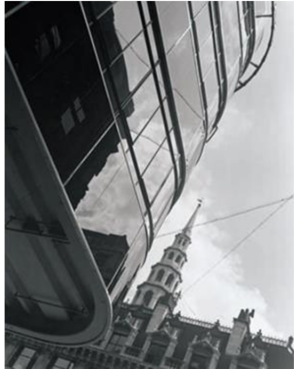
Slika 4: Dell & Wainwright, Daily Express Building