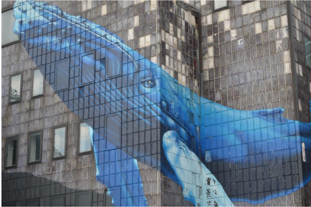
Slika 20: Galerija Gradec, detalj