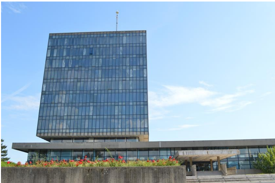
slika 25: Zgrada ministarstva snimana s prednje strane

Zgrada ministarstva Ivana Vitića, istaknutog arhitekta i predstavnika modernizma, poznatija je pod nazivom Kockica, dobivenog zbog oblika zgrade. Zgrada je izgrađena krajem šezdesetih godina prošlog stoljeća za potrebe Saveza omladine Hrvatske te Socijalističkog saveza radnog naroda Hrvatske. Danas su u zgradi smješteni Ministarstvo pomorstva i Ministarstvo turizma. U uređenju interijera sudjelovali su najprominentniji umjetnici tadašnjice, vođeni već spomenutim velikanom Raoulom Goldonijem. Zgrada je zaštićena kao kulturno dobro Republike Hrvatske. [18, 19]