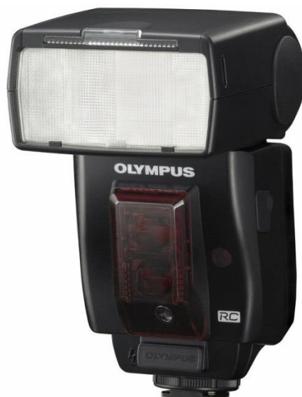
Slika 13: Vanjska, ujedno i bežična bljeskalica

Korištenjem bljeskalice ugrađene u fotografski aparat, dobivaju se fotografije niske kvalitete. Pritiskom na okidač ona daje oštru, nagrđujuću i zasljepljujuću svjetlost. Može osvijetliti objekte udaljene najviše 2 do 4 metra. Da bi se dobila kvalitetnija fotografija, koriste se vanjska i bežična bljeskalica. Vanjska bljeskalica se može pričvrstiti na fotografski aparat ili se koristi odvojeno, upravlja se pomoću kabela ili daljinskim upravljanjem. Ova vrsta bljeskalice ne stvara efekt crvenih očiju, kao što je to slučaj kod ugrađene, može se usmjeriti kamo god se želi, nudi veću kontrolu, a i proizvodi jači bljesak. Vanjske bljeskalice uglavnom funkcioniraju kao bežične (slika 13). Prednost im je da ih se može staviti bilo gdje te kontrolirati pomoću "Triggera". Trigger je naziv za uređaj uz pomoć kojeg se mogu snimati fotografije s udaljenosti. [10]