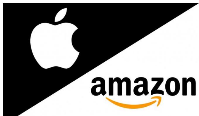
Slika 4. Logo Apple i Amazon

Nakon što je djelo objavljeno, prodaju je moguće pratiti uz pomoć dnevnih izvješća. Osim toga omogućena je i izrada personalizirane nadzorne ploče ovisno o autorovim željama i potrebama. Autor svoje djelo može i naknadno uređivati pomoću iTunes Connect računa te će se nastale promijene ažurirati kroz naredna 24 sata. Plaćanje usluge se vrši u roku od 45 dana nakon isteka svakog mjeseca [15].