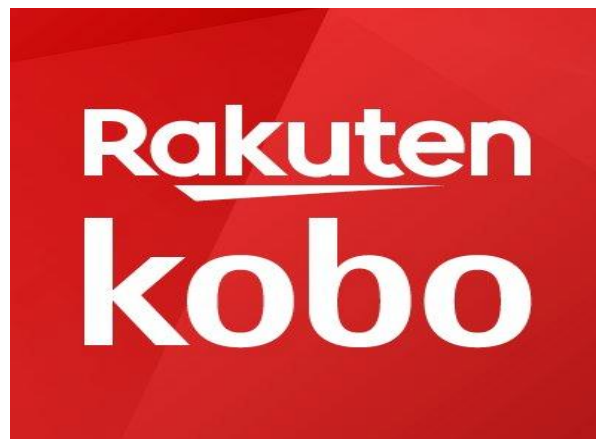
Slika 6. Logo Kobo

Što se tiče konkurencije u njihovom poslovanju, ona je jako velika. Apsolutni vladari ove vrste poslovanja su Amazon, Barnes and Noble i Apple. Sve te firme imaju visoku kvalitetu svojih proizvoda te oni uzimaju veliku većinu kupaca u svijetu. Međutim, Kobo se smatra kao poduzeće koje je najbliže toj velikoj trojci. Najveći problem ovoga poduzeća je taj što nudi jeftini hardver koji jednostavno nije privlačan korisnicima.