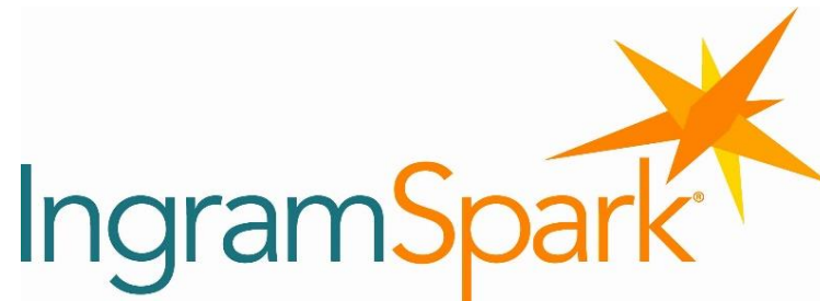
Slika 10. IngramSpark logo

Kao dio Ingram grupe najveća su distribucijska globalna mreža u industriji izdavaštva, posluju s više od 39.000 knjižara, knjižnica, internetskih trgovina, škola i sveučilišta. Među njima su i najveća imena Amazon, Apple Books i Kobo. Glavna značajka je široka distribucija print on demand djela, prije je bio primarni izlog za autore koji su tiskali djela, a otkada ga je Kindle Direct Publishing kupio blisko surađuju u tom području tiska na zahtjev [16].