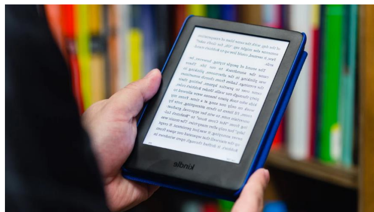
Slika 3. Amazon Kindle

Elektronička knjiga je već od velikog značaja u stručnom i znanstvenom svijetu zbog svoje praktičnosti i jednostavnosti pristupu raznim informacijama, a napretkom će u budućnost biti još i važnija.