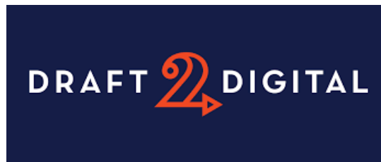
Slika 12. Draft 2 Digital logo

Također, samoizdavačka tvrtka koja pripada kategoriji agregator. Prije je monopol bio u rukama Smashwordsa u području agregatora, no to danas više nije tako. D2D je izbor kojemu se autori češće okreću. Nude jednostavnu metodu učitavanja djela u roku od samo nekoliko minuta, a objavljivanje na stranici unutar 24 sata [16]. Ne naplaćuje se objavljivanje djela, no provizija je 10% od svake prodaje. Neograničena je opcija uređivanja i unaprjeđivanja sadržaja, naslovnice i omogućena je distribucija i na druge kanale.