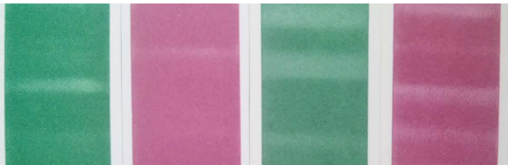
Slika 7. Otisci zelene i vinsko crvene boje na premazanom polukartonu i papiru prije otiranja

Nakon otiskivanja na sjajno premazanim papirima primijećeno je nejednoliko prihvaćanje tiskarske boje, odnosno otisci su djelovali vizualno neujednačeno (slika 7.). Na nepremazanim tiskovnim podlogama to nije bio slučaj, što je u skladu s preporukom proizvođača da boje treba tiskati na nepremazane tiskovne podloge (slika 8.).