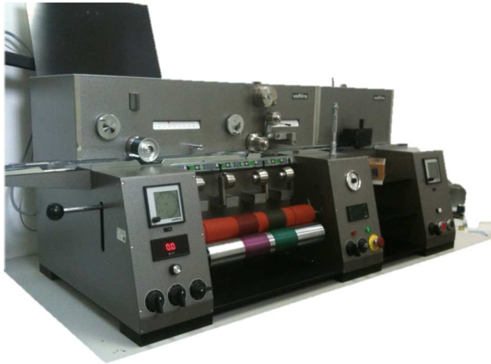
Slika 6. Uređaj Prufbau Multipurpose Printability Testing System

Otiskivanje odabranih boja provedeno je na stroju Prufbau Multipurpose Printability Testing System (slika 6.).