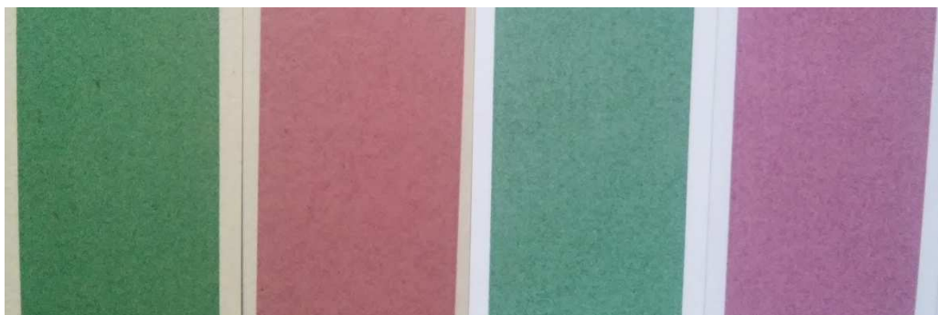
Slika 8. Otisci zelene i vinsko crvene boje na nepremazanom žutom polukartonu i papiru prije otiranja