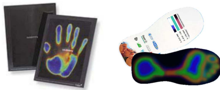
Slika 2. Primjer termokromne boje na bazi tekućih kristala [24]

otisnute na raznim materijalima, a za što bolji vizualni efekt boje preporuča se promatranje nasuprot crnoj pozadini (slika 2.). Tekući kristali pokazuju isti geometrijski red kao i kristali, ali budući da su tekući, njihove molekule su u mogućnosti da se međusobno izvijaju i kreću. Do toga dovodi lagano zagrijavanje kojim započinje narušavanje geometrije, pojavljuju se promjene u valnim dužinama reflektiranog svjetla i kristali mijenjaju boju. Tekući kristali obično omogućuju kontinuirano mijenjanje spektra boja u određenom rasponu temperature, a hlađenjem se kristali vraćaju u svoju prvobitnu boju [2, 15] .