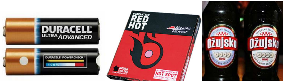
Slika 4. Primjeri oznaka otisnutih termokromnim bojama [24]

Neke od njih su Coca Cola, Bacardi, Guinness koji na etiketama prikazuju kada je piće dovoljno rashlađeno, Pizza Hut da je jelo dovoljno vruće i Mars čokoladice određene skrivene poruke [17].