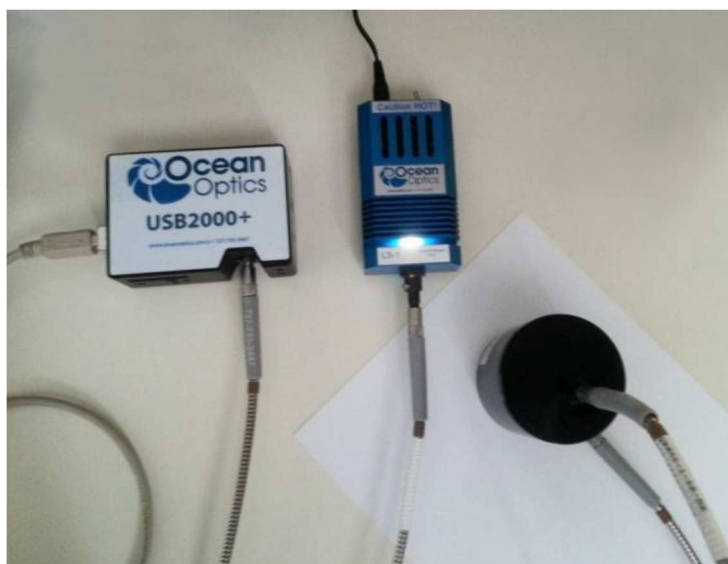
Slika 10. Mjerenje kolorimetrijskih promjena pomoću spektrofotometra Ocean Optics USB 2000+ [18]

Pomoću spektrofotometra Ocean Optics USB2000+ izmjerene su CIELAB vrijednosti na otisnutim uzorcima, a dobivenim rezultatima omogućeno je izračunavanje vrijednosti CIEDE 2000 prema formuli: