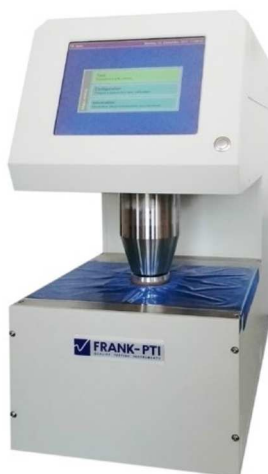
Slika 5. Uređaj PTI-Line Bekk [21]

Glatkost papira ispitana je na uređaju PTI-Line Bekk (slika 5.), prema TAPPI standardu T479.