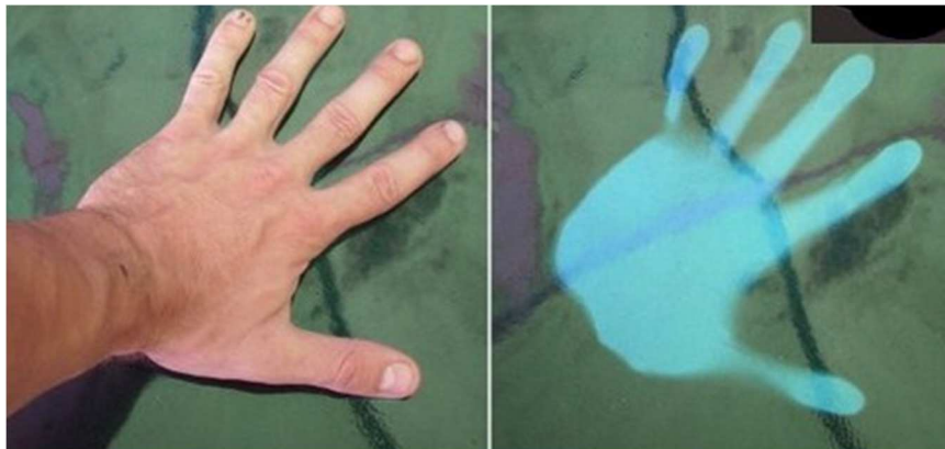
Slika 3. Primjer termokromne boje na bazi leuko bojila [24]

stanje. Kod ireverzibilnih boja na bazi leuko bojila, nema vraćanja u prvobitno stanje. Druga interakcija između razvijaača i otapala smatra se najbitnijom za postizanje termokromnih karakteristika s organskim materijalima. Neke leuko tiskarske boje se mogu mijenjati iz jedne boje u drugu boju, a to se postiže bojama koje su kombinacija leuko bojila i procesnih tiskarskih boja. Također, moguće je korištenje mješavine termokromnih pigmenata različitih temperatura topljenja, gdje jedna komponenta mješavine blijedi postajući bezbojna otapanjem, a boja se mijenja u onu preostalu komponentu koja ima pigment više temperature topljenja. Temperatura na kojoj se događa proces obojenja i obezbojenja ovisi o temperaturi na kojoj se otapa otapalo i ona se naziva temperaturom aktivacije ( T_A ). Iako su termokromne boje na bazi leuko bojila dostupne u različitim temperaturama aktivacije, od -15^{\circ}\text{C} do 65^{\circ}\text{C} , većina aplikacija je ograničena na tri standardna temperaturna područja, na hladno ( \sim 10^{\circ}\text{C} ), na temperaturu ljudskog tijela ( \sim 31^{\circ}\text{C} ) i na vruće ( \sim 43^{\circ}\text{C} ). Budući da leuko bojila apsorbiraju svjetlo, moraju biti otisnute na što svjetlijoj podlozi, najbolje na bijeloj [2,15].