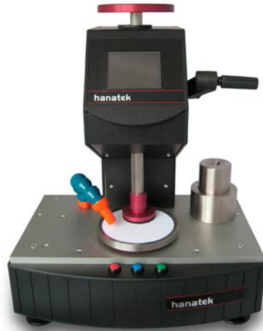
Slika 9. Uređaj Hanatek Rub and Abrasion Tester [21]

Uređaj Hanatek RT4 Rub and Abrasion Tester (slika 9.) korišten je za ispitivanje otpornosti otisaka prema otiranju po standardu BS 3110.