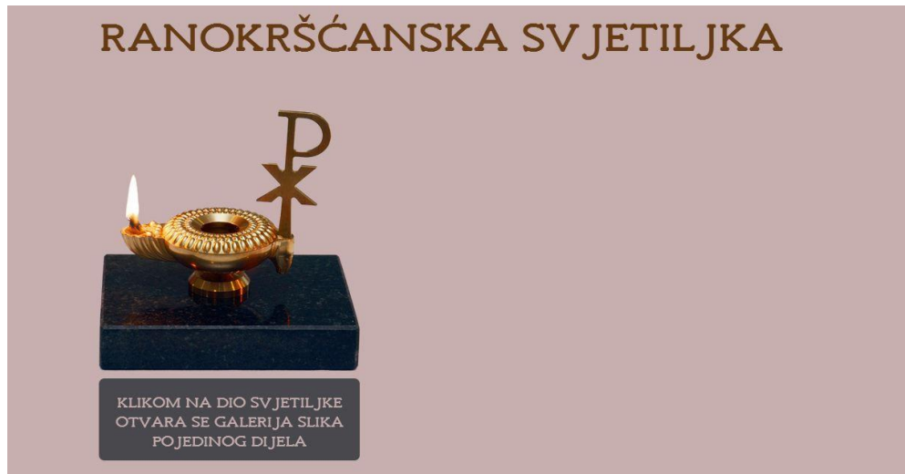
Slika 12. Prikaz okvira, opaciteta vrijednosti 0 prije same animacije

Animacija pod nazivom "anim6" pokazuje se uspješnom kao u prijašnjim primjerima kojima se mijenja opacitet. Primjer je prikazan na slikama 12. i 13.