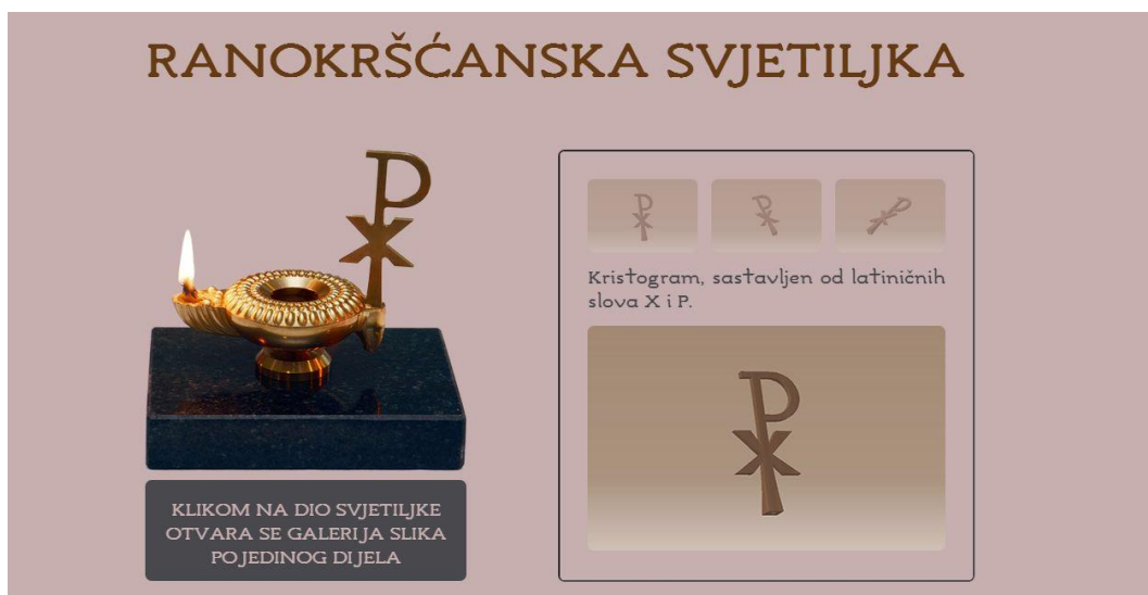
Slika 15. Otvaranje uvećane slike u okviru

Slika 14. i slika 15. prikazuju okvir u kojem se otvaraju zasebni HTML dokumenti.