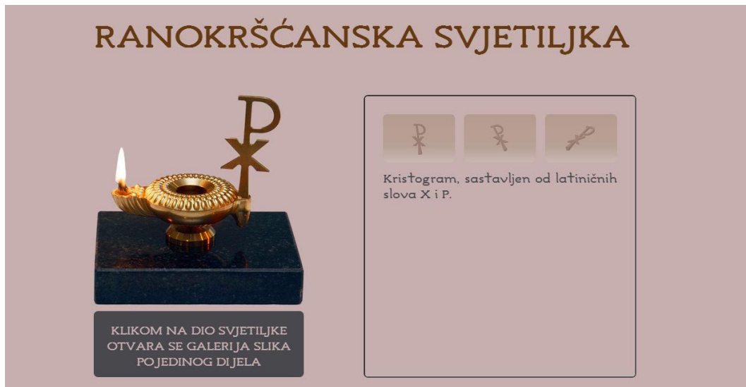
Slika 14. Pritiskom miša na određeno područje otvara se galerija slika u okviru