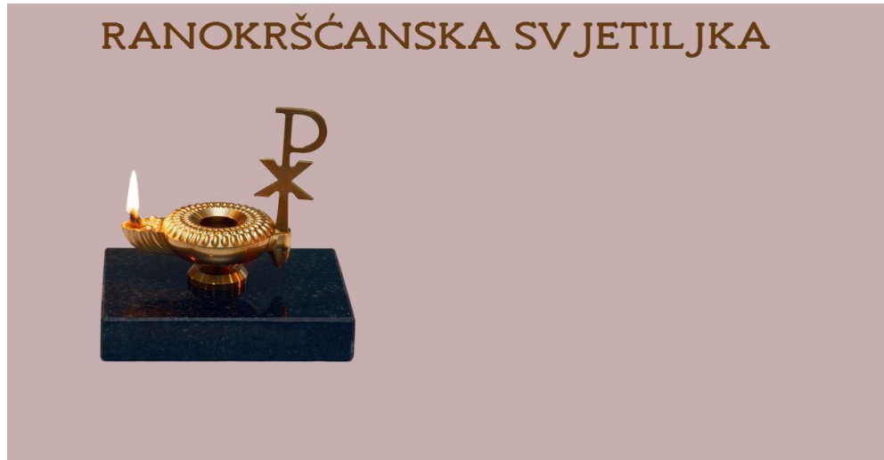
Slika 10. Prikaz box -a prije same animacije, opacitet 0

Animacije pod nazivom "anim4" i "anim5" prikazuju kako se uz definiranje animation-delay i opaciteta, animacija prikazuje u točno predviđeno vrijeme te se pokazuje uspješnom. Rezultat promjene opaciteta prikazan je na slikama 10. i 11.