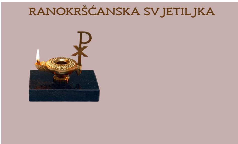
Slika 6. Prikaz pozicije svjetiljke nakon završetka animacije

Animacija pod nazivom "anim3" odvija se u 3 faze. Uz definiranje svojstava, animacija funkcionira. Faze animacije prikazane su na slici 7., slici 8. i slici 9. Slike prikazuju promjenu vrijednosti opaciteta koja se mijenja iz 0 u 1 te ponovno u 0.