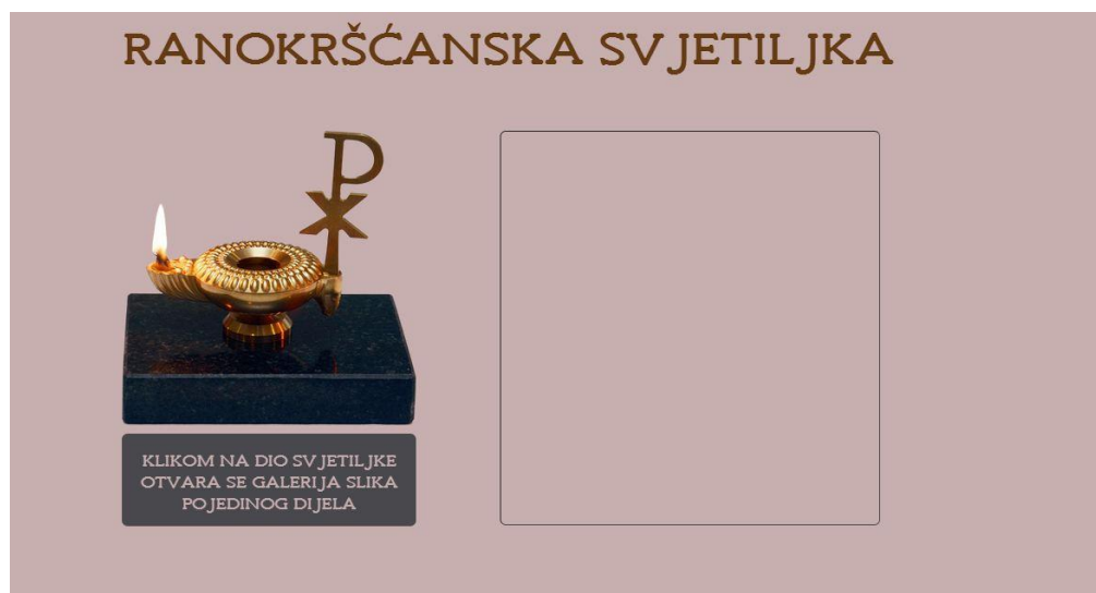
Slika 13. Prikaz okvira, opaciteta vrijednosti 1 nakon animacije

Slikovne mape pridonose praktičnosti web galerije. Uz definirano odredište zasebnih HTML dokumenata, sadržanim slikama dijelova svjetiljke, povećala se funkcionalnost.