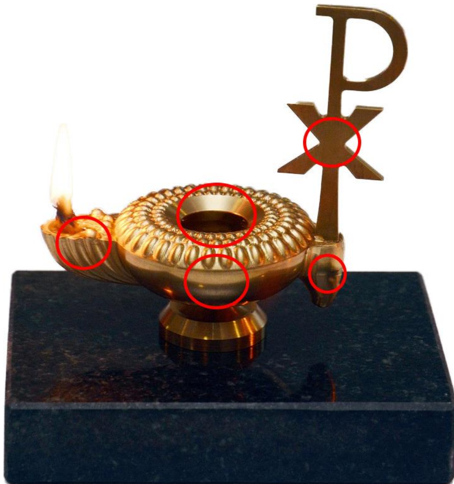
Slika 2. Prikaz slikovne mape, kružni oblik

Kada bi područja bila vidljiva, izgledalo bi ovako: