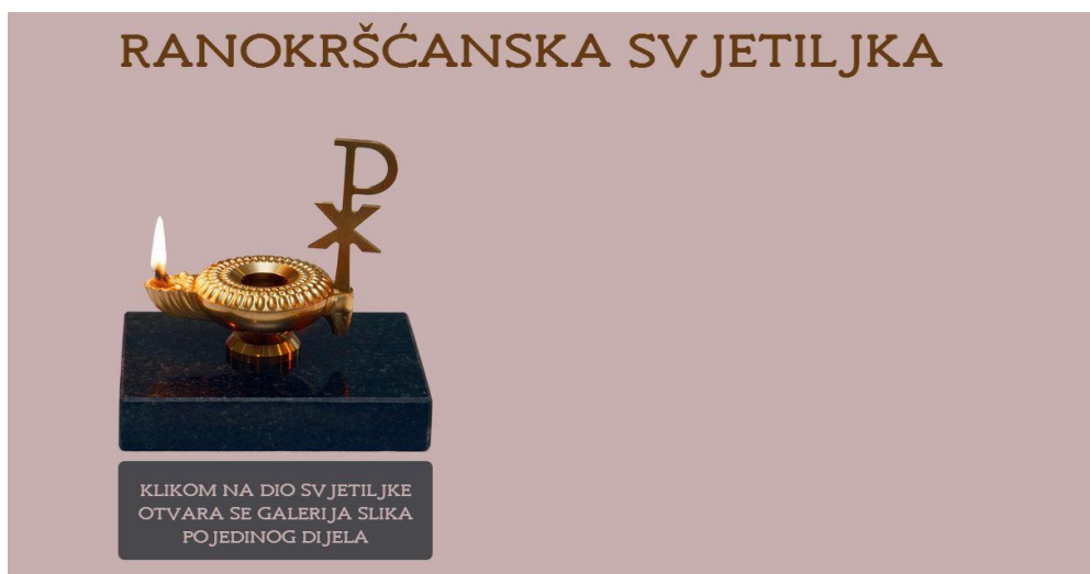
Slika 11. Prikaz box -a nakon same animacije, opacitet 1