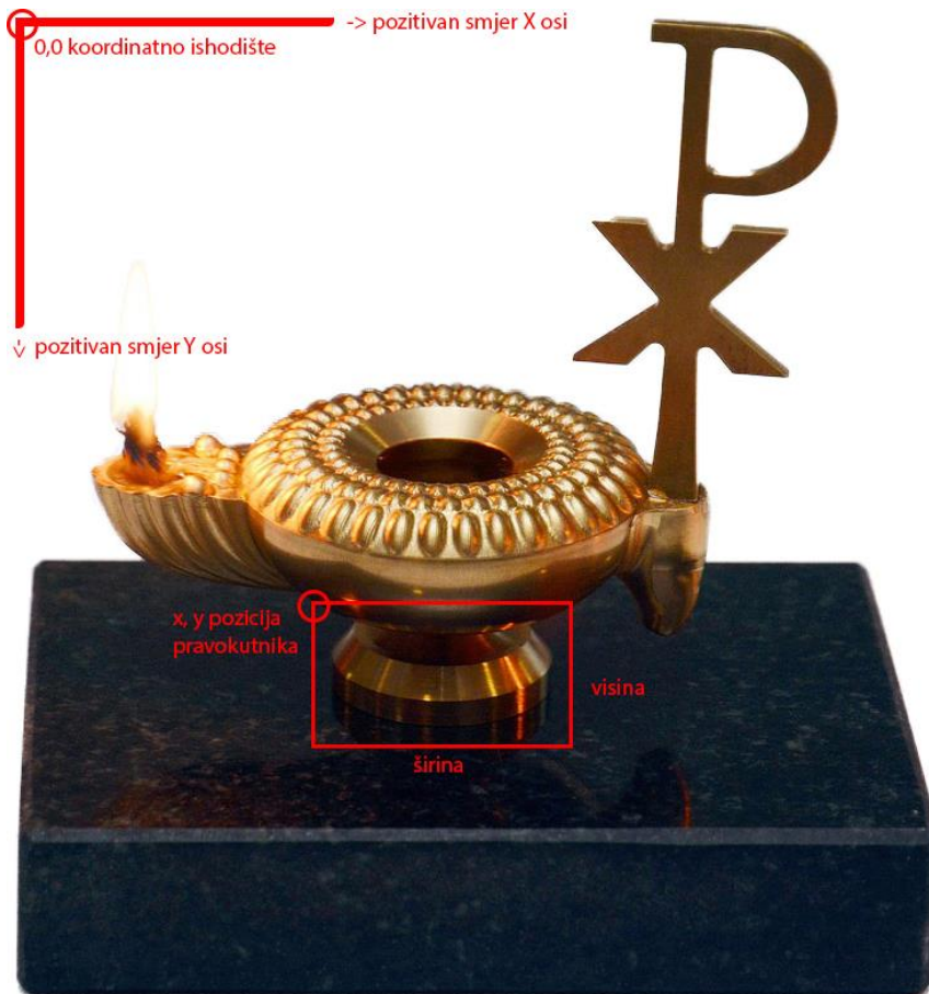
Slika 1. Primjer koordinatnog sustava sa zadanim koordinatama pravokutne slikovne mape

Ako je željeno područje na slici u obliku pravokutnika tada se određuje udaljenost od gornjeg lijevo i donjeg desnog kuta pravokutnika u pikselima. U izrađenoj web galeriji, ovakav oblik je korišten za jedno područje na slici, prikaz na slici 1.