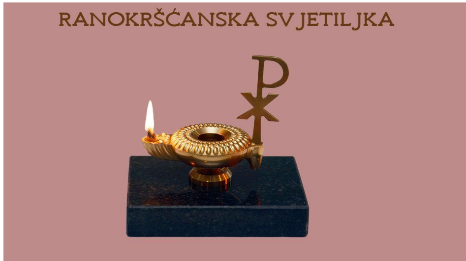
Slika 5. Prikaz pozicije svjetiljke prije animacije

Također, prijelaz glavne slike određene dimenzije koja mijenja svoj položaj i dimenzije u pregledniku, pokazao se uspješnim. Rezultat promjene pozicije i veličine slike vidljiv je na slikama 5. i 6.