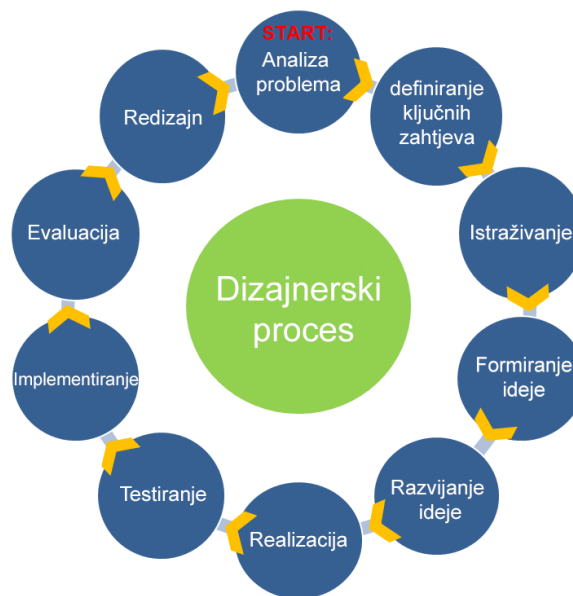
[13] Slika 5. Shematski prikaz održivog dizajnerskog procesa

Dizajnerski proces na ovaj način formira spiralu čiji svaki slijedeći ciklus sadrži sve više informacija i postaje osnova za slijedeći ciklus upravo onako kako funkcionira evolucija bilo kojeg prirodnog sistema.