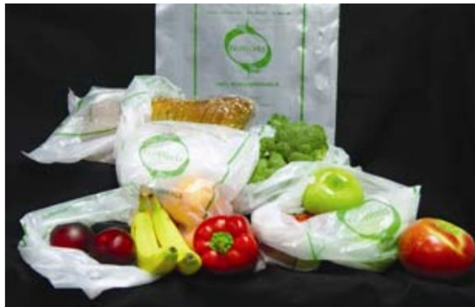
Slika 3. [14] Eco Works™ - Biorazgradive folije i vrećice

OSOBINE • 100% biorazgradiv proizvod • ne sadrži polietilen • ne ostavlja tragove, nakon kompostiranja • superiorna snaga, izdržljivost i dugotrajnost • osnovna sirovina je polyester dobiven iz dekstroze kukuruza • bioragrađuje se u istom obimu i brzini poput uobičajenog organskog materijala na CO 2 i H 2 O unutar nekoliko tjedana • idealan proizvod za škole, restorane i poljoprivredne svrhe • namjenjen za pakiranje svježeg voća i povrća, te za skladištenje i transport hrane