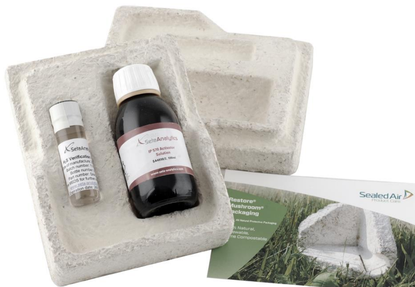
slika 2. Ecovative [15] ambalaža od gljiva

Nova otkrića u tehnologiji omogućina su razvoj novih održivih materijala koji se proteklih par godina polako uvode na tržište. Jedan od primjera je novi materijal tvrtke Ecovative [15] koji koristi poljoprivredni otpad i micelije gljiva za dobivanje čvrstog materijala za ambalažu, vidljivo na slici 2, građevinu, izradu igračaka i određene sportske opreme itd. Ovaj materijal u potpunosti je uzgojen, a ne proizveden, i čitavi proces i završni proizvod u skladu su sa prirodnim sustavima, proces ne koristi nikakve štetne kemikalije i potpuno je siguran za okoliš i izrazito funkcionalan i jeftin za proizvesti.