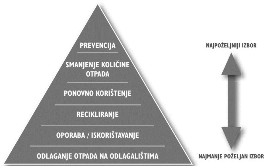
Slika 1. Hijerarhija gospodarenja otpadom [5]

Hijerarhijom gospodarenja otpadom u načelu se određuje slijed prioriteta u skupini najboljih opcija za okoliš u okviru okolišnog zakonodavstva i okolišne politike, pri čemu odstupanje od te hijerarhije može biti nužno za pojedine tokove otpada, tamo gdje je to opravdano na temelju razloga koji uključuju, među ostalim, tehničku izvedivost, gospodarsku održivost i zaštitu okoliša.