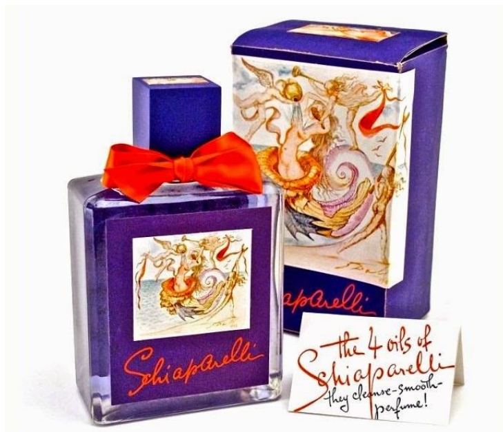
9. Elsa Schiaparelli, Salvador Dali, bočica parfema Shocking Radiance , 1943.

1943. godine Dali ponovno surađuje s Elsom Schiaparelli . Ovaj puta radi se o grafičkom dizajnu. Crtao je ilustracije za pakiranje kozmetičke linije Shocking Radiance by Schiaparelli . Radnje u ilustracijama su, čini se, inspirirane Boticelijem, te dosta podsjećaju na njegovo djelo Rođenje Venere . Dali je, naravno, crtao nadrealistične prizore. Ilustracije su bile iskorištene za bočice, pakiranja i reklame.