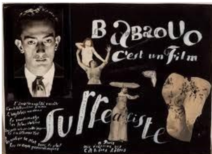
8. Plakat za film Babaouo - C'est un film surréaliste , Salvador Dalí, 1932.

1932. godine dizajnirao je plakat za film Babaouo - c'est un film surréaliste . U ovom plakatu koristi se tamnim tonom. Na plakatu se nalazi njegov portret, dvije djevojke u pokretu, čudan ljudski lik, nalik na ženi koja nosi neodređen predmet na glavi, sata koji se topi identičan onom iz slike Postojanost pamćenja , te u donjem lijevom kutu nepoznat predmet na kojem se nalazi puno mravi. Vidljivo je da je i ovdje ponavljao svoje omiljene motive. Na ovom plakatu upotrebljava različitu tipografiju, čak se razlikuje i od slova do slova u nekim dijelovima.