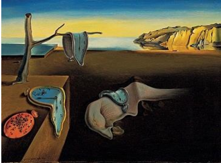
4. Salvador Dali, Postojanost pamćenja , 1931.

Postojanost pamćenja jedno je od najpoznatijih umjetničkih djela nadrealizma, te bez dvojbe najpoznatije djelo Salvadora Dalija, naslikano 1931. godine. Tehnika koju je koristio je ulje na platnu. Slika je dimenzija 24.1cmx33cm, što je dosta malo prema dimenzijama.