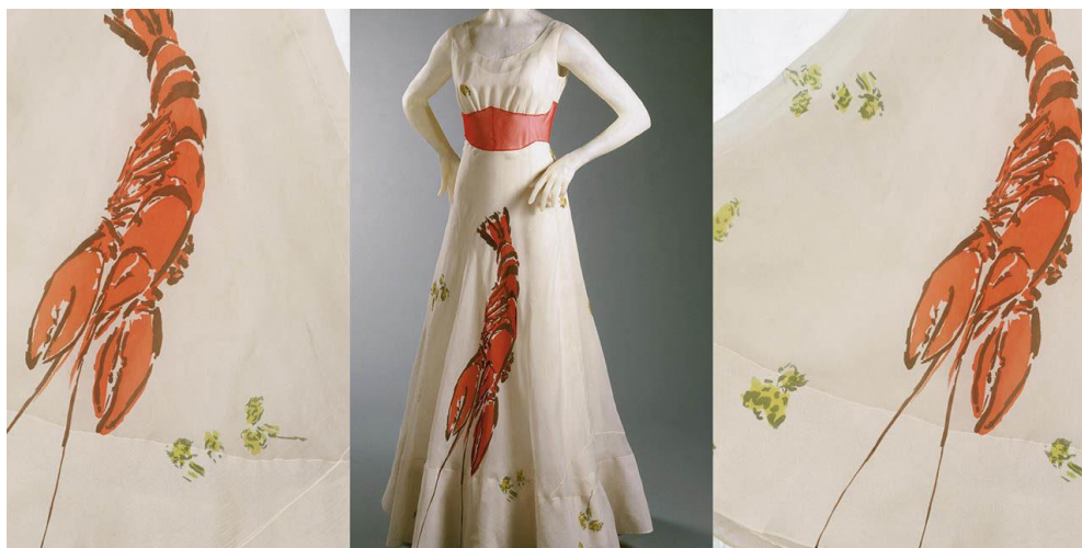
5. Elsa Schiaparelli i Salvador Dali, Haljina s jastogom, 1937.

Njihova najpoznatija suradnja je Haljina s jastogom iz 1937. godine. Dali je u par svojih dijela pokazao svoju začudnost i interes za motiv jastozima. U ovom djelu na bijeloj je haljini nacrtao crvenog jastoga.