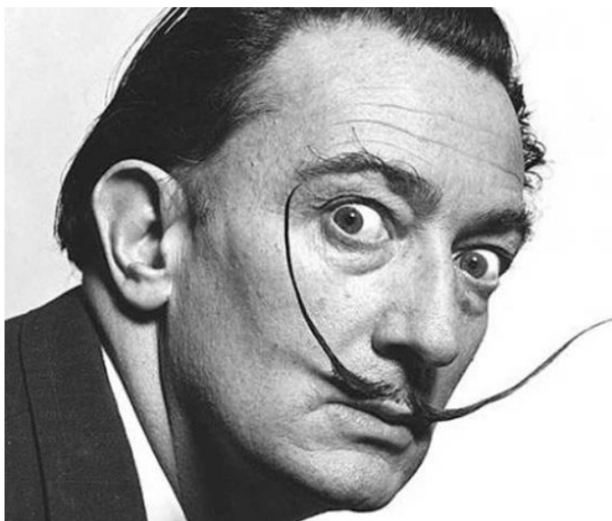
1. Portret Salvadora Dalija

"Sa šest godina htio sam biti kuhar. Sa sedam sam želio biti Napoleon. I moja ambicija od tada stalno raste.." [5] prva je rečenica Dalijeve autobiografije The Secret Life Of Salvador Dali .