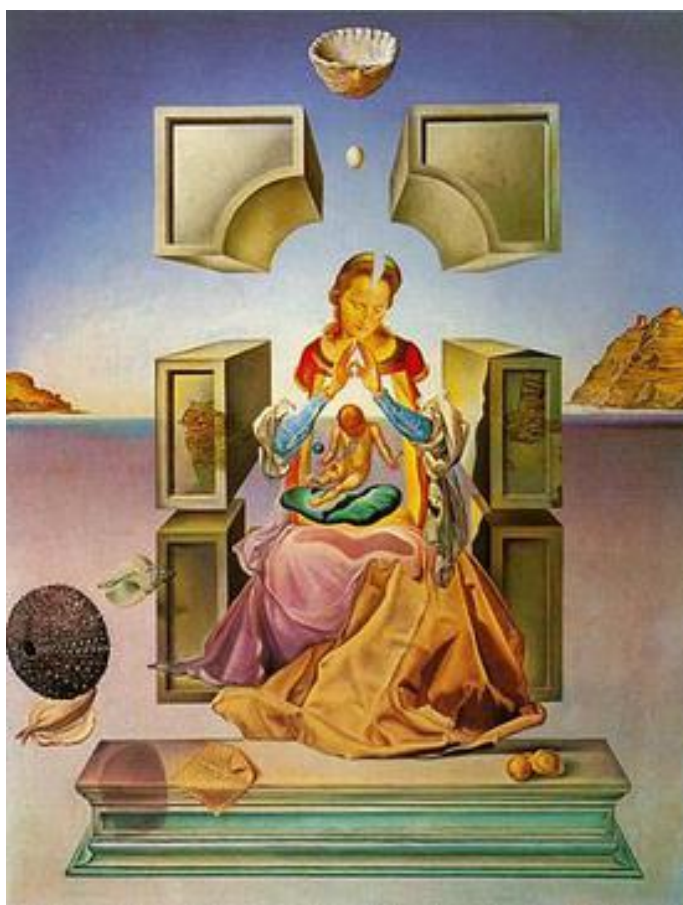
3. Madona iz Port Lligata , 1949.

Oko 1940. godine ulazi u fazu koju je nazvao nuklearni misticizam . Nuklearni misticizam nastaje kao posljedica bacanja nuklearnih bombi na Japan u Drugom svjetskom ratu. U ovoj fazi djelovanja, povezuje znanost sa ljudskim umom, te istražuje optičke iluzije i religiju. Njegova djela ovog razdoblja pokazuju da je usavršio svoju tehniku slikanja, te svoju maštu doveo do vrhunca. U djelima prikazuje raspršenost, razbacane predmete, geometriju, dinamiku, kaos. Religija se uklapa u ovu teoriju po mnogim tezama. U djelu Madonna iz Port Lligata možemo vidjeti utjecaj religije, kako i lebdeće predmete. Još jedan od bitnih primjera je Krist, sv. Ivan od Križa gdje je prikazan lebdeći križ, te Kristovo tijelo. Dao je i nuklearno-mistički zaplet svojoj najpoznatijoj slici, Postojanost pamćenja , koju je preslikao. U Dezintegraciji postojanosti pamćenja također su prikazani satovi, no u ovom djelu se raspadaju, što da je dodir nuklearnog misticizma .