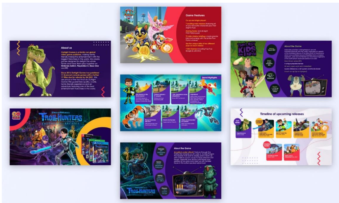
14. Brošura za nadrealistični dizajn raznih web igrica