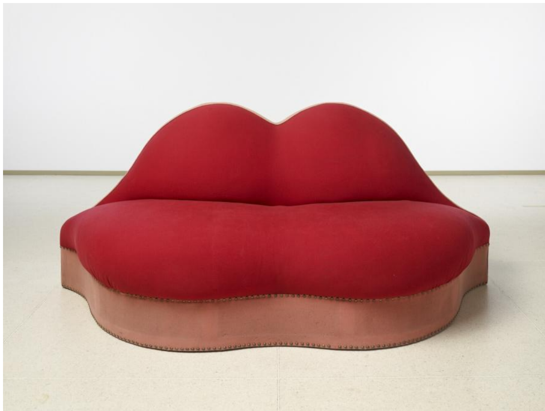
6. Salvador Dalí, Usne Mae West , 1935.

bio njegov najpoznatiji rad u njegovom dizajnerskom opusu, ne samo njegovom nego i svjetskom opusu dizajna interijera. Predmet nastaje prema zahtjevu Edwarda Jamesa , koji kasnije postaje kolekcionar njegovih djela.