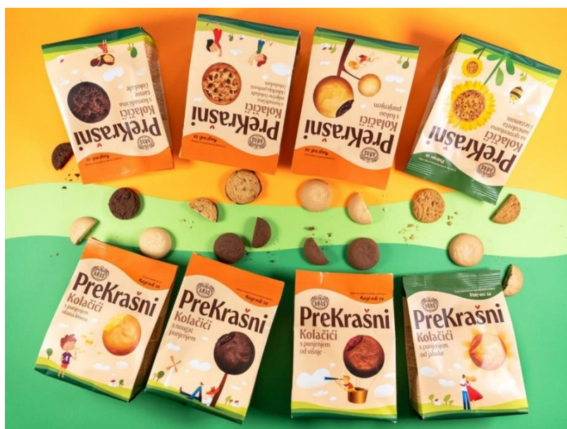
12. Primjer nadrealizma u dizajnu ambalaže brenda Kraš