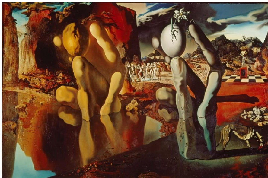
2. Salvador Dalí, Metamorfoze narcisa , 1937.

On pretvara stijene u ljude, instrumente u tijela, tijela u lica, labudove u slonove, spaja više slika kako bi dobio jednu. Nazivao ih je zagonetkama za djecu. Ova metoda zastupljena je u mnogim umjetnikovim djelima; Metamorfoze narcisa , Lincoln u Dalivisionu , Destino i mnogim drugim. Smatra se da je u ovom vremenu dosegao svoj stvaralački vrhunac.