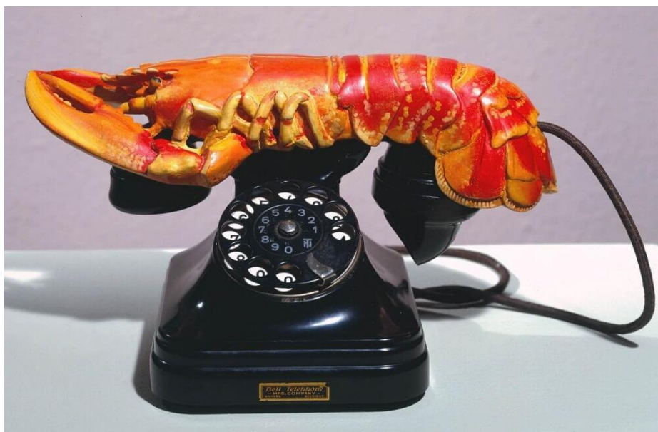
7. Salvador Dalí, Telefon sa slušalicom od jastoga, 1936.