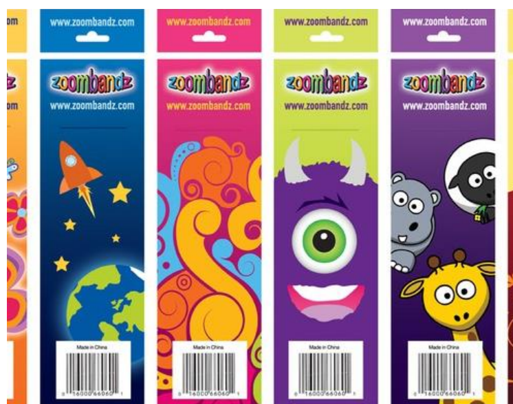
13. Primjer nadrealizma u dizajnu ambalaže brenda Zoombandz